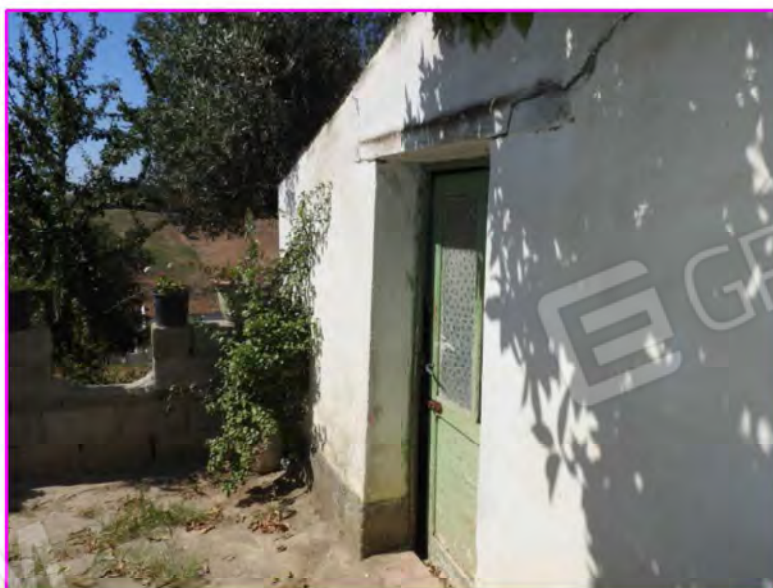
Scatto foto 18: