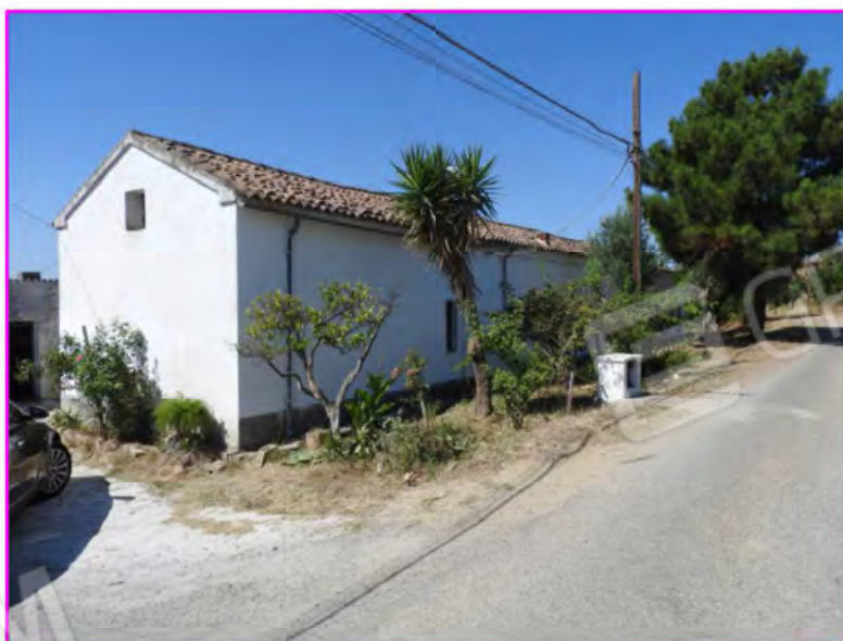
Scatto foto 2: Vista dall'esterno