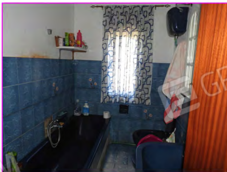
Scatto foto 8 :