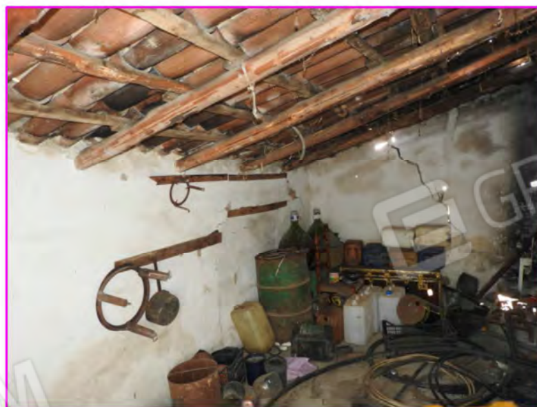
Scatto foto 20: