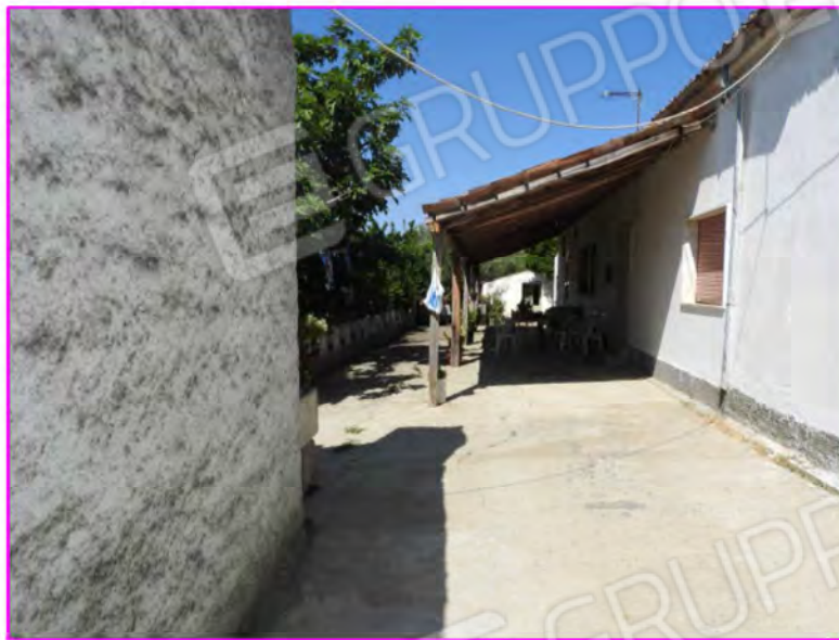
Scatto foto 3 :

D1 - unità immobiliare oggetto di perizia "abitazione"