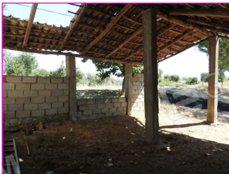
Scatto foto 26: