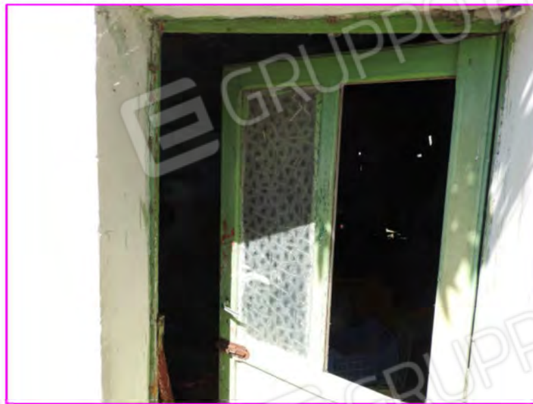
Scatto foto 19:

D2 - unità immobiliare oggetto di perizia " magazzino 1"