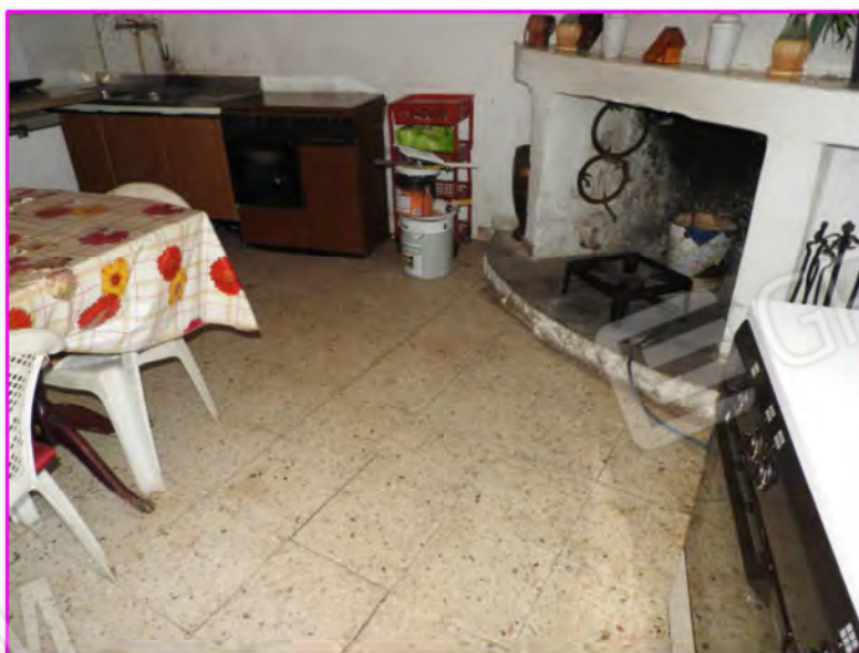
Scatto foto 24 :