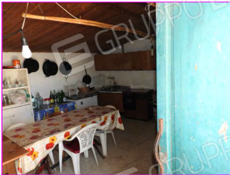
Scatto foto 23 :

D3 - unità immobiliare oggetto di perizia " magazzino 2"