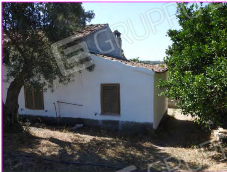
Scatto foto 17:

D2 - unità immobiliare oggetto di perizia " magazzino 1"