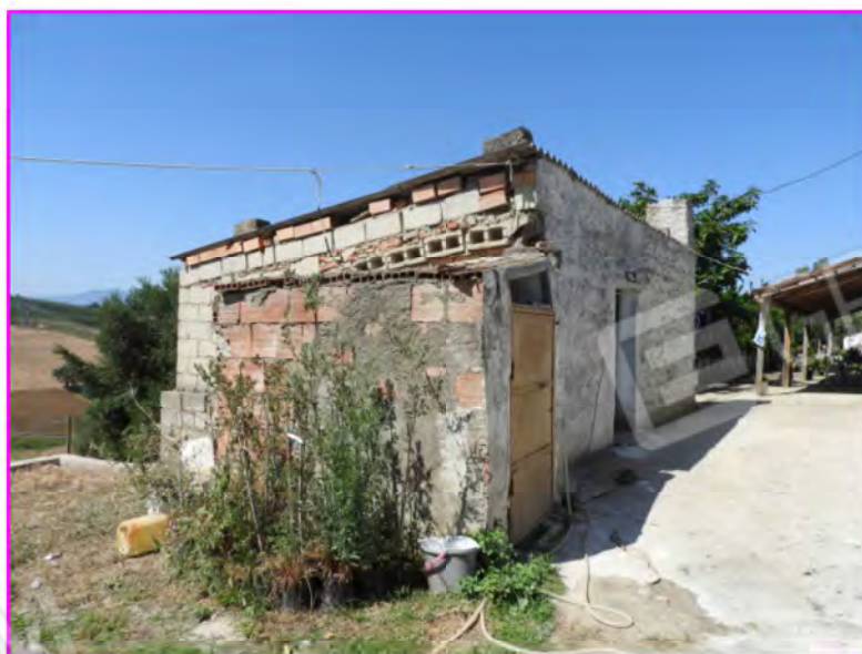
Scatto foto 22 :