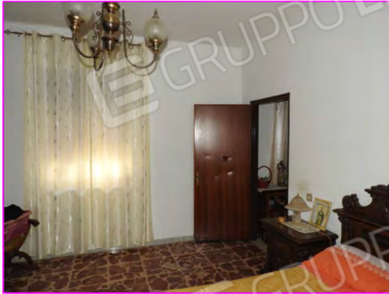
Scatto foto 11 :

D1 - unità immobiliare oggetto di perizia "abitazione"