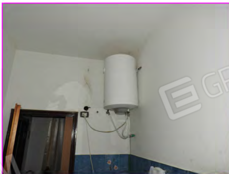
Scatto foto 14 :

Vista dall'interno particolare punto luce