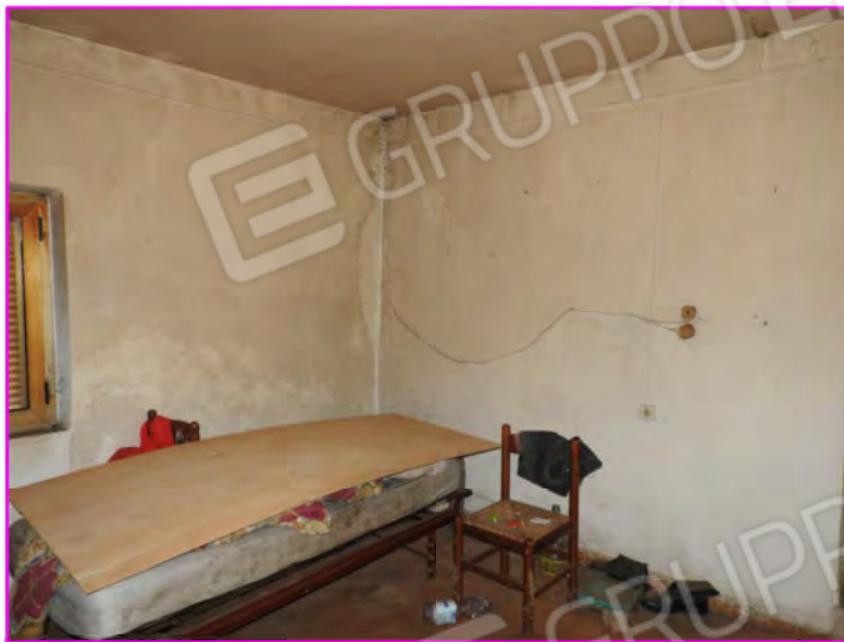
Scatto foto 15:

D1 - unità immobiliare oggetto di perizia "abitazione"