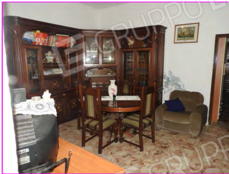
Scatto foto 7 :

D1 - unità immobiliare oggetto di perizia "abitazione"