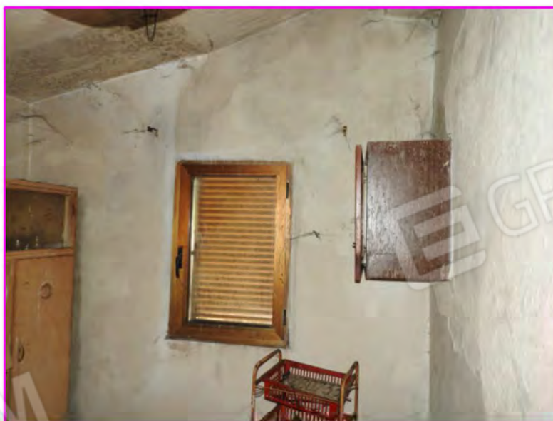
Scatto foto 16: