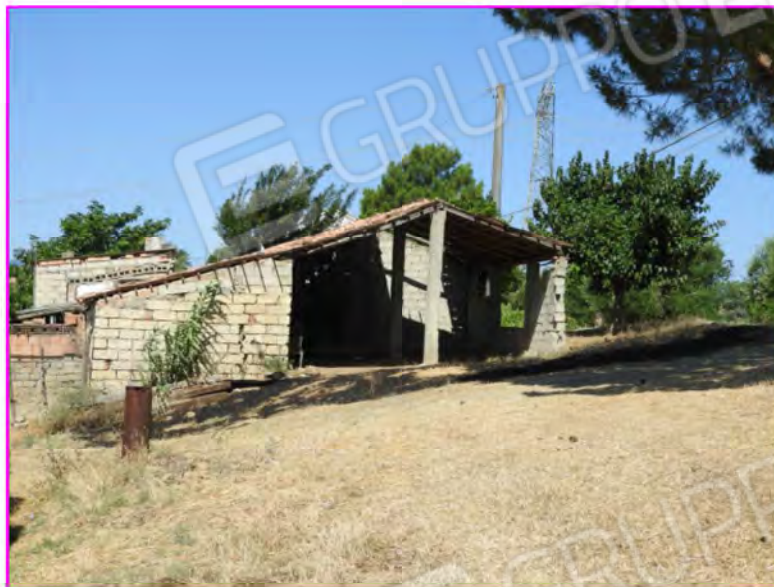
Scatto foto 25:

D4 - unità immobiliare oggetto di perizia "fienile"