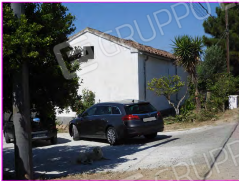
Scatto foto 1: Vista dall'esterno

D1 - unità immobiliare oggetto di perizia "abitazione"