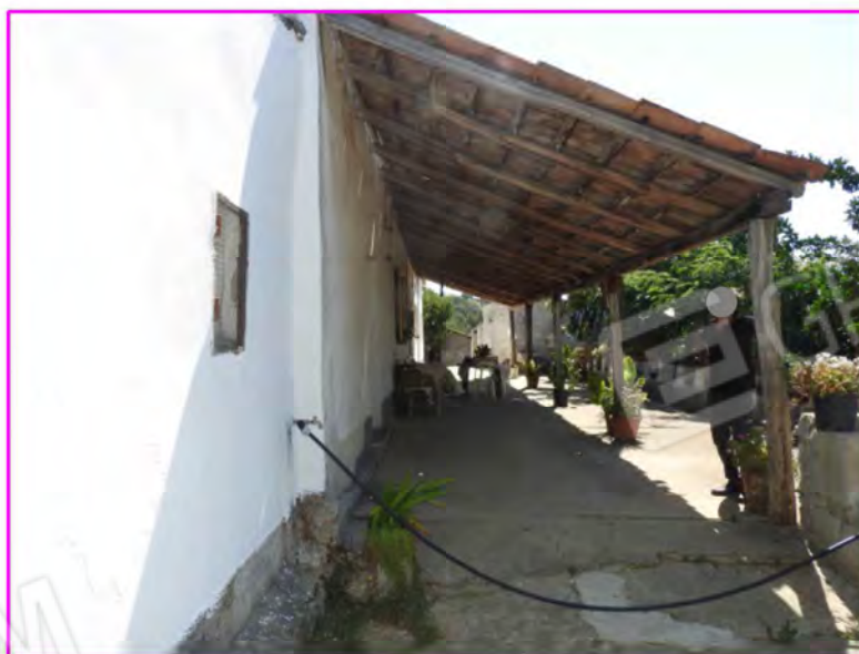
Scatto foto 4 :