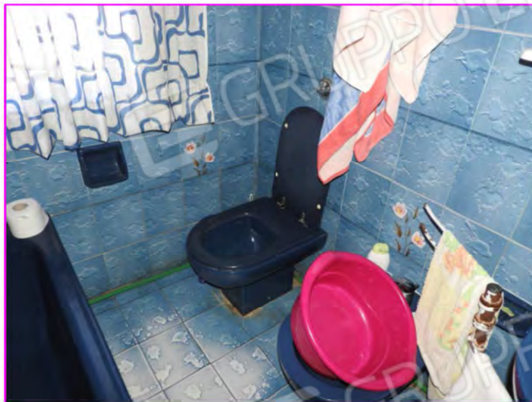
Scatto foto 9 :

D1 - unità immobiliare oggetto di perizia "abitazione"