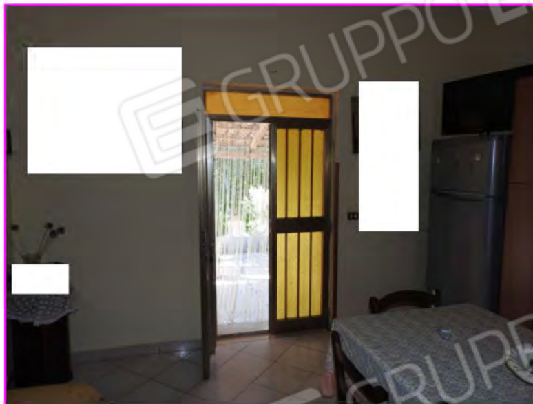
Scatto foto 5 :

D1 - unità immobiliare oggetto di perizia "abitazione"