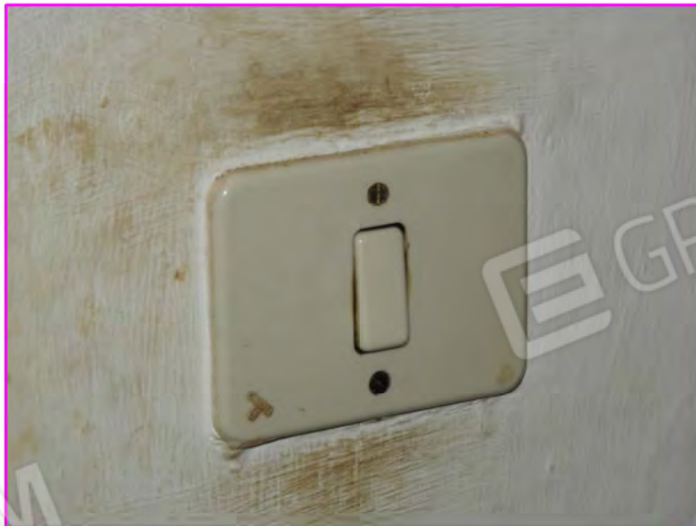
Scatto foto 12 :

Vista dall'interno particolare punto luce