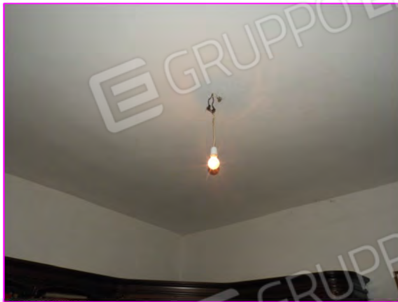
Scatto foto 13 :

D1 - unità immobiliare oggetto di perizia "abitazione"