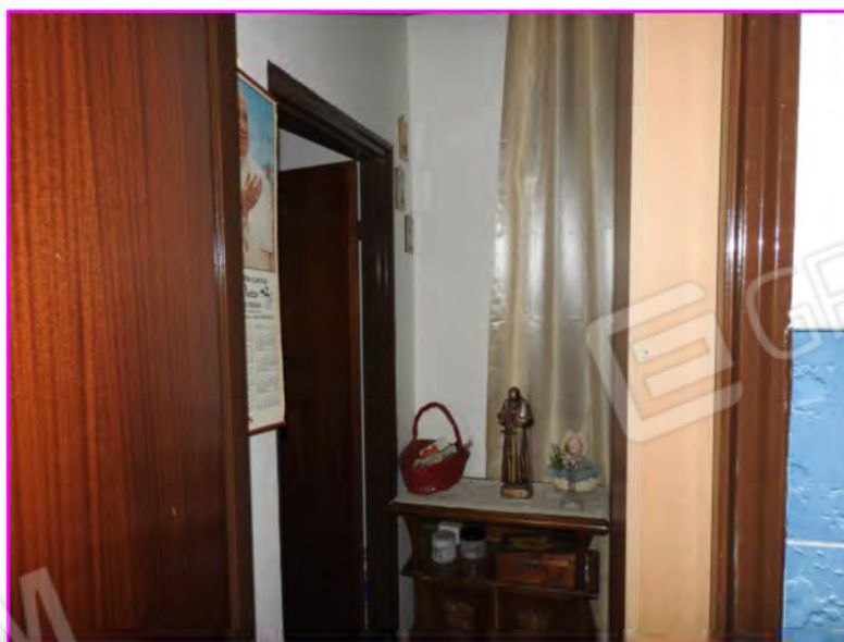
Scatto foto 10 :

Vista dall'interno vano disimpegno zona notte