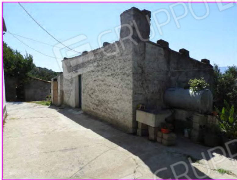
Scatto foto 21 :

D3 - unità immobiliare oggetto di perizia " magazzino 2"