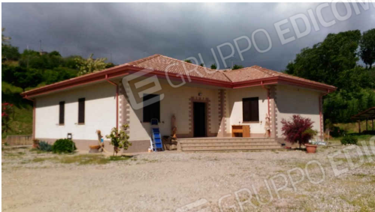
ingresso abitazione, lato nord-est