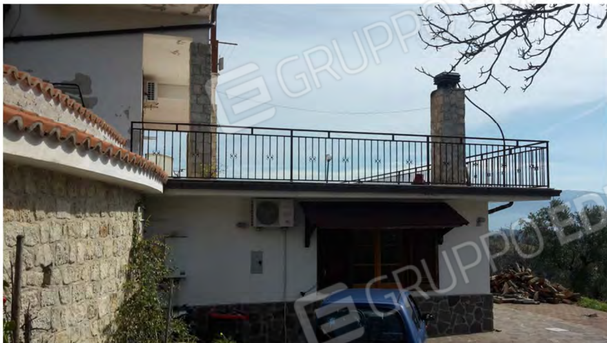
Prospetto laterale dell'appartamento al livello seminterrato