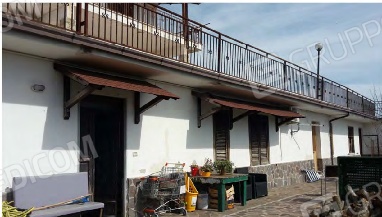
Ingresso e fronte principale dell'appartamento al livello seminterrato