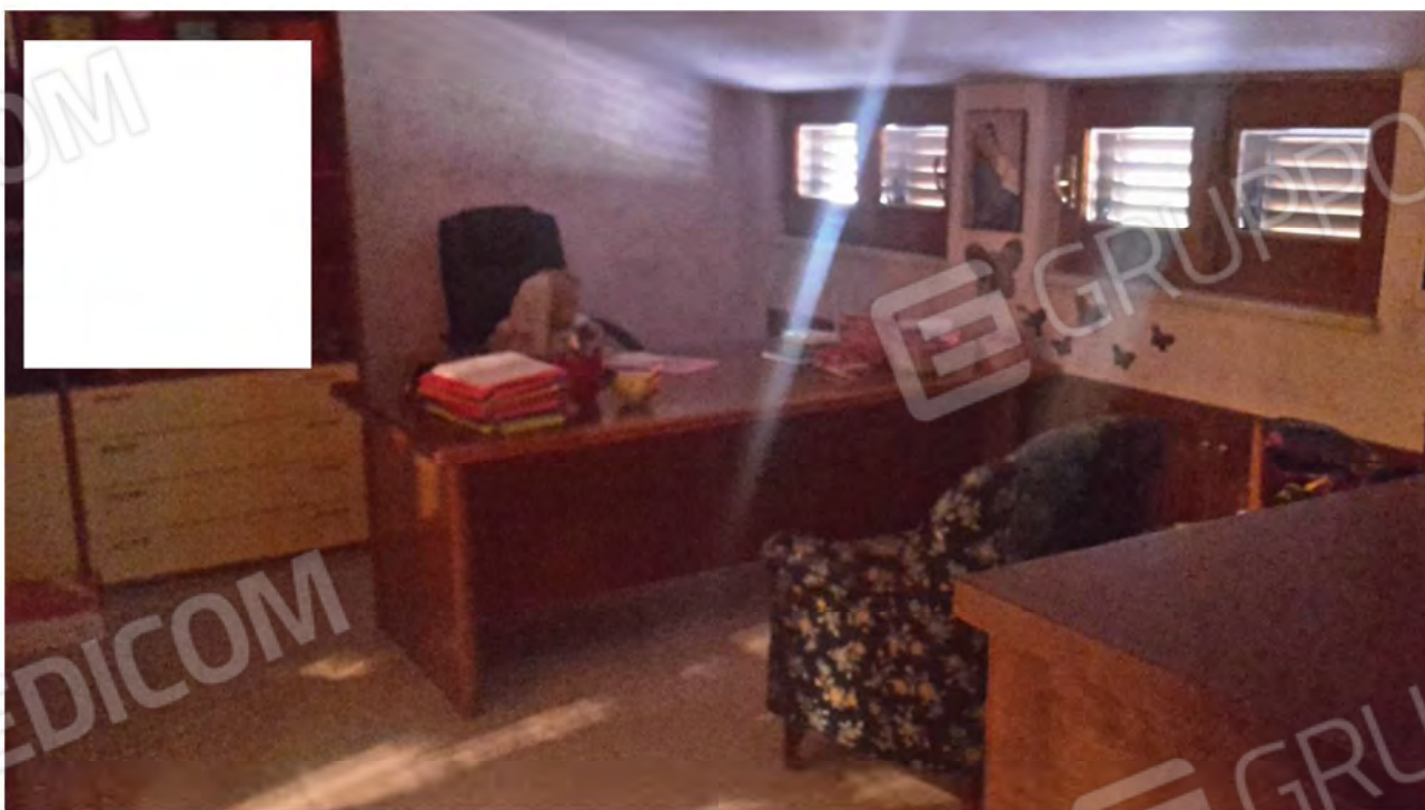
Stanza adibita a studio