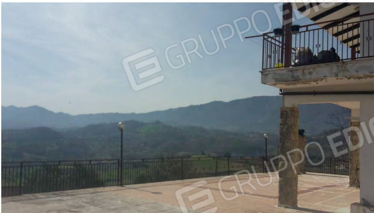
Terrazza-corte sul retro, di propria pertinenza, con vista panoramica sulla vallata