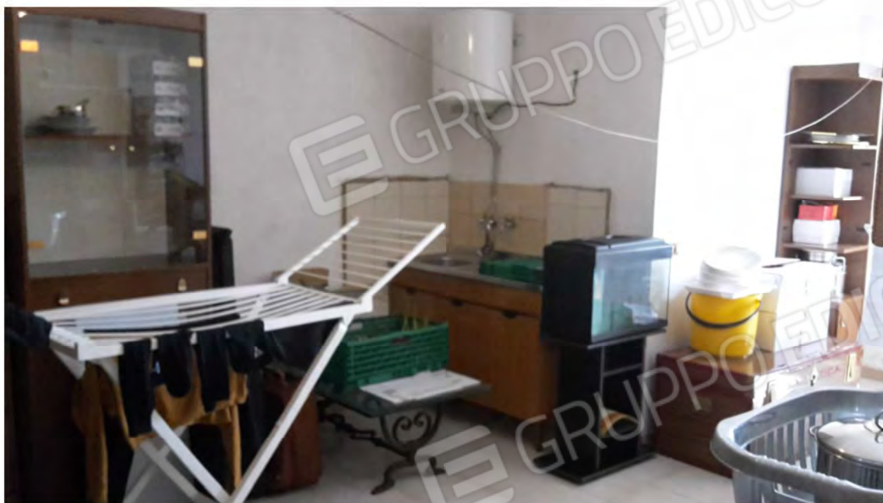
Seconda camera con attacchi idrici ed ingresso indipendente