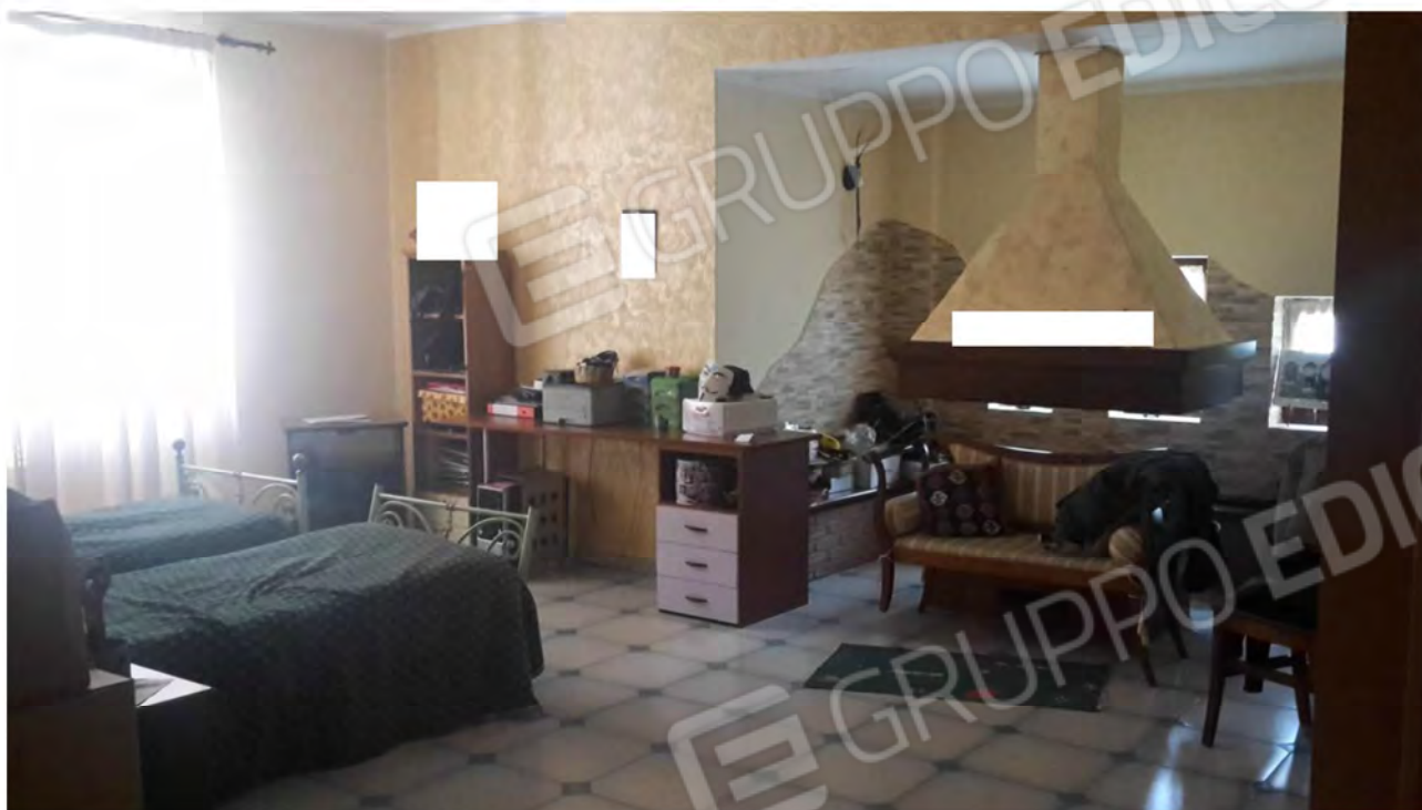
Locale di soggiorno