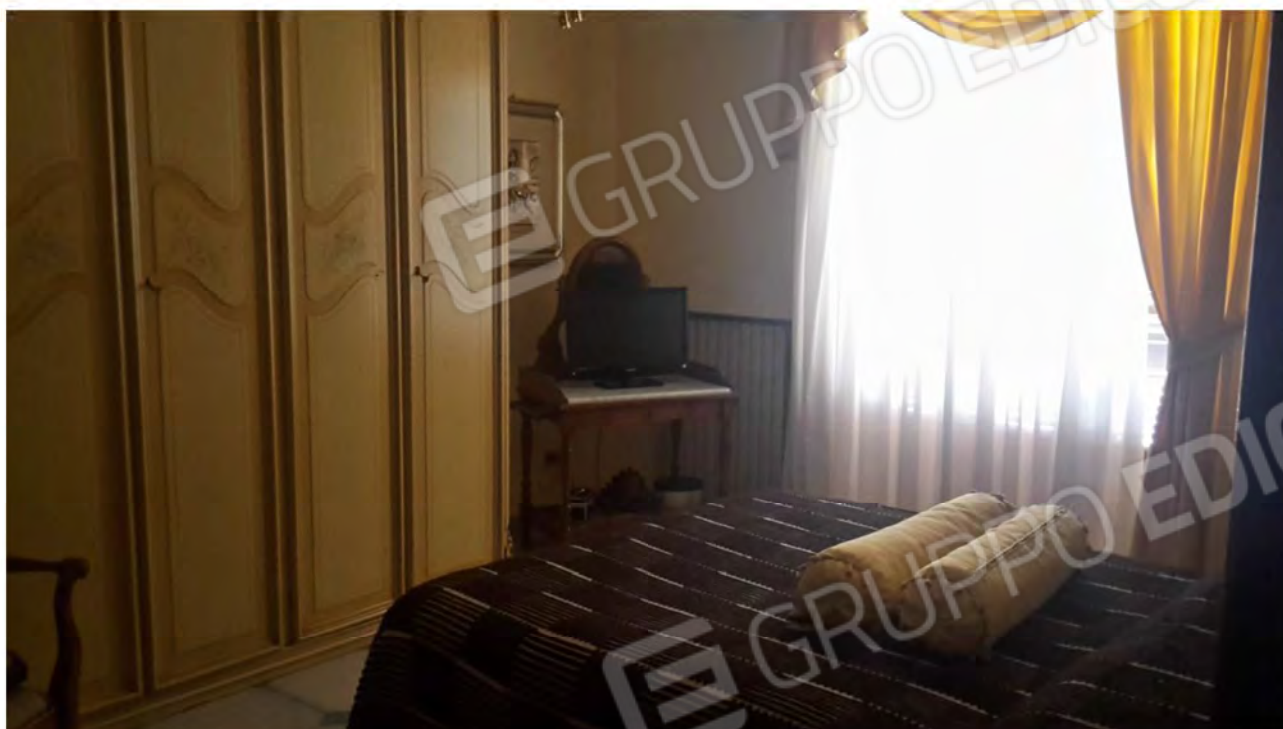
Le camere da letto