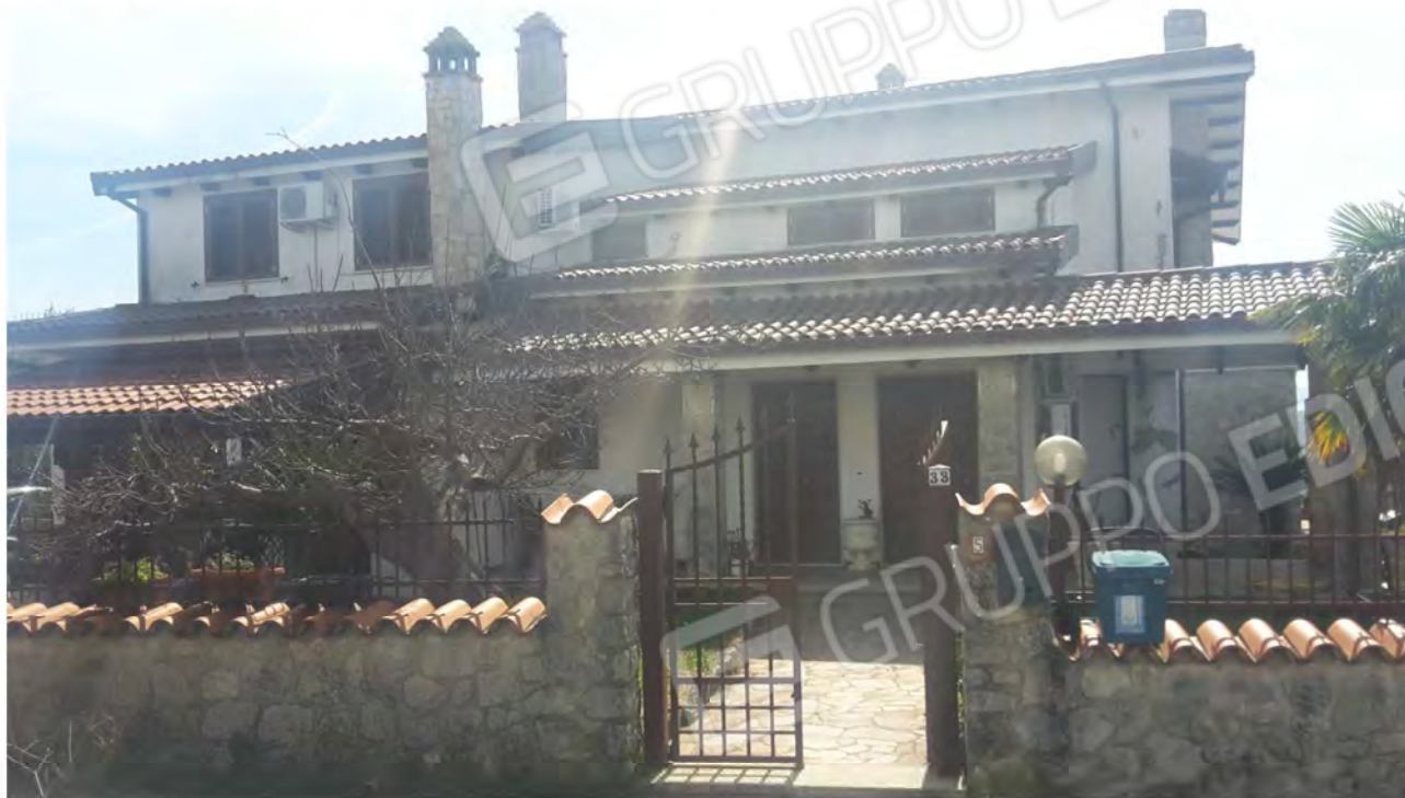
Prospetto principale del secondo cancello di ingresso con accesso al piano terra e primo