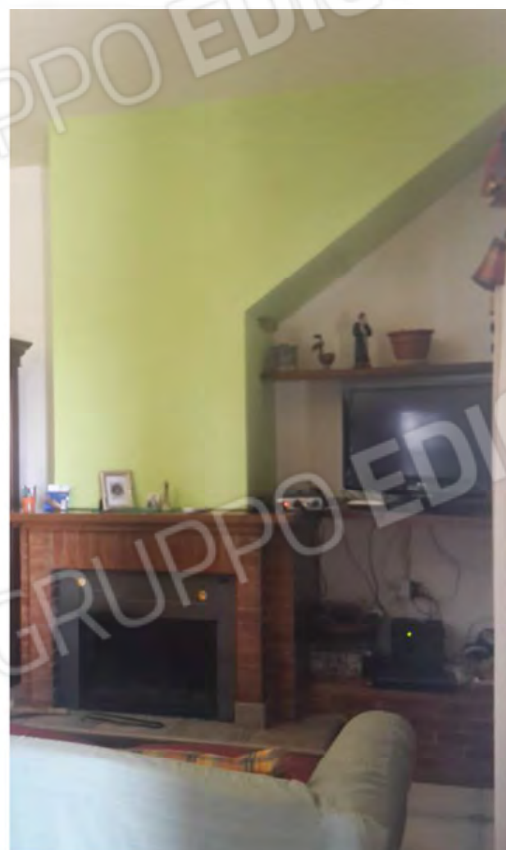
Cucina con caminetto