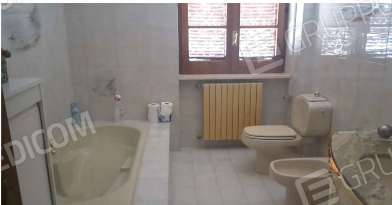
Locale bagno completo con vasca

Studio Tecnico - Arch. Federica Berlingieri - via Trieste, 22 Bisignano (CS)