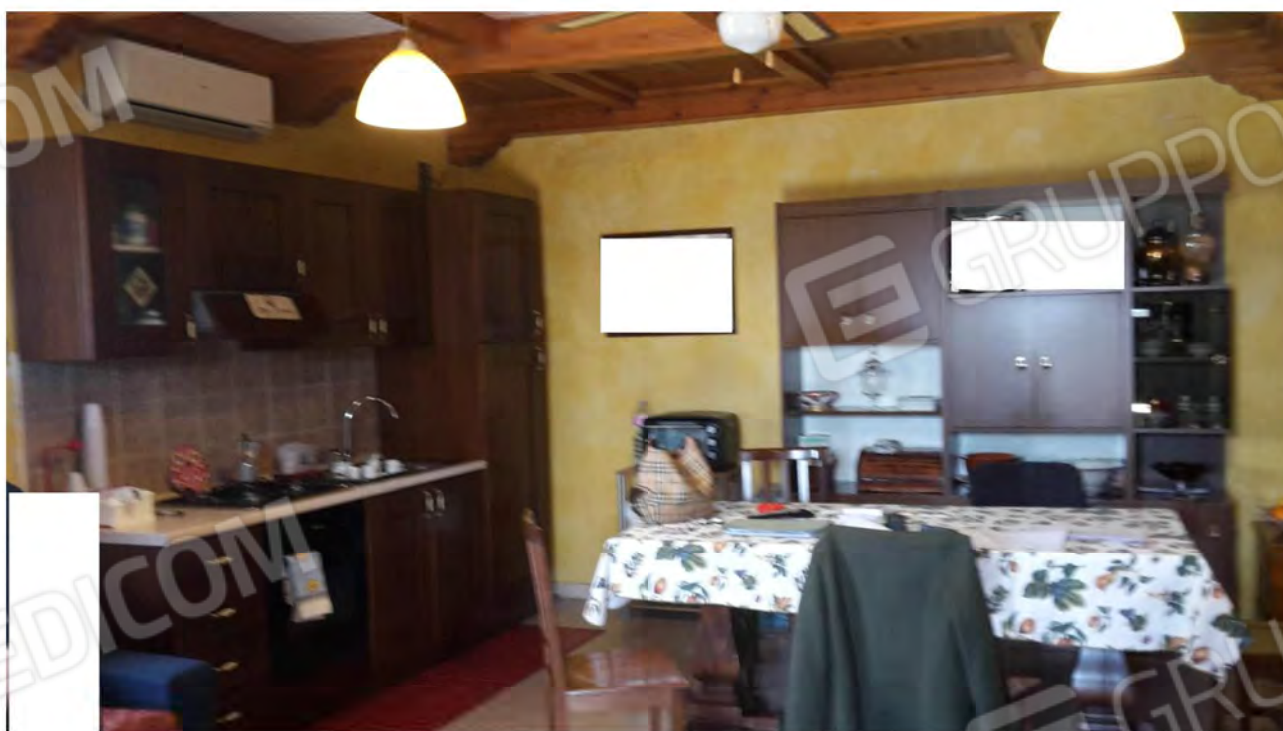
Vista dell'angolo cottura