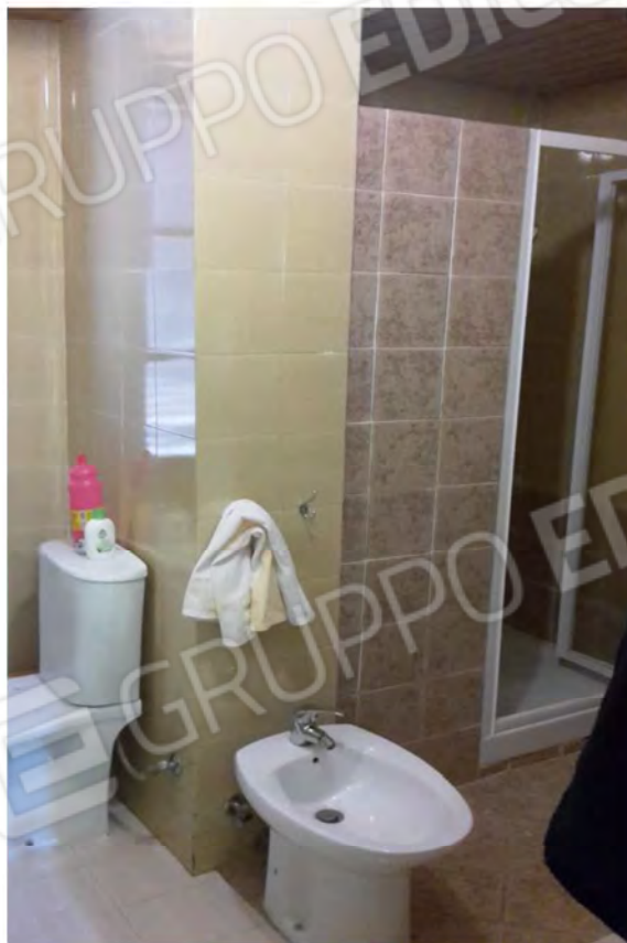
Vista della camera e del bagno