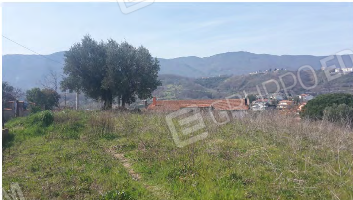
Immagini del terreno edificabile - via San Pietro – con vista panoramica sul centro storico