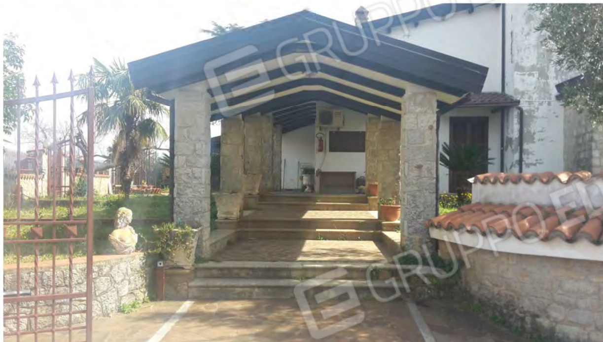
Passaggio di ingresso porticato; vista laterale e vano scala di accesso al piano