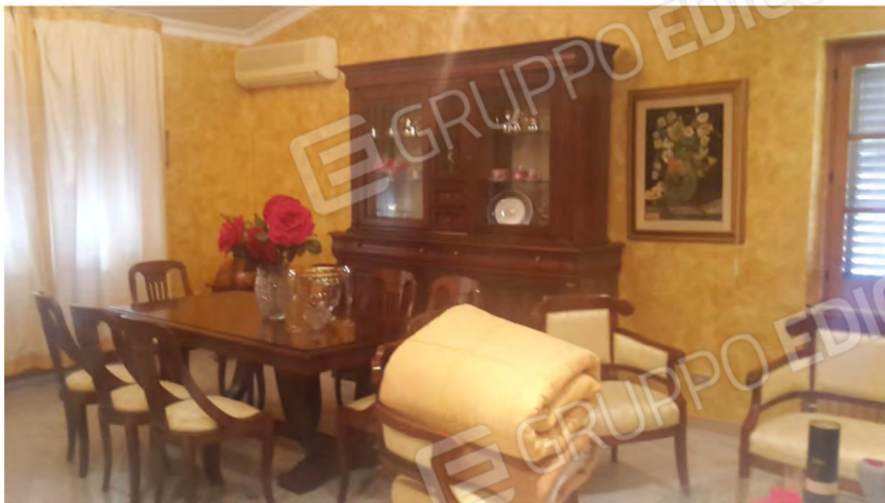
Stanza di soggiorno - pranzo