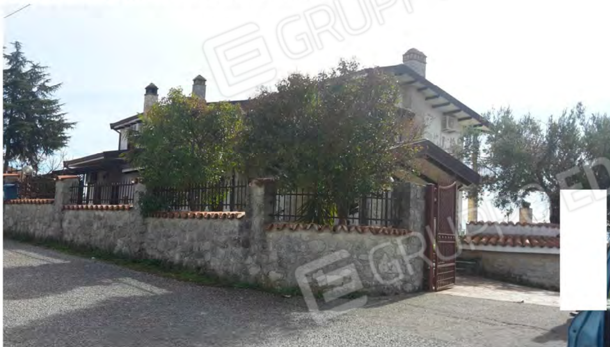
Ingresso dal primo cancello esterno e viale lastricato in discesa