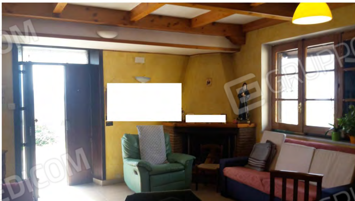
Vista del locale di soggiorno