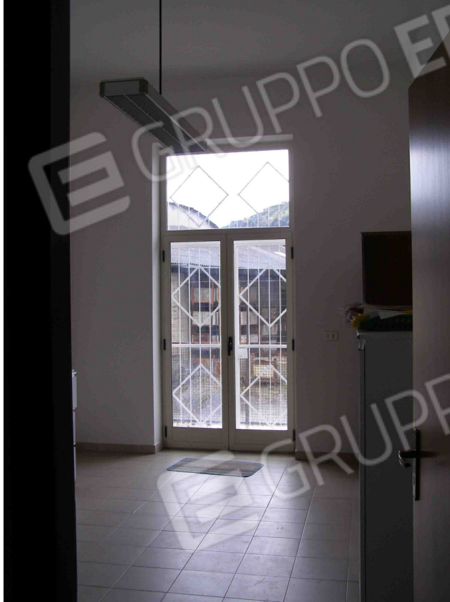
FOTO N° 21 : Locale adibito ad uso "Direzione " come da planimetria stato di fatto