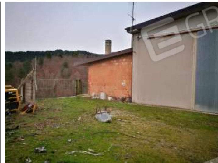
Figura 17 Capannone Industriale sub 3 Lato Sud-Ovest – visibile la costruzione annessa