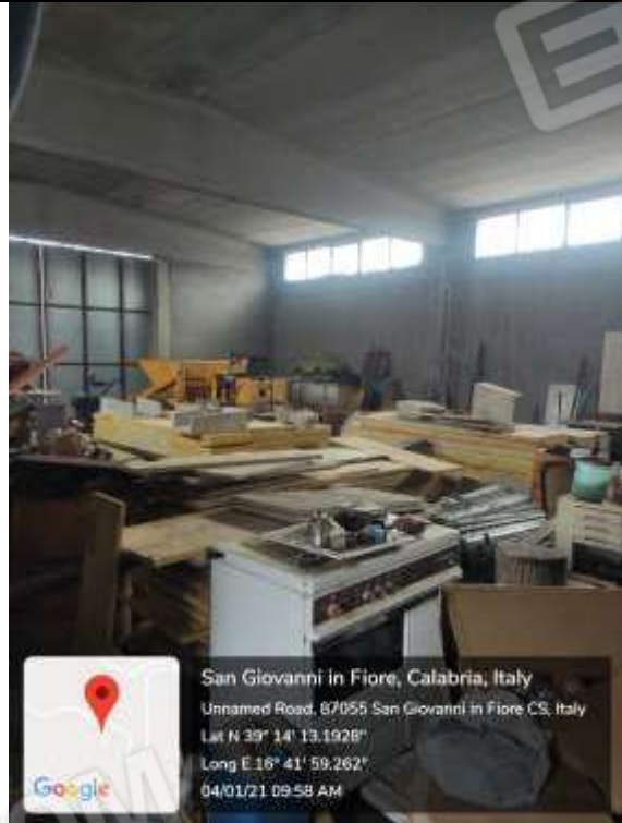
Figura 23 Capannone Industriale vista dell'interno