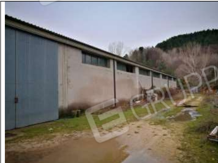
Figura 16 Capannone Industriale sub 3 Lato Nord-Ovest