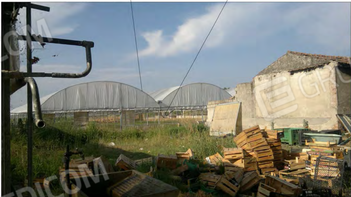
Appezamento di terreno in oggetto