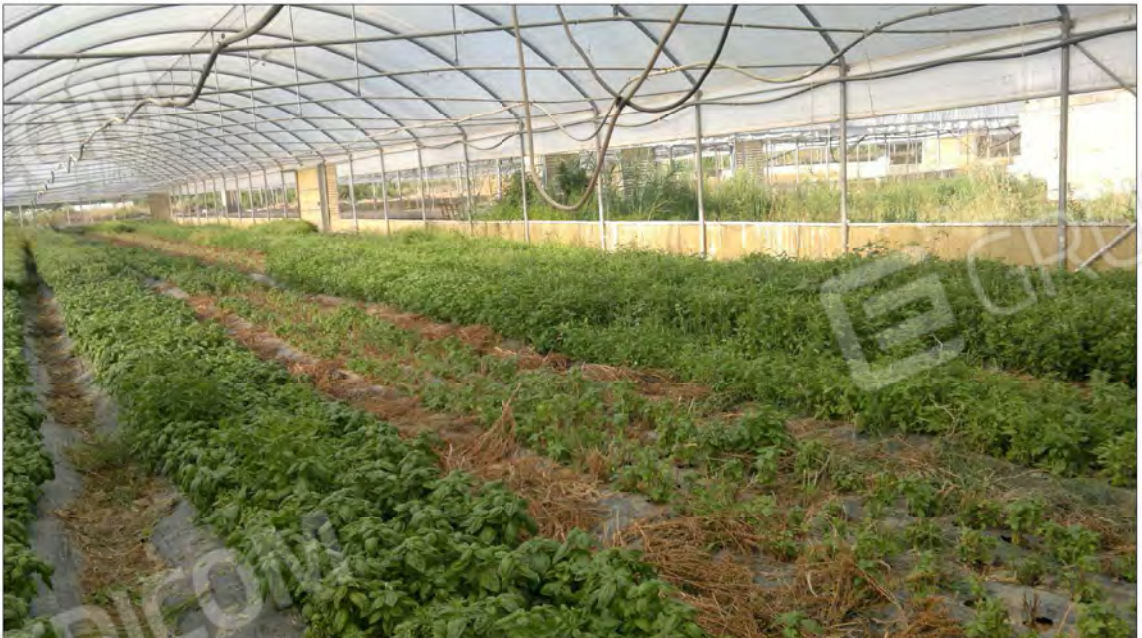
Vista interna Serre tunnel