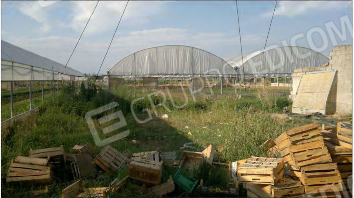
Stradina interpodereale Foto n°8