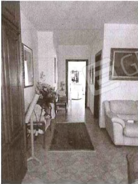
Appartamento piano terra: Disimpegno