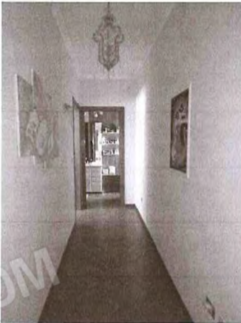
Appartamento piano primo: Disimpegno