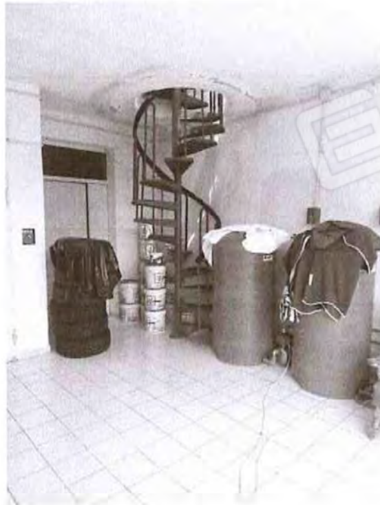
Interni Piano seminterrato