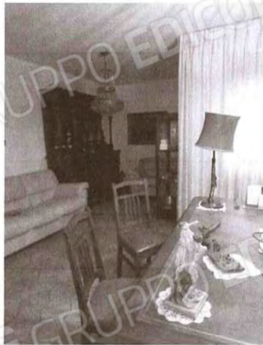
Appartamento piano terra: Studio