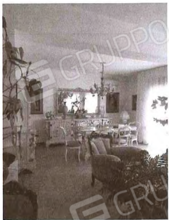
Appartamento piano terra: Soggiorno