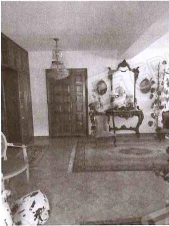
Appartamento piano terra: Ingresso