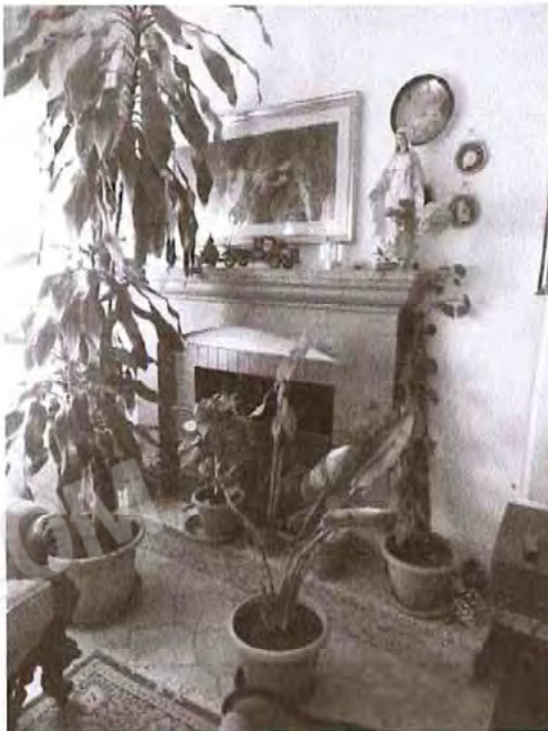
Appartamento piano terra: Soggiorno