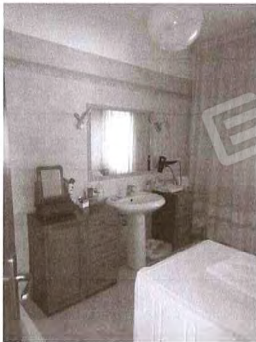
Appartamento piano terra: Bagno