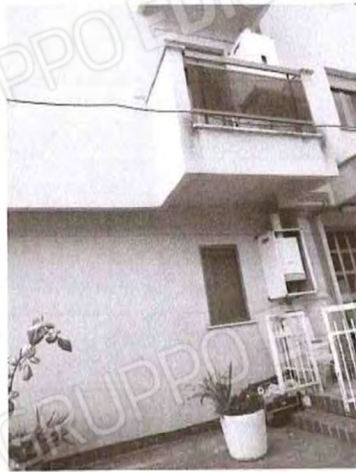
Vista esterno fabbricato (lato Nord)