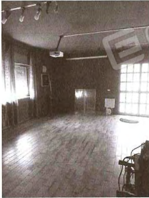
Interni Piano seminterrato