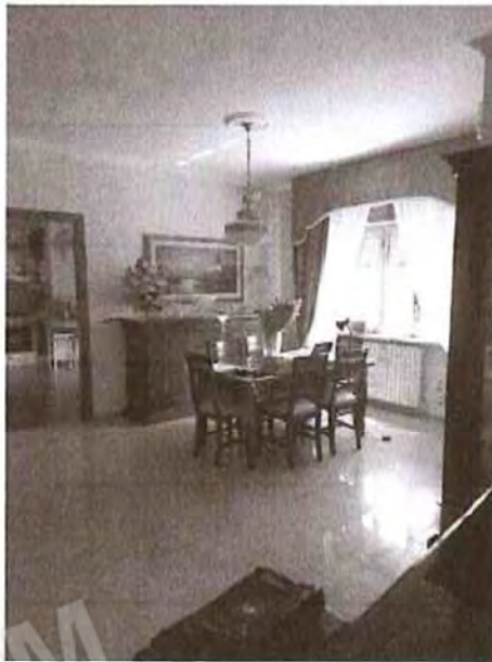
Appartamento piano primo: Soggiorno