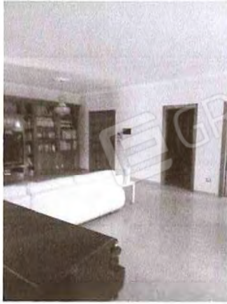
Appartamento piano primo: Soggiorno