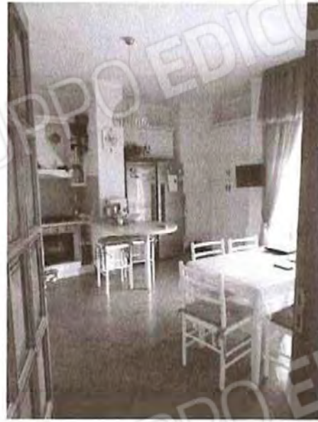
Appartamento piano primo: Cucina