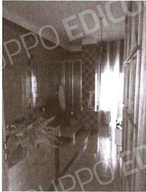
Appartamento piano primo: Bagno n°2