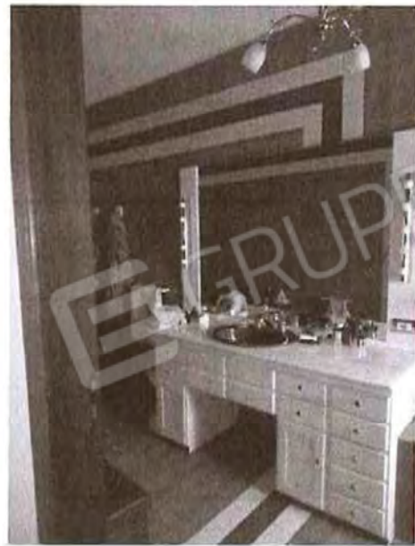
Appartamento piano primo: Bagno n°1