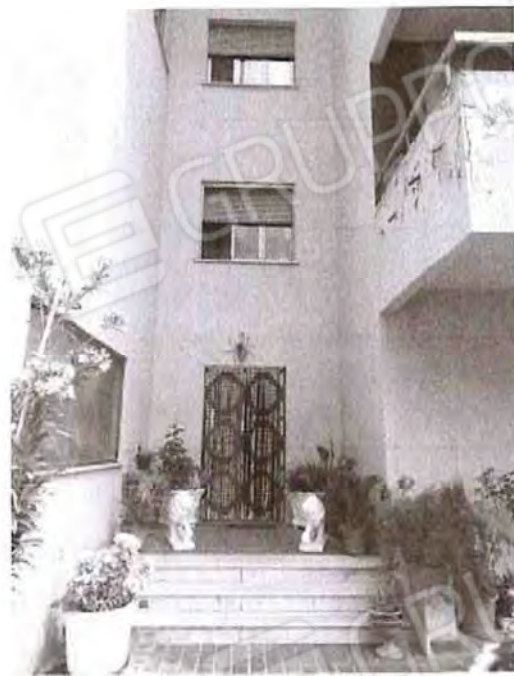
Vista esterno fabbricato (lato Sud)