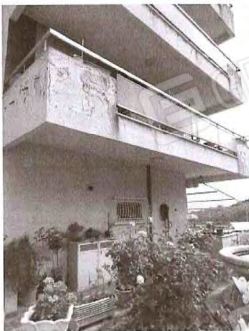
Vista esterno fabbricato (lato Sud)