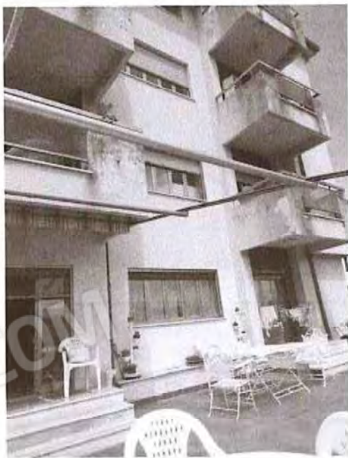
Vista esterno fabbricato (lato Est)