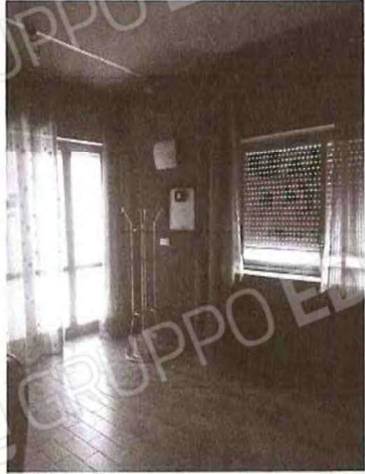
Interni Piano seminterrato