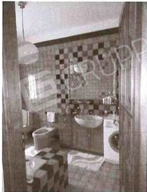
Appartamento piano primo: Bagno n°3