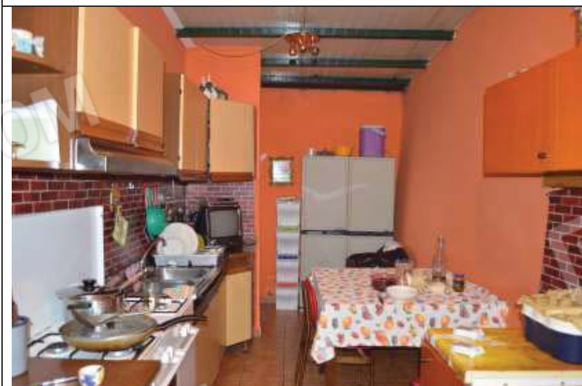
Locale ricavato nell'intercapedine