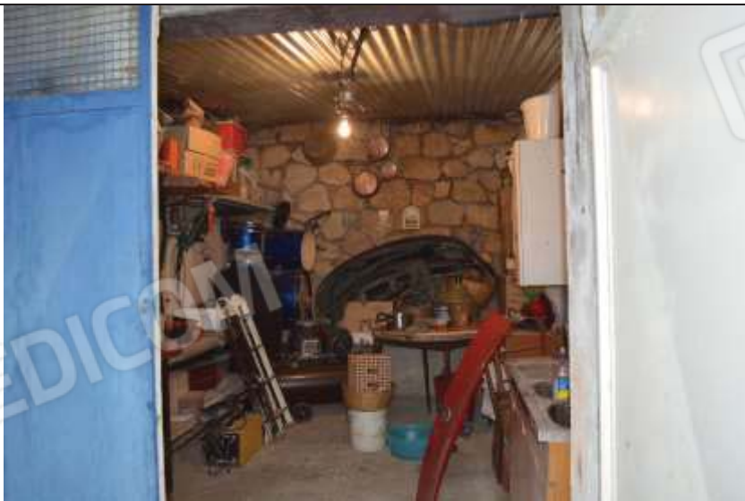
Immobile foglio N.8 Mappale N.313 sub.1