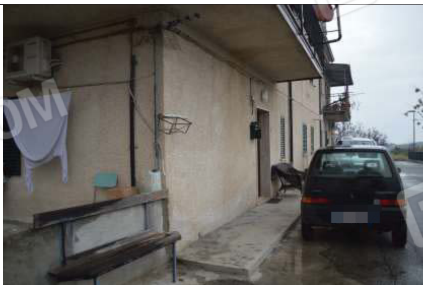
Alloggio foglio N.8 Mappale N.311 sub.1