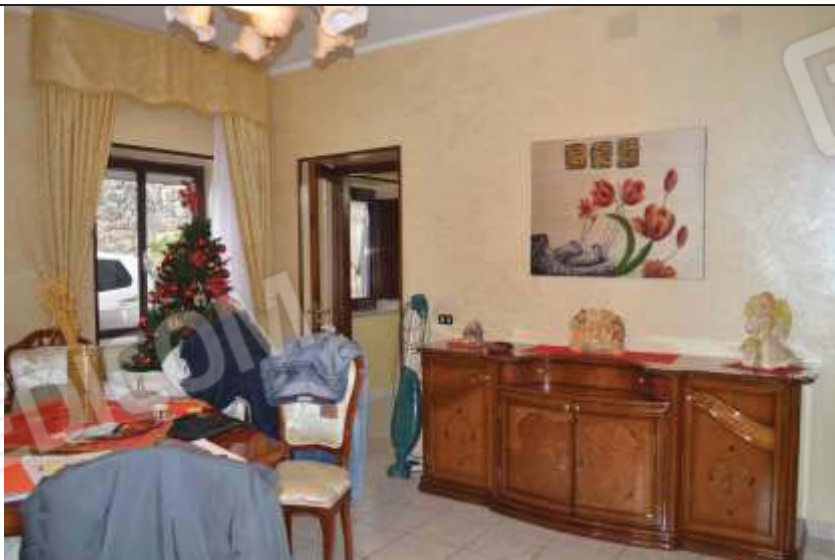
Soggiorno - pranzo