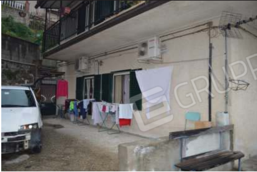
Alloggio foglio N.8 Mappale N.311 sub.1