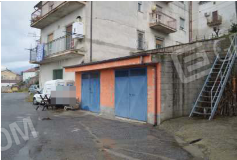
Immobile foglio N.8 Mappale N.313 sub.1