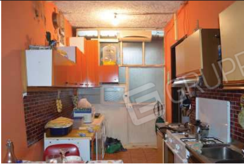
Locale ricavato nell'intercapedine