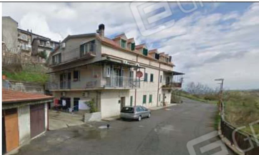
FOTO INTERO FABBRICATO