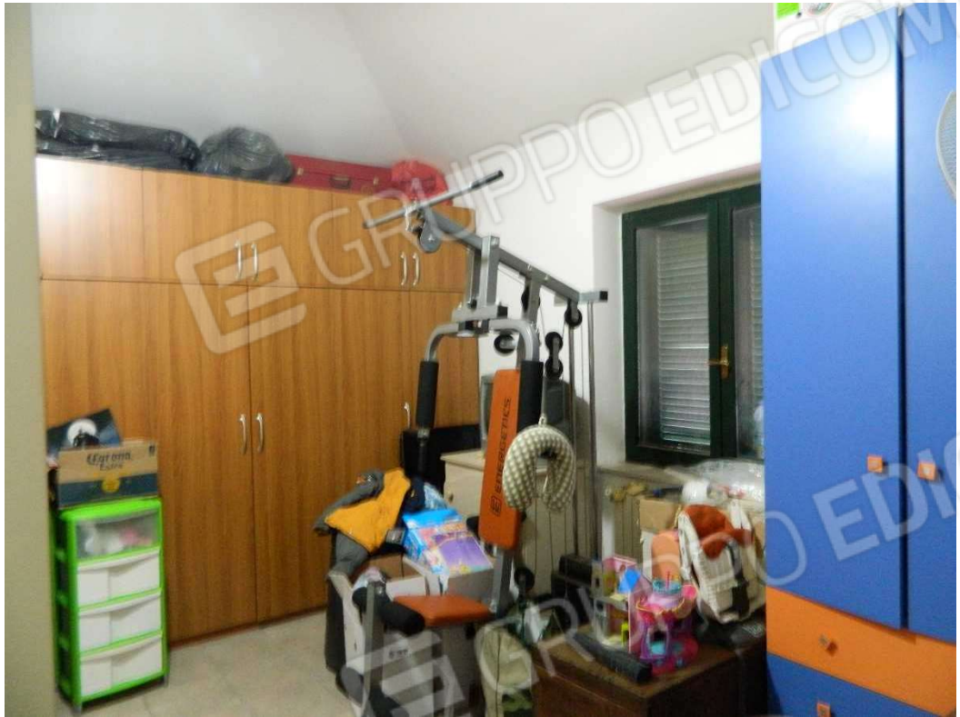
Camera piano terzo