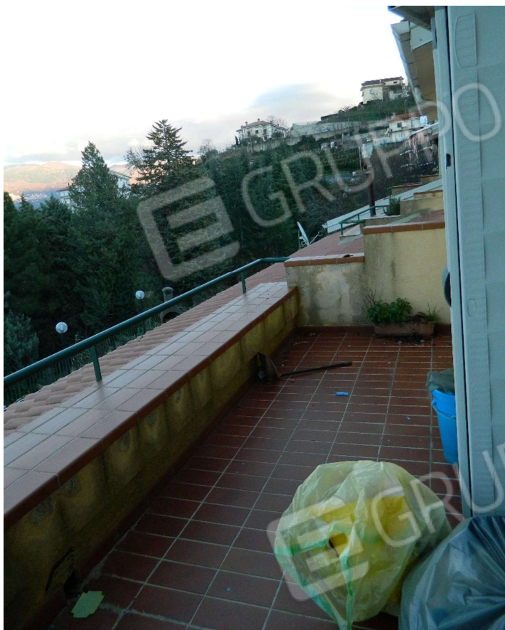
Balcone piano primo