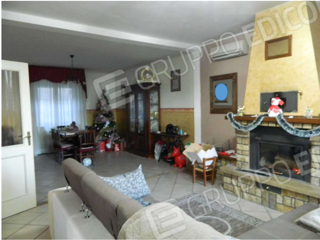
Soggiorno – pranzo. Piano terra