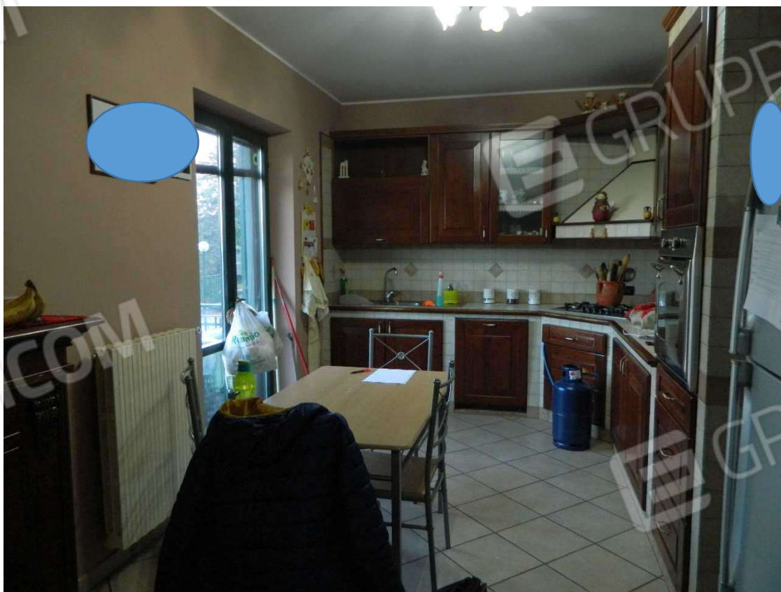
Cucina piano terra