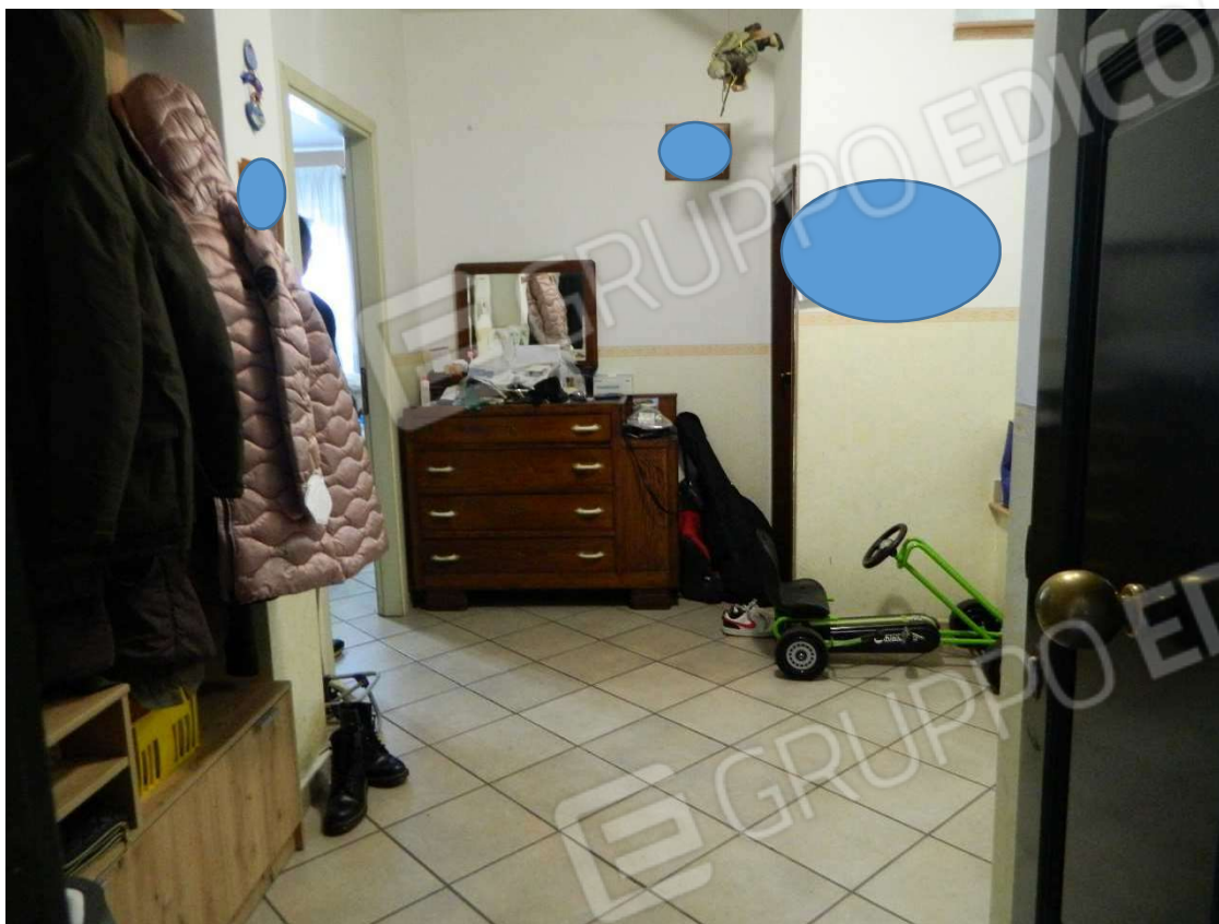
Ingresso piano terra