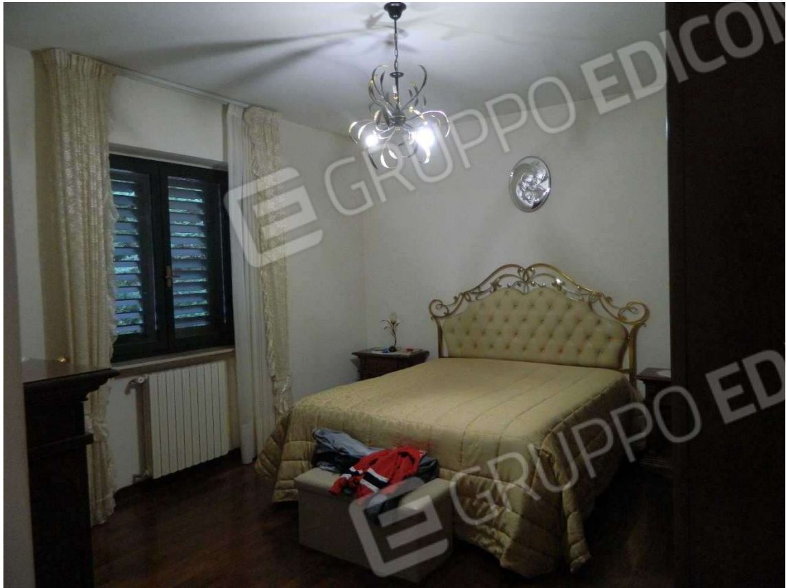
Camera piano primo