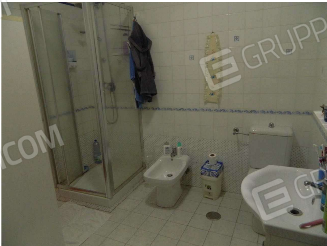
Bagno piano terra