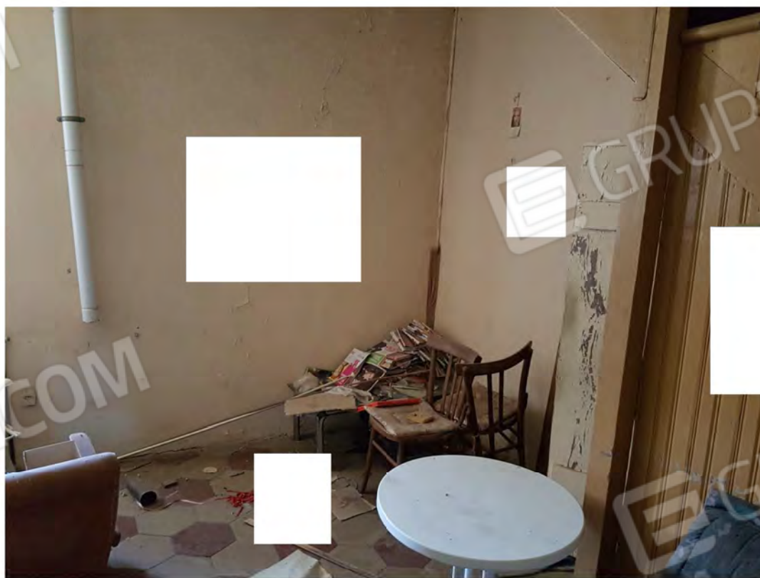
Figura 2 – Soggiorno