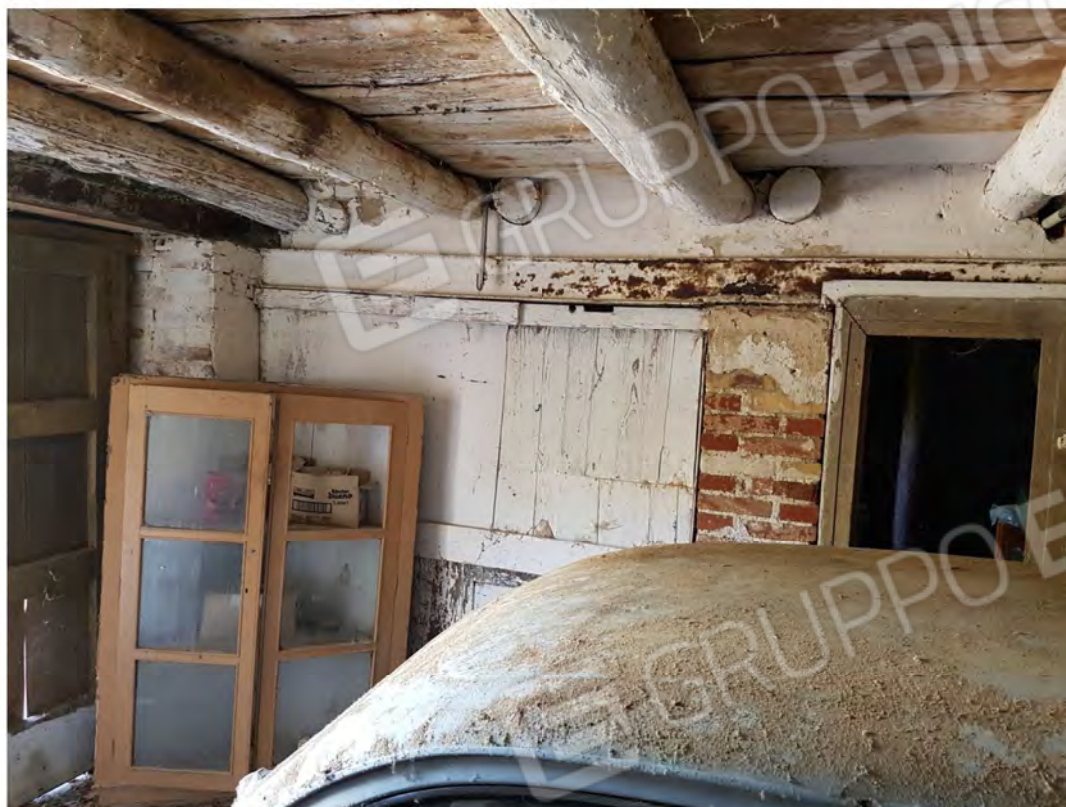
Figura 9 – Magazzino con parete divisoria