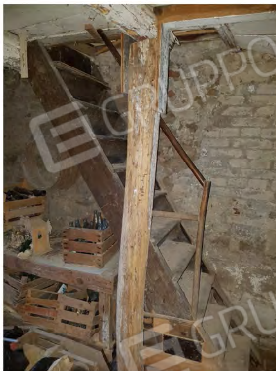
Figura 7 – Scala di collegamento tra primo e secondo piano sotterrada ( sotterraneo )