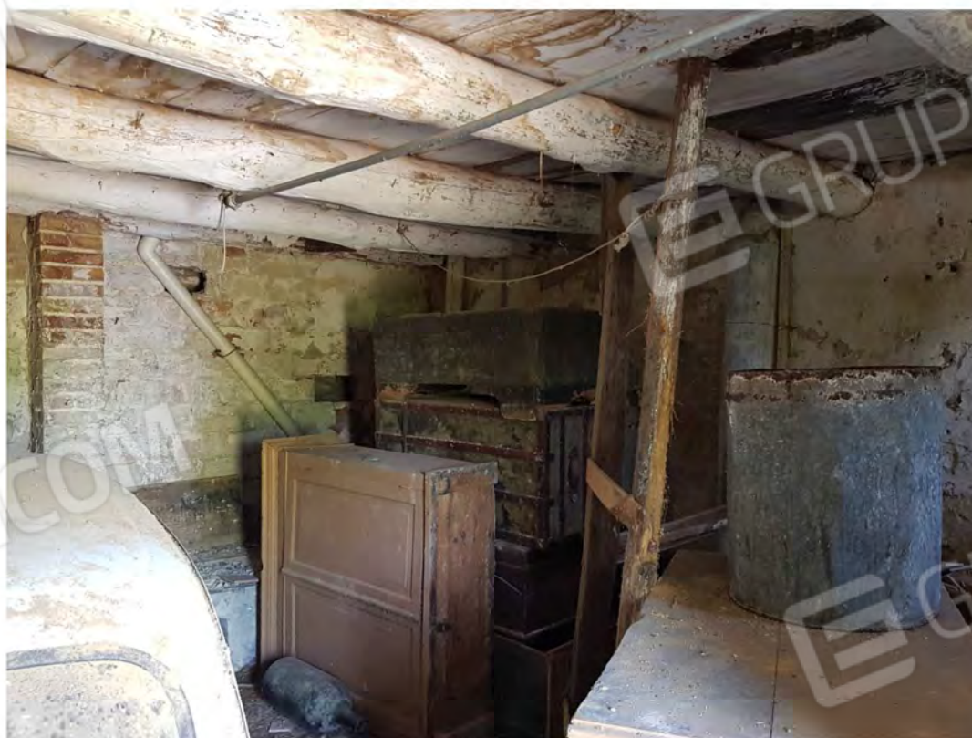
Figura 10 – Magazzino e ricovero attrezzi