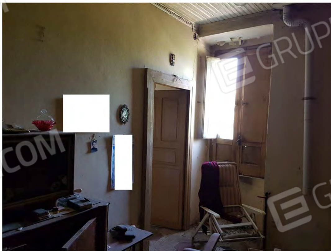
Figura 6 – Soggiorno