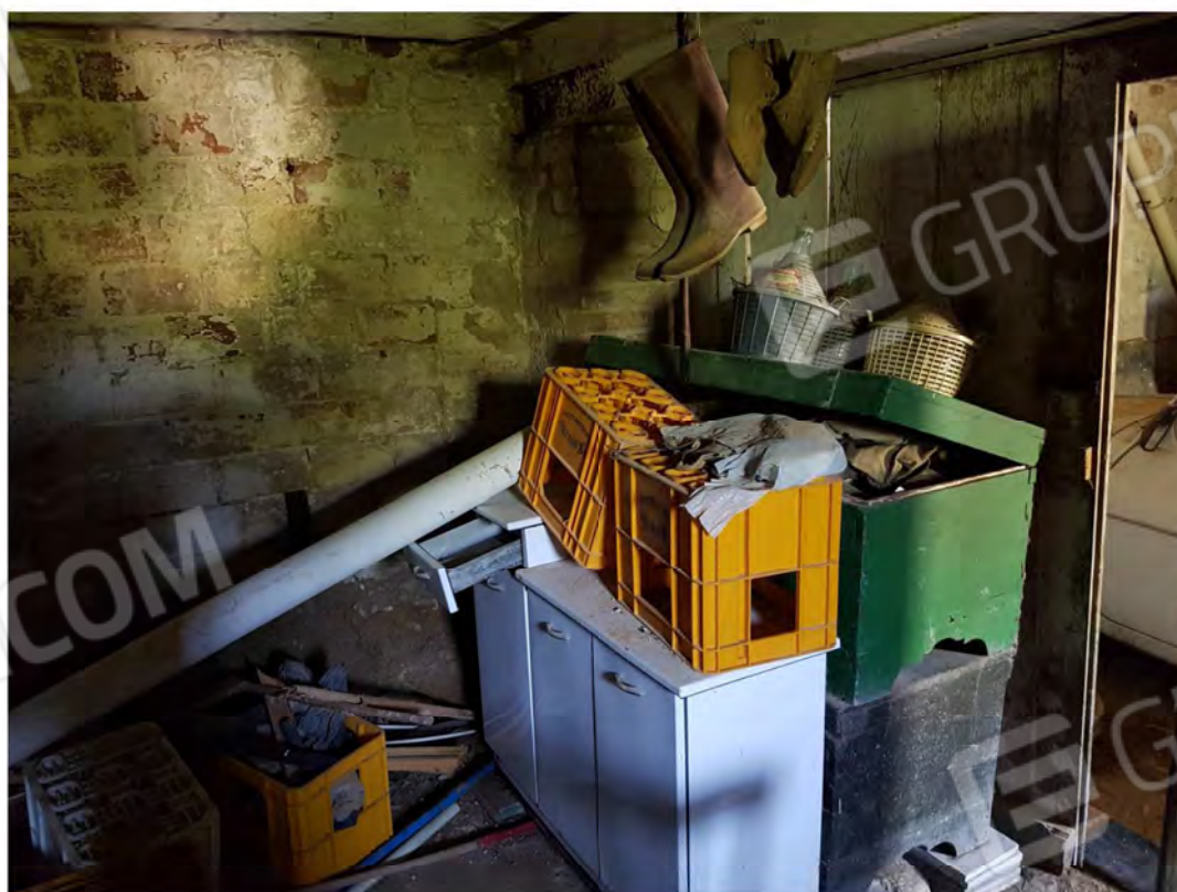
Figura 8 – Magazzino