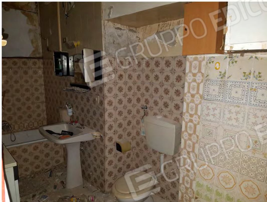
Figura 5 – Bagno