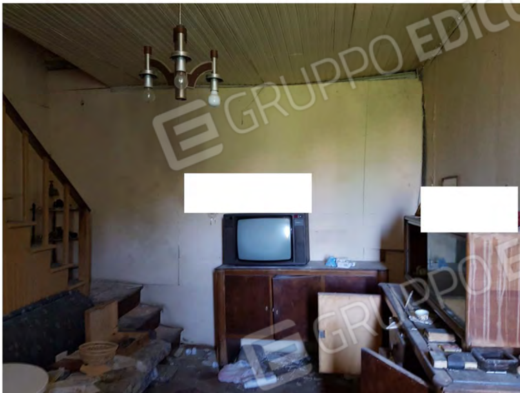
Figura 3 – Soggiorno