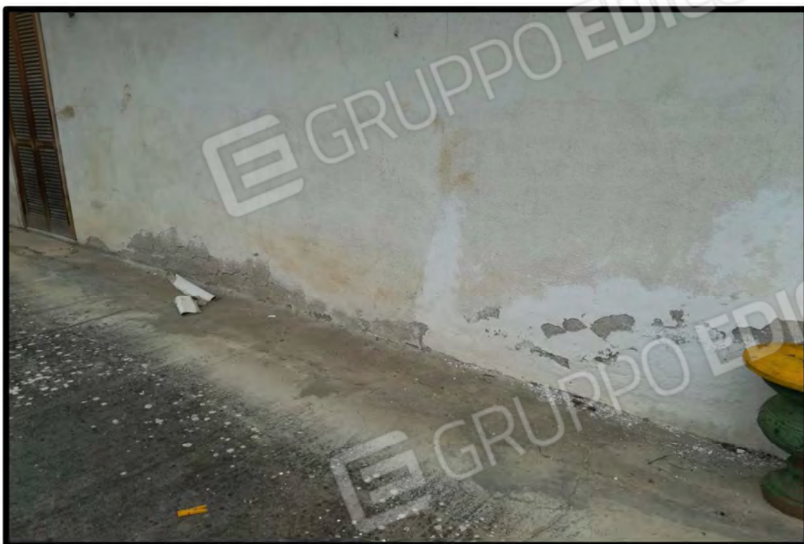
PARTICOLARE ESTERNO UMIDITA PER RISALITA CAPILLARE SULLE MURATURE E INFISSO ESTERNO