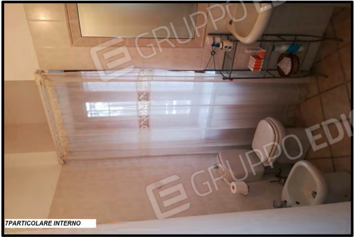
7 PARTICOLARE INTERNO