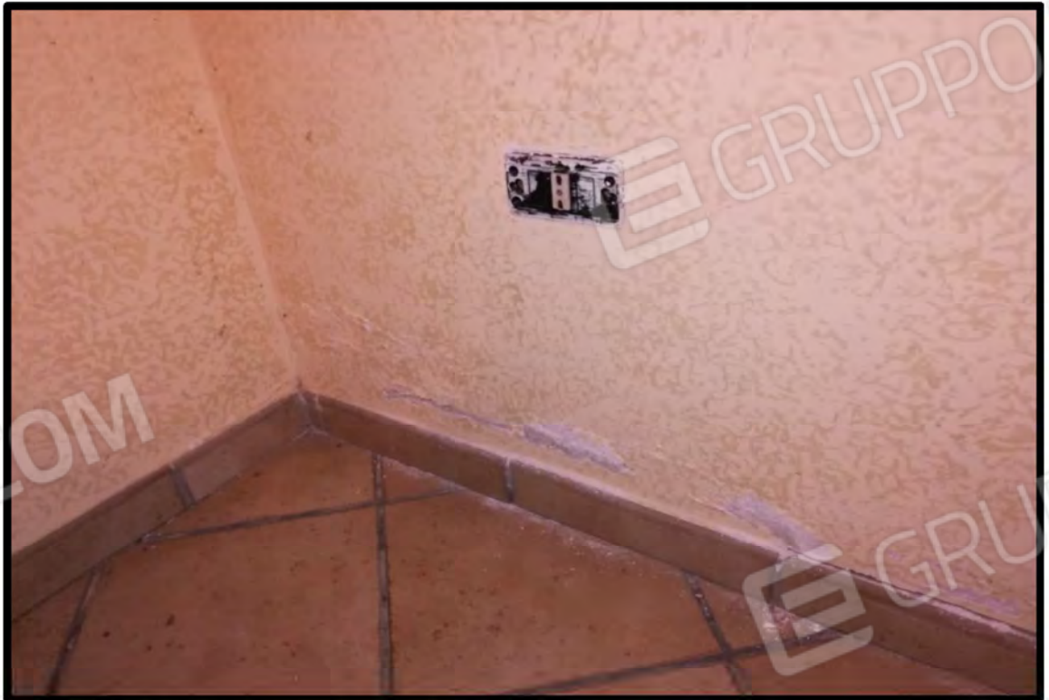
8 PARTICOLARE INTERNO UMIDITA PER RISALITA CAPILLARE SULLE MURATURE