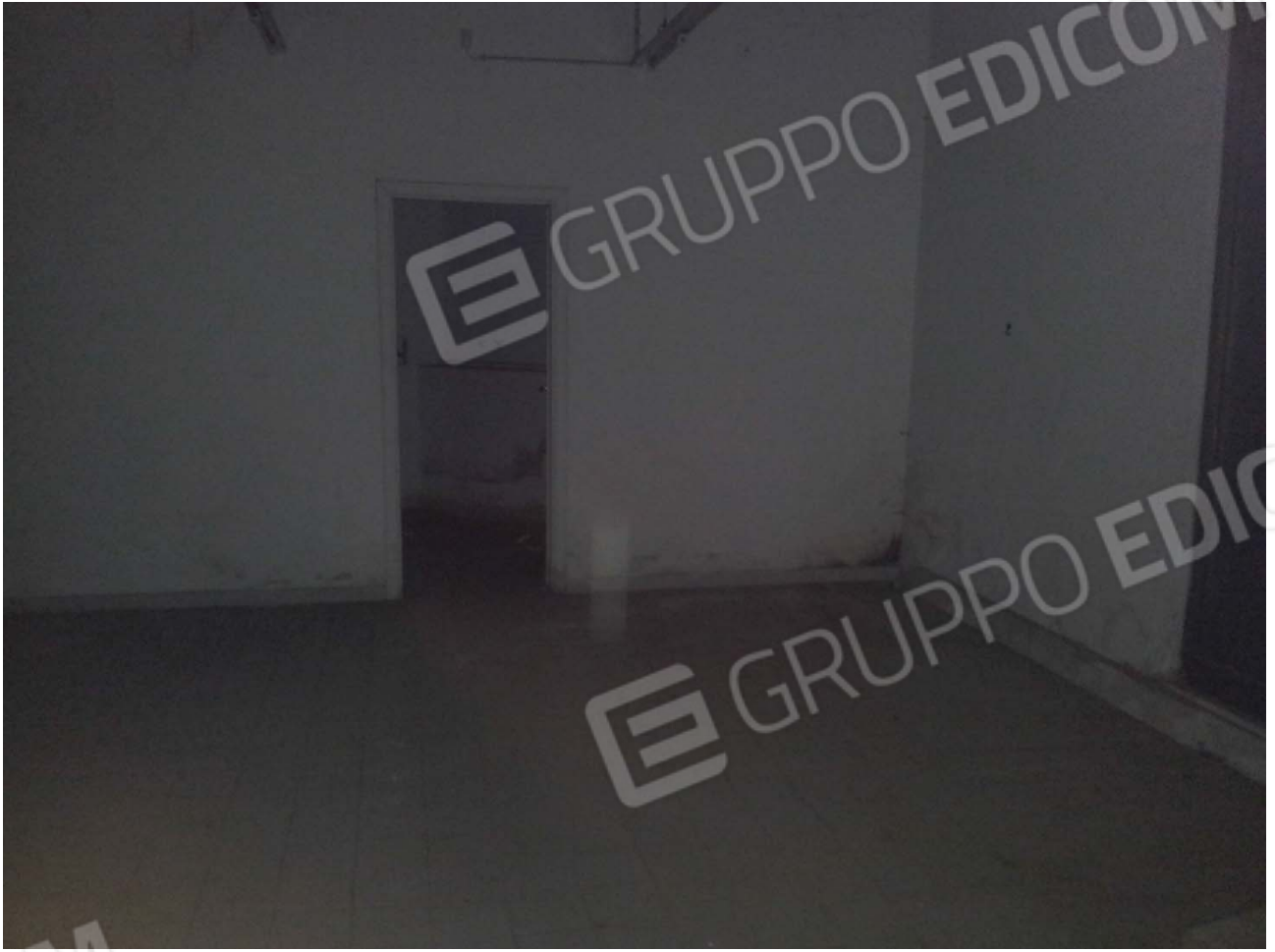
Interno Lotto n. 2