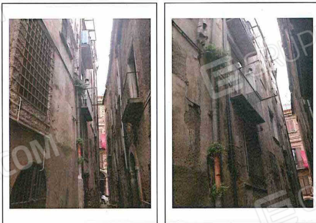
FOTO 2 – Prospetto del fabbricato e dell'appartamento oggetto di perizia su Vicolo Bastai