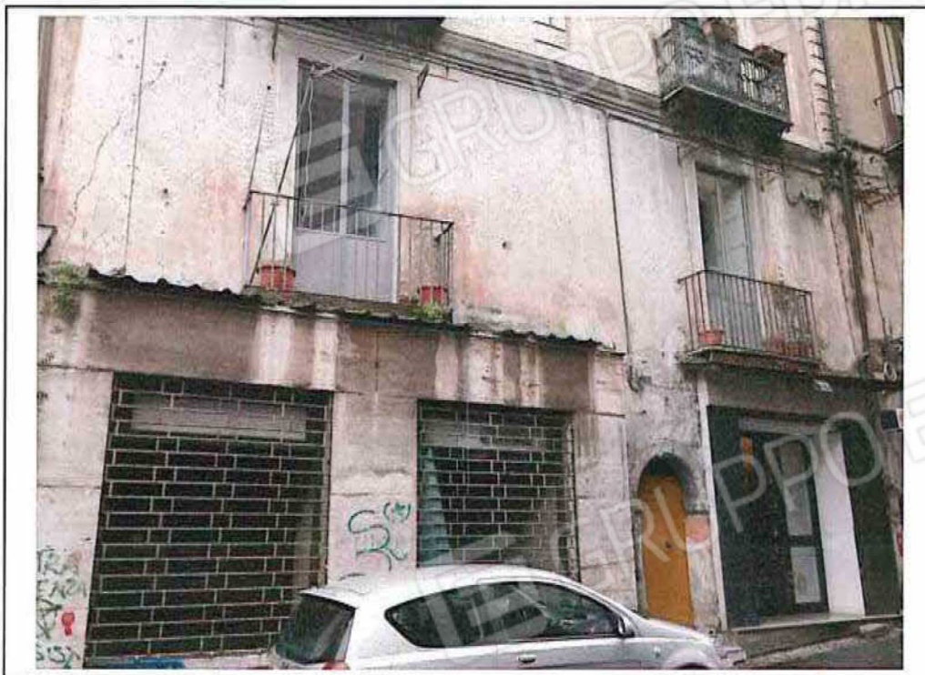
FOTO 3 – Prospetto su Corso Telesio dell'appartamento oggetto di perizia