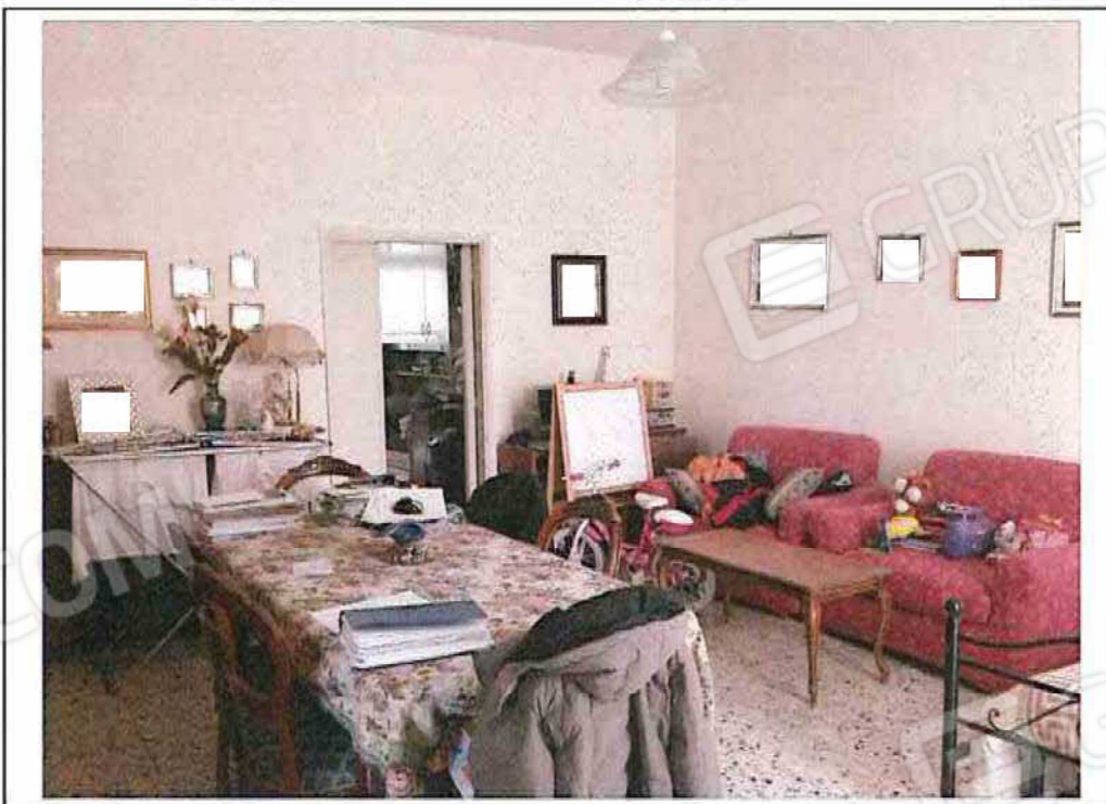
FOTO 18 - Ambiente "letto/soggiorno" vista dalla porta di collegamento con la cucina