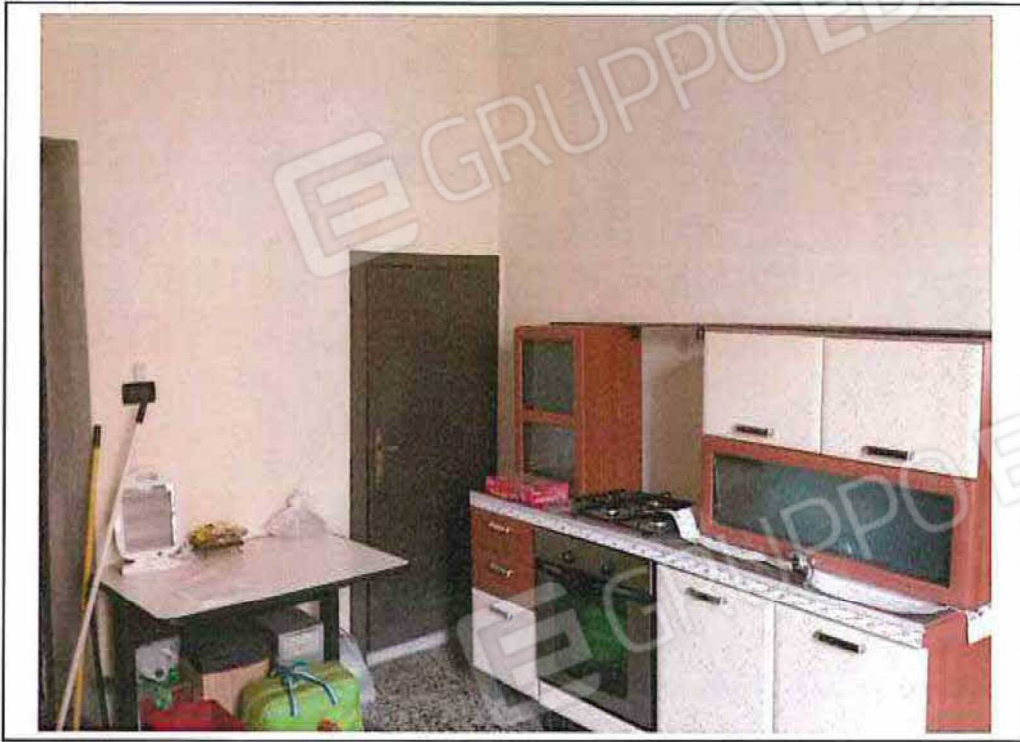
FOTO 15 – Ambiente "Cucina/Pranzo" vista della porta del ripostiglio