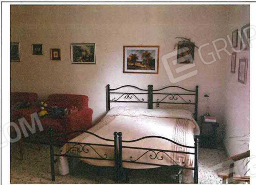
FOTO 20 – Ambiente "Cucina/Pranzo" Ambiente "letto/soggiorno" vista dall'interno