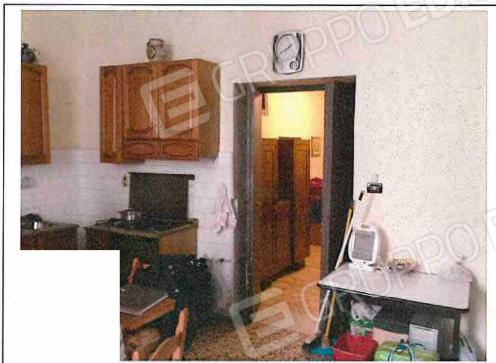
FOTO 13 – Ambiente "Cucina/Pranzo" vista della porta di collegamento con l'ingresso