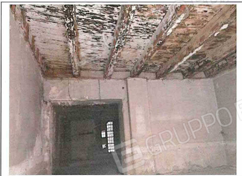
FOTO 5 – Intradosso solaio in legno del primo piano visto dal piano terra