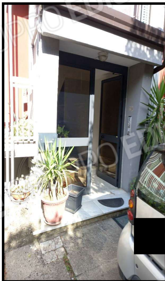
Portone condominiale su lato opposto a via Ottavio Greco