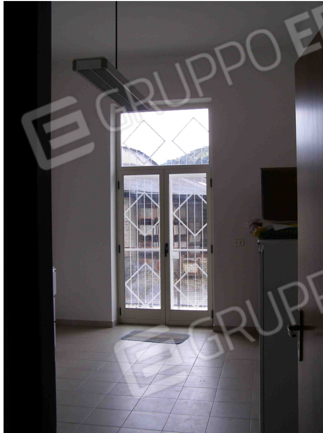
FOTO N° 21 : Locale adibito ad uso "Direzione " come da planimetria stato di fatto