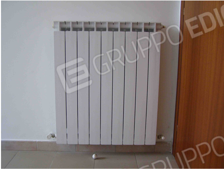
FOTO N° 29: Particolari impianto termico : radiatore in alluminio