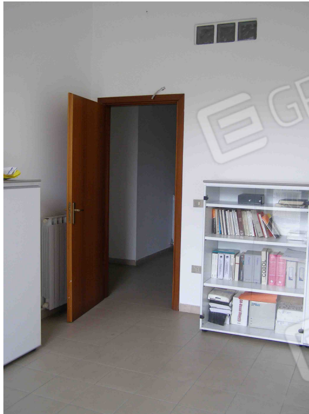
FOTO N° 22 : Locale adibito ad uso "Direzione " come da planimetria stato di fatto