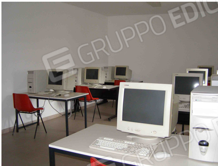
FOTO N° 23 : Locale adibito ad uso " Sala computer n° 2 " come da planimetria stato di fatto