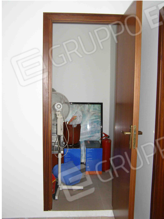
FOTO N° 25 : Locale adibito ad uso "Ripostiglio " come da planimetria stato di fatto