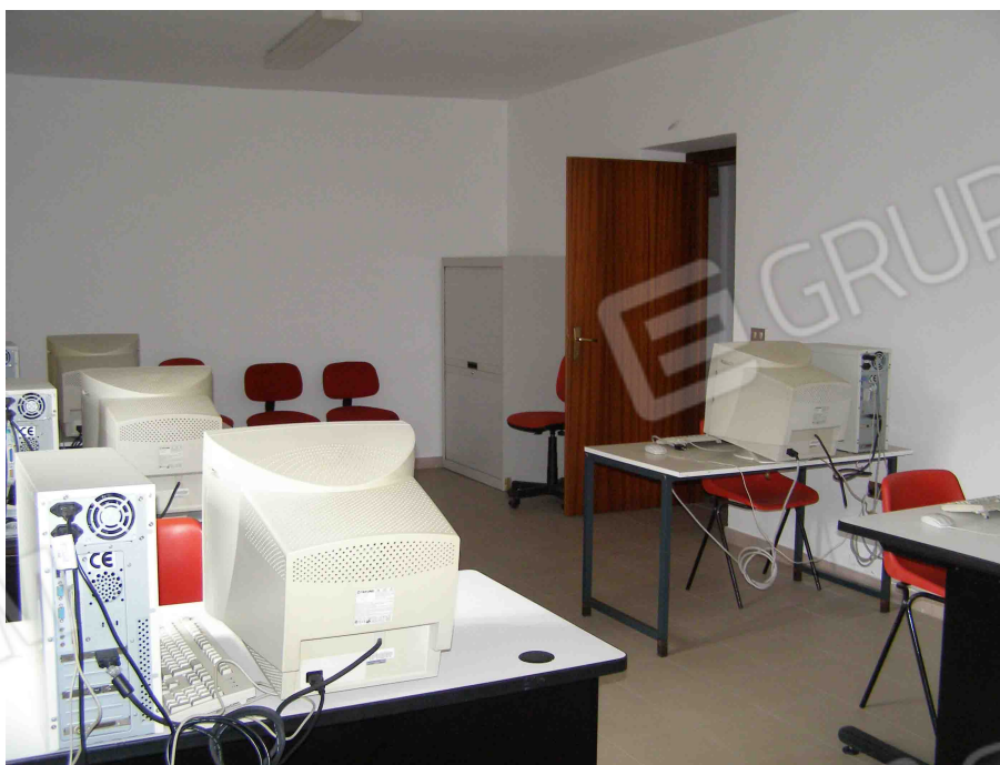
FOTO N° 24 : Locale adibito ad uso " Sala computer n° 2" come da planimetria Stato di fatto