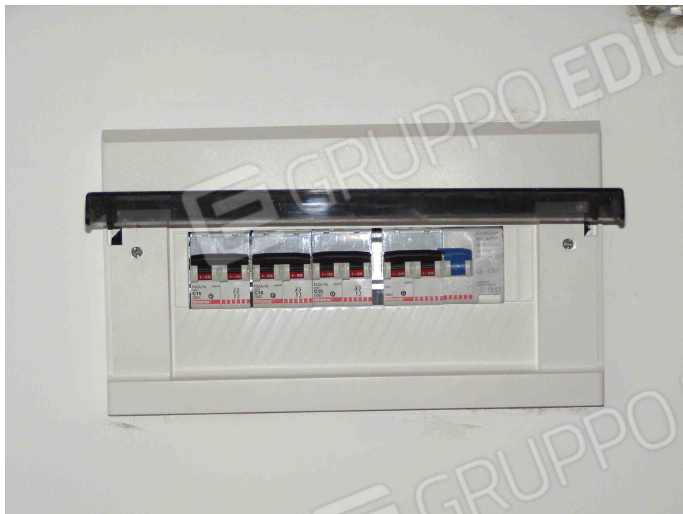
FOTO N° 27: Particolari impianto elettrico : Quadro elettrico di piano