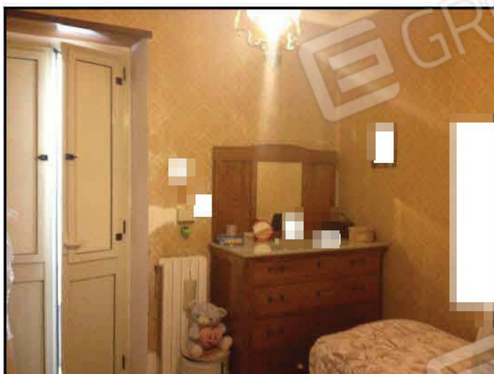
Fig n°10.1 – Cameretta 1