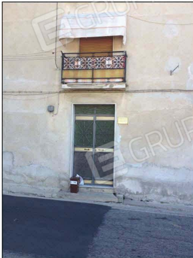
Fig n°2.1 – Ingresso Fabbricato