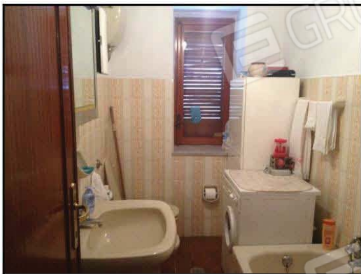
Fig n°8.2 – Bagno 2