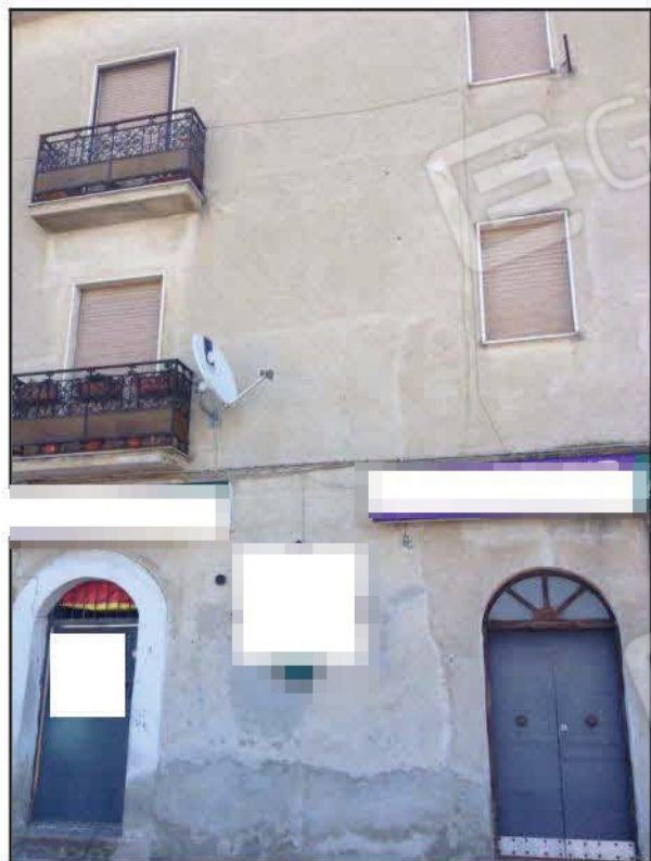
Fig n°2.3 – Vista di una porzione della facciata del fabbricato