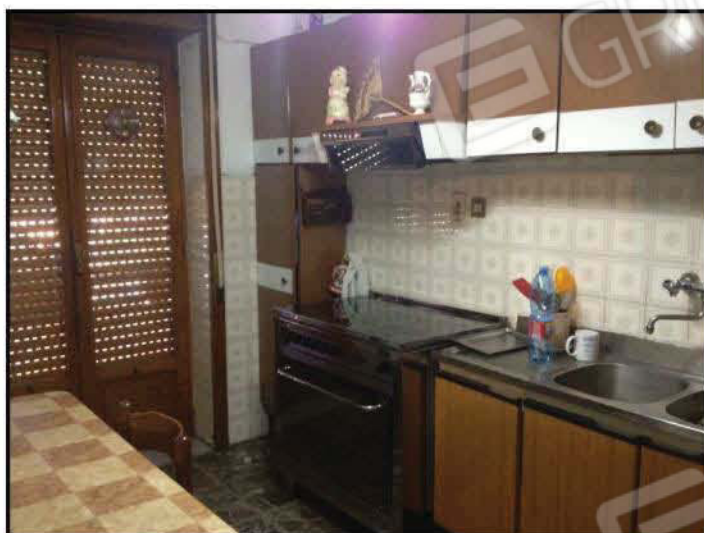
Fig n°4.2 – Cucina