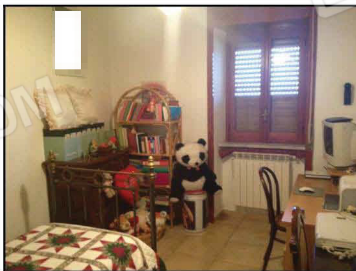
Fig n°7.1 – Cameretta 2