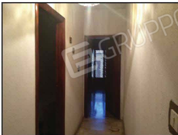
Fig n°9.1 – Corridoio