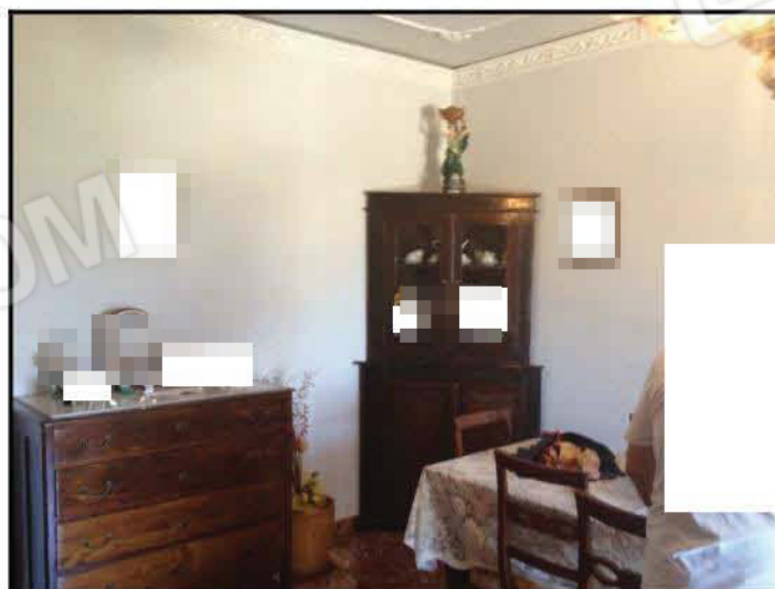
Fig n°5.1 – Tinello