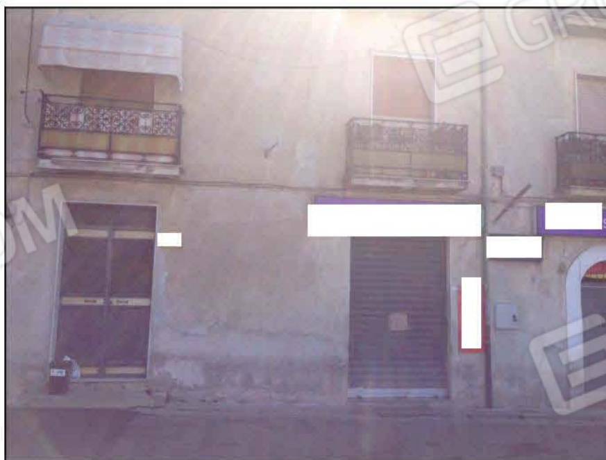
Fig n°2.2 – Ingresso Fabbricato e Vista di una porzione della facciata