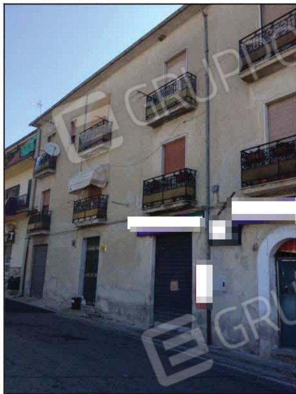
Fig n°2.4 – Ingresso Fabbricato e Vista di una porzione della facciata