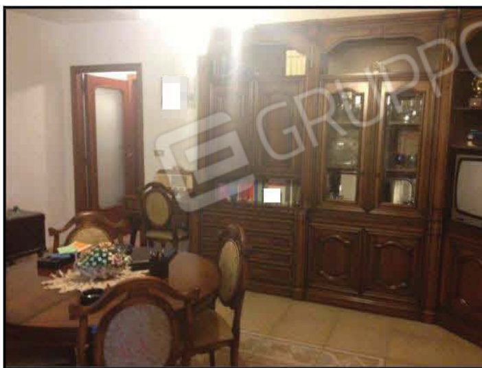
Fig n°6.1 – Tinello