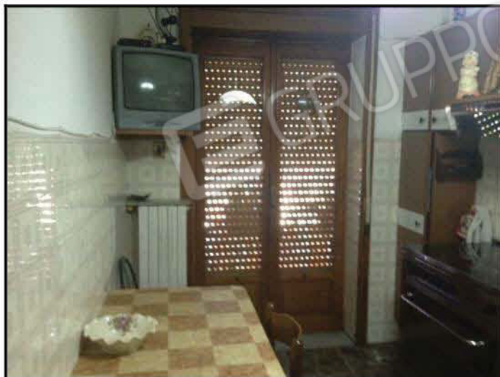
Fig n°4.1 – Cucina