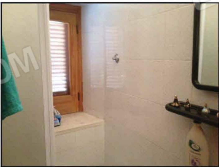
Fig n°8.3 – Bagno 2