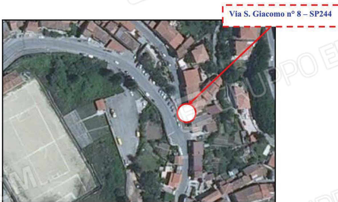
Fig n°1 – Vista Aerea di Aprigliano e Localizzazione Fabbricato