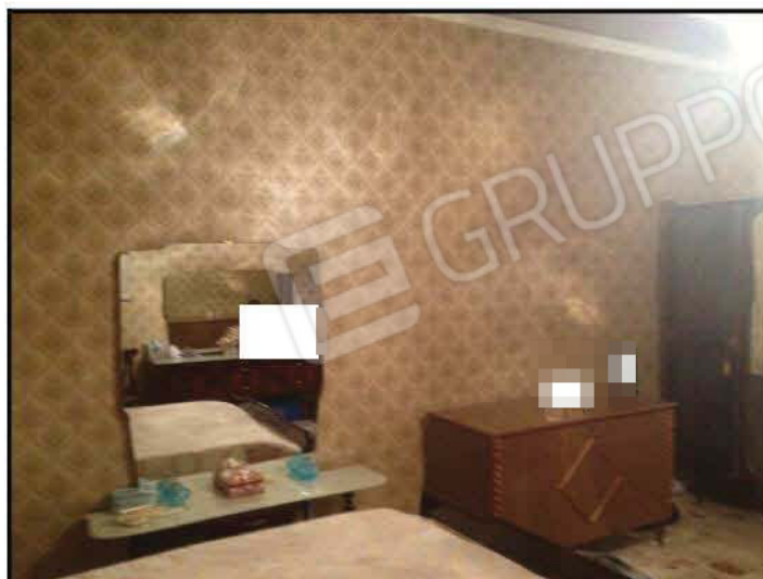
Fig n°11.2 – Stanza Matrimoniale