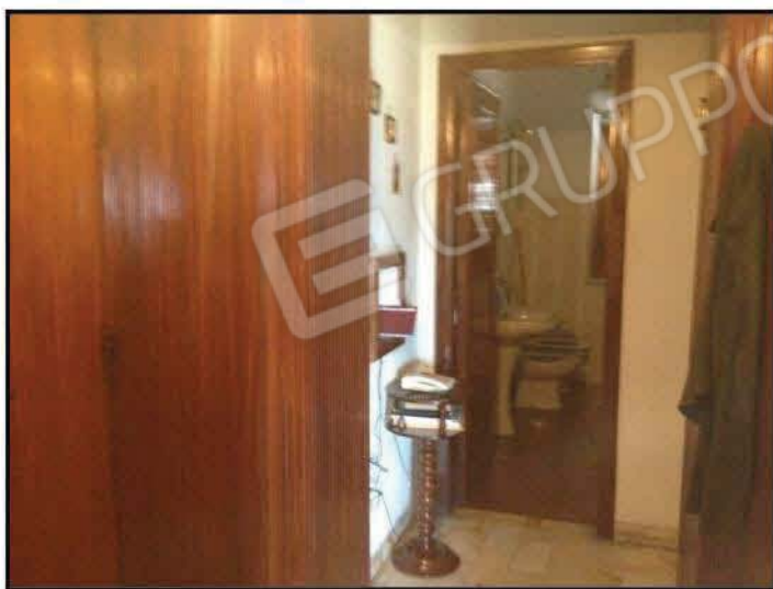
Fig n°8.1 – Bagno 1