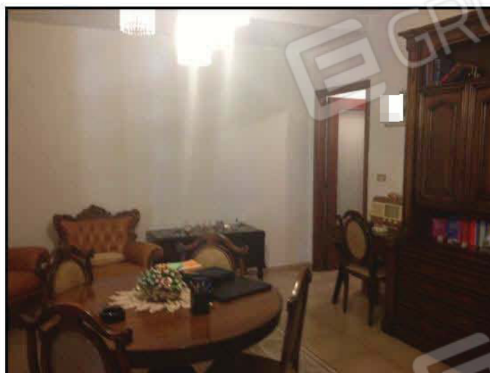
Fig n°6.2 – Soggiorno