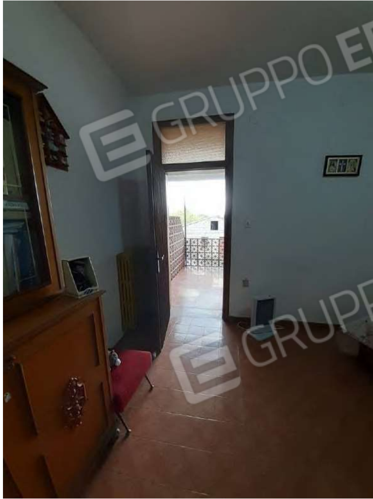
DA LETTO 1 ACCESSO SULLA TERRAZZA