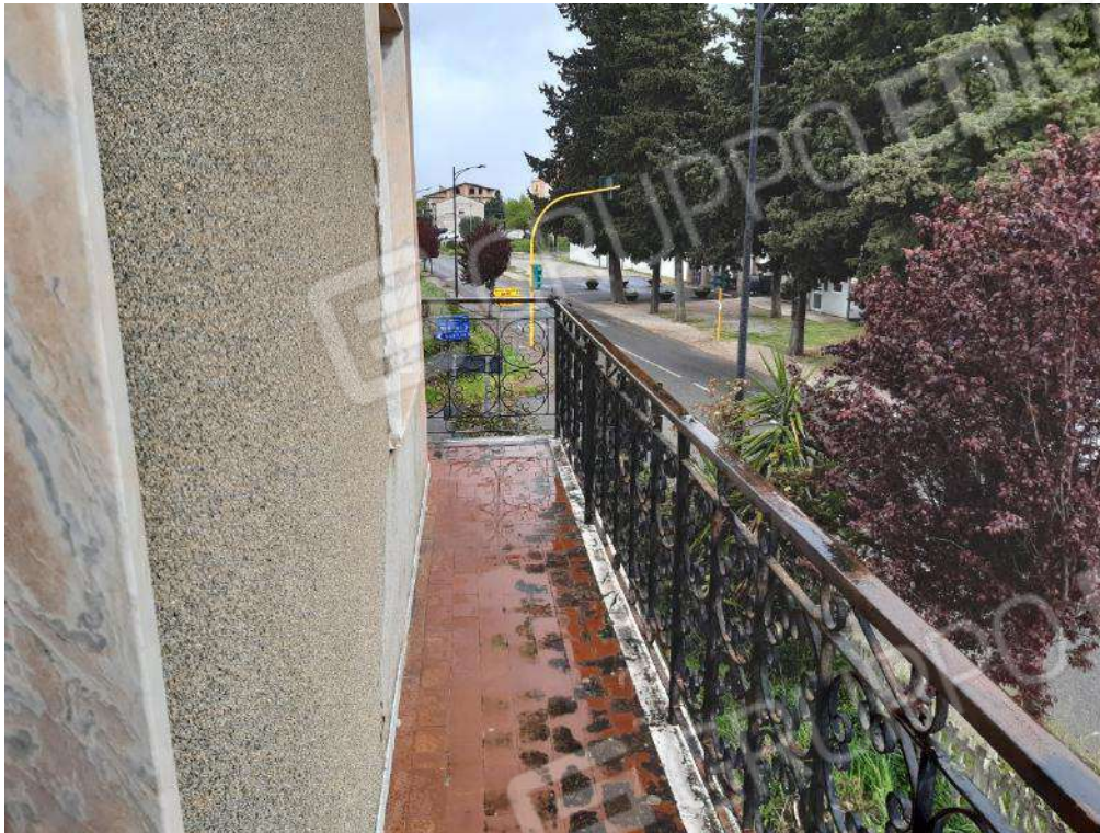
BALCONE LATO SUD