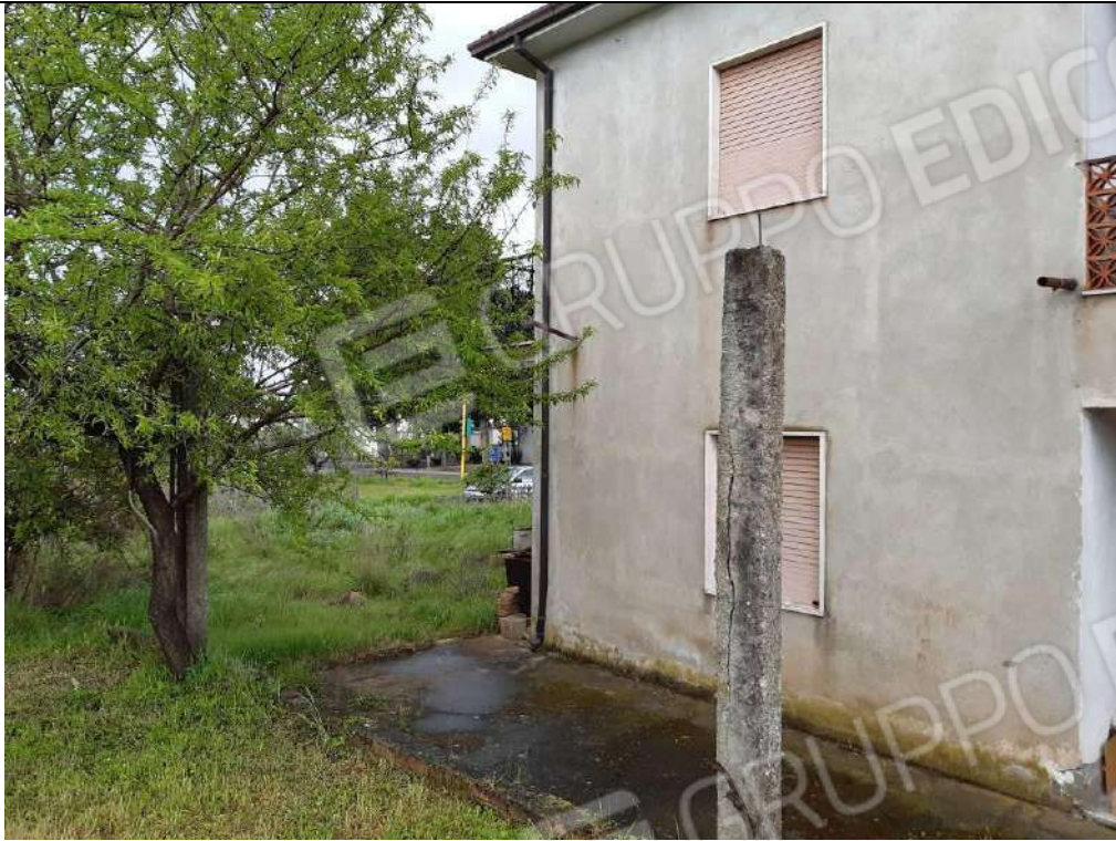
CORTE LATO NORD