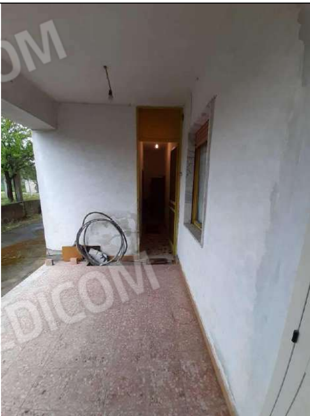
USCITA SU RETRO