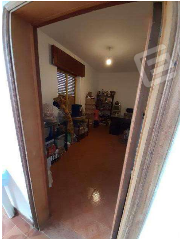
STANZA ACCESSIBILE SOLO DALLA TERRAZZA