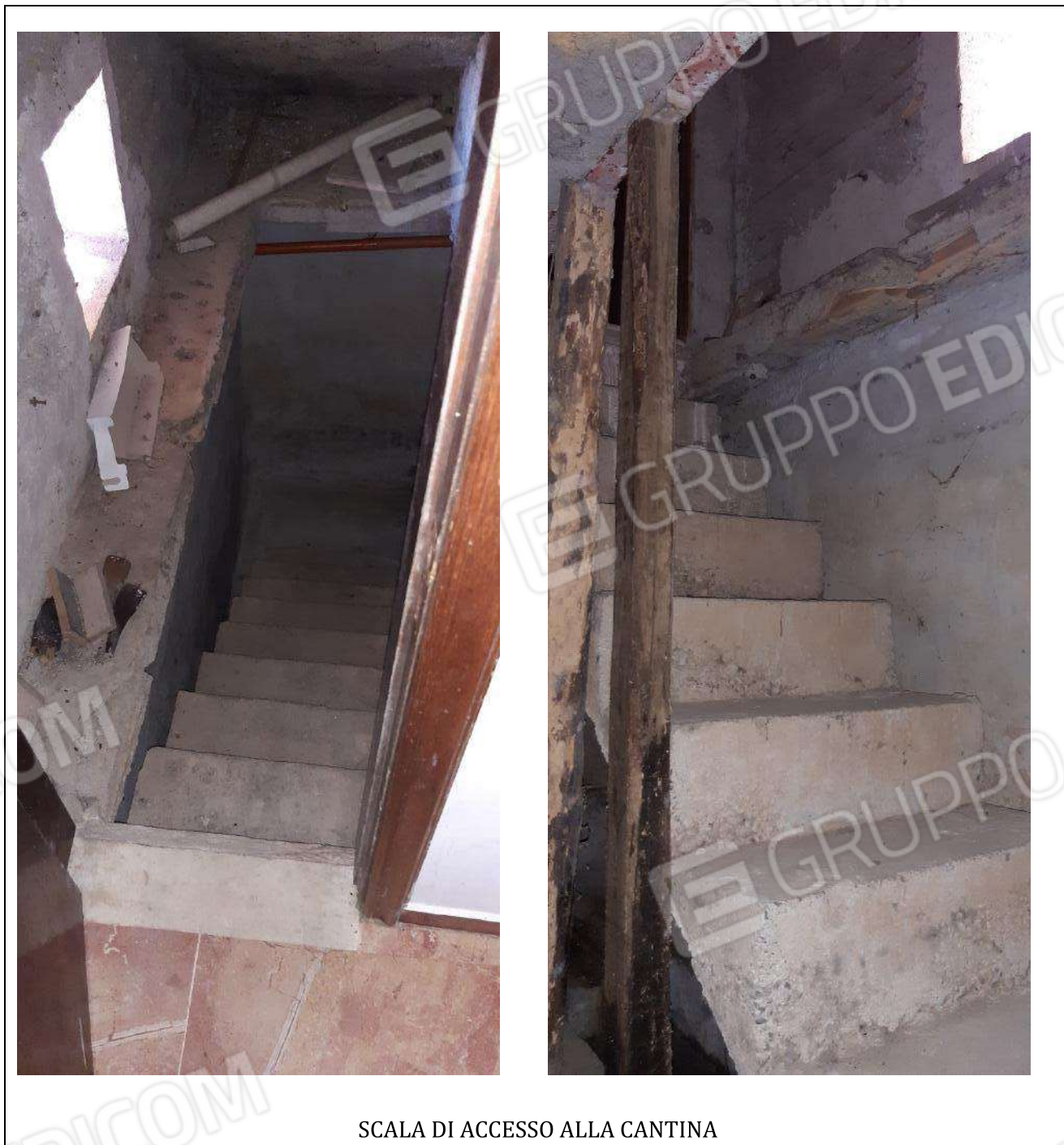
SCALA DI ACCESSO ALLA CANTINA