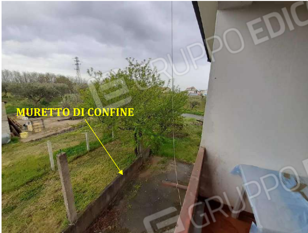
MURO SUL RETRO DI CONFINE CON IL SUB 7