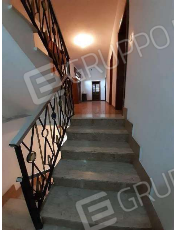
SCALA PER ACCESSO AL PIANO PRIMO