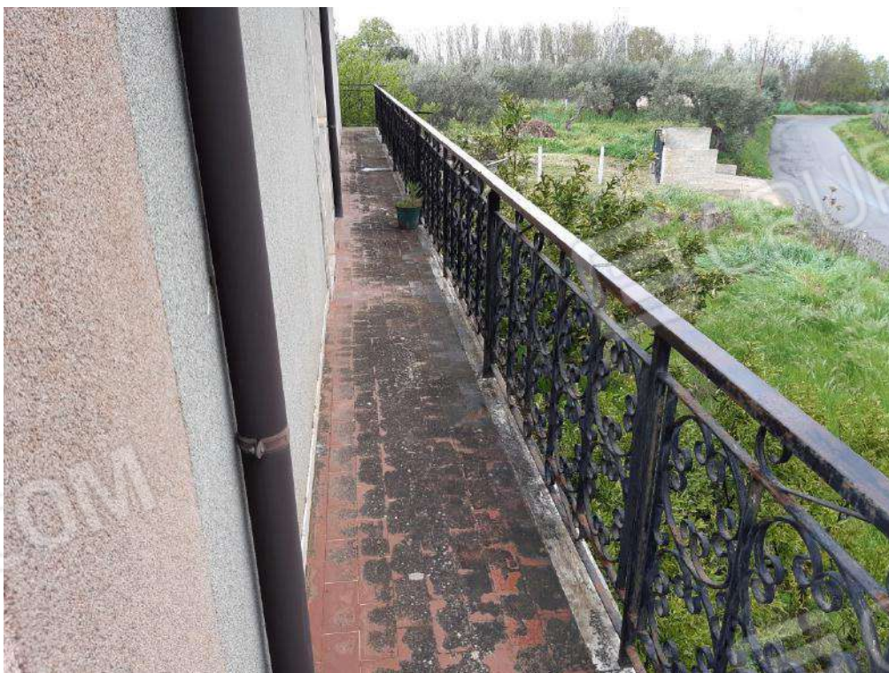
BALCONE LATO EST