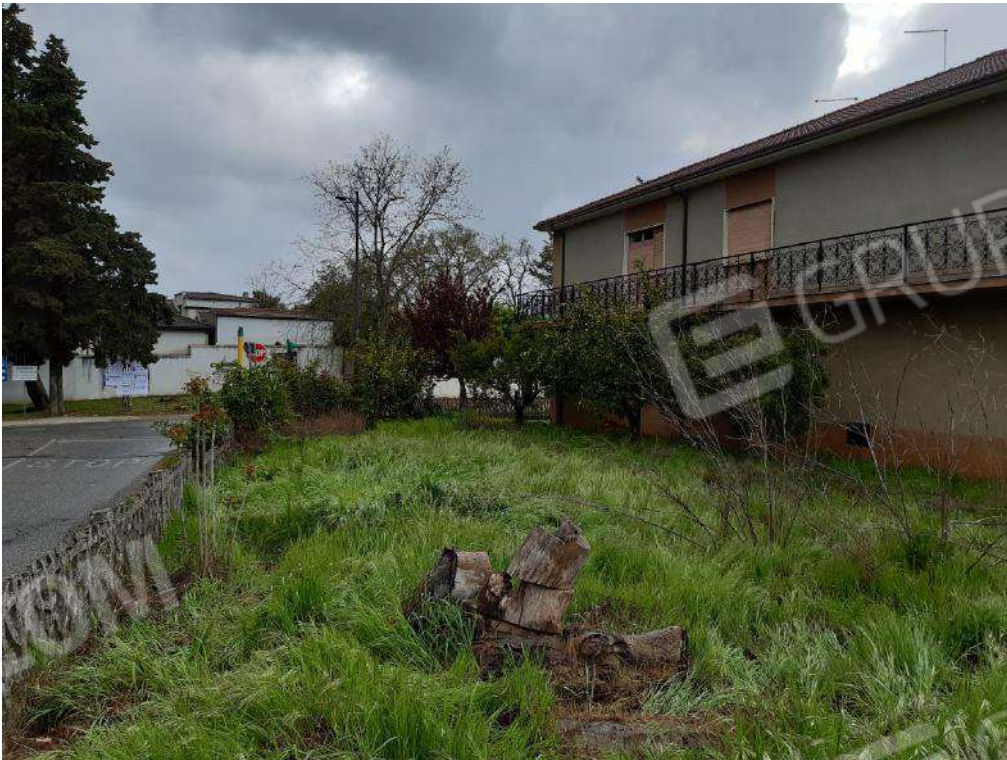
CORTE LATO EST