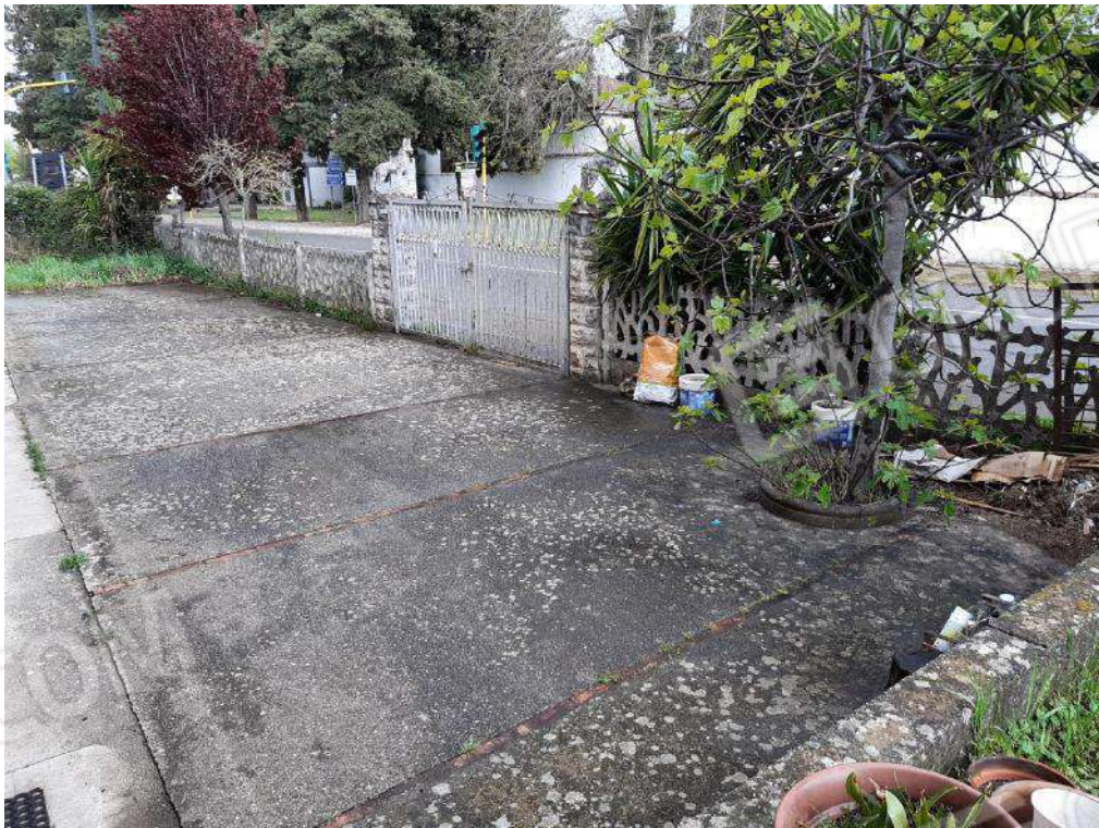
ACCESSO CARRABILE IN COMUNE