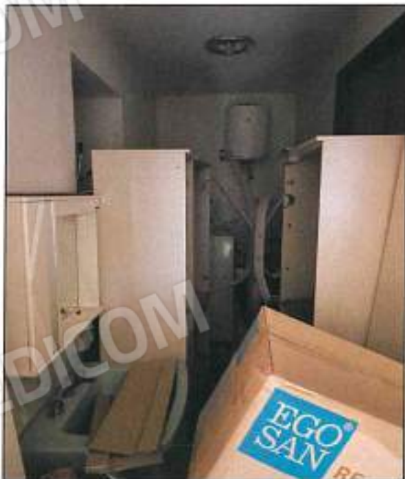
Foto n° 18 – Vista interna sala / cucina presente nella u.l. sub 7,

Foto n° 17 – Vista interna wc presente nella u.l. sub 7,