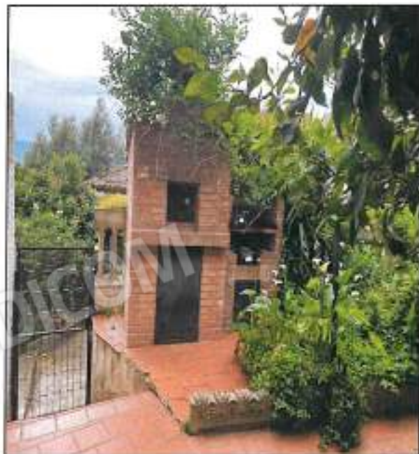
Foto n° 13 – Vista interno cortile, lato del patio porticato su il lato lungo del cortile, sono presenti tracce di umidità.

Foto n° 12 – Vista cortile, in primo piano il forno e barbecue, in mattoni di laterizi, posizionati di fianco ingresso u.s.