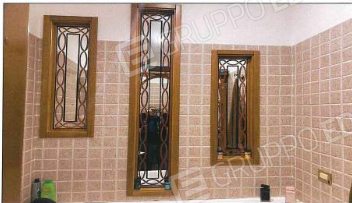
Foto n° 15 – Vista interna sala presente nella u.l. sub 6, sono visibili e presenti ottime rifiniture, in quanto l'u.l. ha avuto lavori di ristrutturazione.

Foto n° 14 – Vista interna locale wc presente nella u.l. sub 6, sono visibili e presenti ottime rifiniture, in quanto l'u.l. ha avuto lavori di ristrutturazione.