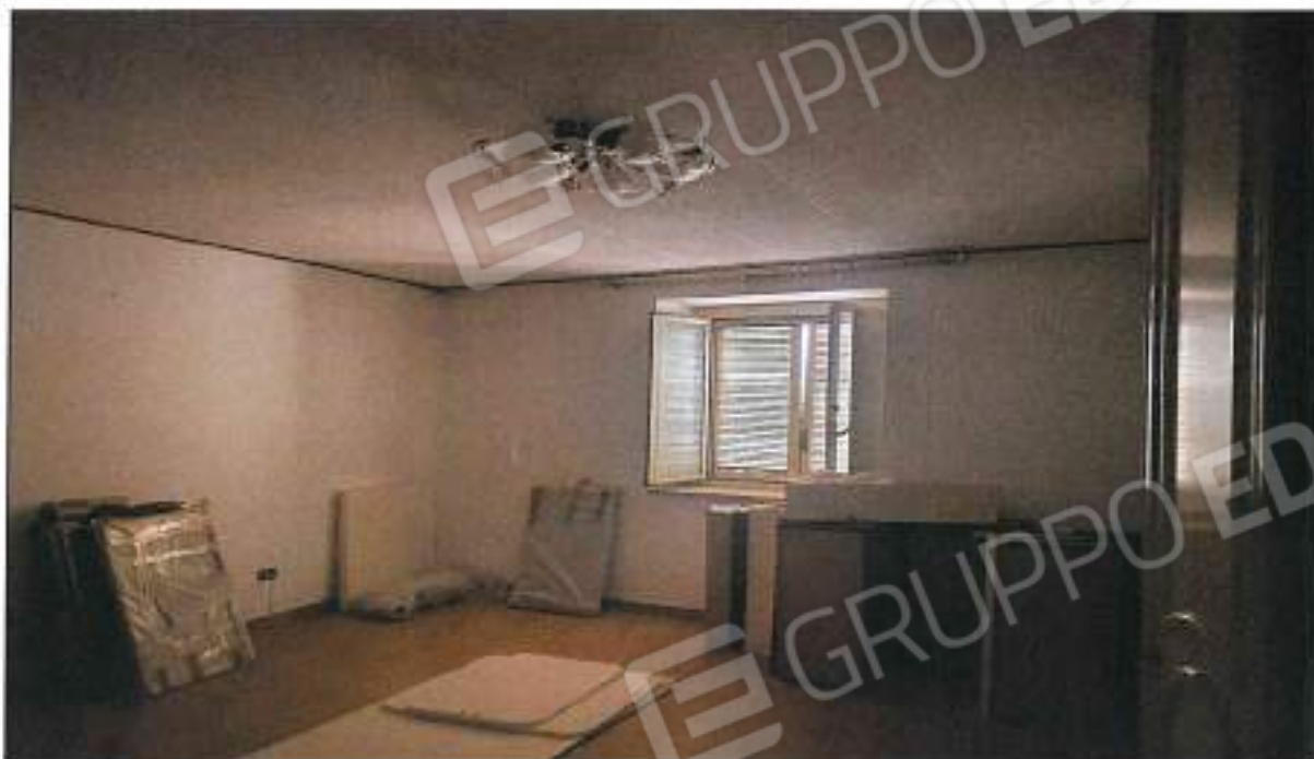
Foto n° 27 – Vista interna sala oltre cucina presente nella u.i. sub 9. sono visibili e presenti ottime rifiniture, in quanto l'u.i. ha avuto lavori di ristrutturazione.

Foto n° 26 – Vista interna locale sala presente nella u.i. sub 9. sono visibili e presenti ottime rifiniture, in quanto l'u.i. ha avuto lavori di ristrutturazione.