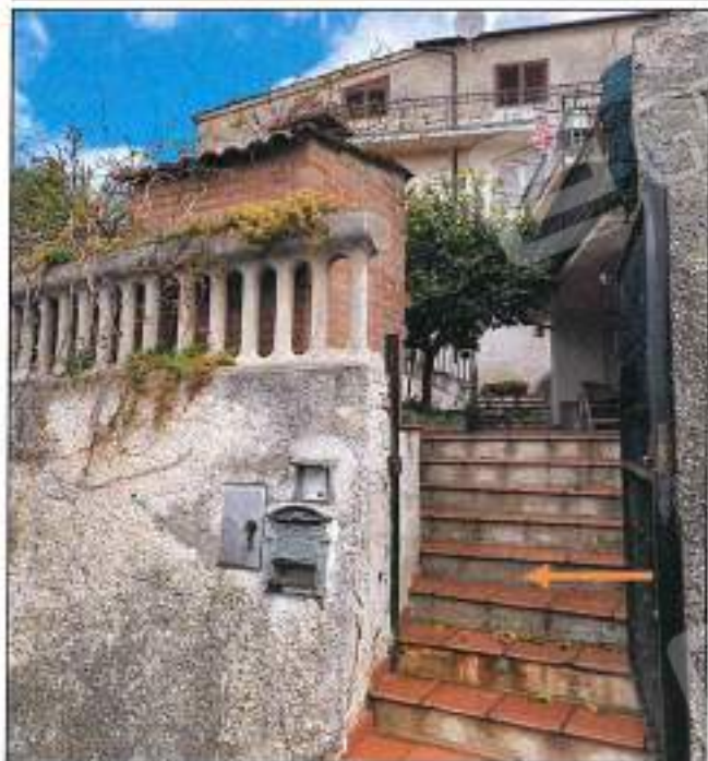
Foto n° 3 – Vista ingresso del fabbricato sub 6- Col la freccia è indicato ingresso della u.i. posta nel vicolo San Vito.