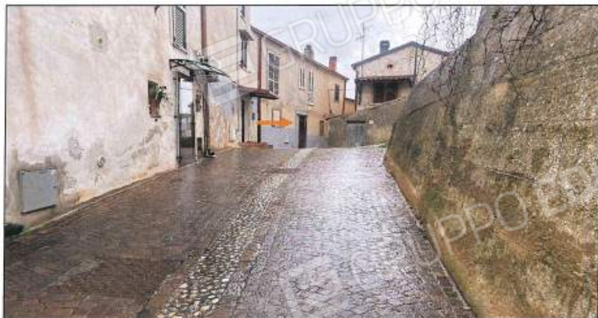
Foto n° 7 – Vista particolare ingresso su via Piave, 23, accesso esclusivo del sub 7-9.

Foto n° 6 – Vista della via Piave, dalla quale si accede al sub 7 e 9, è visibile indicato dalla freccia in portone di ingresso.