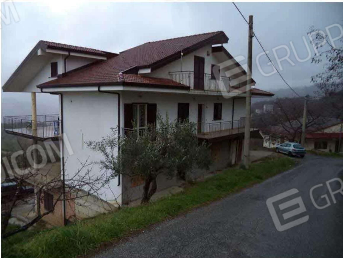
Fabbricato in oggetto e prospetto 1 e 4