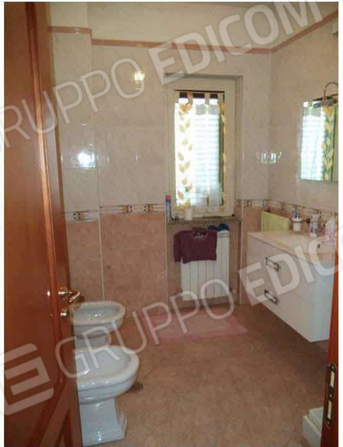
Bagno zona giorno