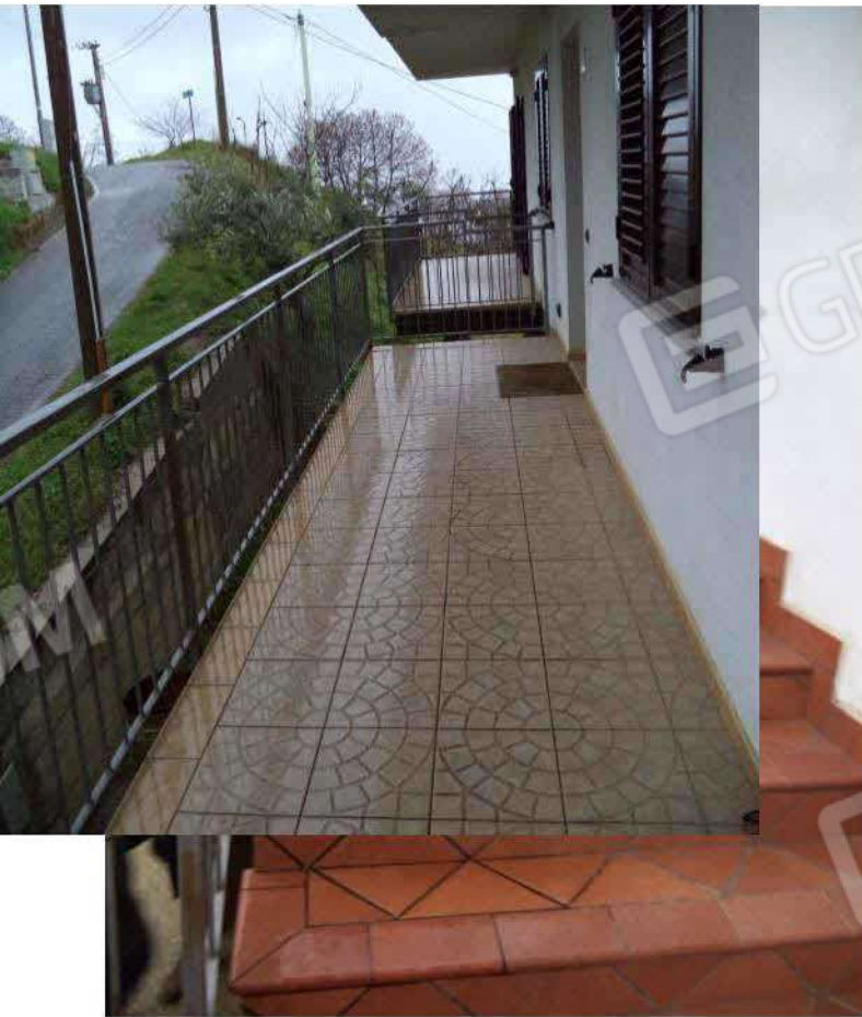
Rampa di scale per accesso al piano primo e pianerottolo d'ingresso all'abitazione