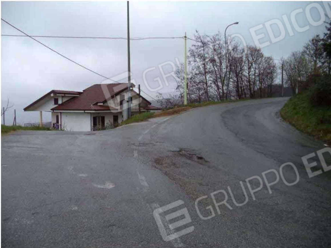
Strada provinciale per Redipiano-Sila e stradina comunale di accesso al fabbricato