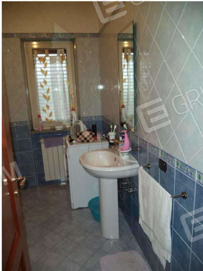
Bagno zona notte