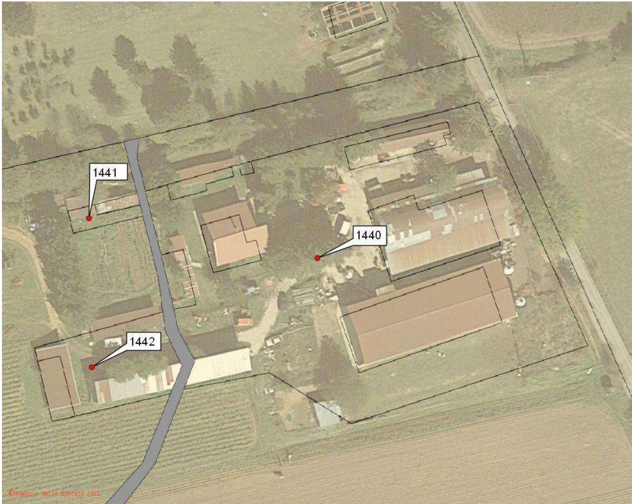
Figura 3: Sovrapposizione cartografia catastale attuale e immagine Google Satellite - fabbricati rurali.