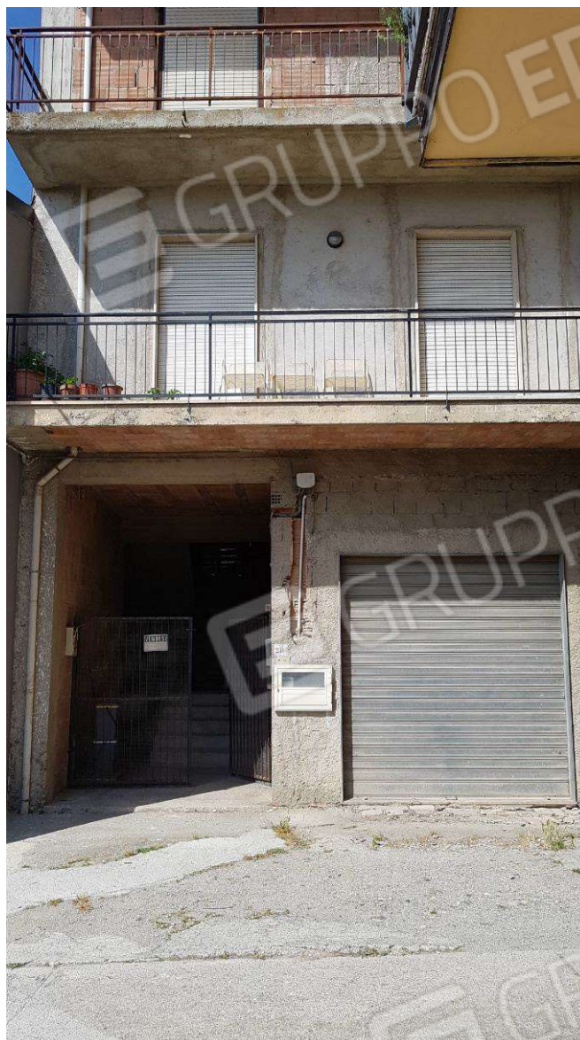
Foto N.2: Ingresso esterno del fabbricato dove ricade l'immobile oggetto di stima.