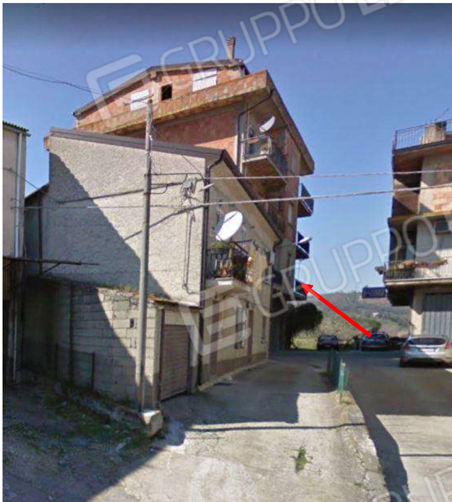
Foto N.1: Fabbricato dove ricadono gli immobili oggetto di stima.