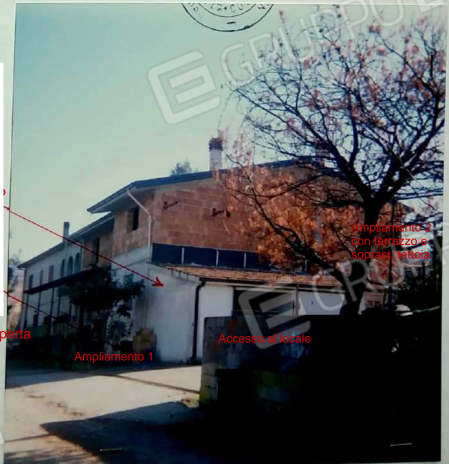
Foto n. 1 - Piano Terra, lato Est

Ampliamento 2 con terrazzo e soprast. tettoia