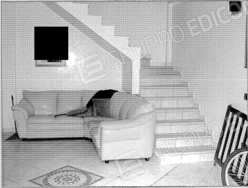
- Foto 9 (Vista su scala di collegamento tra il Piano Interrato 1 e il Piano Terra) -