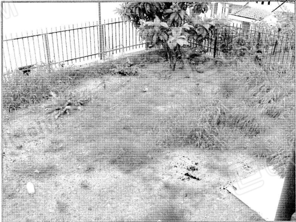
- Foto 2 (Corte esclusiva adibita a giardino – Part. 738 sub. 15) -