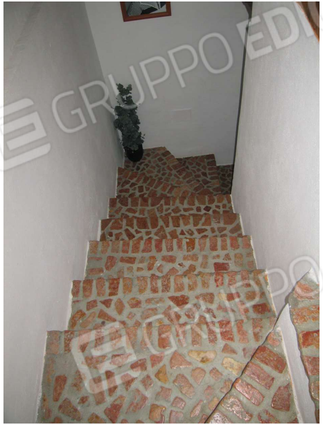
Foto n° 9 e 10 - Scala di collegamento fra piano terra e piano primo

Firmato Da: CERAVOLO ALESSANDRO Emesso Da: ARUBAPEC S.P.A. NG CA 3 Serial#: 44d03f95be766c71490e0610fe005297