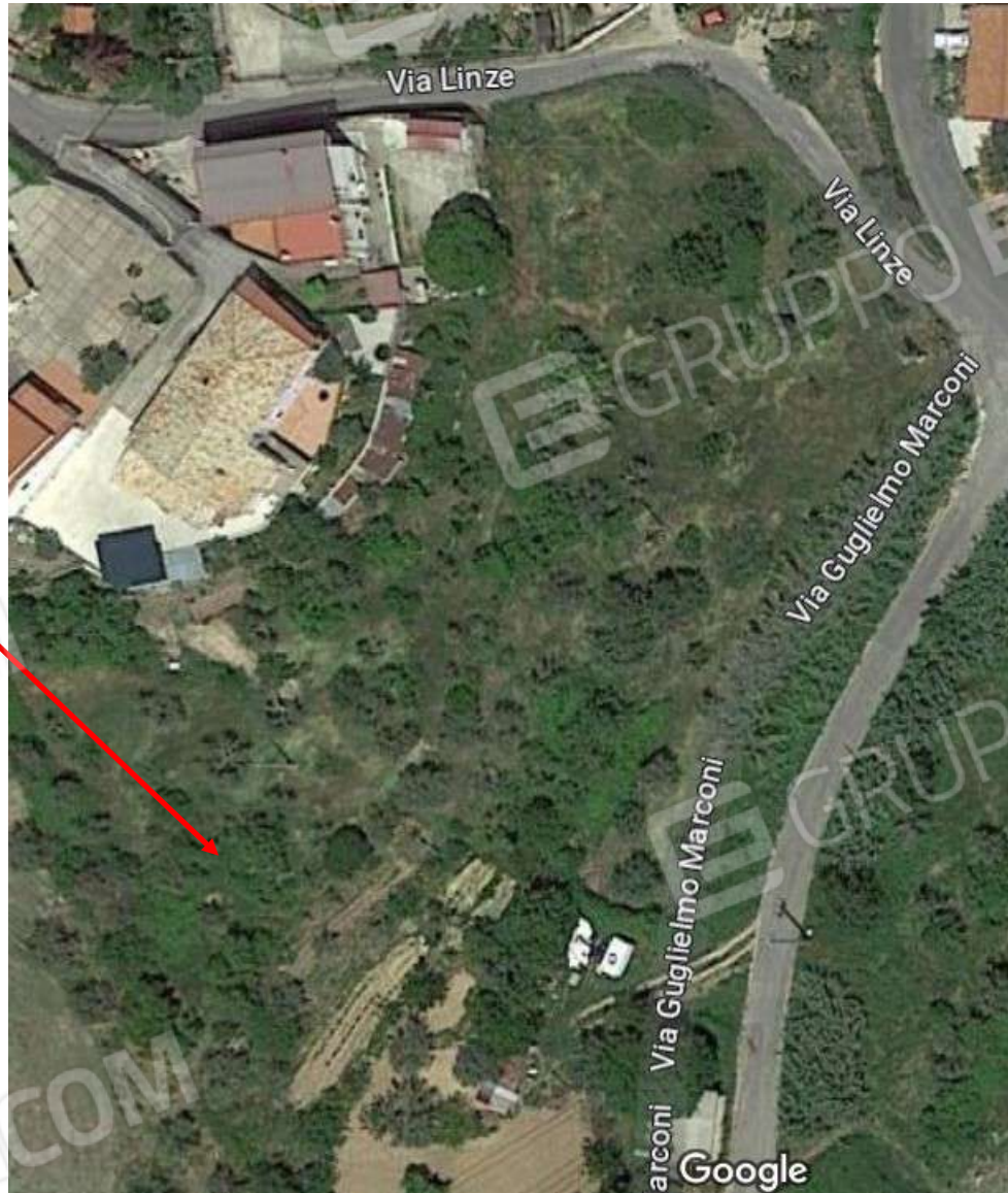
Foto n. 35: Vista dall'alto dell'immobile 3 pignorato