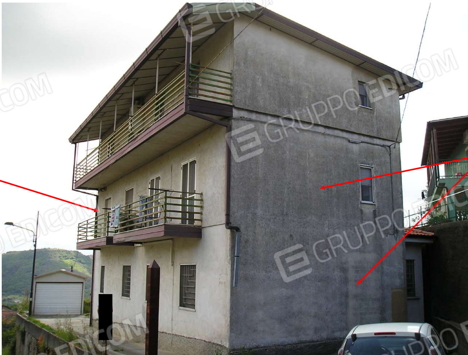
Foto n. 3: Fabbricato di cui fanno parte gli immobili 1 e 2 pignorati