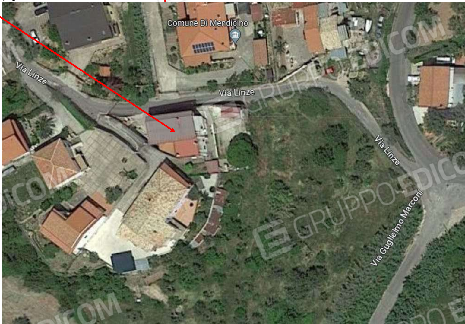
Foto n. 1: Vista dall'alto del fabbricato di cui fanno parte gli immobili 1 e 2

Fabbricato di cui fanno parte gli immobili 1 e 2 pignorati