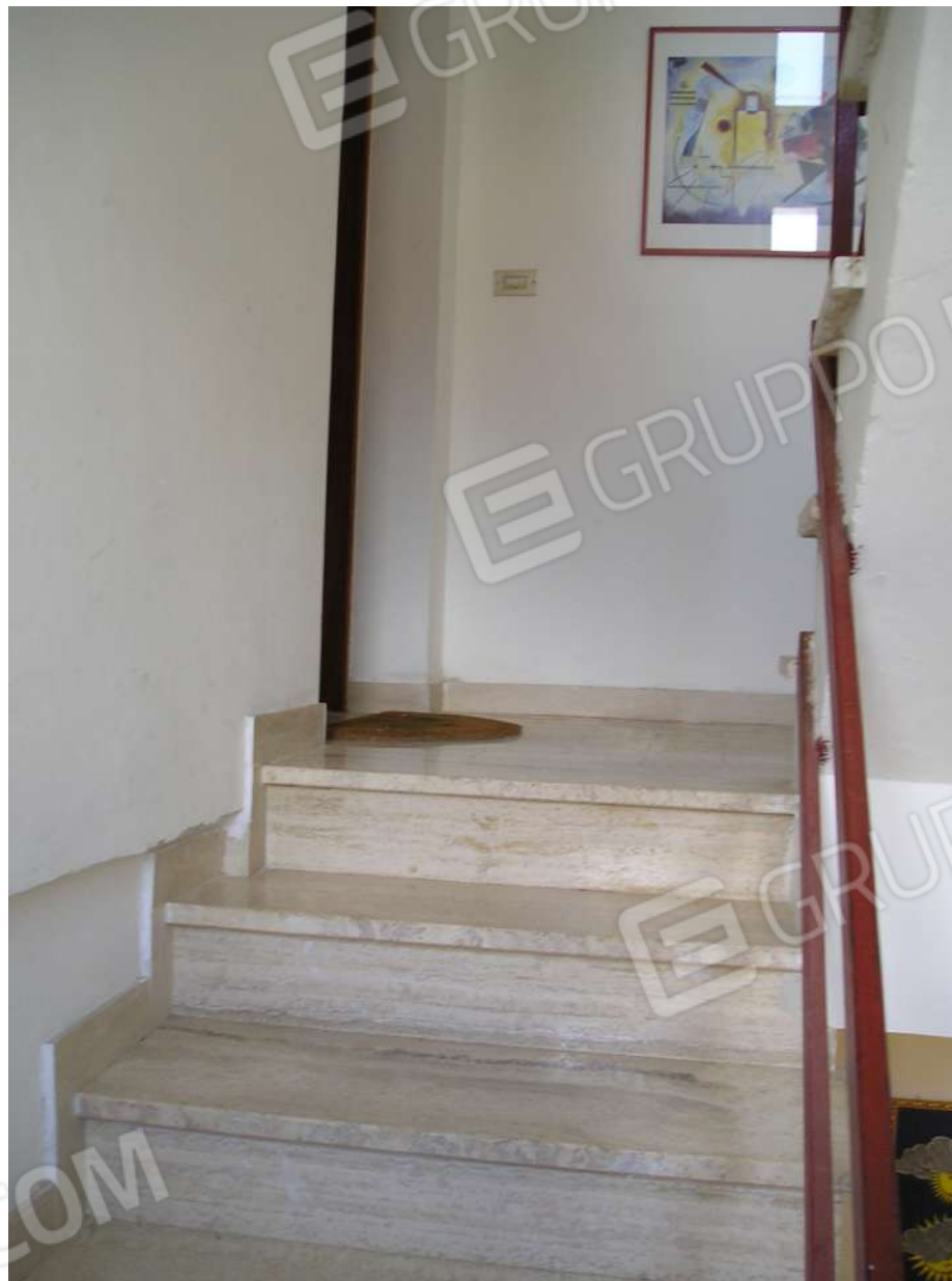
Foto n. 11: Scala interna di collegamento dei piani del fabbricato