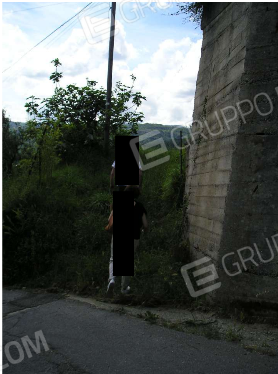
Foto n. 36: Accesso (con varco da via Linze) che conduce all'immobile