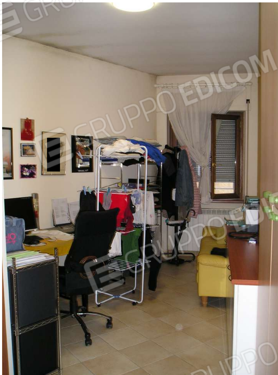
Foto n. 15: Vano adibito a studio con presenza di muffe completamente abusivo