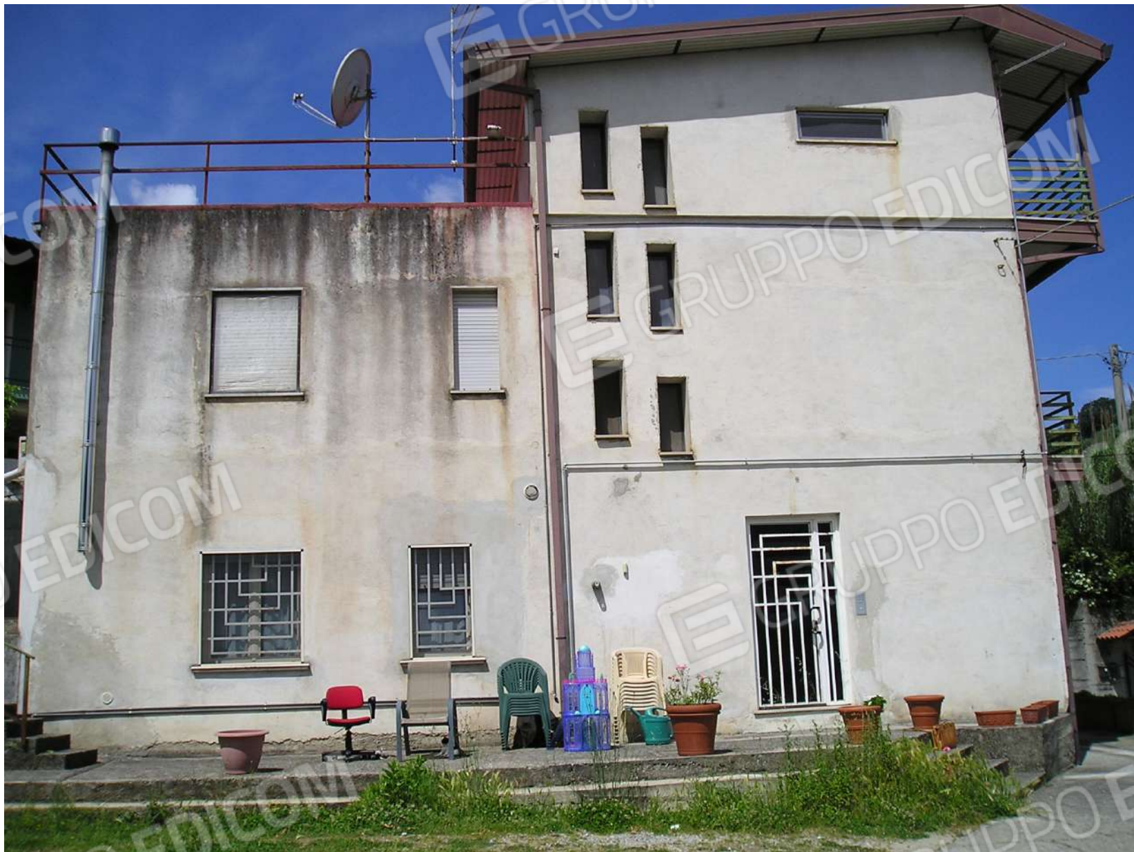
Foto n. 5: Fabbricato di cui fanno parte gli immobili 1 e 2 pignorati