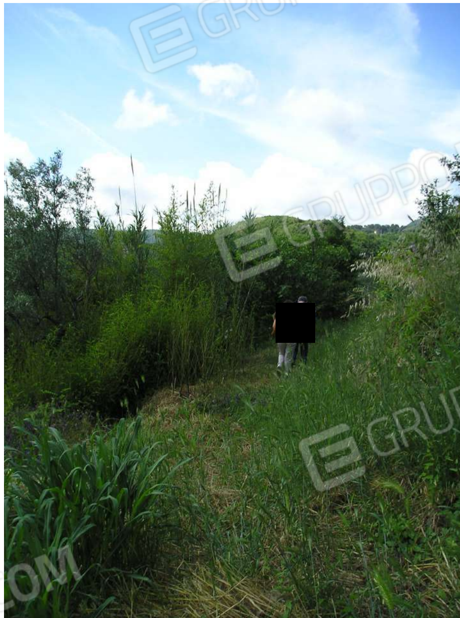
Foto n. 37: Accesso (con varco da via Linze) che conduce all'immobile