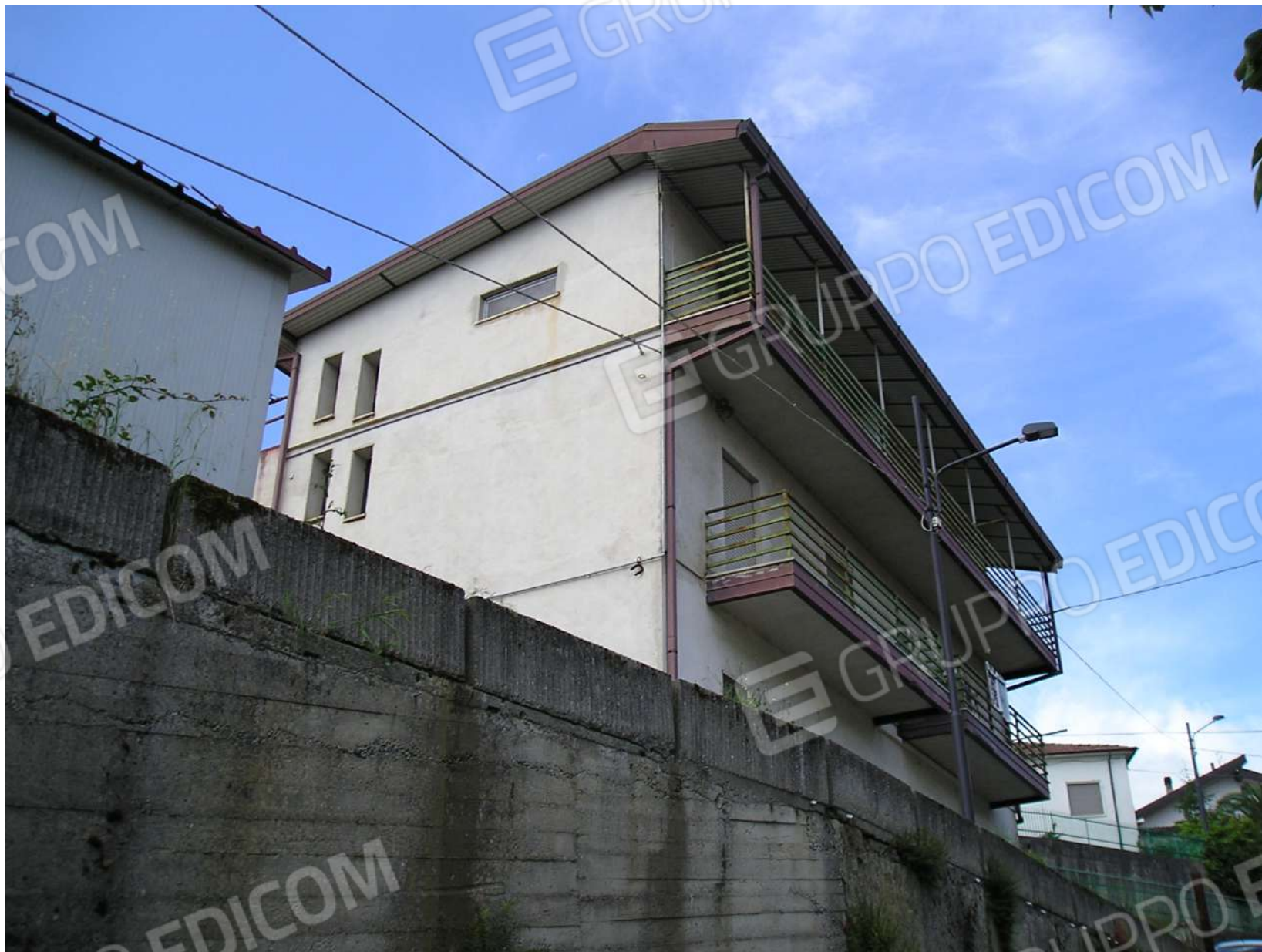
Foto n. 4: Fabbricato di cui fanno parte gli immobili 1 e 2 pignorati

Firmato Da: TUCCI TIZIANA Emesso Da: ARUBAPEC S.P.A. NG CA 3 Serial#: 7c3d954feeaa68484505ffe702de3fa0