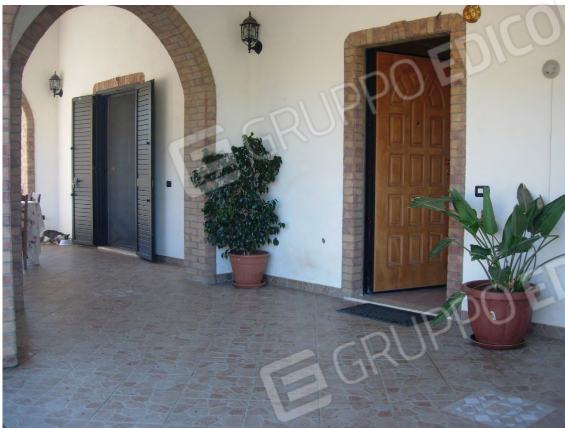
Foto 5: il gradevole patio d'ingresso, si notano due aperture, quella di destra è l'accesso vero e proprio all'abitazione, mentre a sinistra una porta-finestra d'accesso alla cucina.