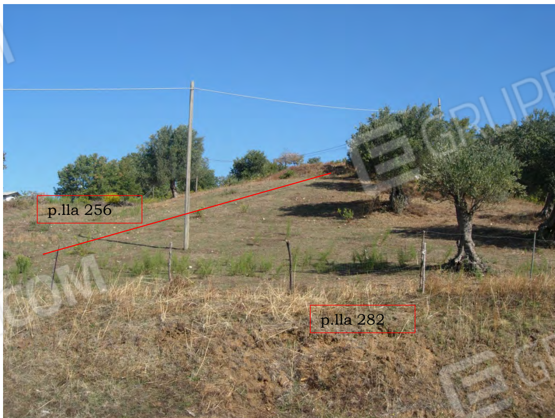
Foto 22: il terreno identificato dalla p.la 282 e più sopra dalla p.la 256, questa porzione di terreno ha pendenze non particolarmente elevate. Dagli escrementi presenti quasi dappertutto si nota come l'esecutato utilizzi l'intero podere come pascolo per i maiali allevati nei ricoveri ubicati sulla p.la 108 (si vedano foto 26-27).