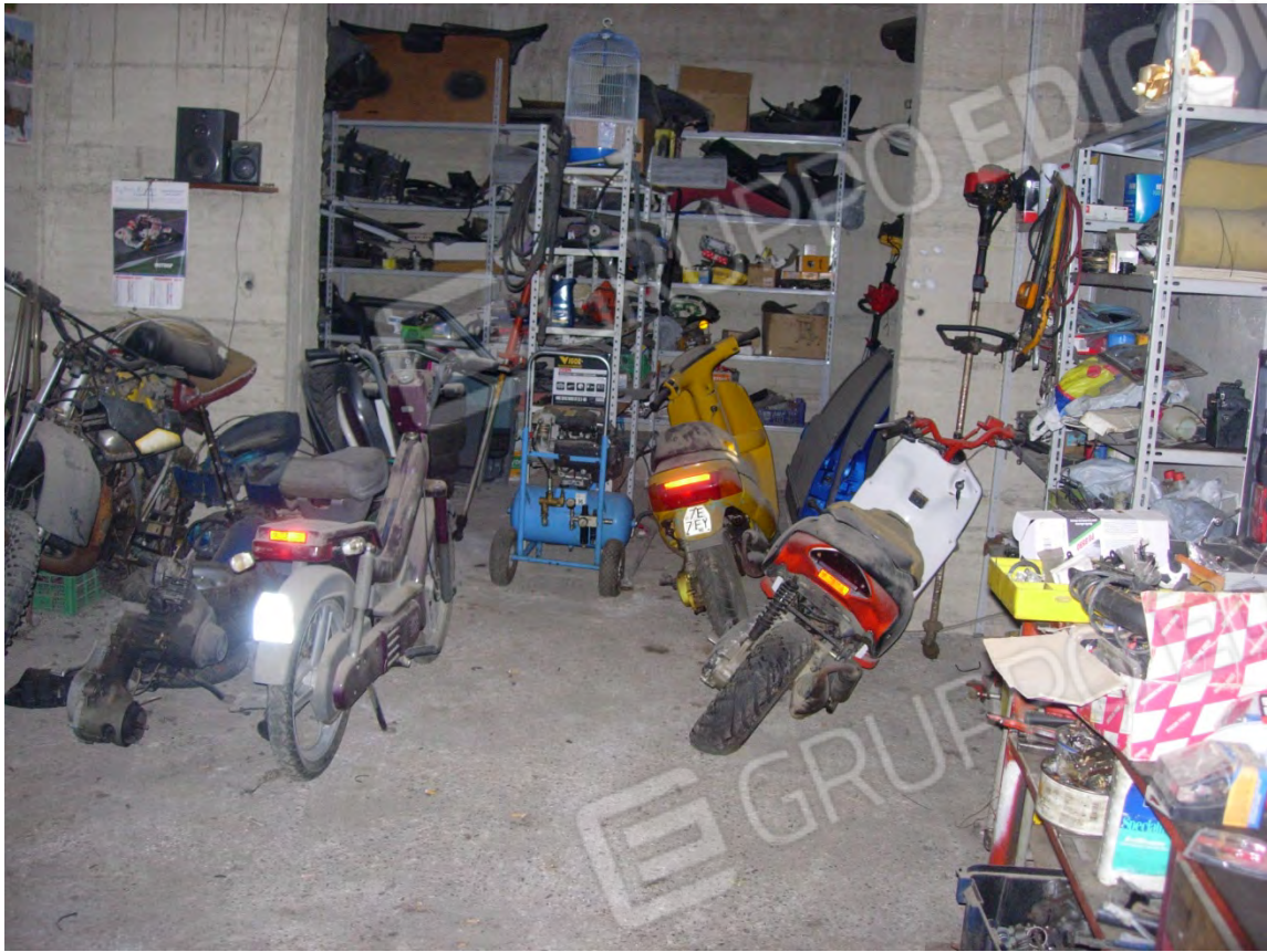
Foto 15: un altro locale al piano seminterrato, utilizzato come laboratorio di meccanica.