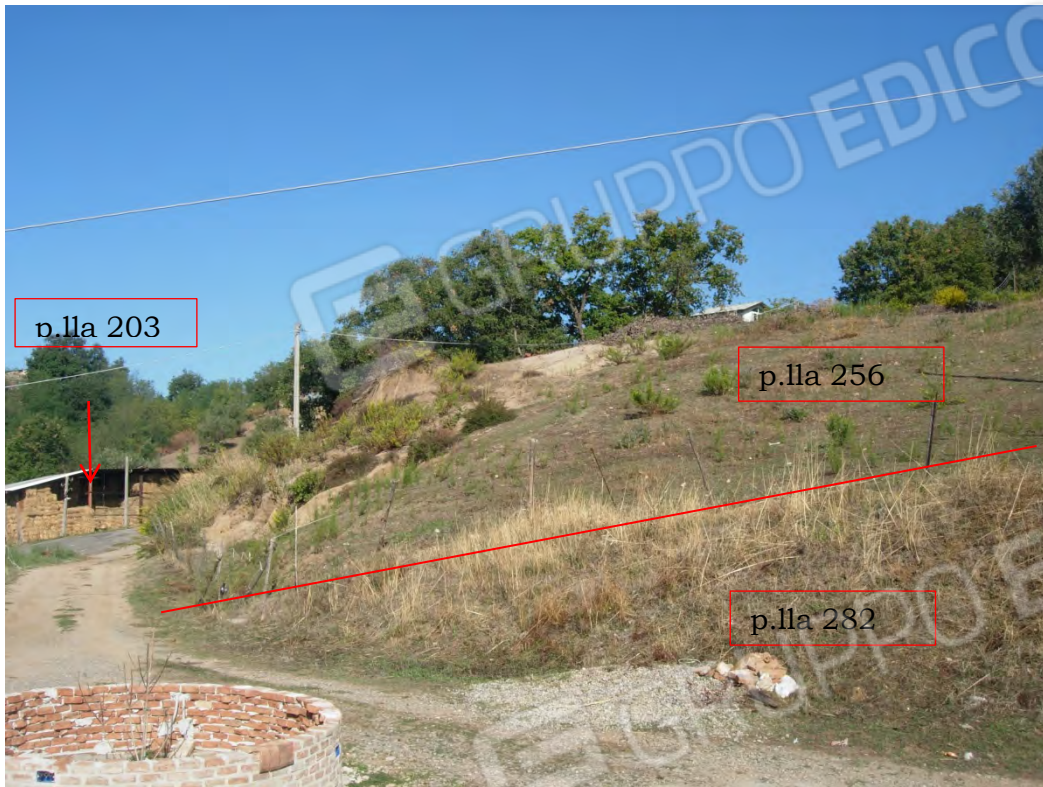
Foto 21: si nota l'ingresso all'intera proprietà dell'esecutato. La p.la 203 al di là della strada interpodereale, a memoria della famiglia, non è mai stata di loro proprietà.