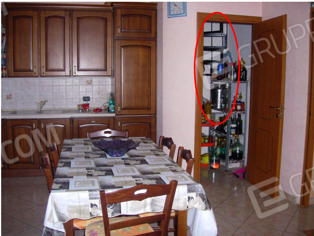
Foto 8: ancora la cucina, a destra si intravede la stretta scala a chiocciola che permette di accedere al piano superiore.