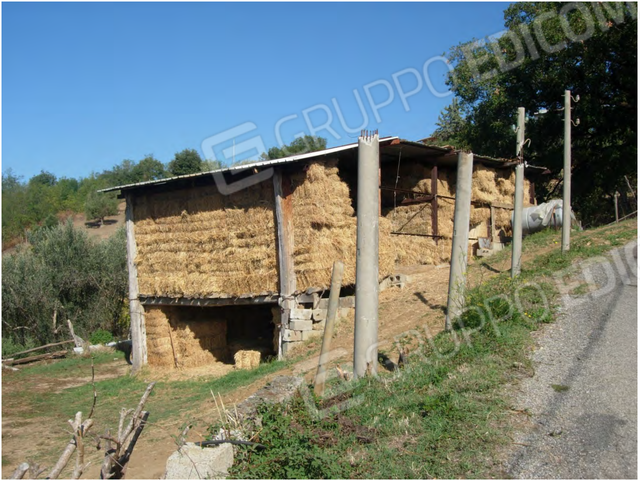
Foto 31: la p.lla 203, che anche se risulta, da tutta la documentazione, di proprietà dell'esecutato, a memoria della loro famiglia, non è mai stata in loro possesso. Anche il CTU ha potuto notare che all'interno del terreno erano presenti altre persone, estranee alla famiglia dell'esecutato. Si noti a destra della foto la strada interpoderale presente sulle mappe catastali.