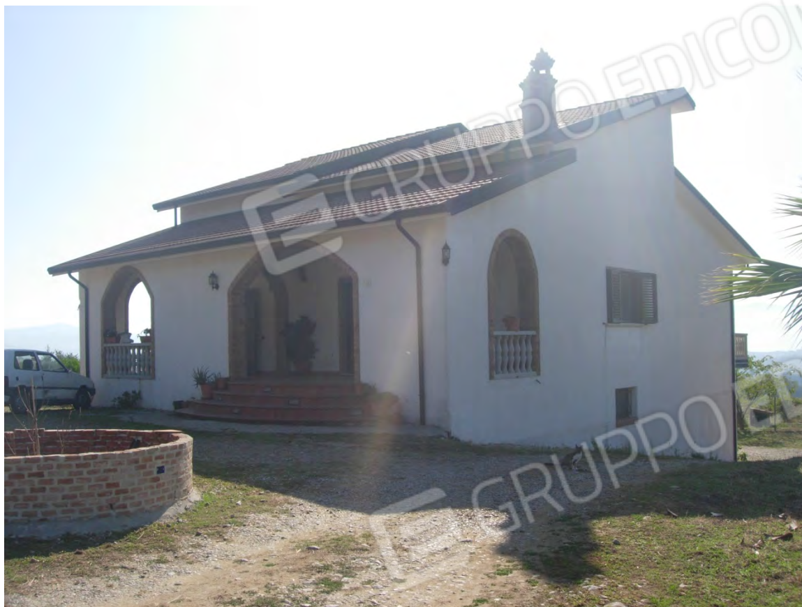
Foto 1: l'accesso al fabbricato oggetto di stima, si notano i tre livelli. Al piano terra, con l'entrata, si estende l'abitazione, al piano inferiore dei magazzini, mentre al livello superiore, sottotetto, sono presenti dei locali allo stato rustico.