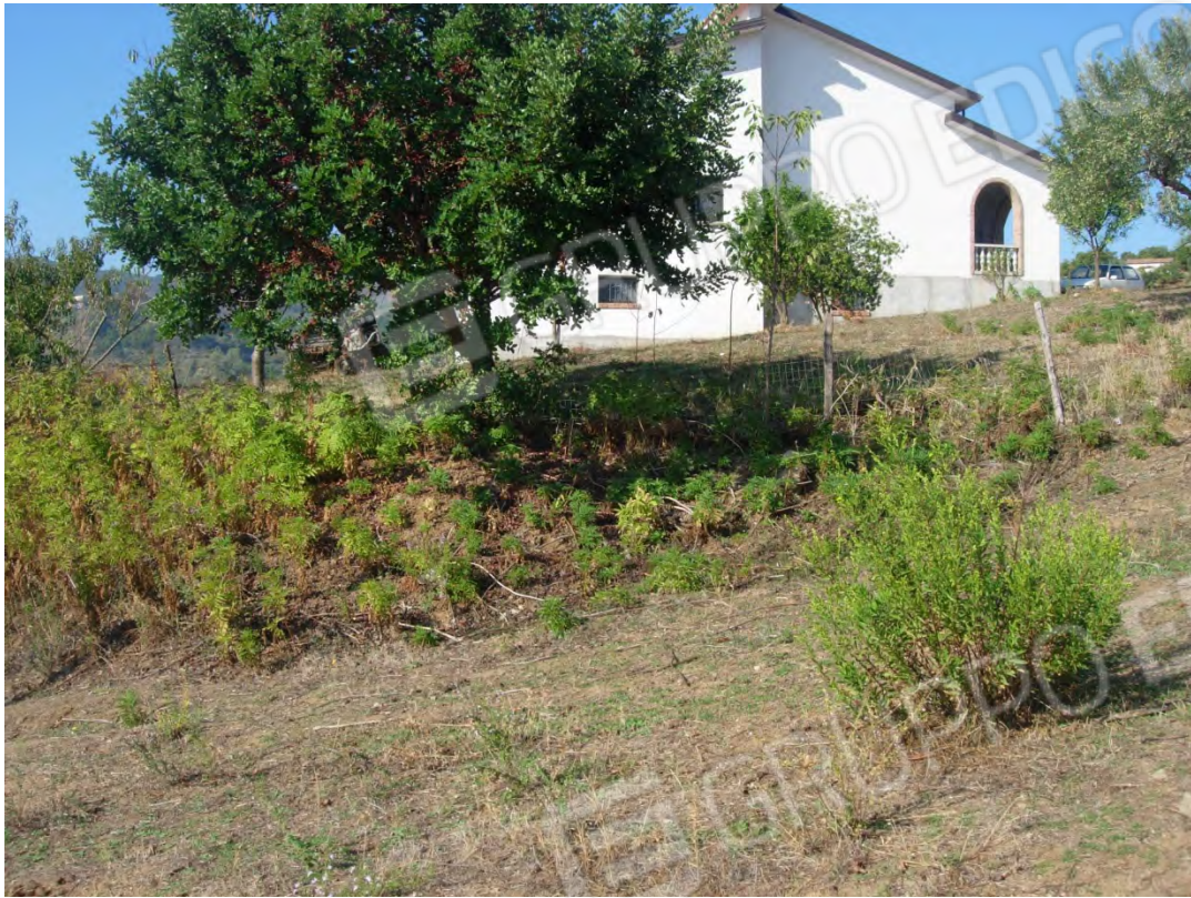
Foto 25: la p.lla 17, si nota sullo sfondo il prospetto orientale del fabbricato dell'esecutato.