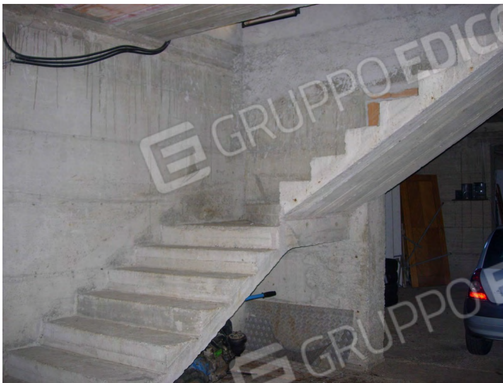
Foto 13: la scala in cemento armato di accesso al piano seminterrato.