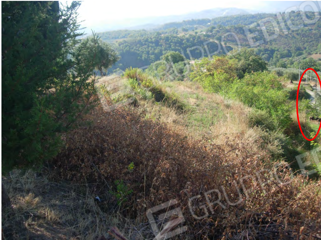
Foto 29: la p.lla 284 fotografata dalla parte superiore, si intravede a destra la strada interpodereale che costeggia il fosso, segnato sulla planimetria catastale che fa confine con la p.lla 262.