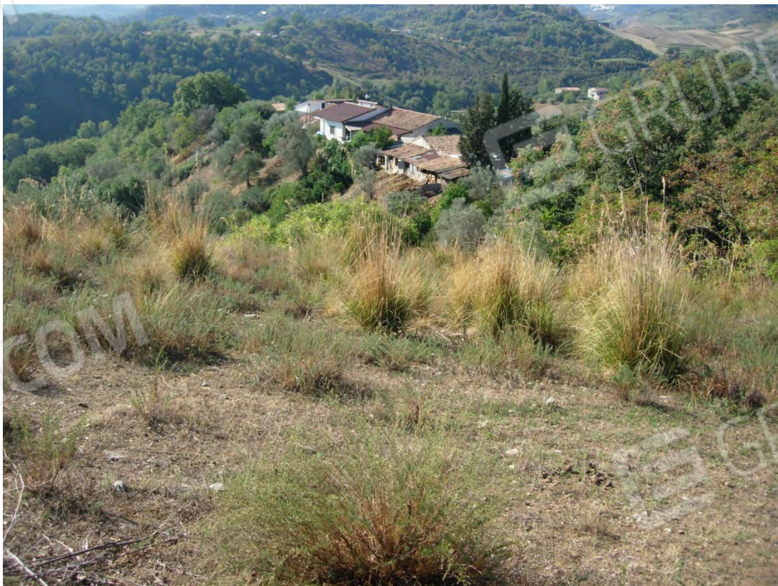
Foto 30: ancora la p.lla 284, fotografata dalla parte superiore, posteriormente al fabbricato, si vedono bene il gruppo di case identificabili con le p.lle catastali 239.