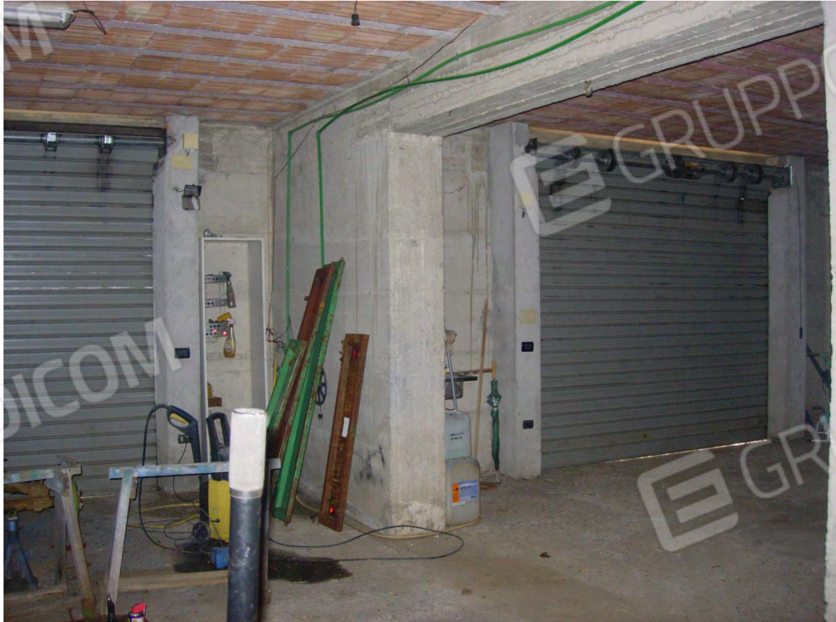
Foto 16: le due ampie saracinesche che costituiscono l'accesso esterno ai locali seminterrati.