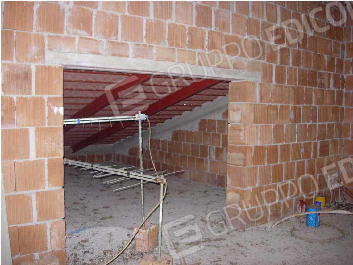
Foto 19: uno dei locali soprastante il prospetto posteriore, si nota l'altezza (all'estremo è di appena 30 cm) che rende l'ambiente parzialmente utilizzabile.