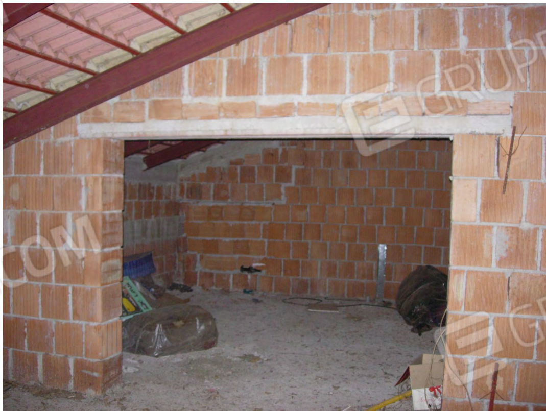
Foto 20: l'altro ambiente con l'altezza maggiore di 1,50, che rende il locale quasi completamente utilizzabile.