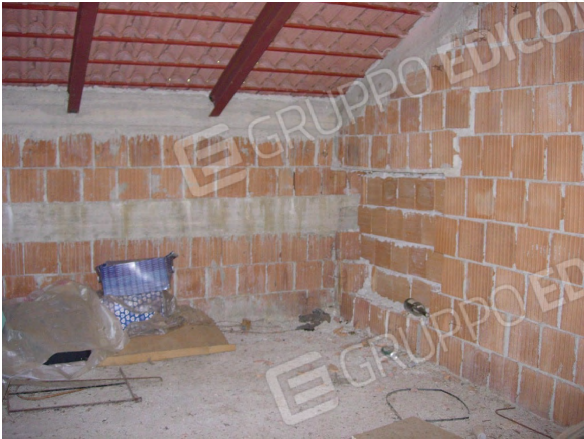
Foto 17: il primo locale nel quale si accede, tramite la scala a chiocciola, al piano superiore, sottotetto, anche questo piano è completamente allo stato rustico. Si noti come il manto di copertura sia sprovvisto del pacchetto di sottotegola (impermeabilizzazione e isolamento).