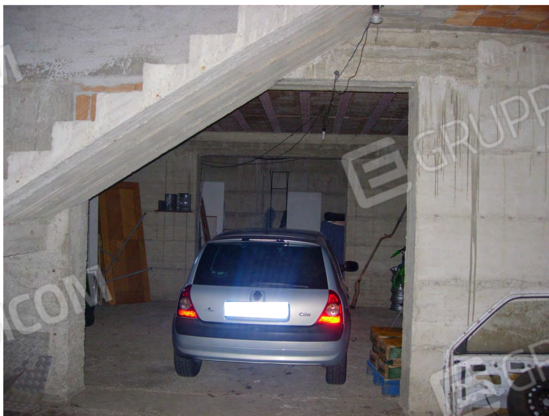
Foto 14: uno degli ampi locali presenti nel piano seminterrato; si nota come tutto il piano è rimasto allo stato rustico, senza nessun finimento (mancano: il pavimento, gli infissi interni, l'intonacatura, i servizi).