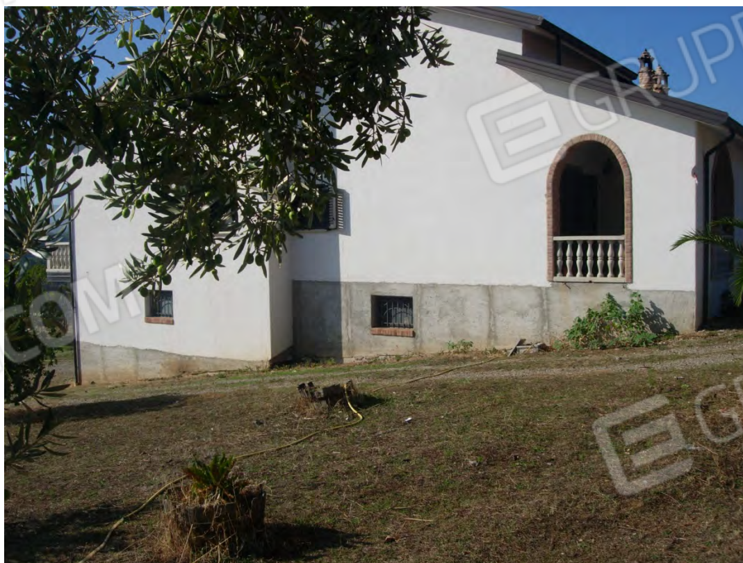
Foto 2: il prospetto est, anche in questo caso si notano i tre livelli.