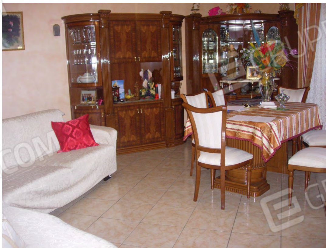
Foto 6: l'ambiente immediatamente successivo all'ingresso, una spaziosa e ben rifinita sala da pranzo.