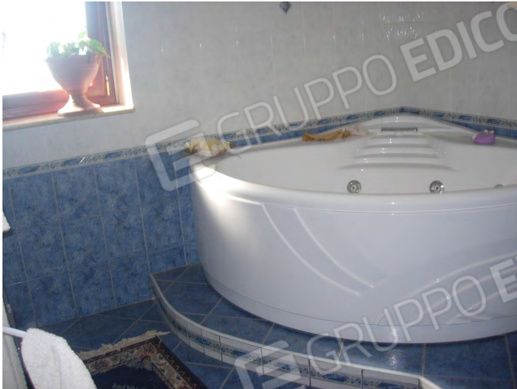
Foto 11: il bagno principale, con il particolare di una vasca idromassaggio.