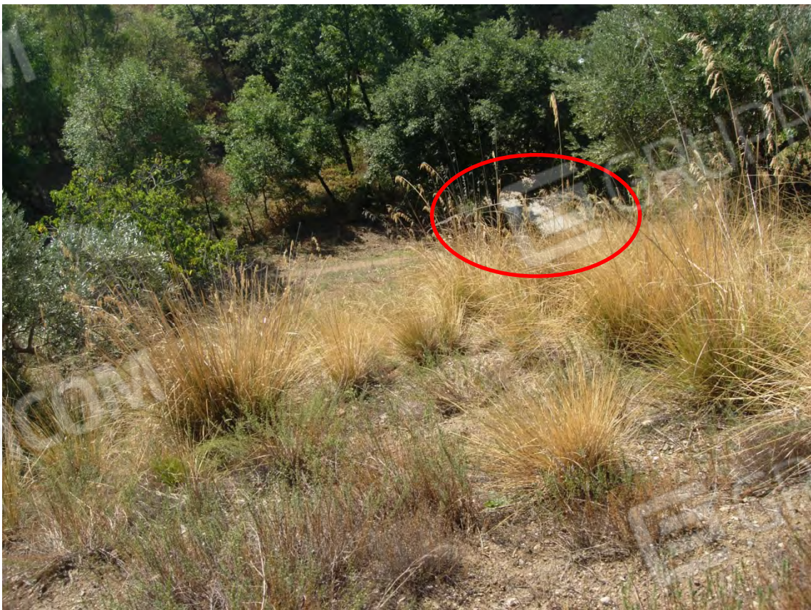
Foto 28: la p.lla 284, si intravede la strada, riportata sul catastale che fa da confine con la p.lla 262. Anche in questo caso sono percepibili le elevate pendenze del terreno.