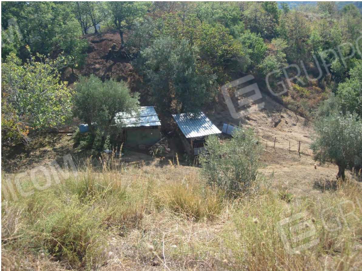
Foto 26: la p.lla 108, sulla quale l'esecutato ha realizzato dei ricoveri per l'allevamento di una decina di maiali.