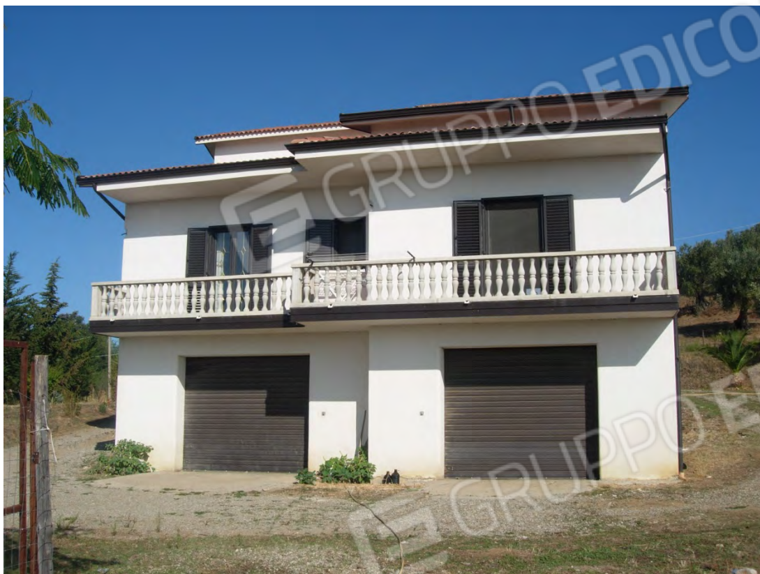
Foto 3: il prospetto esposto a sud, da dove è possibile l'accesso esterno al piano seminterrato.