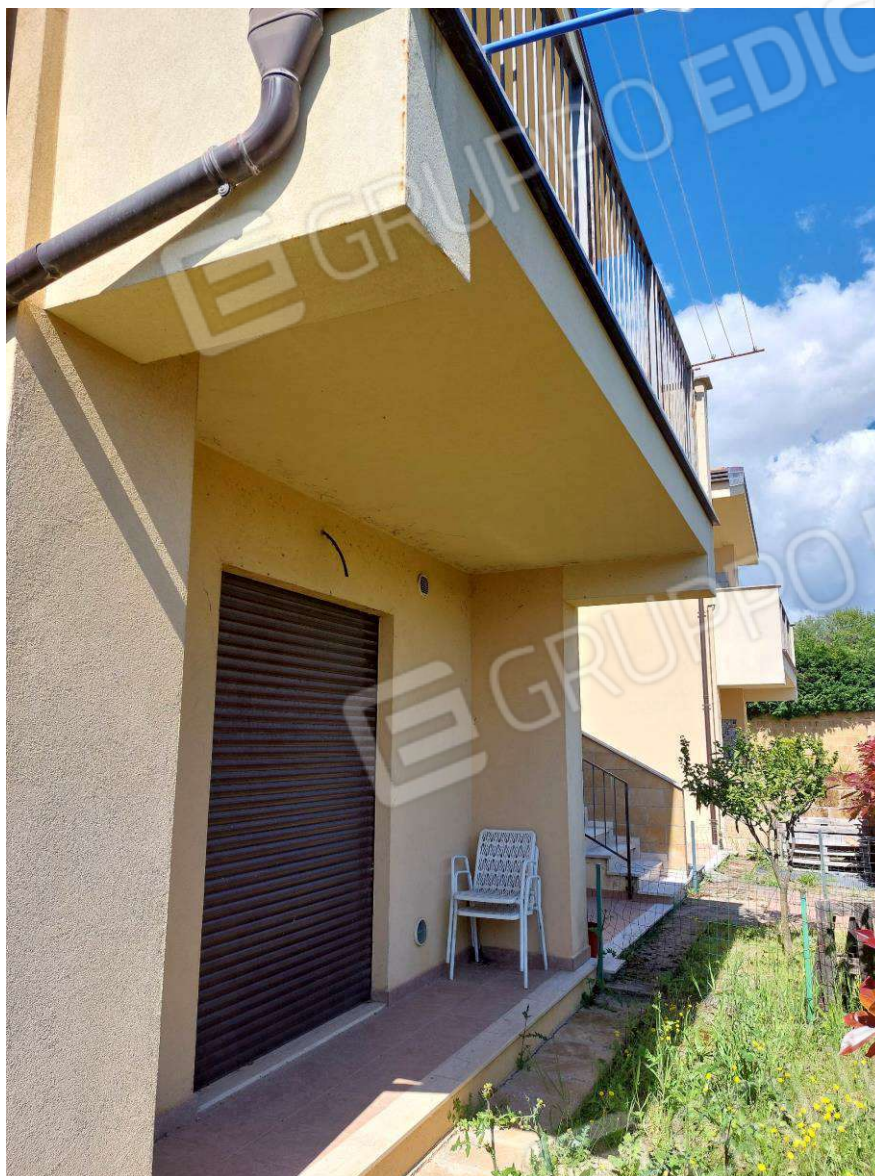
Foto N.1: Sub.1_ Prospetto fabbricato Nord con spazio esterno di pertinenza.