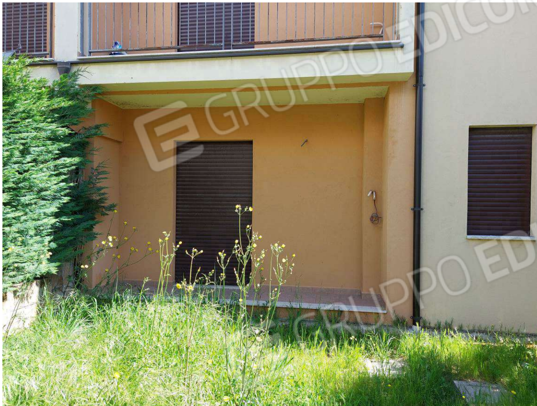
Foto N.2: Sub.1_ Prospetto fabbricato Sud con spazio esterno di pertinenza.