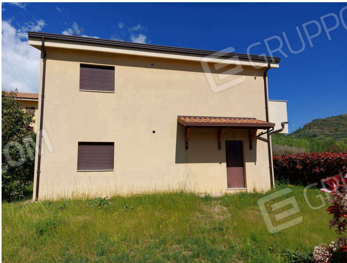
Foto N.3: Sub.1_ Prospetto fabbricato Est con spazio esterno di pertinenza.