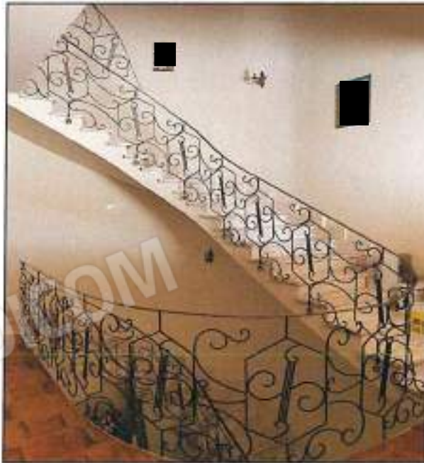
Foto n° 24 – Vista interna ampio pianerottolo di disimpegno scala di piano P.