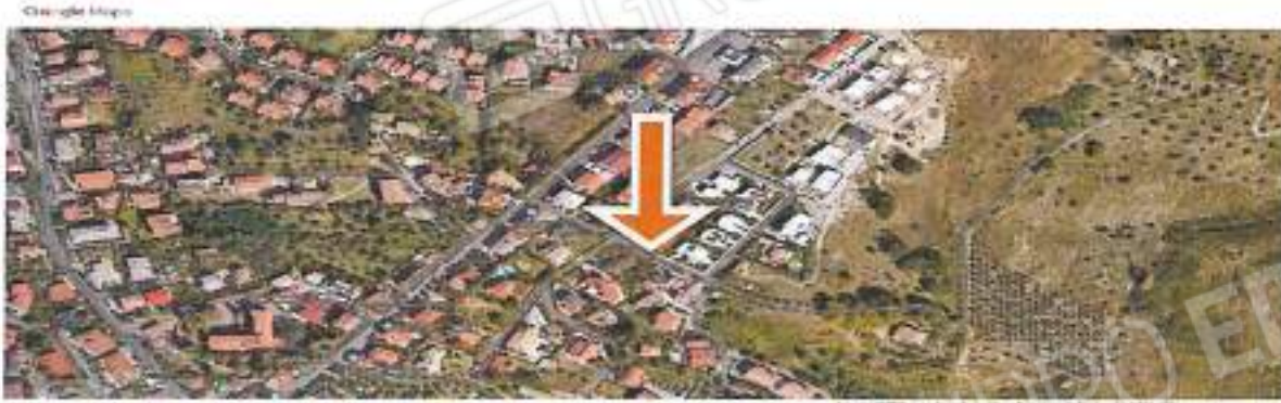
Foto n° 2 – Veduta estropolata da Google Maps- Fabbricato nella sua interezza, di cui è parte integrante la u.l. oggetto di procedura - foglio mappa 7 particelle 164 ,

Foto n° 1 – Vista foto dell'area interessata, è evidenziata con freccia il fabbricato di cui fa parte, località pasquoli – via Folco Ruffo di Calabria, I.