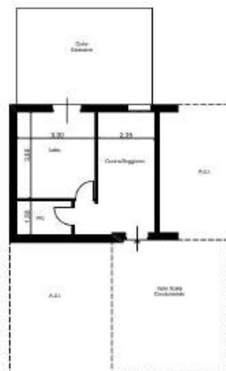
Appartamento - Sub 2

L'appartamento ha una superficie lorda pari a 32 mq, e una superficie balconi pari a circa 3 mq. Le pertinenze dell'appartamento sono una soffitta, collocata al terzo piano, di 18 mq e una corte esterna di 22 mq. Per maggiore chiarezza qui di seguito si riporta la pianta dell'immobile residenziale con la distribuzione degli ambienti.