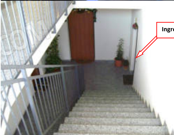
Foto n°5 - 6: Vano scala (Piano 2°) del corpo di fabbrica in catasto urbano del Comune di Mendicino (CS), fg. n°8, p.lla 917