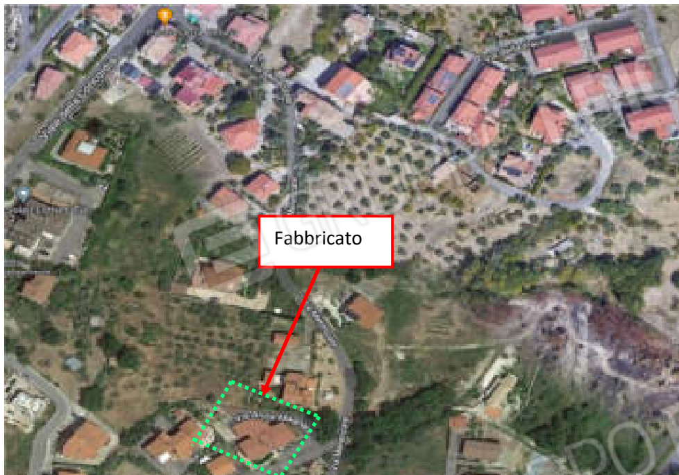
Foto n°1: – Vista aerea della zona del Comune di Mendicino entro cui ricade il fabbricato in catasto urbano, fg. n°8, p.lla n°917;