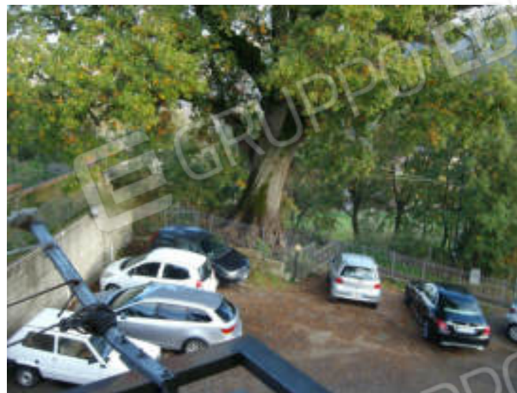
Foto n°26: Vista del Piano Terra le zona parcheggi di pertinenza del sub 13;