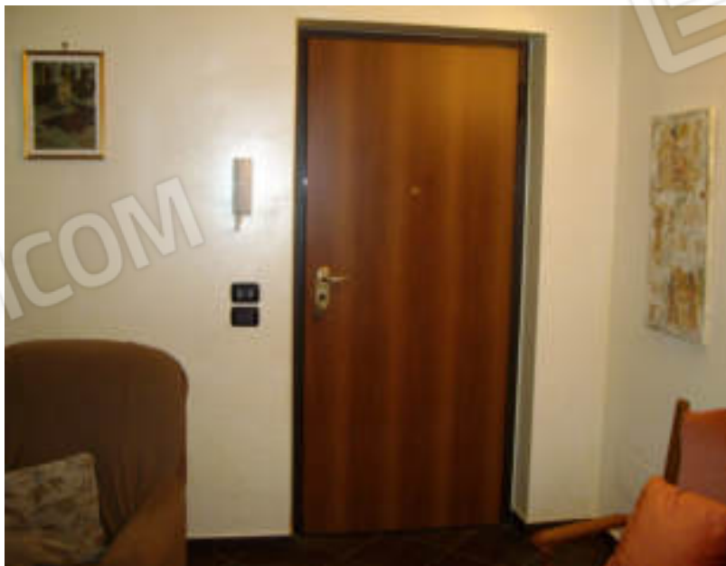
Foto n°7 – Ingresso-Soggiorno, vista dall'interno portoncino del blindato;