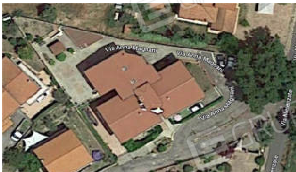
Foto n°2: – Vista aerea del fabbricato in catasto urbano Comune di Mendicino, fg. n°8, p.lla n°917;