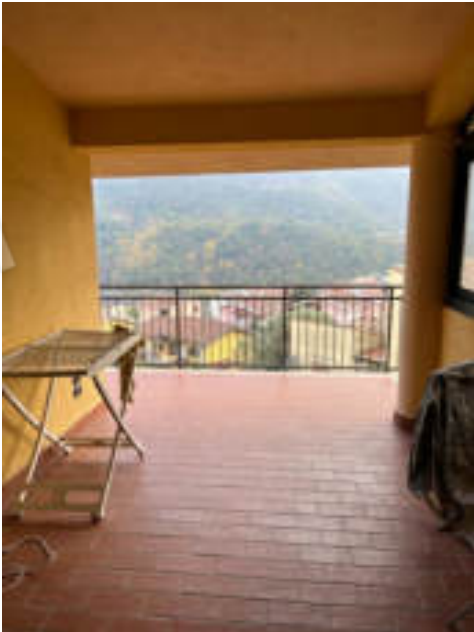
Foto n°19: Balcone Soggiorno-Cucina, Vista dall'interno Zona Soggiorno;