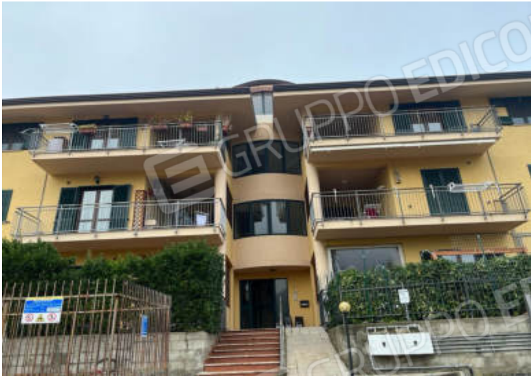
Foto n°4: – Prospetto Principale del fabbricato, Comune di Mendicino (CS) fg. n°8, p.lla 917;