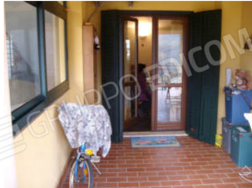
Foto n°20: Balcone Soggiorno-Cucina, Vista dall'esterno Zona Soggiorno;