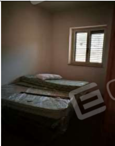
Figura 30 Piano terra sub 1 - letto