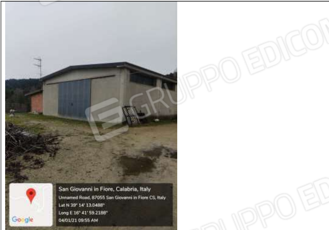
Figura 18 Capannone Industriale sub 3 Lato Sud-Ovest