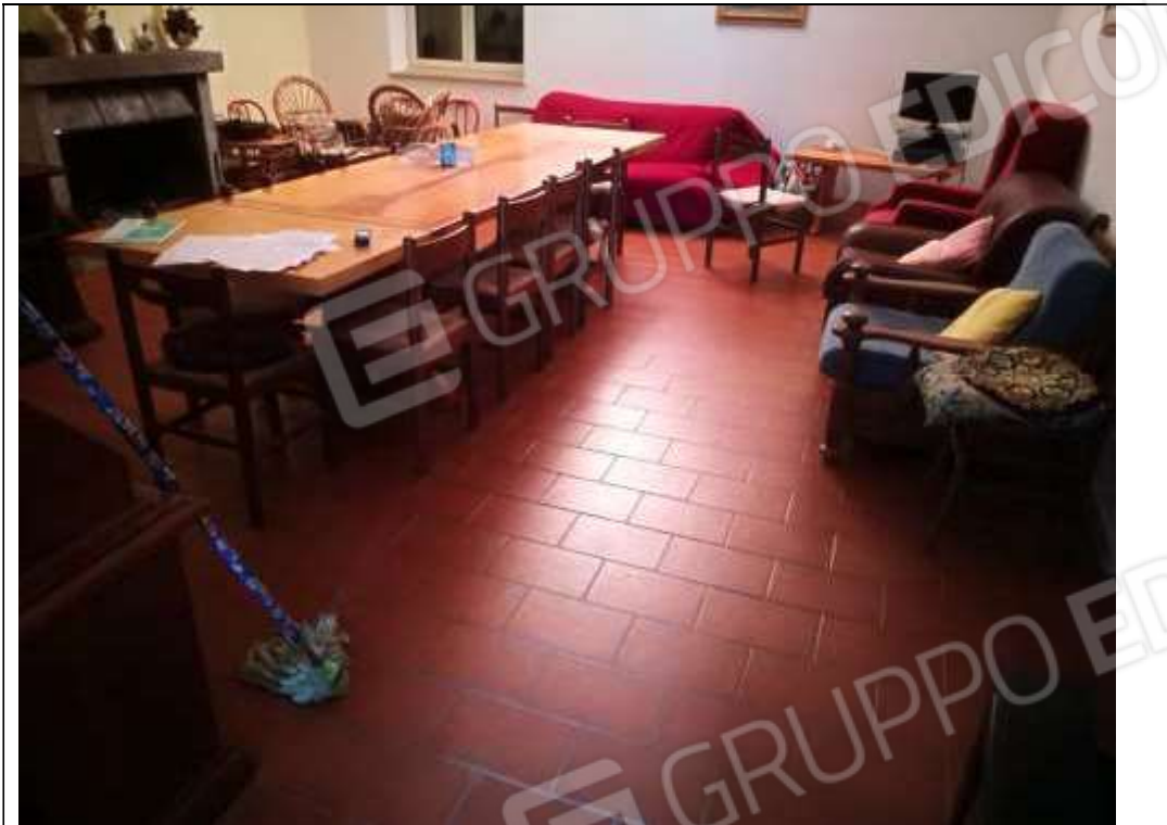
Figura 35 Piano primo sub 2– salone