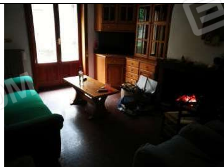
Figura 7 Salotto