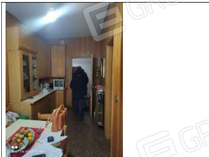
Figura 11 Cucina