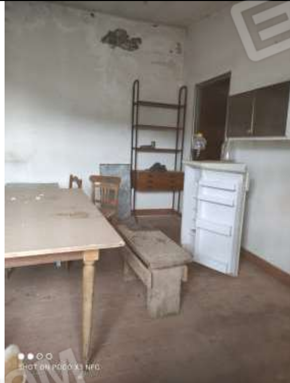
Figura 21 Edificio annesso al Capannone Industriale Lato Sud-Est