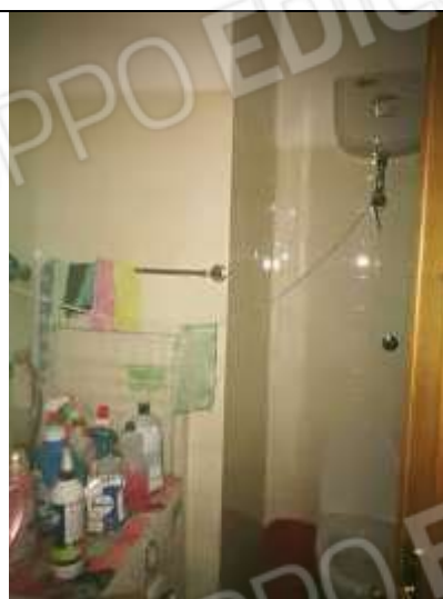
Figura 6 Bagno