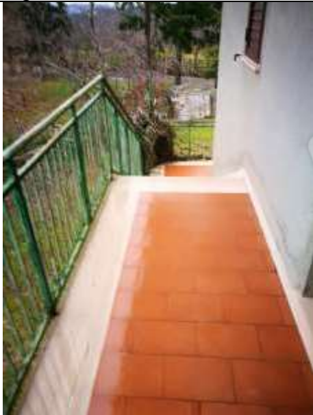
Figura 31 Piano primo sub 2 – scale di accesso