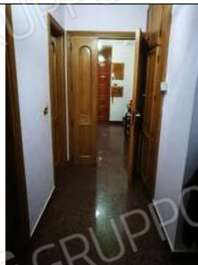
Figura 4 Corridoio