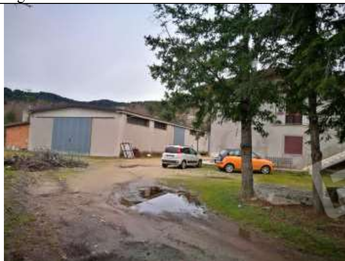
Figura 15 Capannone part 85 sub , 2 e 3