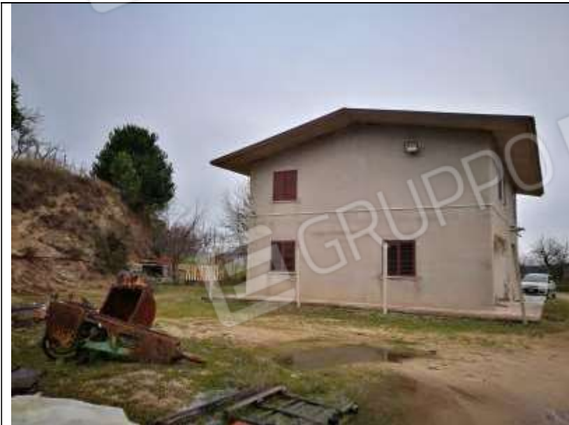
Figura 26 Fabbricato Facciata Sud Ovest