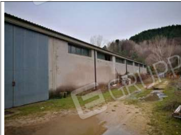
Figura 16 Capannone Industriale sub 3 Lato Nord-Ovest