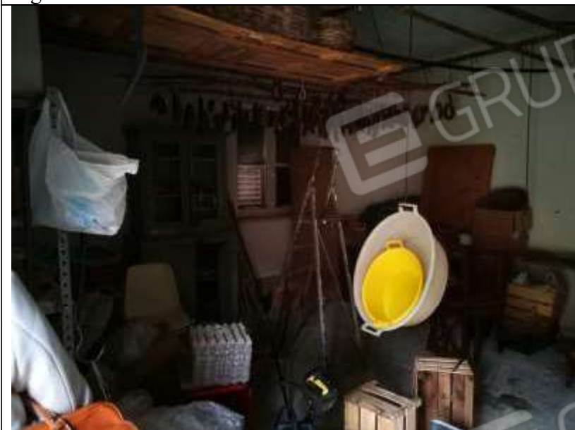
Figura 27 Piano terra sub 1 - deposito