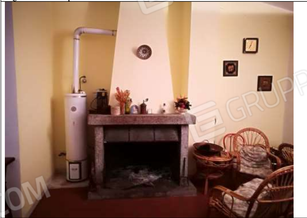
Piano primo sub 2– salone