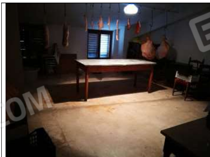
Figura 12 Soffitta