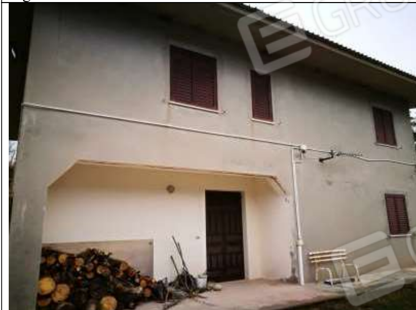
Figura 25 Fabbricato Facciata Nord Est