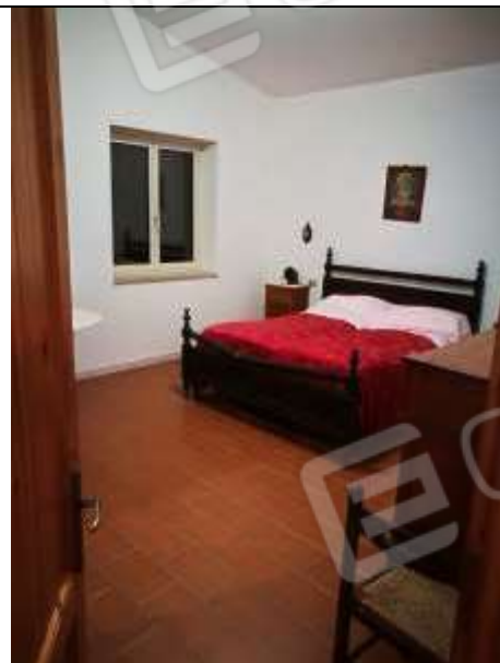
Figura 34 Piano primo sub 2 - camera da letto