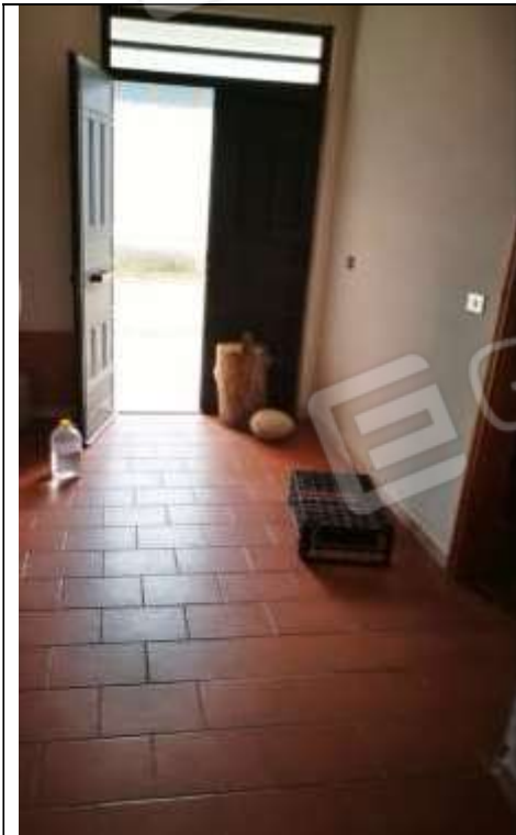
Figura 28 Piano terra sub 1 - ingresso