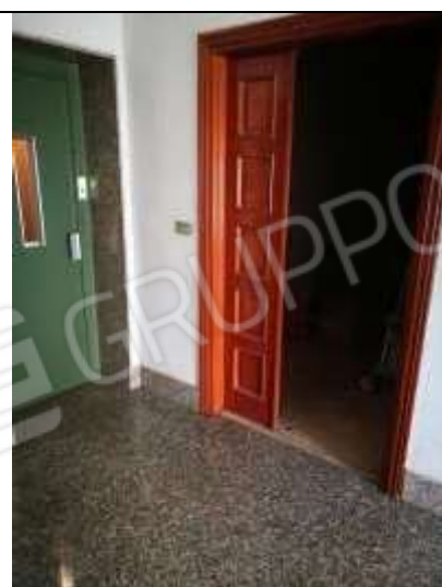
Figura 2 Ingresso appartamento