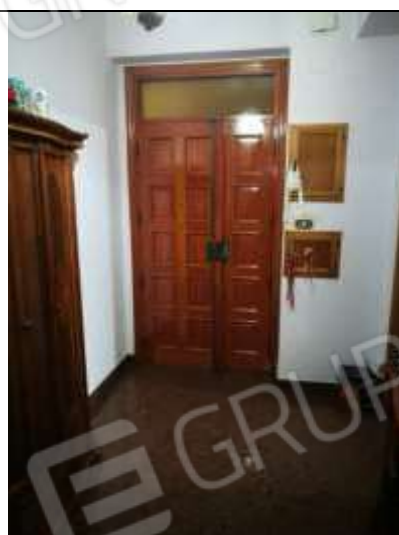
Figura 8 Ingresso