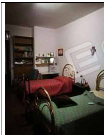
Figura 5 Camera da letto