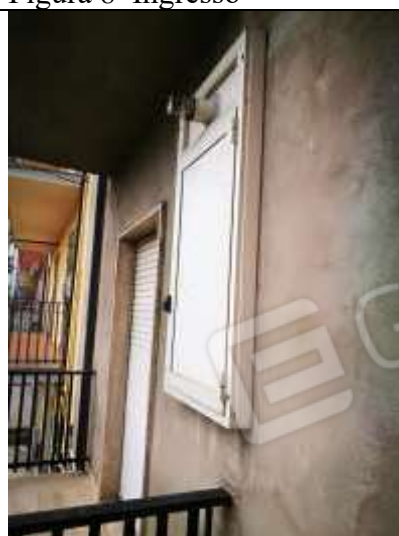
Figura 10 Dettaglio Caldaia