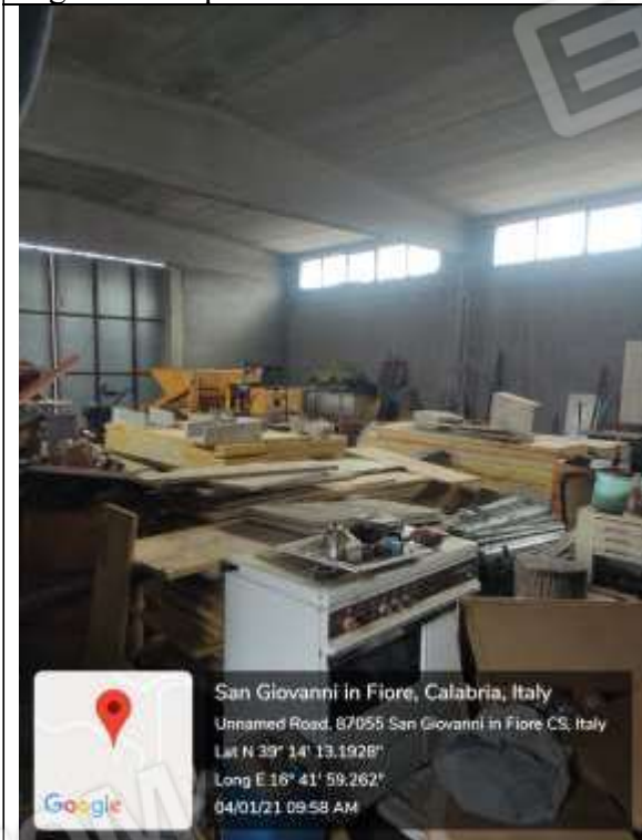
Figura 23 Capannone Industriale vista dell'interno