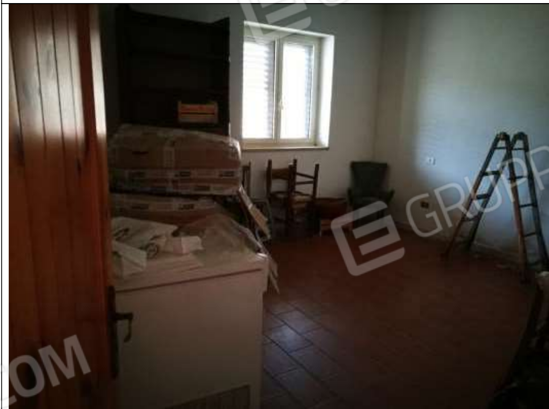
Figura 29 Piano terra sub 1 - letto