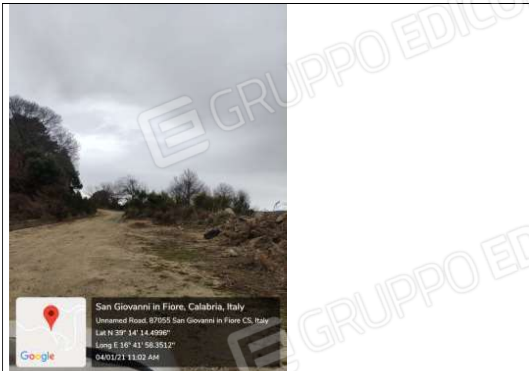
Figura 14 Strada di accesso al fondo