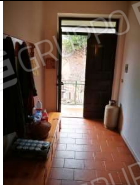
Figura 32 Piano primo sub 2 - ingresso