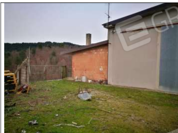
Figura 17 Capannone Industriale sub 3 Lato Sud-Ovest – visibile la costruzione annessa