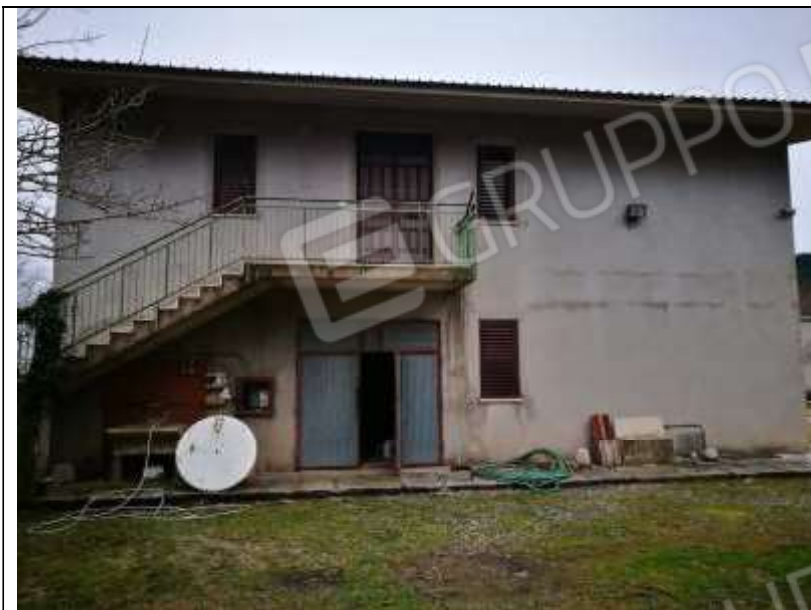
Figura 24 Fabbricato Facciata Nord Ovest