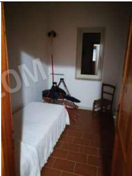
Figura 33 Piano primo sub 2– camera da letto