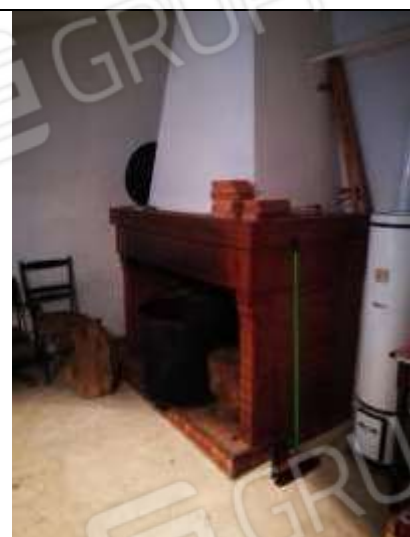
Figura 13 Dettaglio Caminetto soffitta