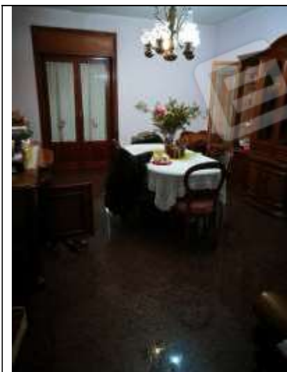
Figura 3 Sala pranzo