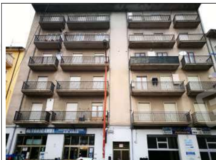
Figura 1 Vista frontale Palazzina Via panoramica 182