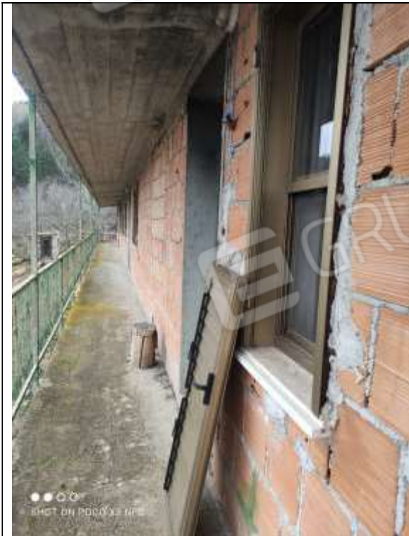
Figura 20 Edificio annesso al Capannone Industriale Lato Sud-Est