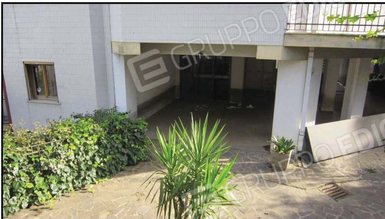
Foto 5 Ingresso Vano Scala Interno