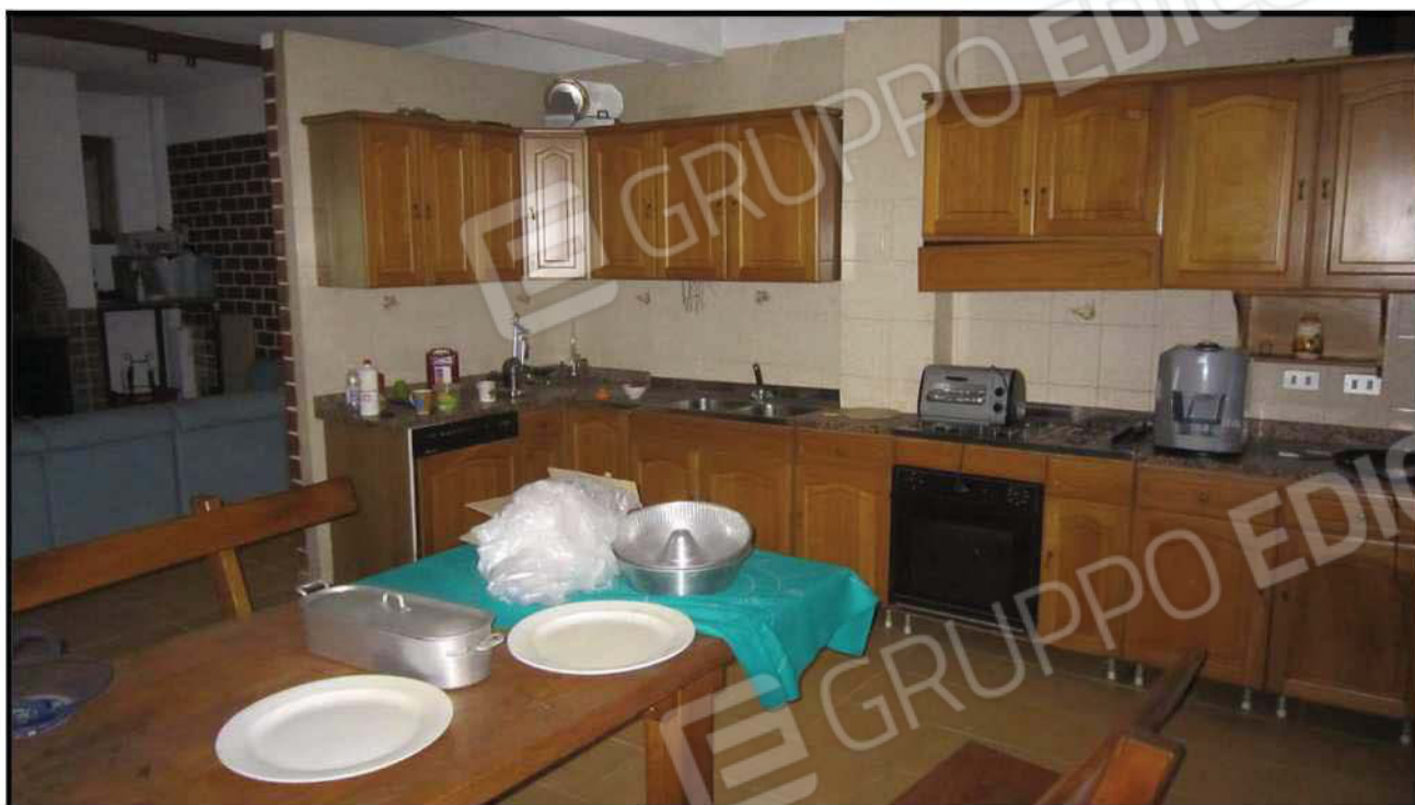
Foto 15 Interno Piano Seminterrato (Sub. 19) – Particolare Cucina