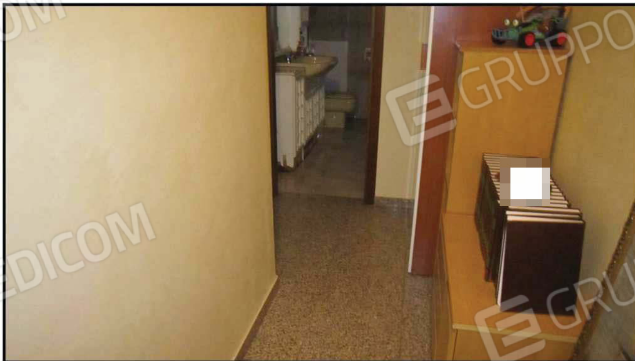
Foto 26 Interno appartamento Sub. 22 - Disimpegno