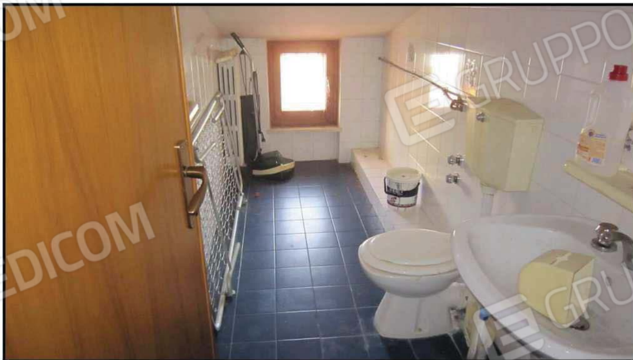
Foto 34 Appartamento Sub. 22 - Wc Sottotetto