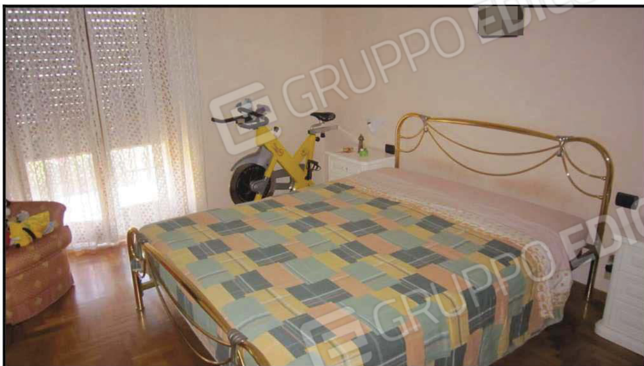
Foto 25 Interno appartamento Sub. 22 - Stanza da letto