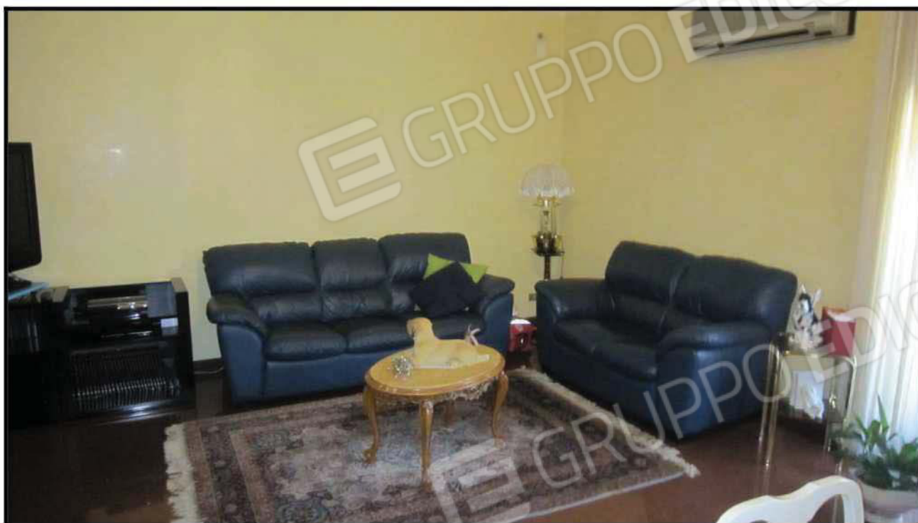
Foto 19 Interno appartamento Sub. 22 - Salone