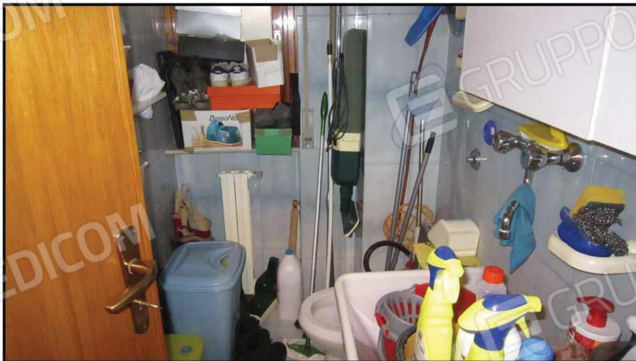
Foto 22 Interno appartamento Sub. 22 - Wc