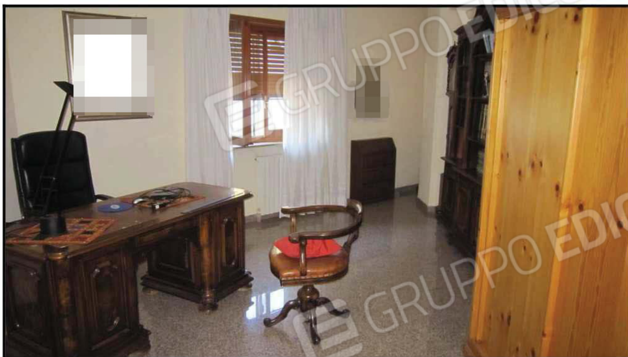
Foto 23 Interno appartamento Sub. 22 - Studio