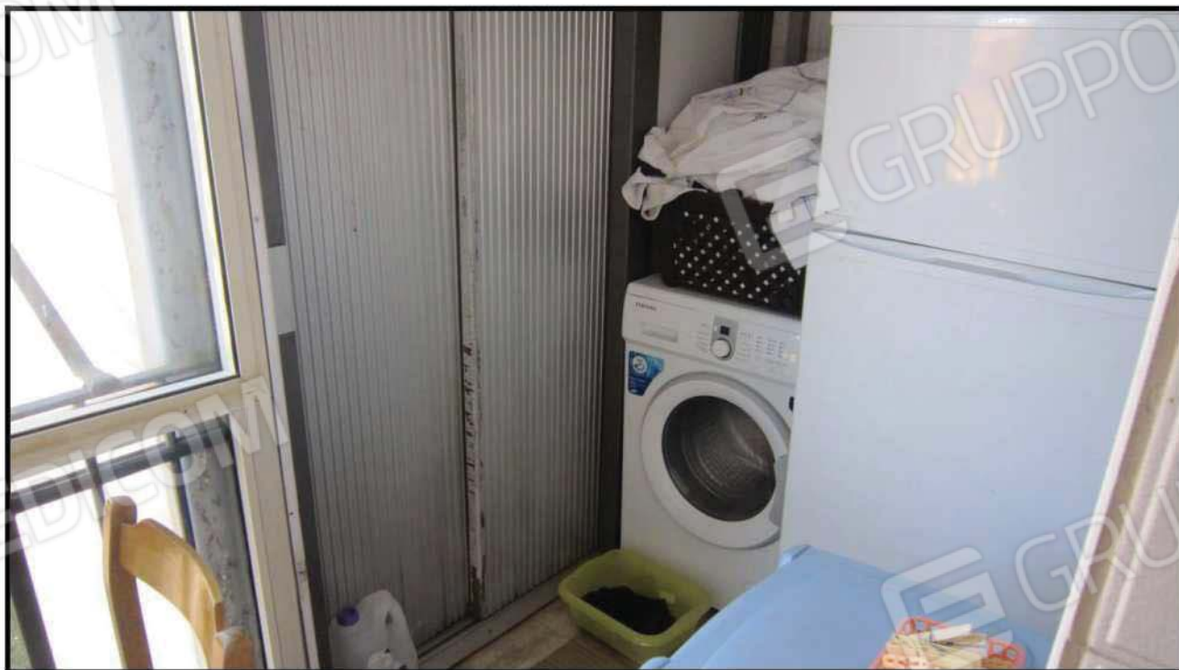
Foto 28 Appartamento Sub. 22 - Balcone Est con accesso ascensore