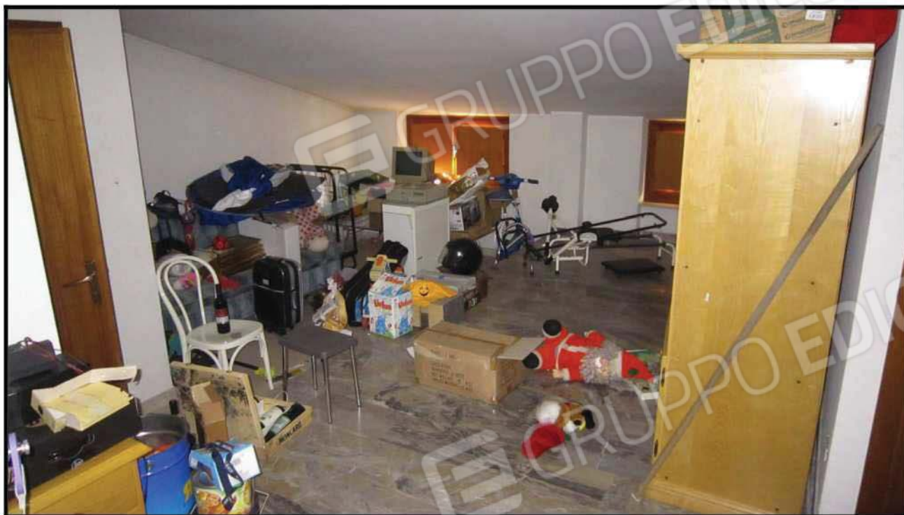
Foto 33 Appartamento Sub. 22 - Sottotetto