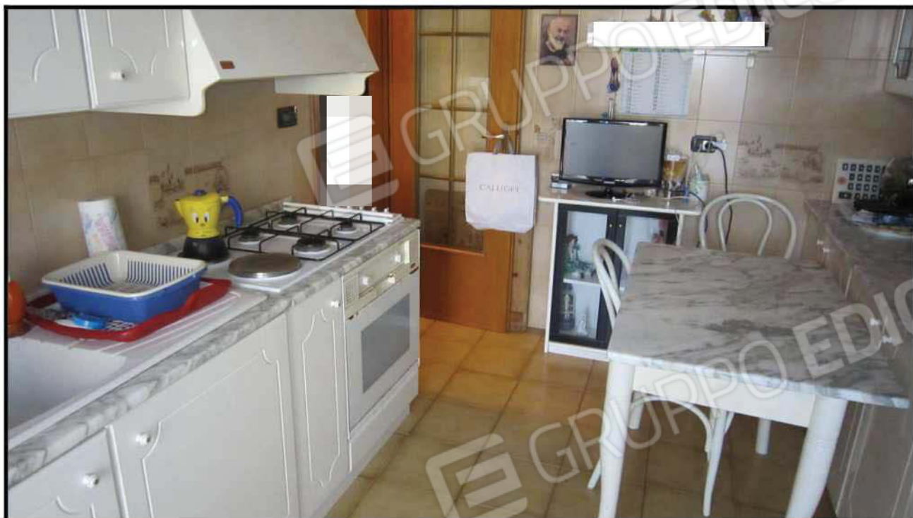
Foto 21 Interno appartamento Sub. 22 - Cucina