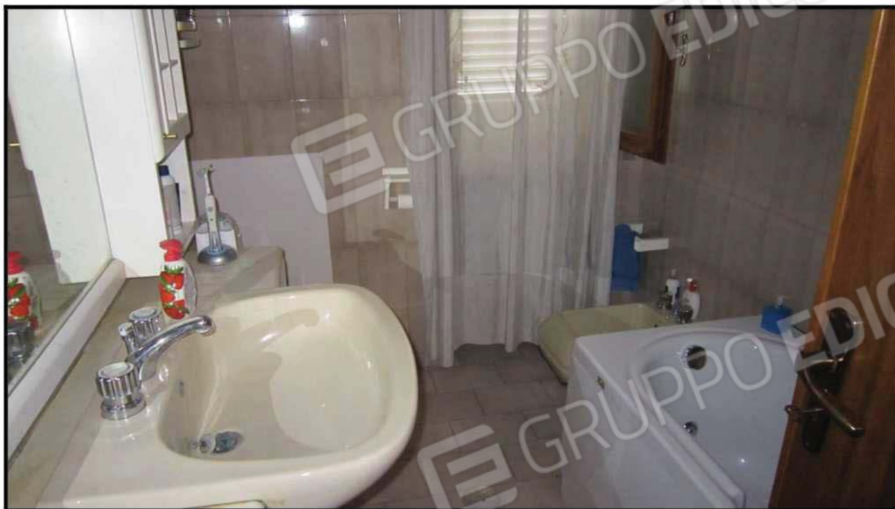
Foto 27 Interno appartamento Sub. 22 - Bagno