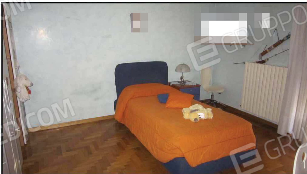
Foto 24 Interno appartamento Sub. 22 - Stanza da letto