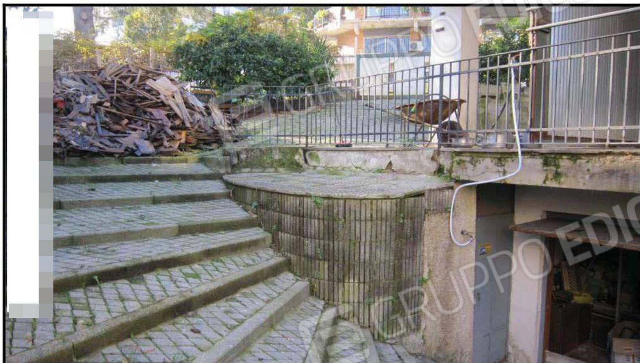
Foto 9 Corte Esterna lato Est – Scala di accesso al piano seminterrato (Sub. 19)