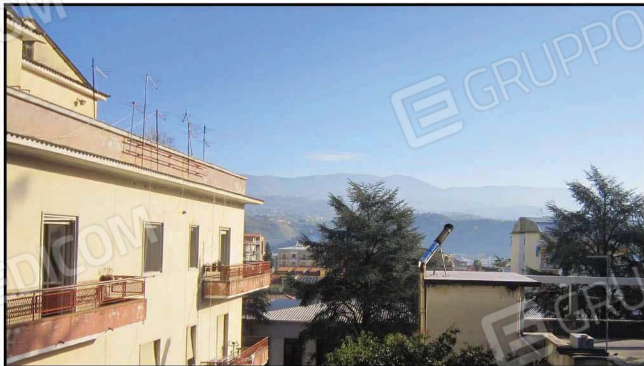
Foto 30 Appartamento Sub. 22 - Vista Est