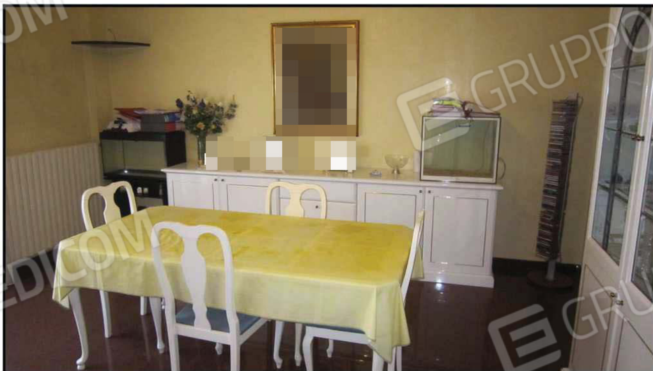
Foto 20 Interno appartamento Sub. 22 - Soggiorno