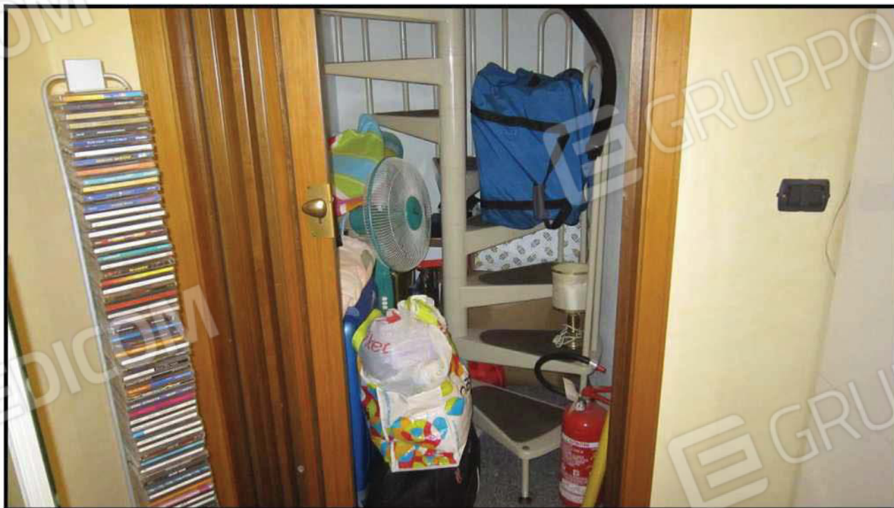
Foto 32 Appartamento Sub. 22 - Accesso al sottotetto