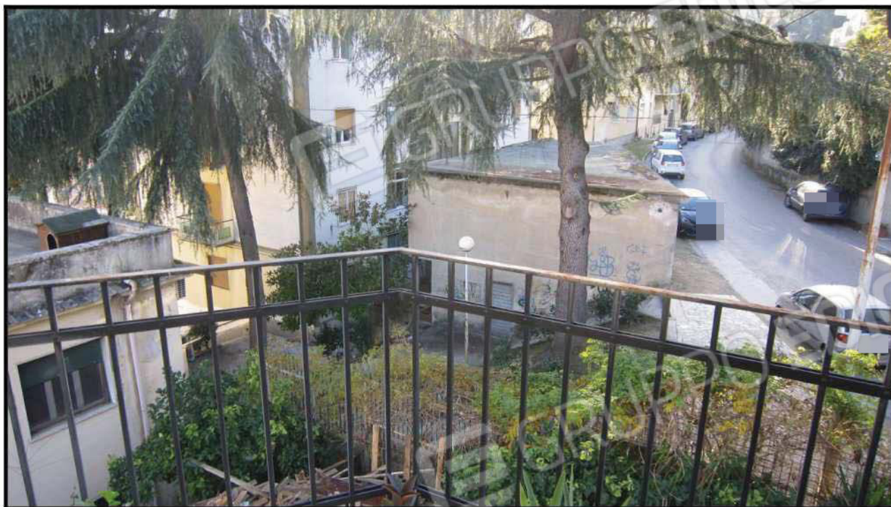
Foto 31 Appartamento Sub. 22 - Vista Sud