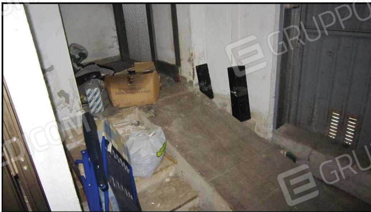
Foto 12 Interno Piano Seminterrato (Sub. 19)- Particolare area accesso ascensore