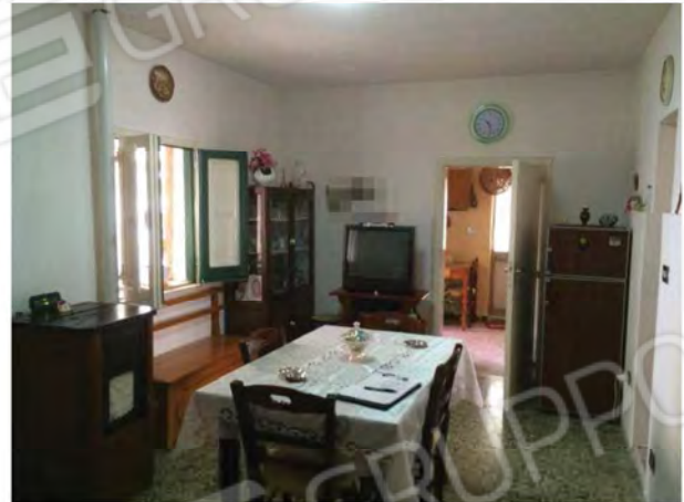
FOTO 4 - SOGGIORNO