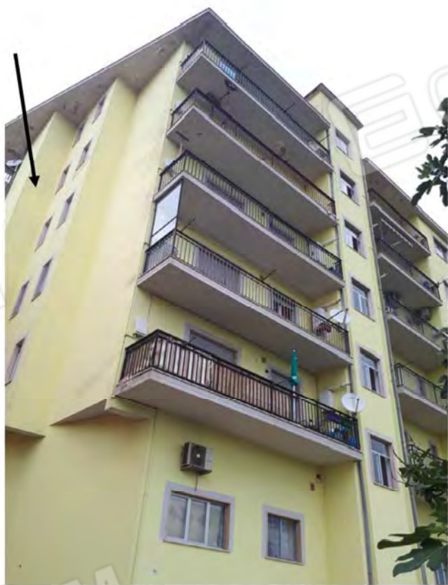
FOTO 4. PROSPETTO LATO SUD-OVEST (AFFACCIO CORTE-PROPRIETA' XXXXXXX)