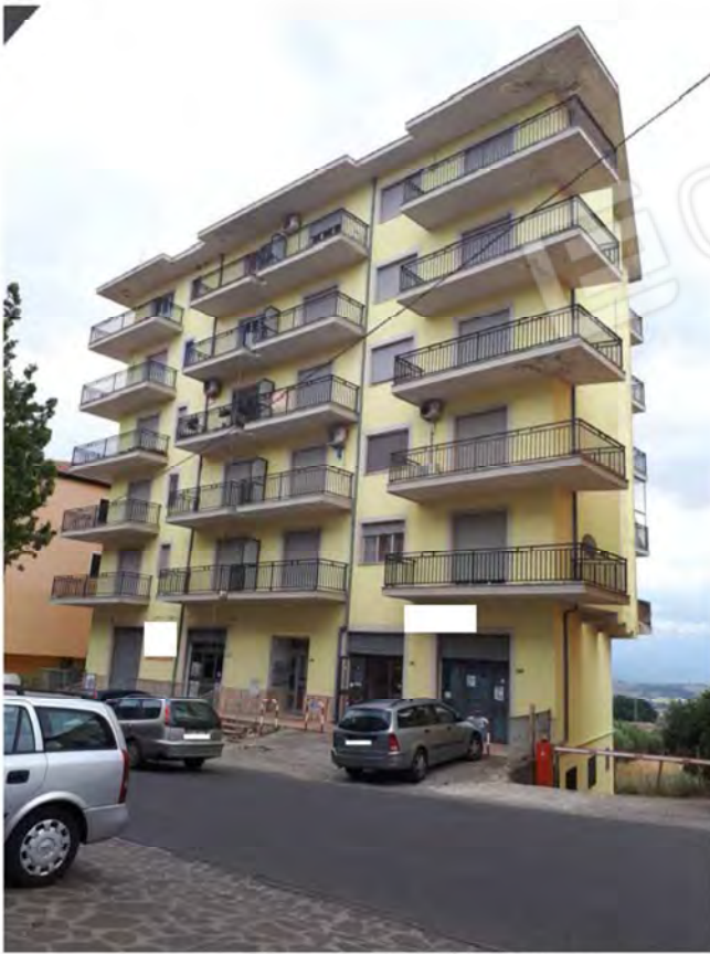
FOTO 1. PROSPETTO LATO NORD-OVEST (AFFACCIO VIA VITTORIO EMANUELE)