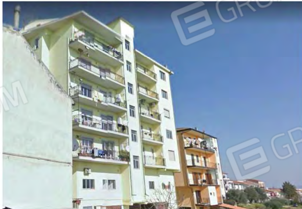
FOTO 3. PROSPETTO LATO SUD-EST (AFFACCIO CORTE—CONFINE PROPRIETA' XXXXXXXX)