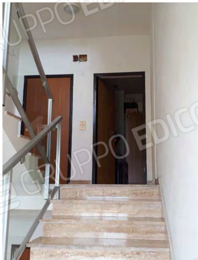
FOTO 5. VANO SCALE PIANO SECONDO PORTE DI ACCESSO AGLI APPARTAMENTI DEL SUBALTERNO 16