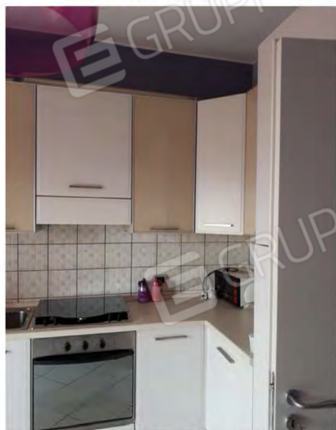
FOTO 7. APPARTAMENTO A - CUCINA