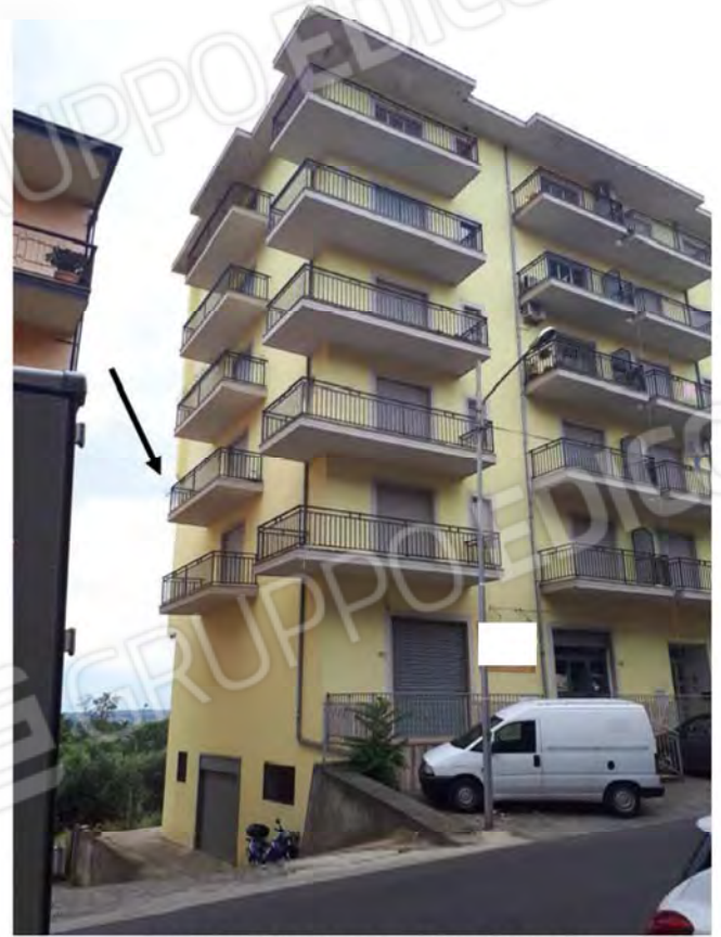
FOTO 2. PROSPETTO LATO NORD-EST (AFFACCIO CORTE—CONFINE PROPRIETA' XXXXXXXX)