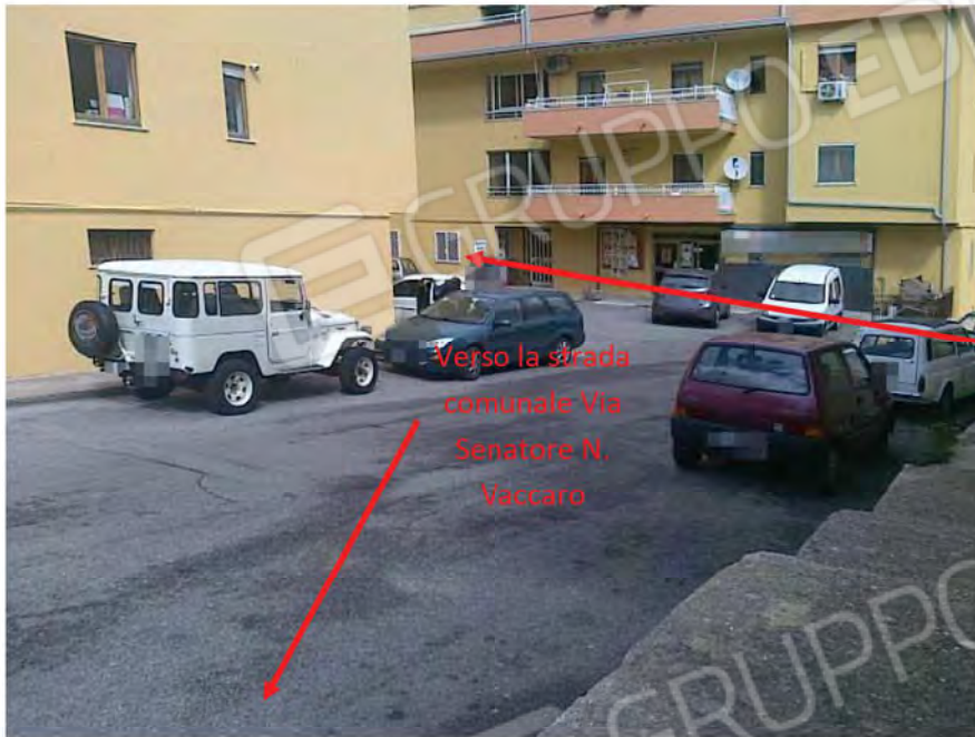
Vista lato sud-est del complesso edilizio in cui è ubicato l'appartamento pignorato