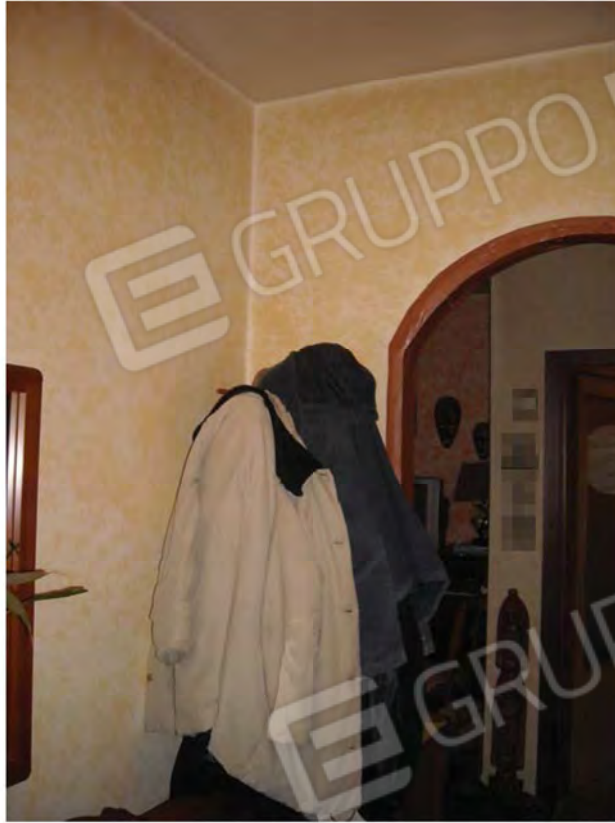
Foto N.1 - ingresso