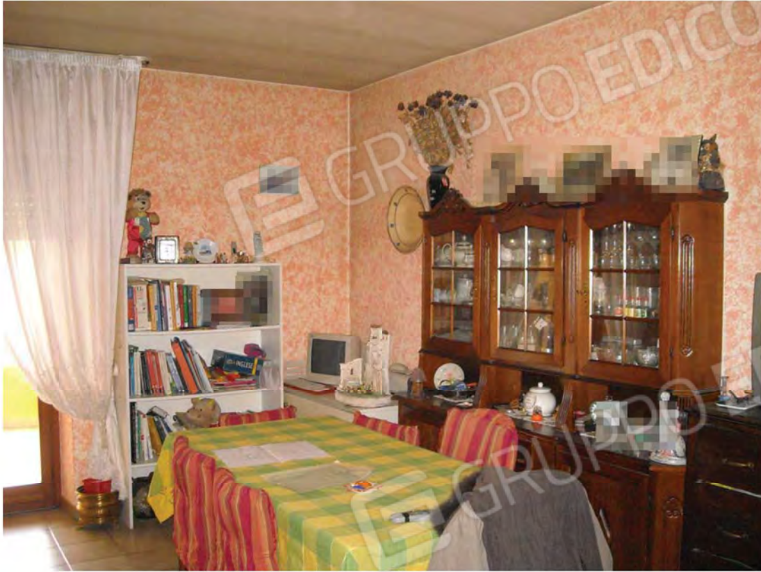
Foto N.3 - soggiorno