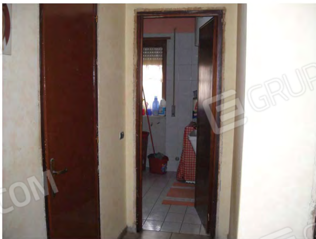
Foto N.8 - corridoio e bagno1