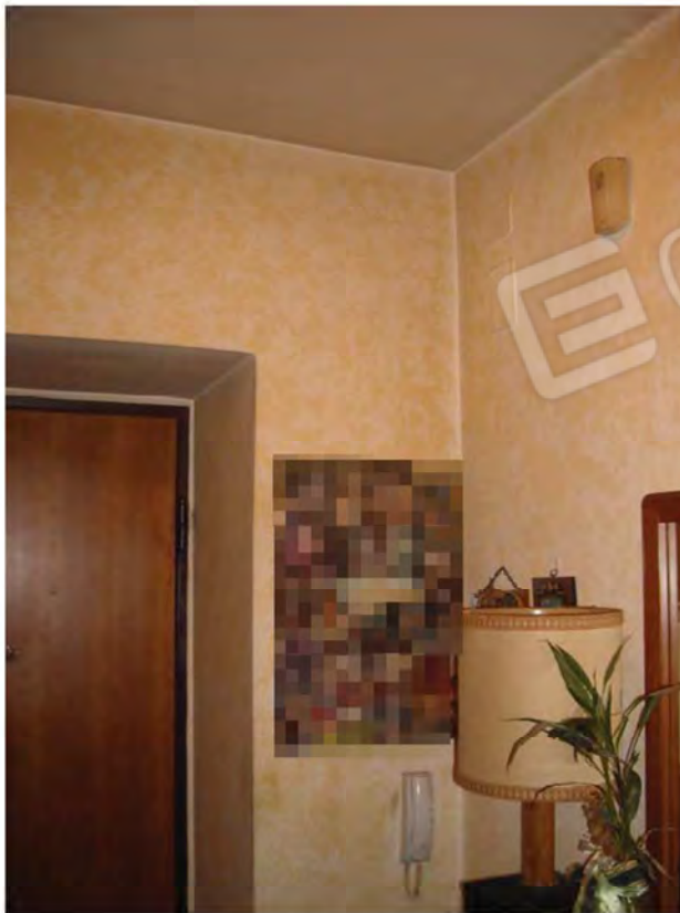
Foto N.2 - ingresso