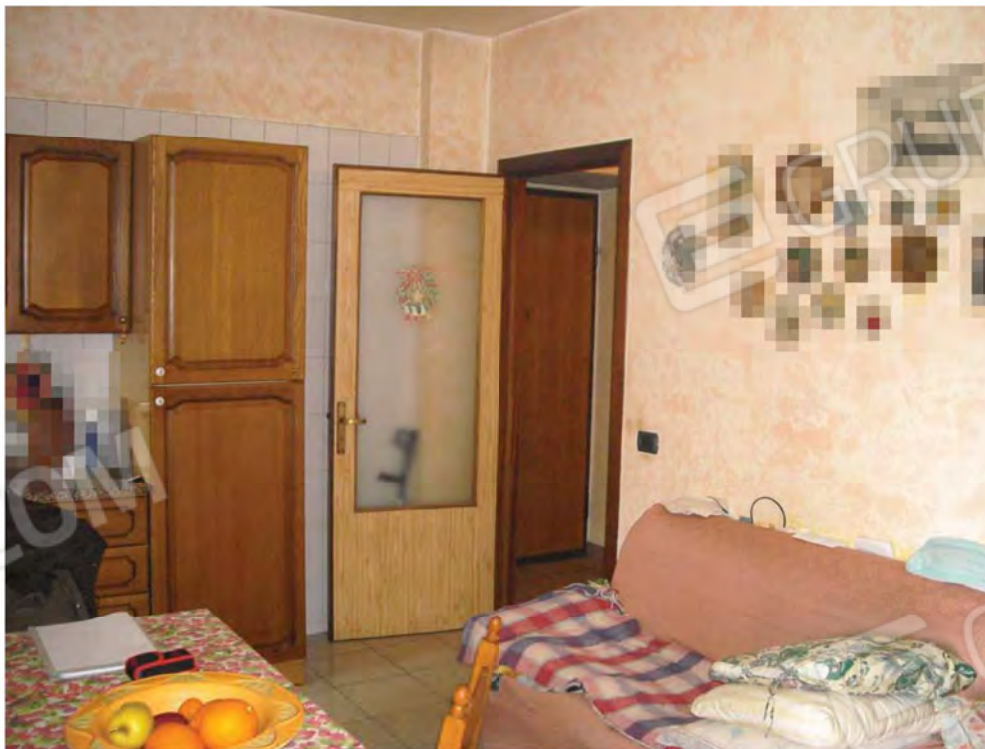
Foto N.20 - cucina