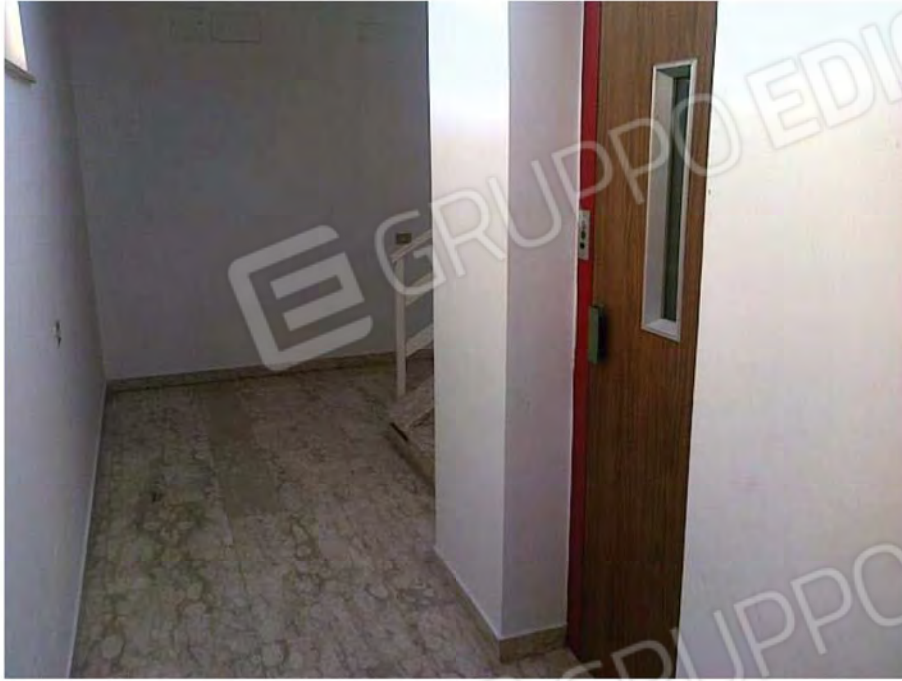
Vista interno vano scala con ascensore