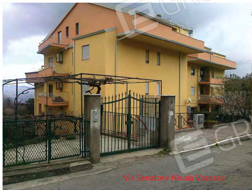
Vista lato est del fabbricato in cui è ubicato l'appartamento pignorato