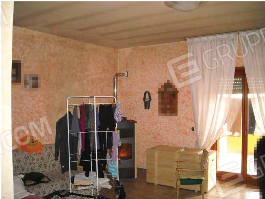
Foto N.4 - soggiorno