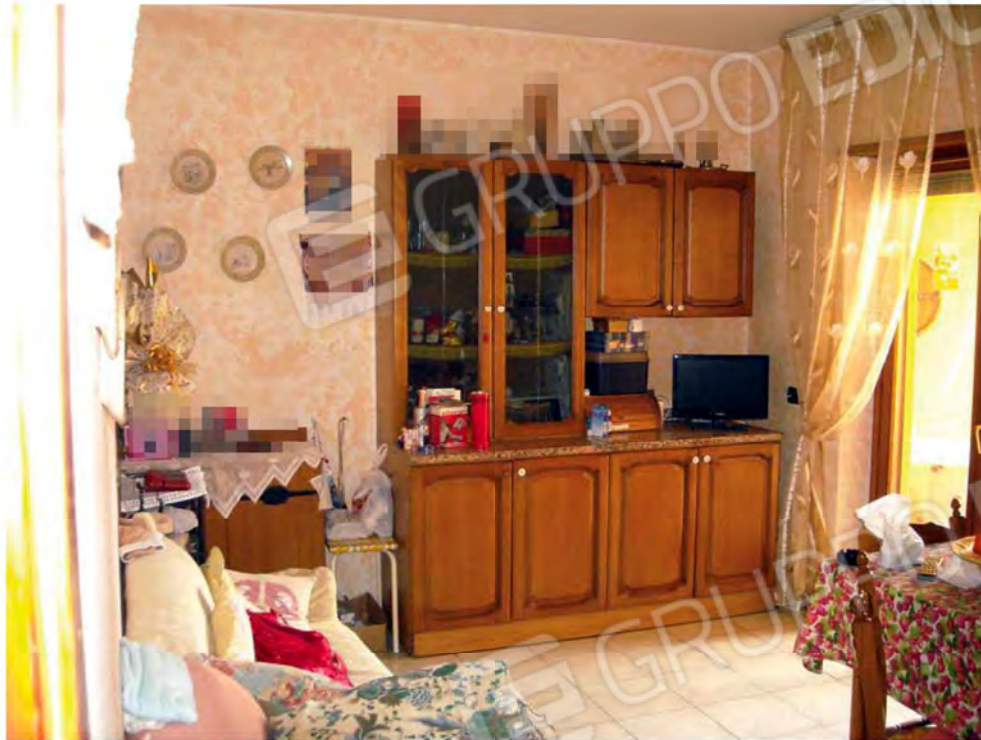
Foto N.19 - cucina