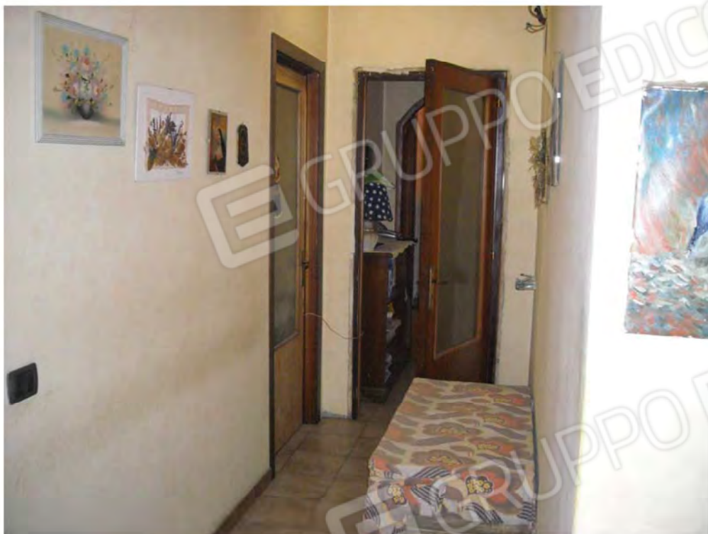
Foto N.7 - corridoio