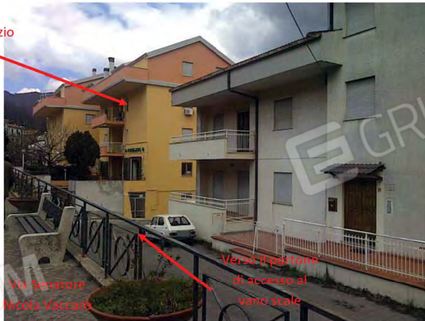
Vista lato sud-est del complesso edilizio in cui è ubicato l'appartamento pignorato