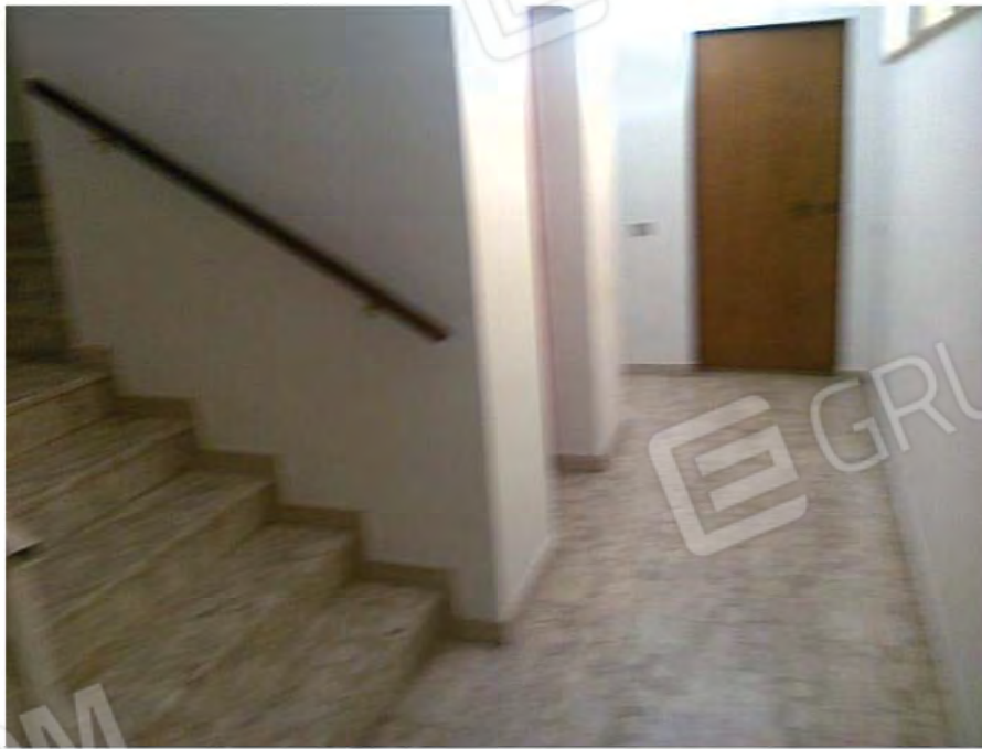
Vista interno vano scala con ascensore