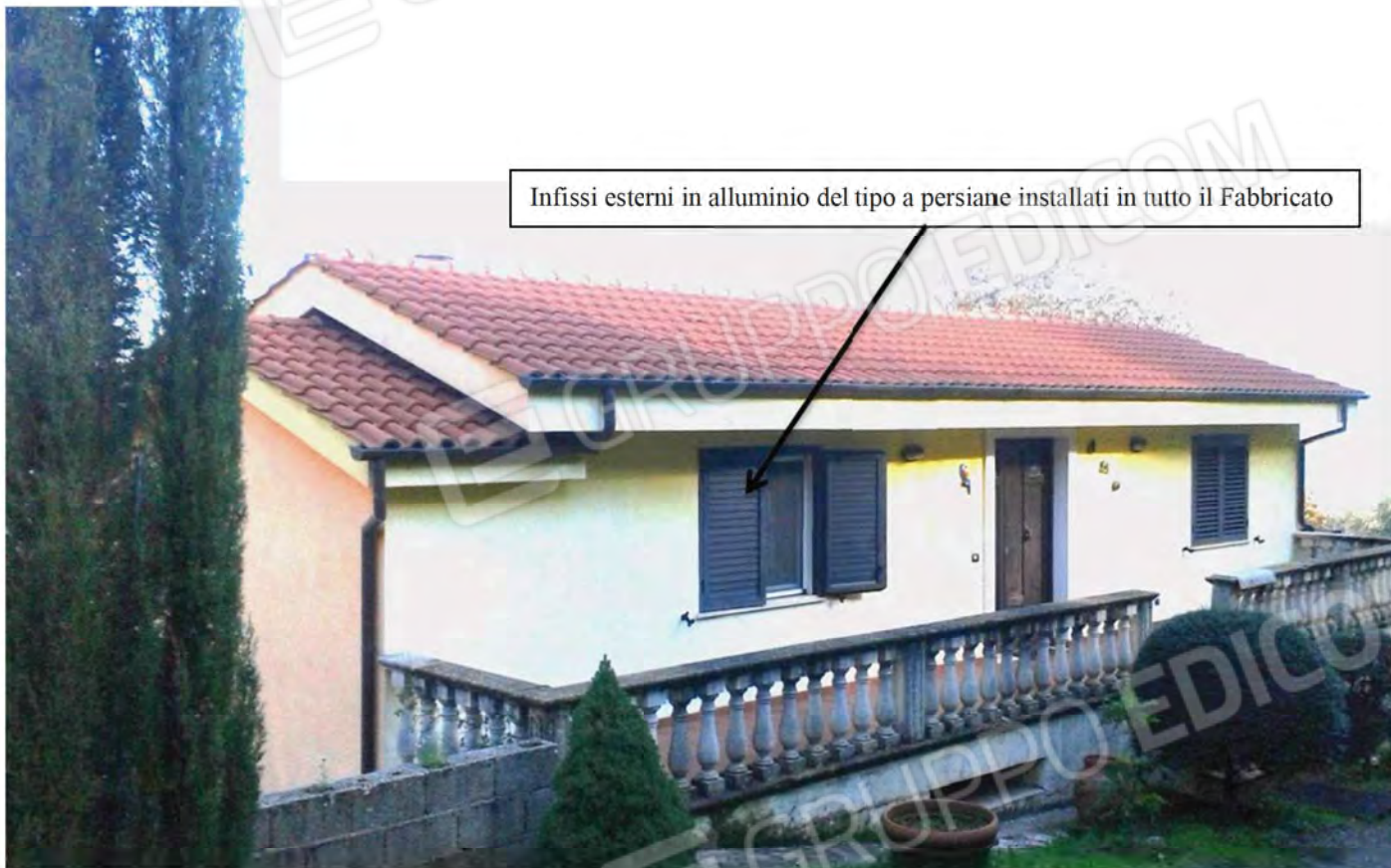
Foto n. 15 - Vista prospettica della facciata Sud del Fabbricato, nonché del terrazzo, della copertura e degli infissi esterni delle finestre (persiane) in alluminio .