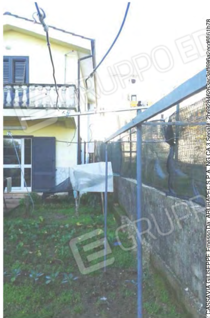
Foto n. 18 , 19 -Vista prospettica dell'intercapedine tra il muro di recinzione della Corte e la facciata Nord del Fabbricato .