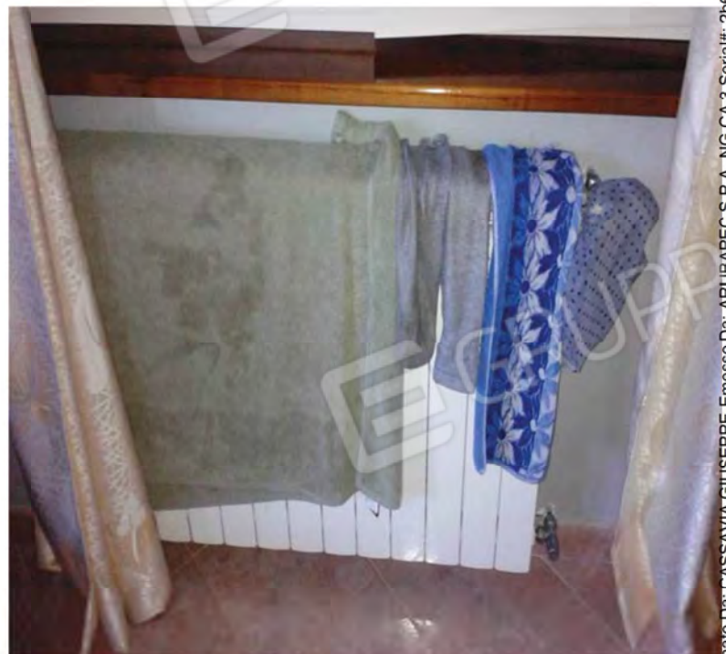
Foto n. 31 , 32 -Porta in tamburato e termosifoni in alluminio adottati per i vani del P.T.M. del Fabbricato.