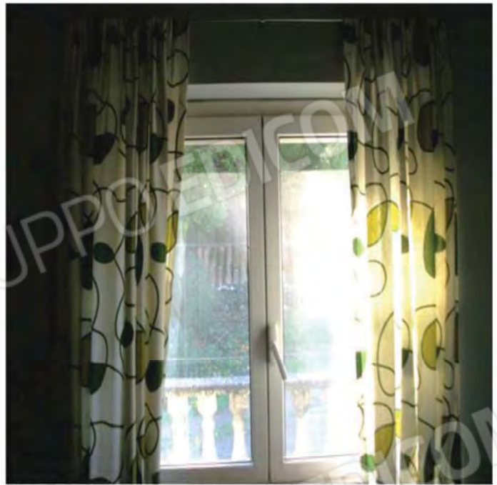
Foto n. 33 , 34 - Particolare tipo degli infissi interni delle finestre in alluminio semplice adottate al P.T.M. del Fabbricato.