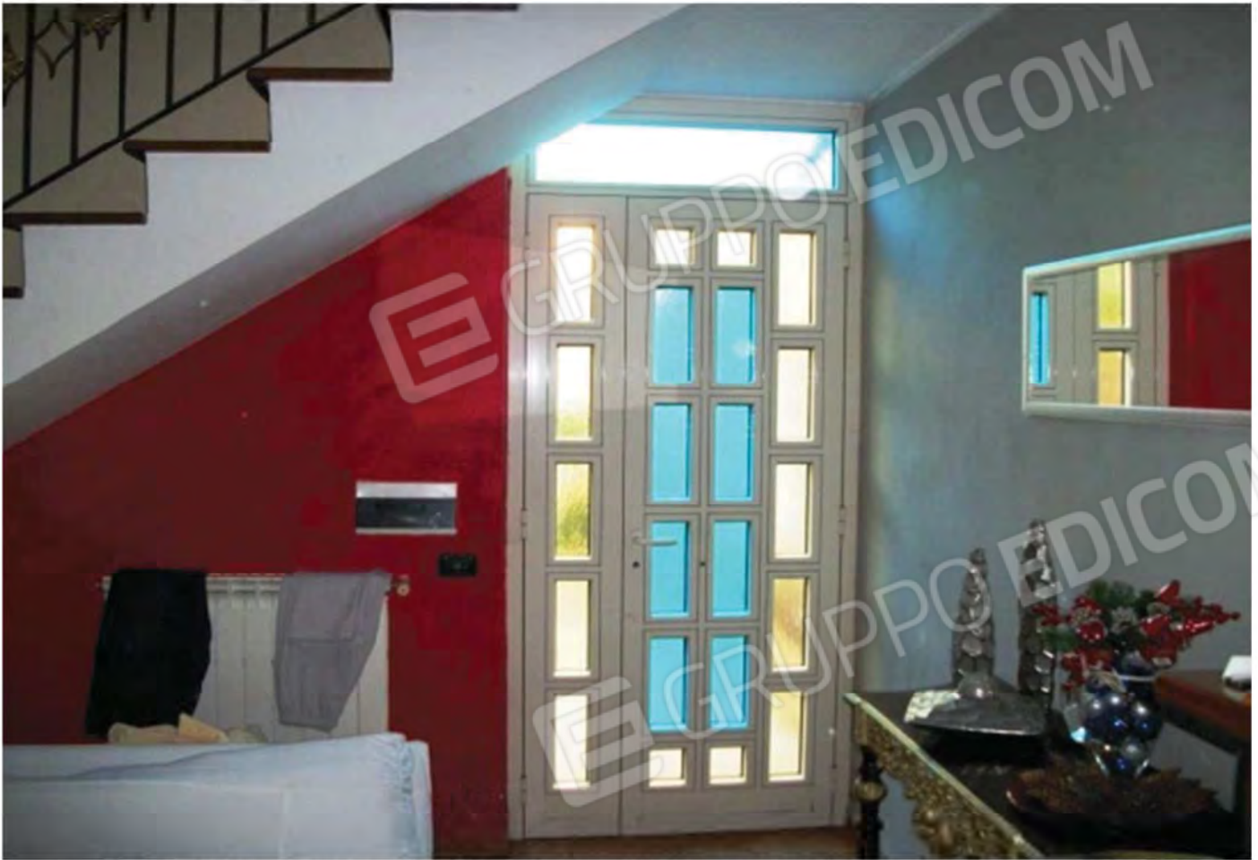
Foto n. 20 -Porta di ingresso in alluminio semplice al P.S.1 del Fabbricato e particolare laterale del corpo scala che dal P.S1 porta al P.T.M. del medesimo Fabbricato.

Seguono foto riguardante l'interno del Piano Seminterrato Primo del Fabbricato.