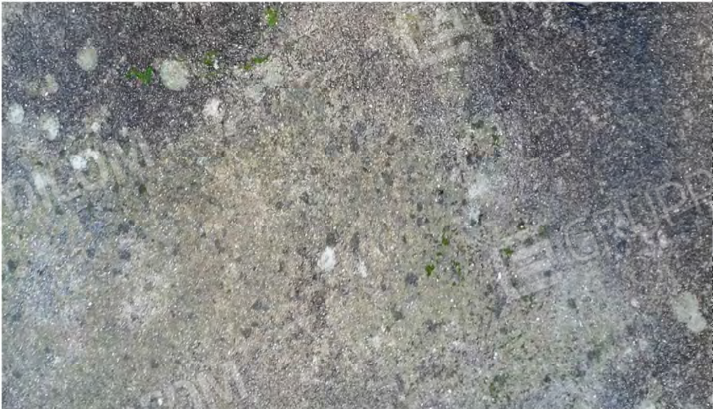
Foto n. 10 - Particolare del lastricato in cls della Corte facente parte del Fabbricato.