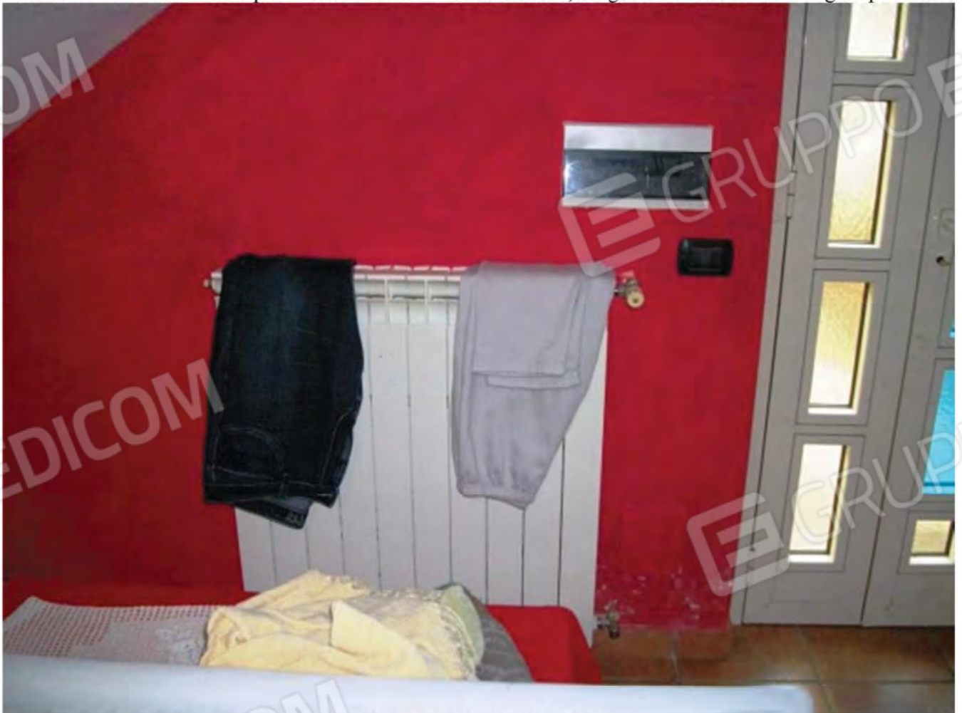
Foto n. 25 - Particolare termosifone in alluminio al P.S1 del Fabbricato.