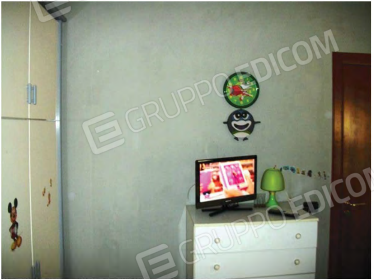
Foto n. 36 - Particolare finiture Camera Singola al P.T.M. del Fabbricato.