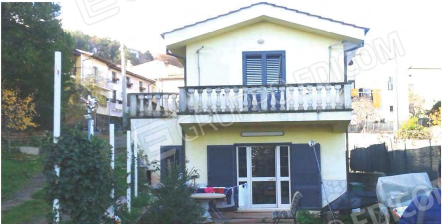
Foto n. 13 - Vista prospettica della Corte e della facciata Est del Fabbricato .