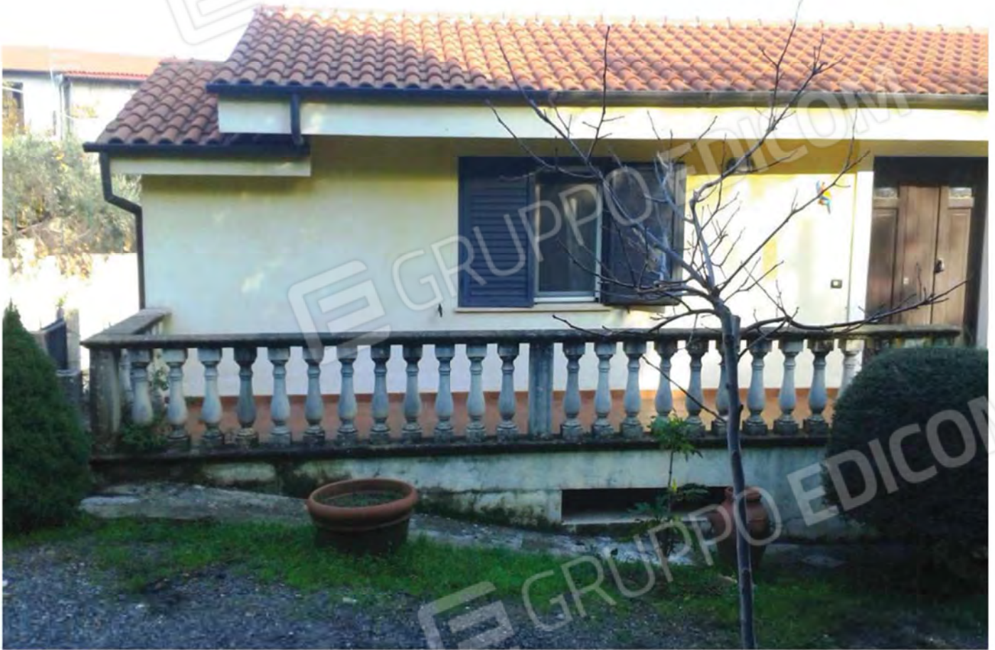
Foto n. 17 - Particolare vista prospettica della facciata Sud del Fabbricato, nonché del Terrazzo facente parte dello stesso Fabbricato.