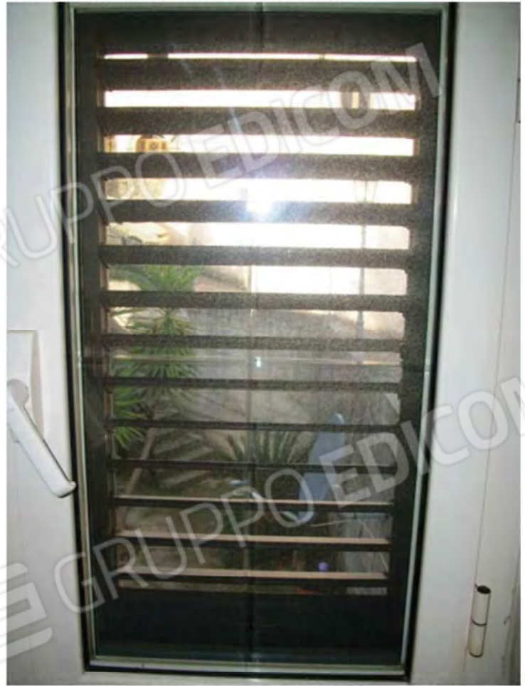
Foto n. 29 , 30 - Corpo scala rivestita in legno che dal P.S1 porta al P.T.M. del Fabbricato, nonché finestra posta alla fine della rampa della stessa scala con affaccio sulla parte Ovest della corte esclusiva.