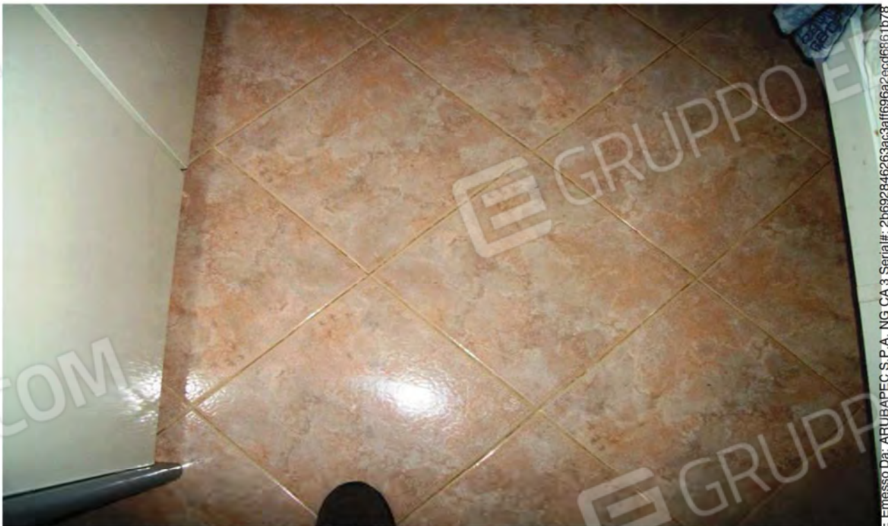
Foto n. 37 - Particolare del pavimento al P.T.M. del Fabbricato, eseguito con mattonelle di gres porcellanato.