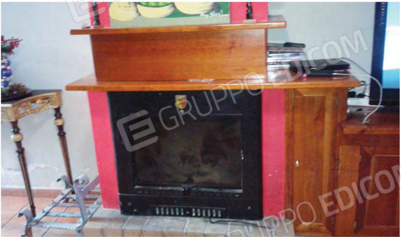
Foto n. 22 -Termo-caminò posto al P. S1 del Fabbricato, con la quale si alimentano i termosifoni del P.S1 e del P.T.M. .