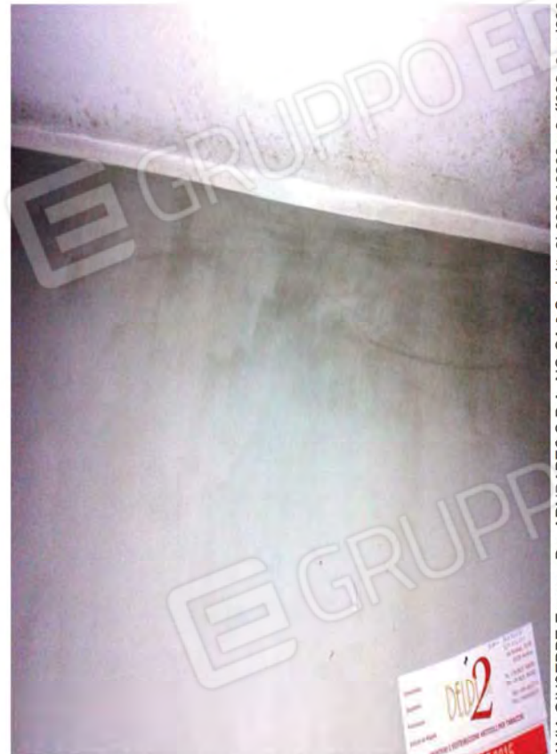
Foto n. 38, 39 , 40, 41 - Particolare parete e soffitto al P.T.M. del Fabbricato, dove si evidenzia presenza di umidità e di muffa, dovuta sicuramente ad un carente isolamento tra l'esterno e l'interno.