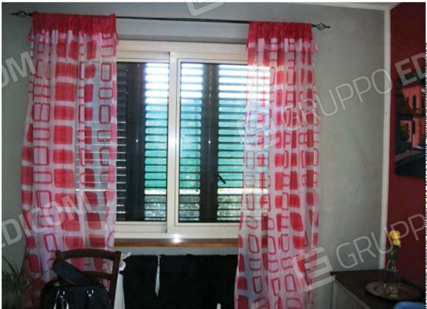
Foto n. 23 - Particolare tipo degli infissi interni delle finestre in alluminio semplice adottate per il P.S1 del Fabbricato.