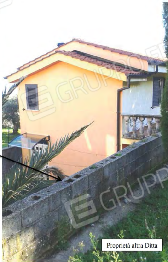
Foto n. 4 , 5 -Viste prospettiche Sud della recinzione posta a confine di proprietà della Corte facente parte del Fabbricato.