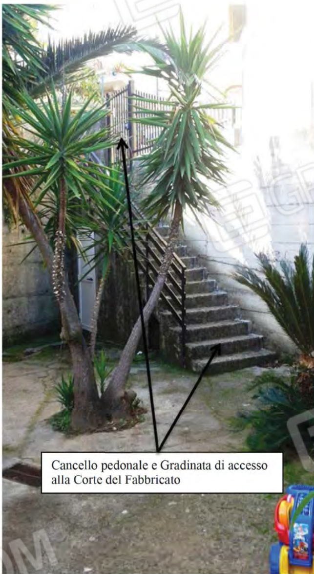
Cancello pedonale e Gradinata di accesso alla Corte del Fabbricato