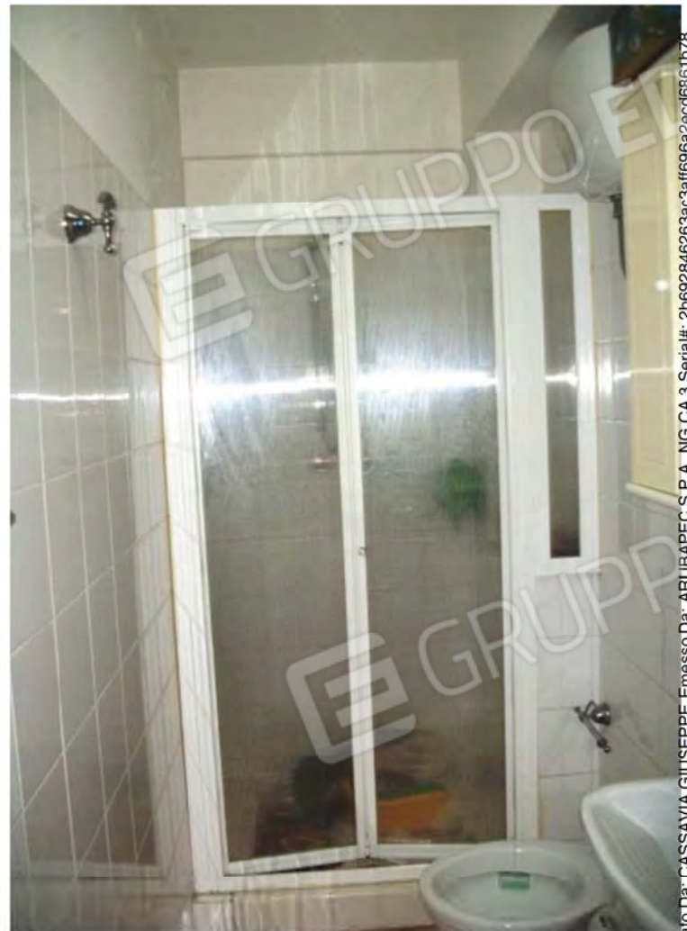
Foto n. 26, 27, 28 -Bagno posto al P.S1 del Fabbricato, completo di Vaschetta lavabiancheria che funge anche da Lavabo, WC , Doccia semplice completa di cabina, postazione Lavatrice .

Firmato Da: CASSAVIA GIUSEPPE Emesso Da: ARUBAPEC S.P.A. NG CA 3 Serial#: 2b692846263ac3aff696a2ecc66b61b78