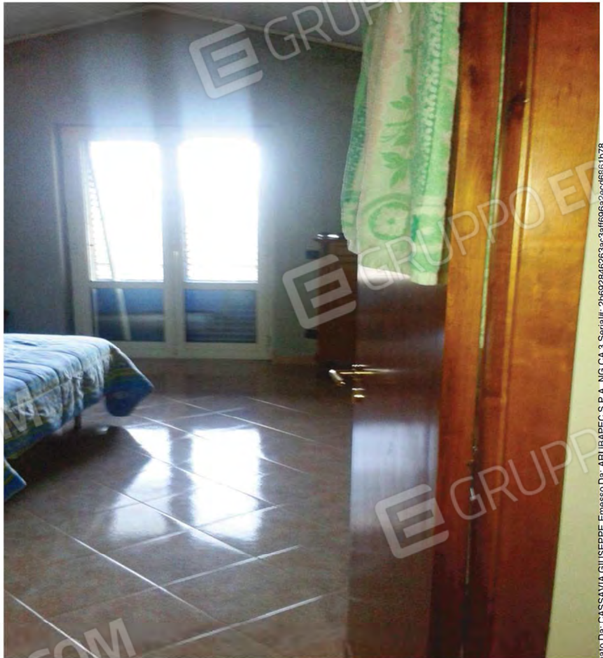
Foto n. 35 -Particolare finiture Camera da Letto Matrimoniale al P.T.M. del Fabbricato.