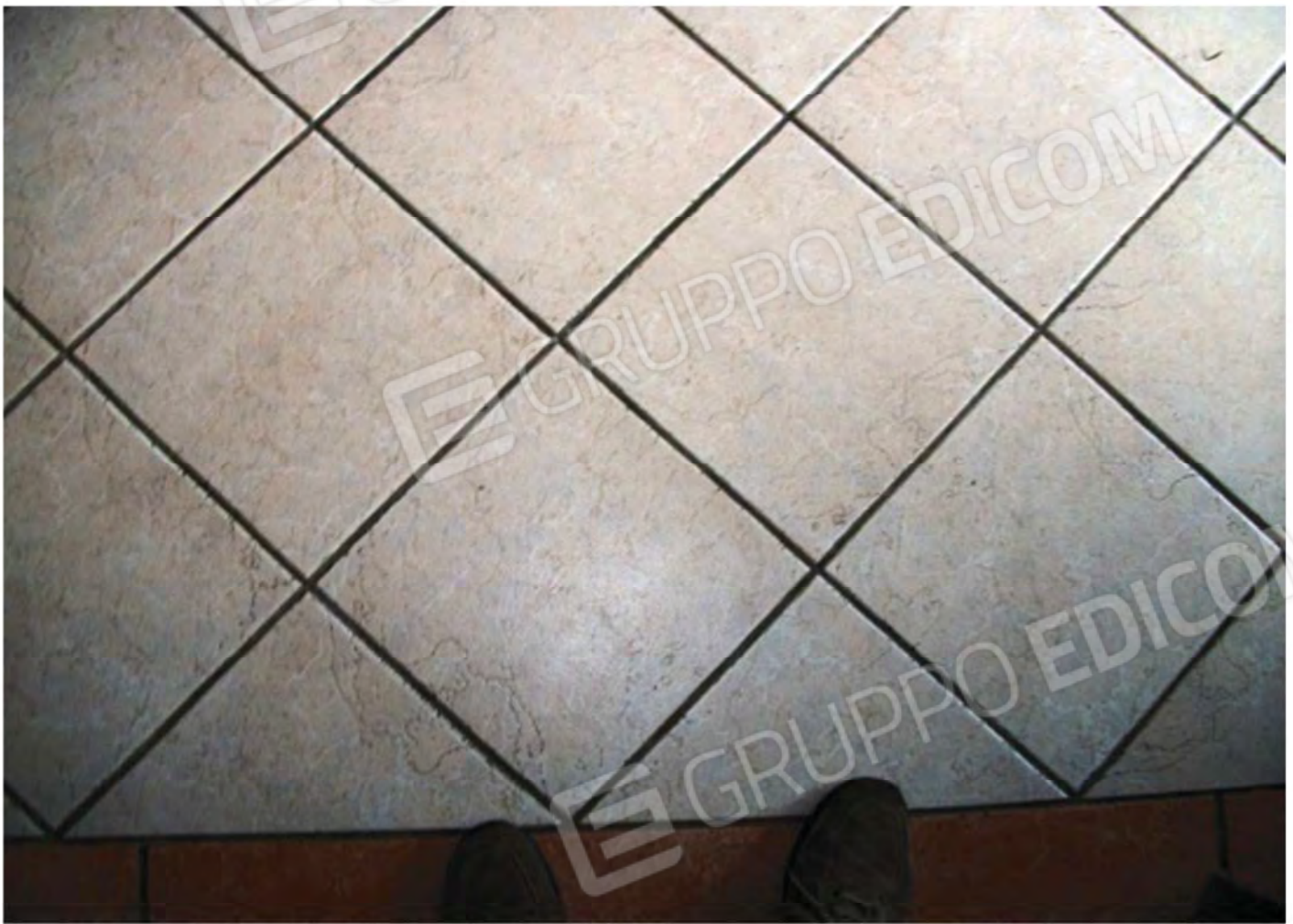
Foto n. 24 - Particolare del pavimento al P. S1 del Fabbricato , eseguito con mattonelle di gres porcellanato.