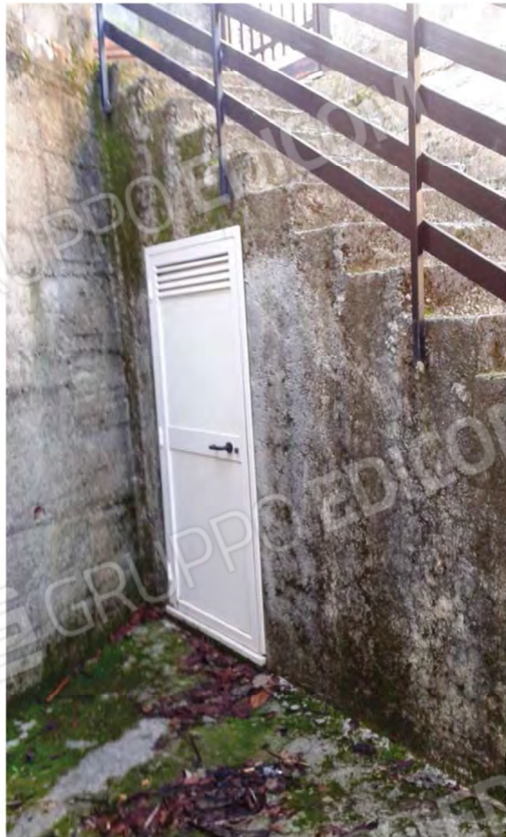
Foto n. 8 , 9 -Vista Gradinata di accesso alla Corte nonché al P.S1 del Fabbricato e vista della porta di ingresso ad un piccolo ripostiglio ricavato nel sottoscala della Gradinata di ingresso alla Corte del medesimo Fabbricato.