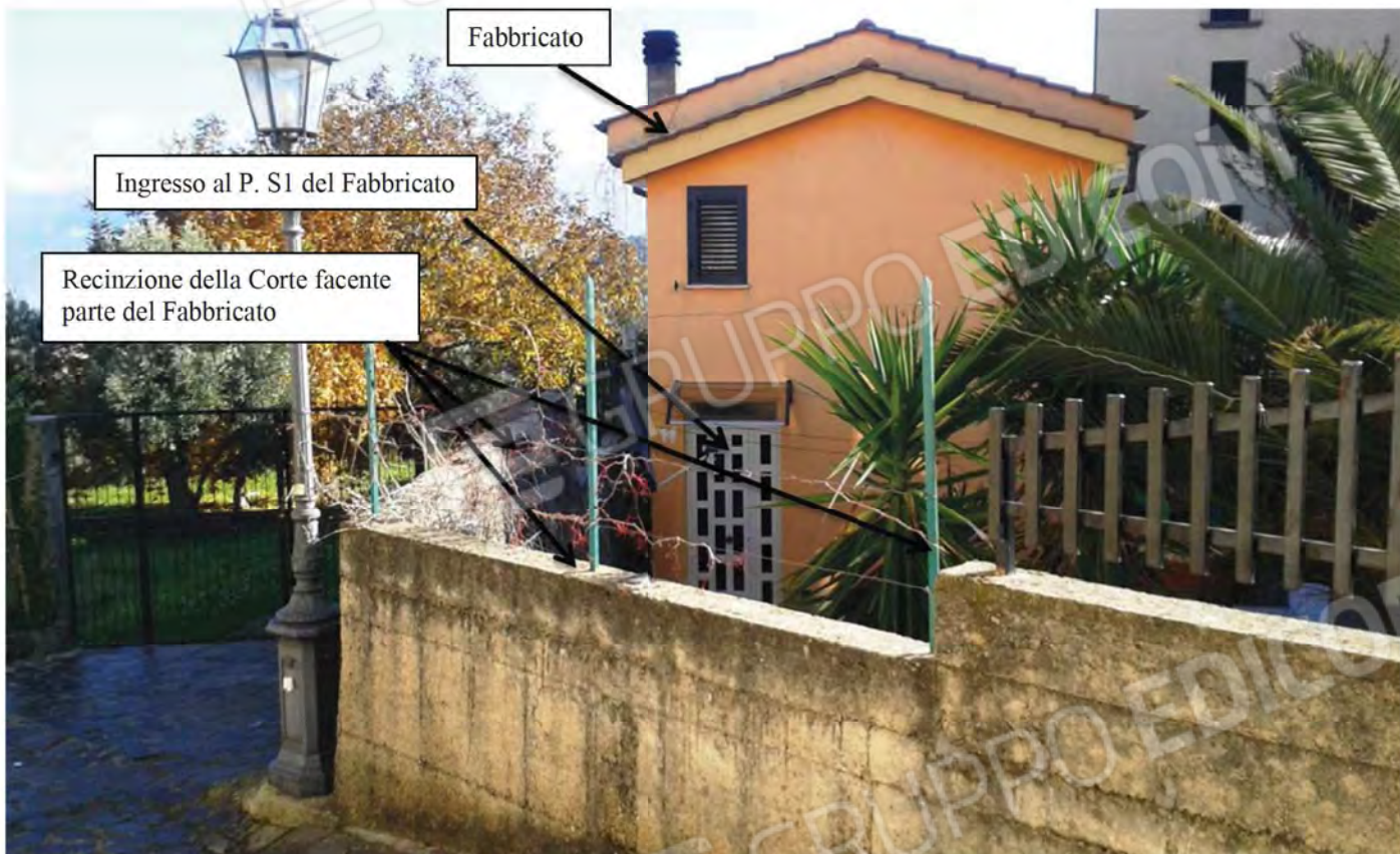
Foto n. 3 - Vista prospettica della facciata Ovest del Fabbricato.