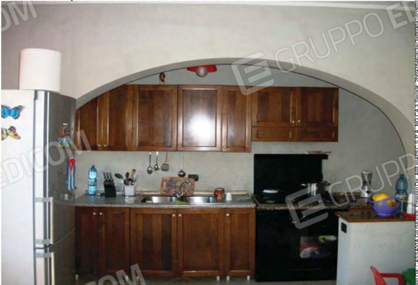
Foto n. 21 -Angolo cucina posto al P.S1 del Fabbricato.