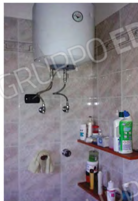
Foto n. 42 , 43 , 44 , 45 - Bagno posto al P.T.M del Fabbricato, composto da Lavabo, WC, Bidet, Vasca da bagno. Bagno semplice, Boiler elettrico per la produzione di acqua calda sanitaria, con la quale si alimenta anche il Bagno posto al P.S1 ed il lavello cucina, quanto questi non vengono alimentato dal termo-camino.