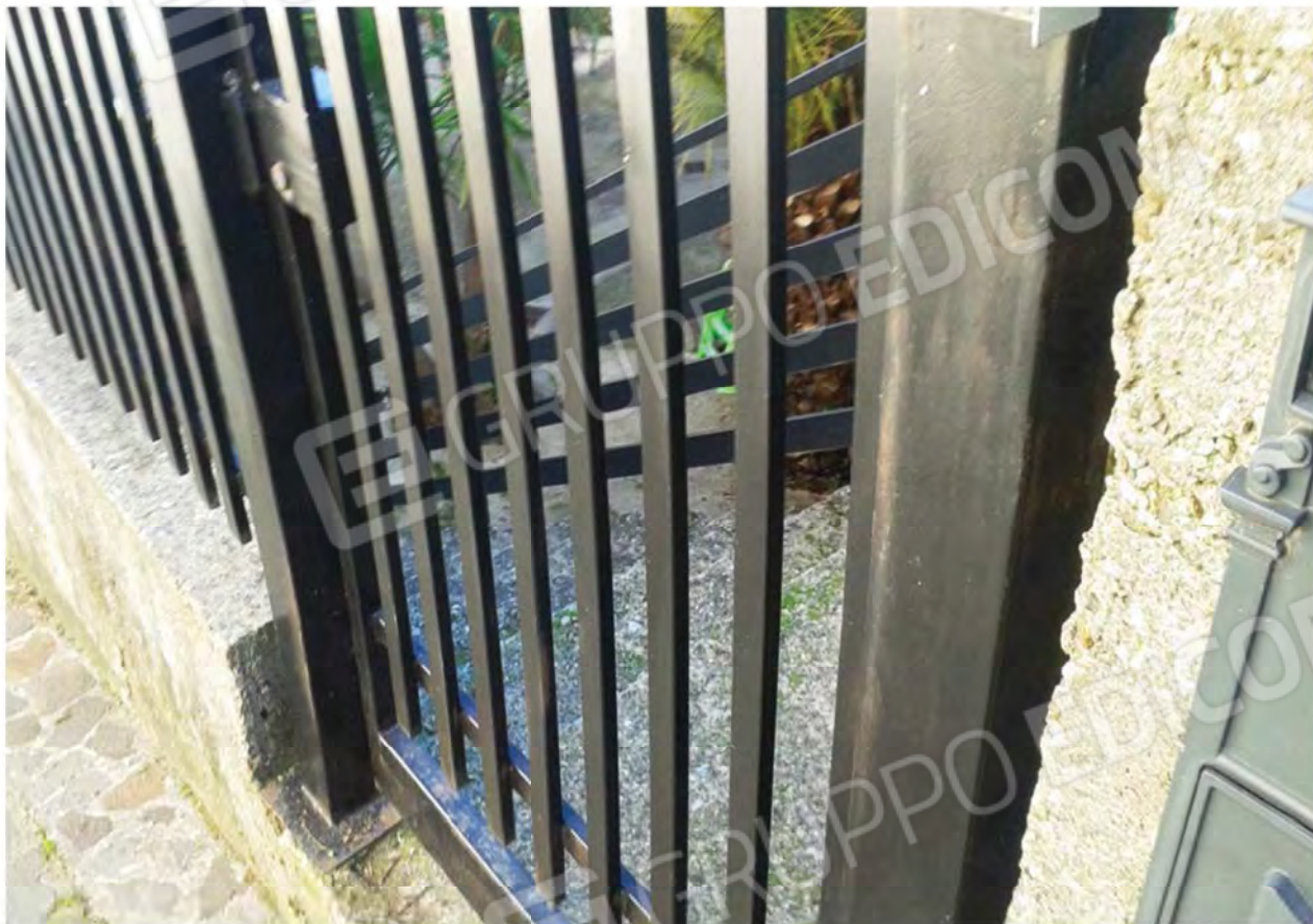
Foto n. 6 - Gradinata di ingresso pedonale alla Corte del Fabbricato.