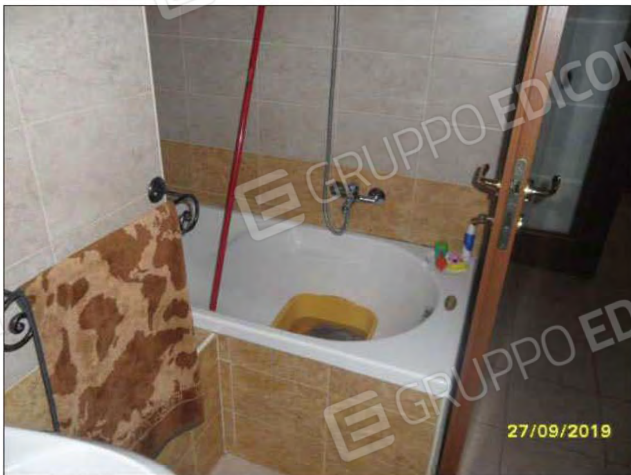
Fotografia n.21: Vista del W.C.1, con evidenza di vasca da bagno e porta attestata su corridoio.