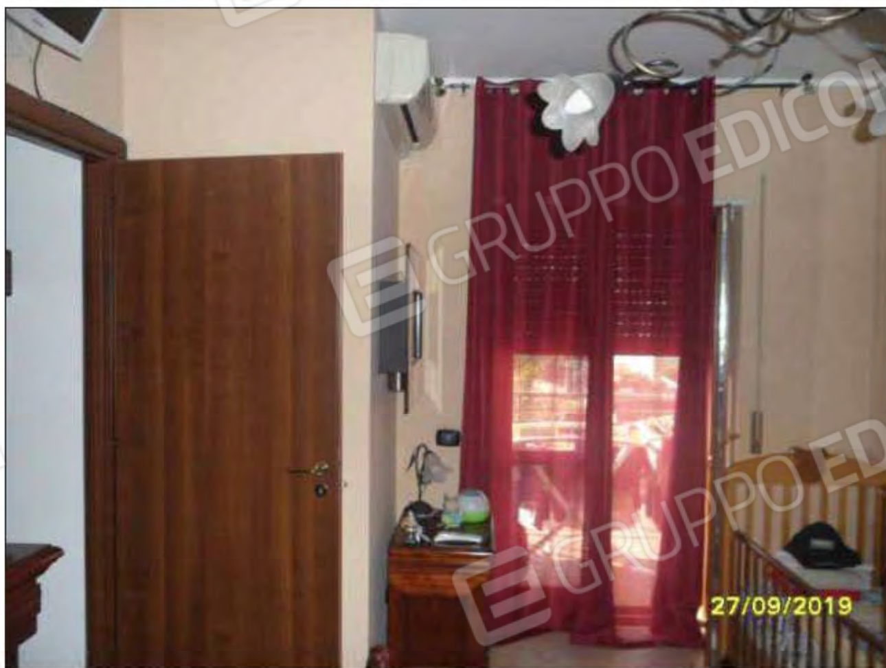
Fotografia n.15: Vista della camera da letto padronale dell'abitazione, con evidenza del balcone e della porta su corridoio