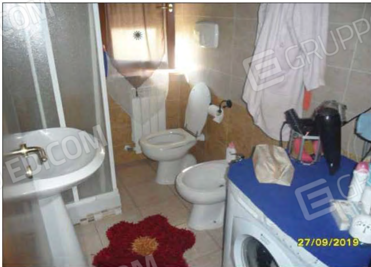
Fotografia n.24: Vista del W.C.2 , con evidenza di tutti i pezzi igienici componenti lo stesso.