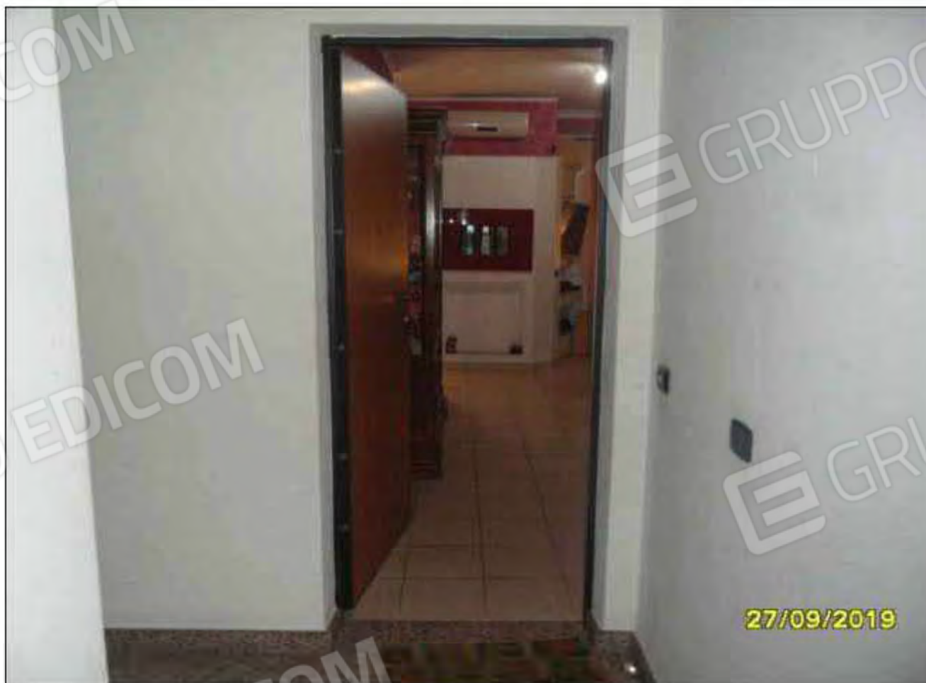
Fotografia n.8: Ingresso all'abitazione: foto scattata dal vano scala condominiale.