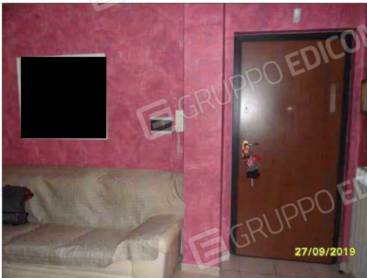
Fotografia n.1: Portoncino di accesso all'immobile; foto scattata dall'ingresso/soggiorno.