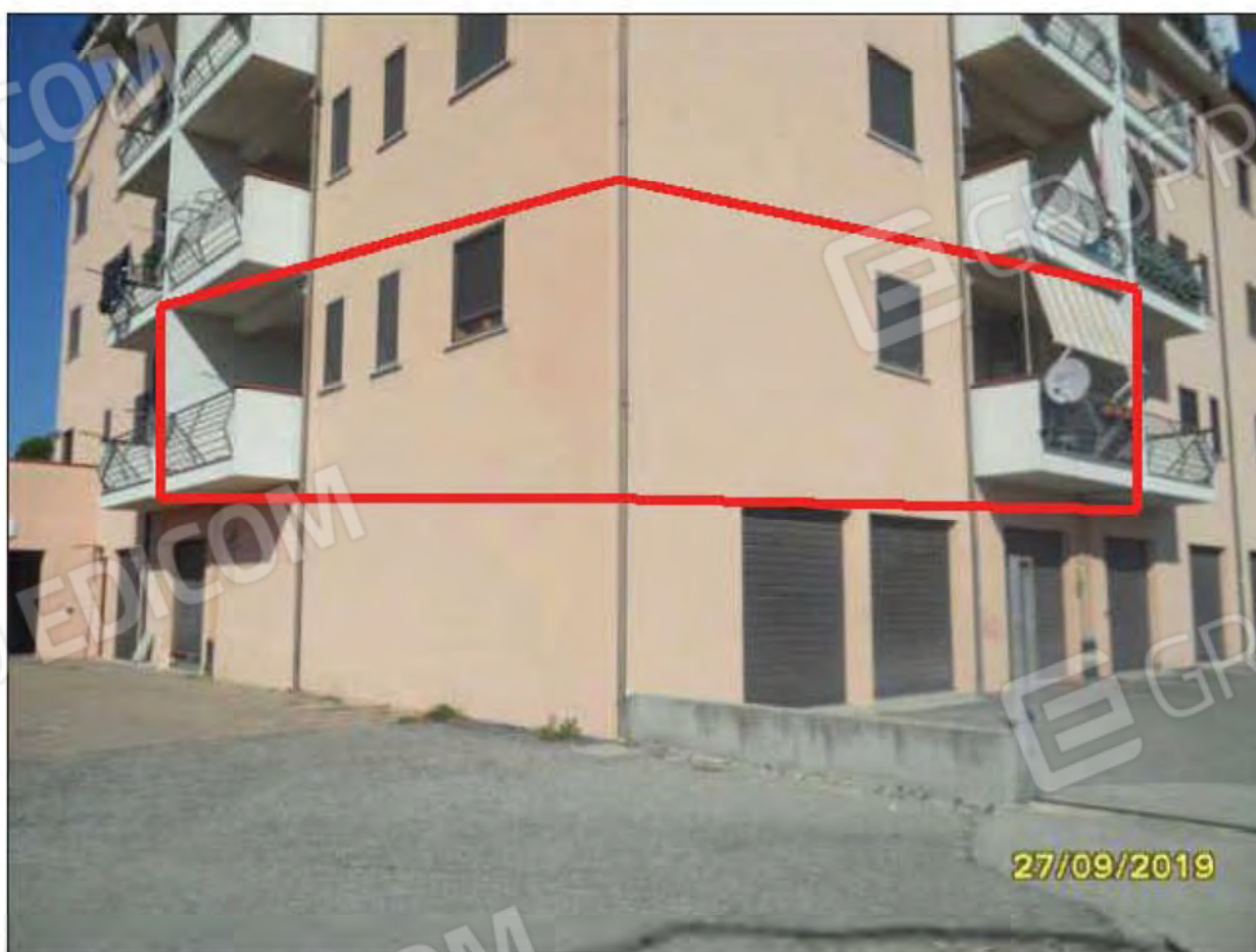
Fotografia n.32: Vista dell'abitazione da corte esterna: facciata attestata su lato Sud e sul lato Est.