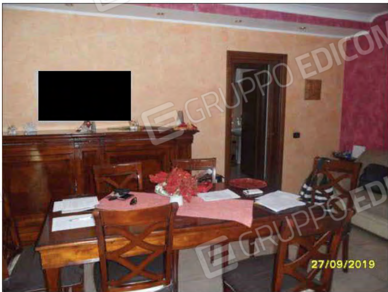
Fotografia n.5: Ingresso/soggiorno con visione dell'ambiente e della porta che adduce al disimpegno.