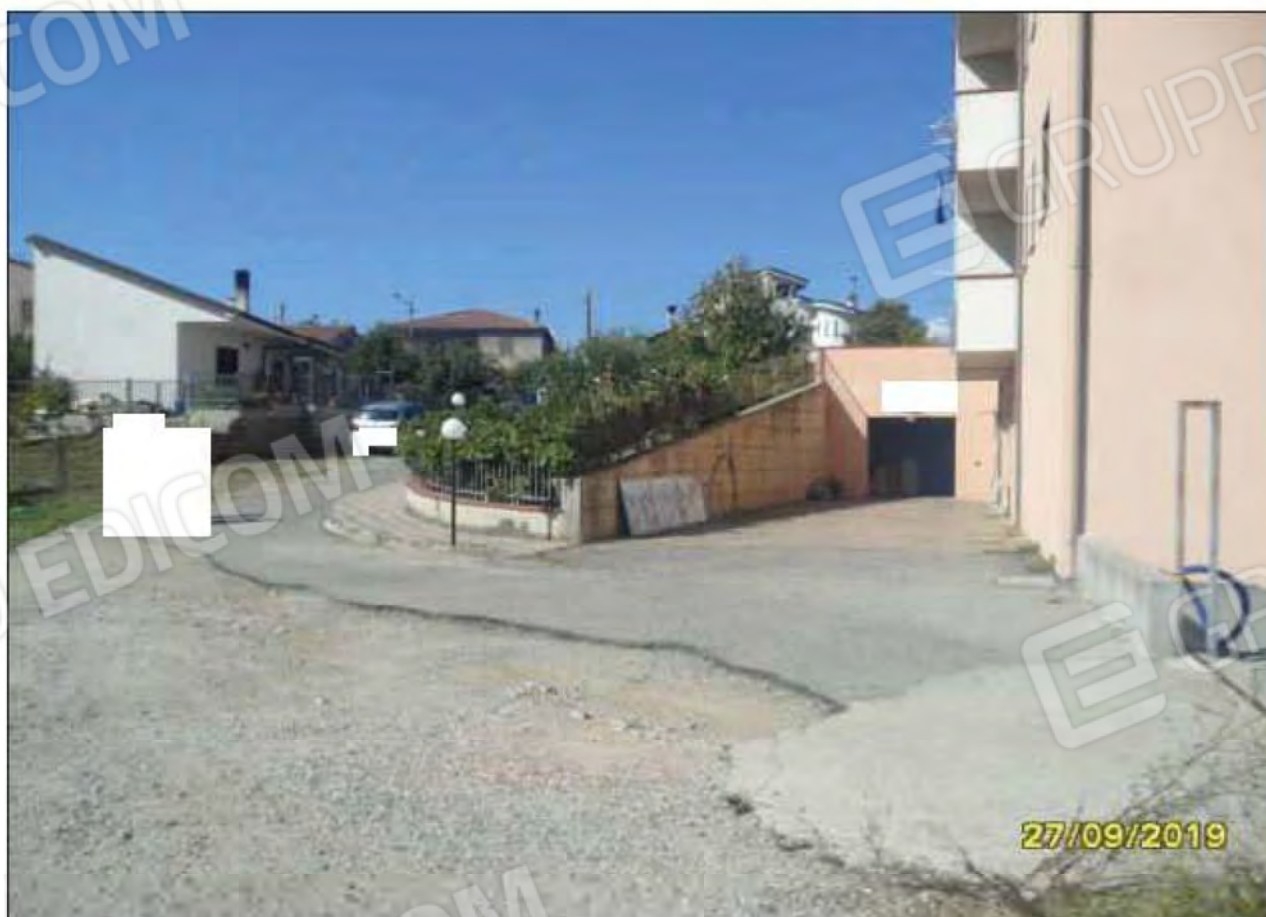
Fotografia n.34: Vista dell'area esterna condominiale all'abitazione, posta sul lato Sud-Est.