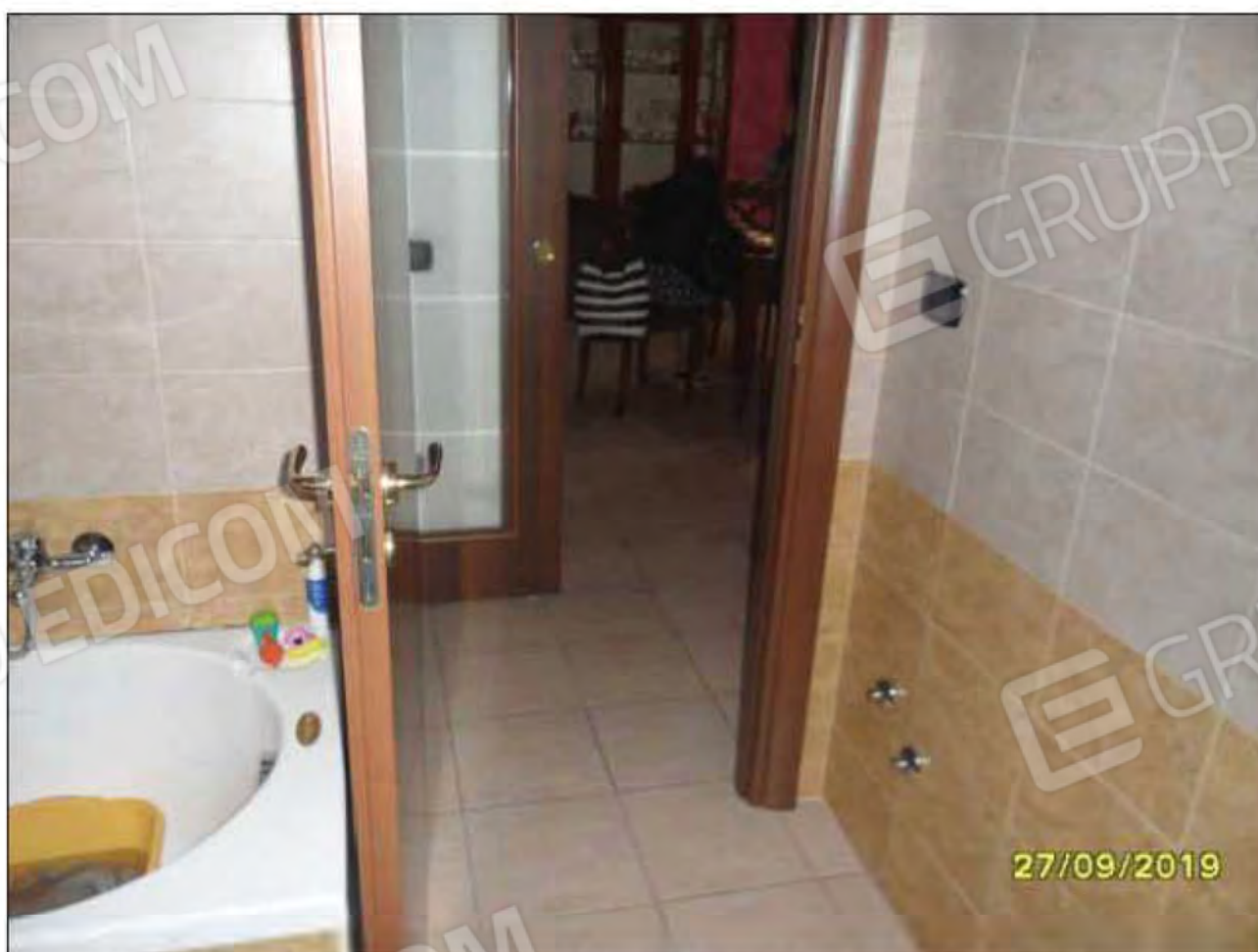
Fotografia n.22: Vista del W.C.1, con evidenza di vasca da bagno e porta attestata su corridoio.