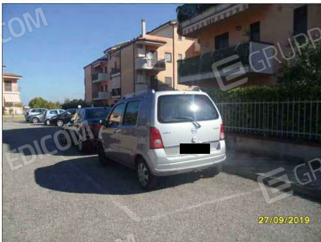
Fotografia n.30: Vista della corte esterna del fabbricato con evidenza del posto auto in dotazione all'appartamento.