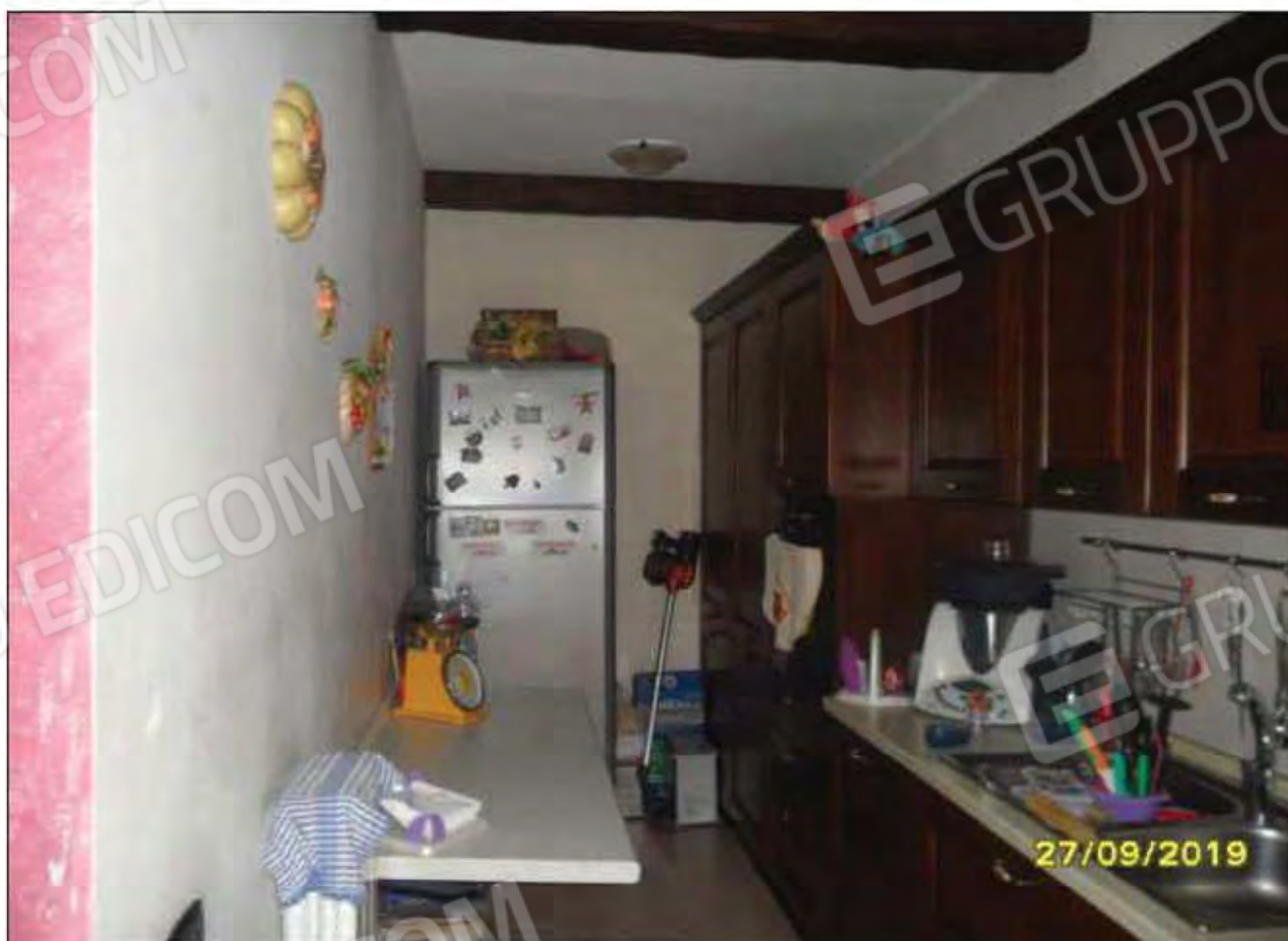
Fotografia n.10: Vista della cucina dell'abitazione.