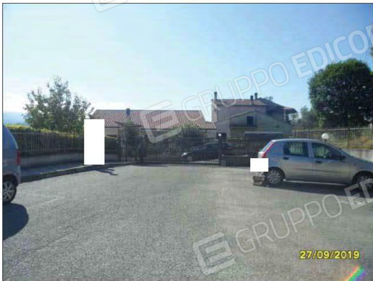
Fotografia n.29: Vista della corte esterna del fabbricato con evidenza del cancello, pedonale e carrabile, di accesso.