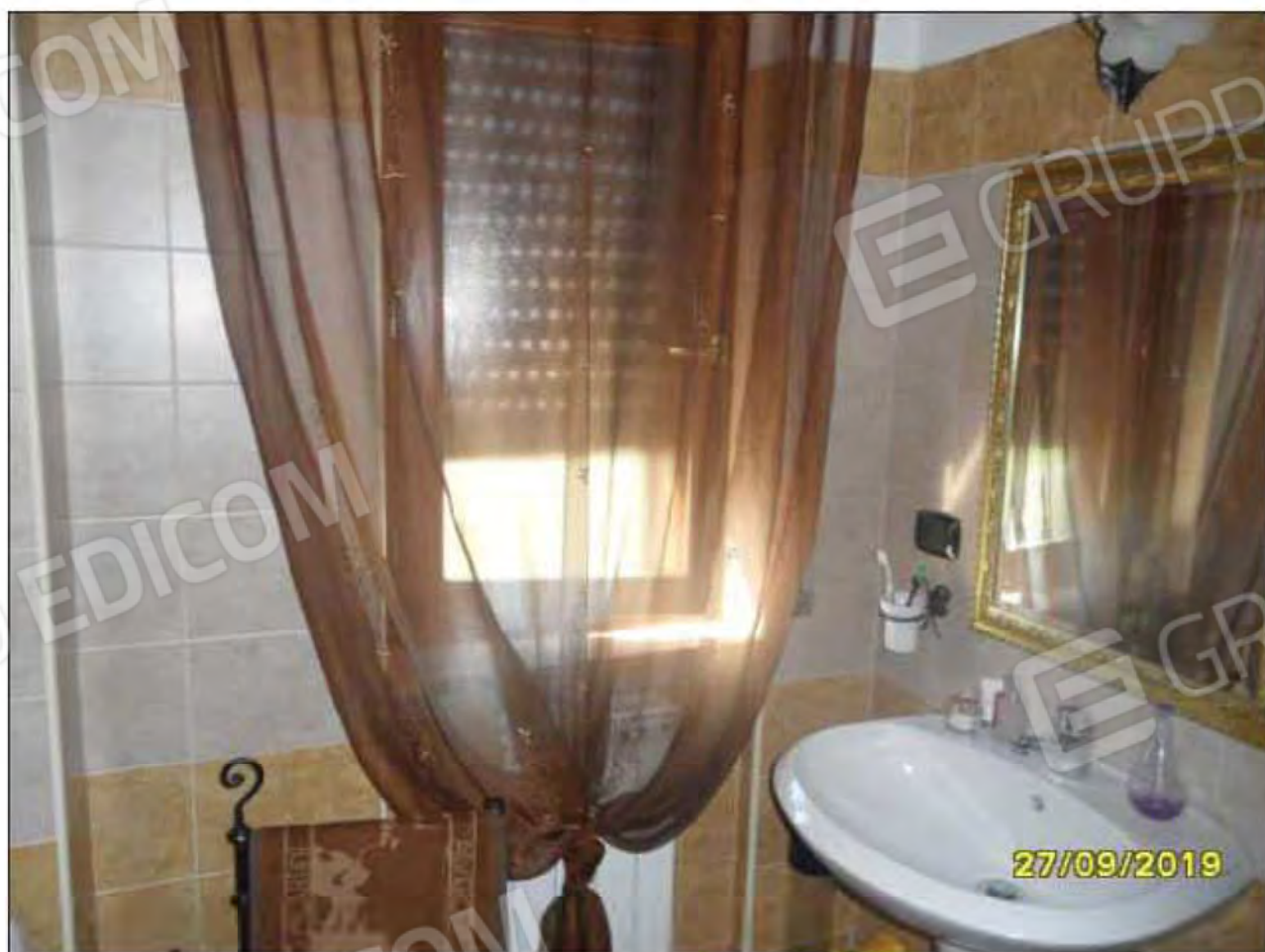
Fotografia n.20: Vista del W.C.1, con evidenza di finestra (attestata sul lato Sud) e lavabo.