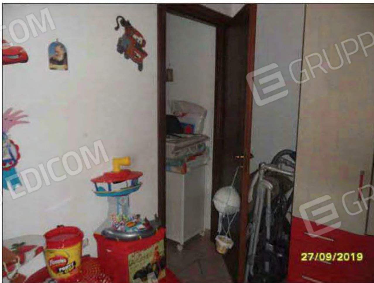
Fotografia n.28: Vista della camera da letto 2, adibita a stanza da letto per bambino. (evidenza della porta su corridoio).