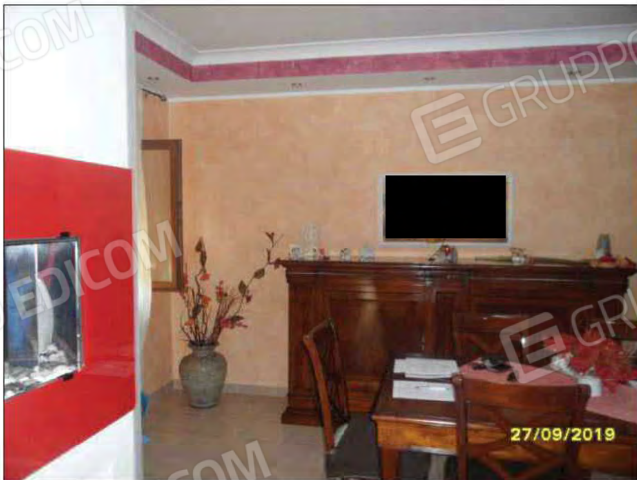
Fotografia n.6: Ingresso/soggiorno con visione ambiente: piastrelle, battiscopa, intonaco, pittura, profilo cartongesso etc..