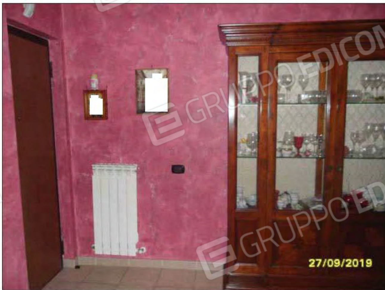
Fotografia n.3: Ingresso/soggiorno con visione del portoncino di ingresso all'abitazione.