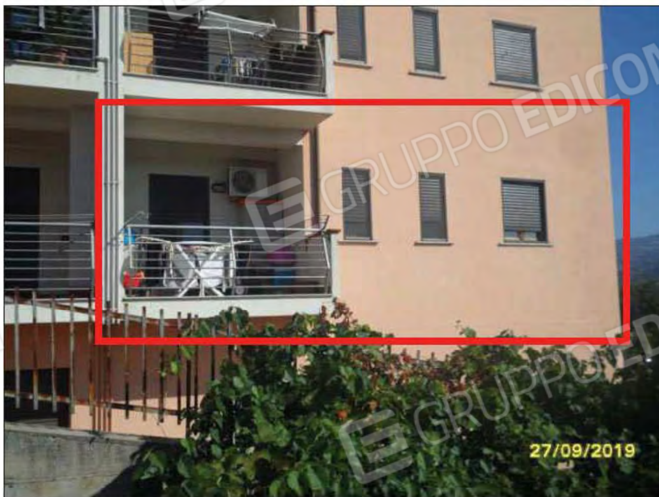
Fotografia n.31: Vista dell'abitazione da corte esterna: facciata attestata su lato Sud.