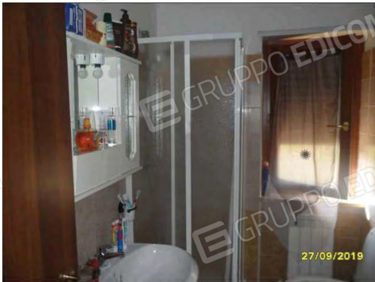
Fotografia n.23: Vista del W.C.2 , con evidenza di vasca di lavabo e finestra attestata su lato Sud dell'abitazione.