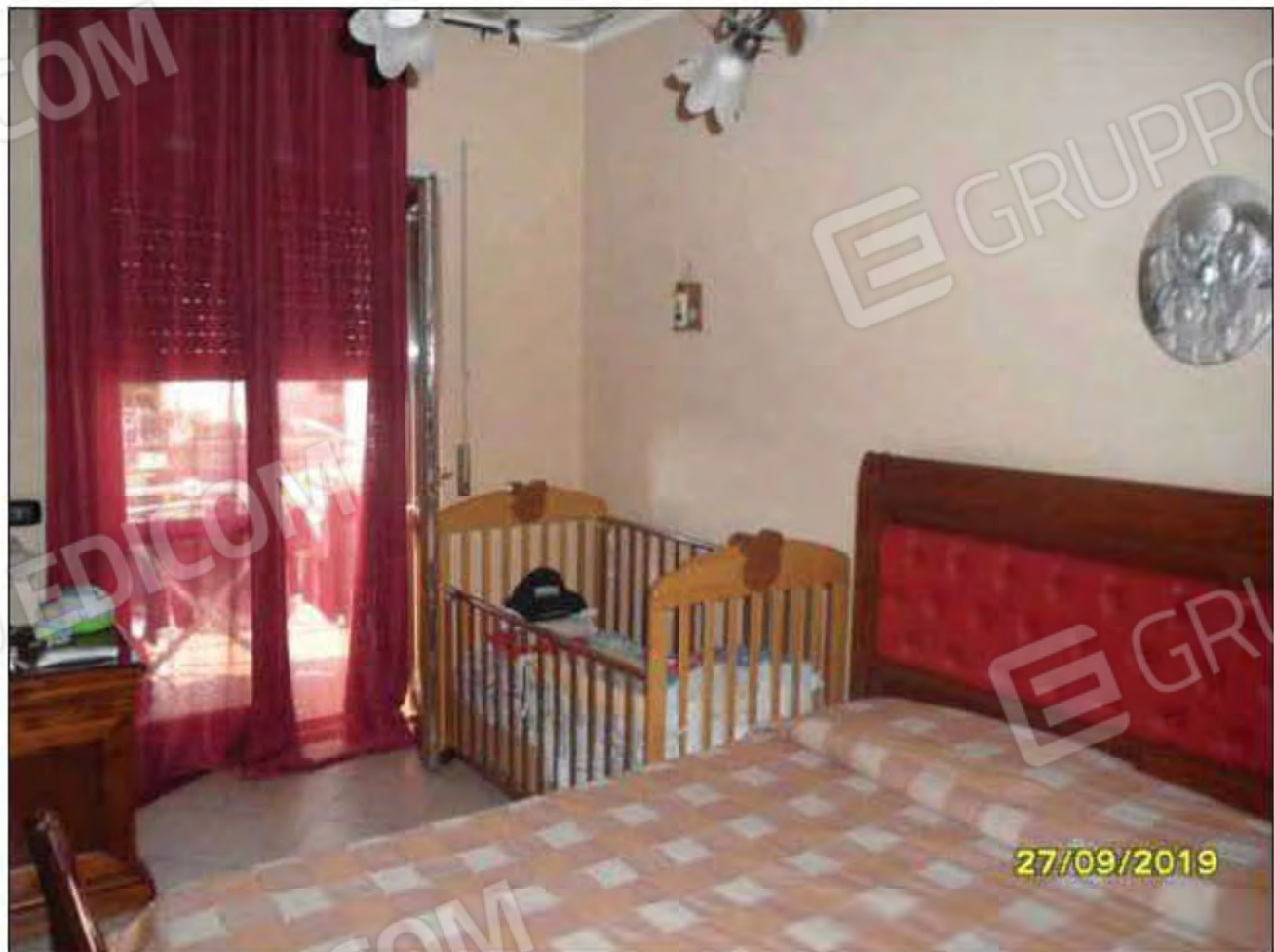
Fotografia n.14: Vista della camera da letto padronale dell'abitazione, con evidenza del balcone attestato sul lato Sud.