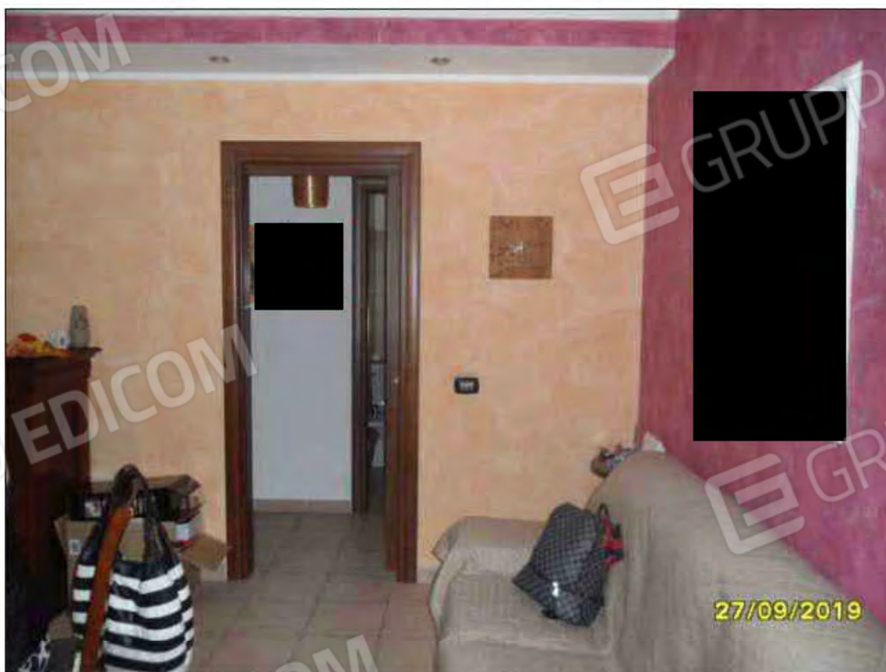
Fotografia n.2: Ingresso/soggiorno con visione di porta che adduce al disimpegno.