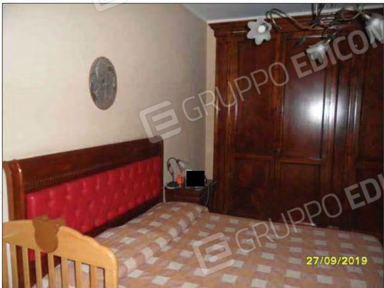
Fotografia n.13: Vista della camera da letto padronale dell'abitazione.