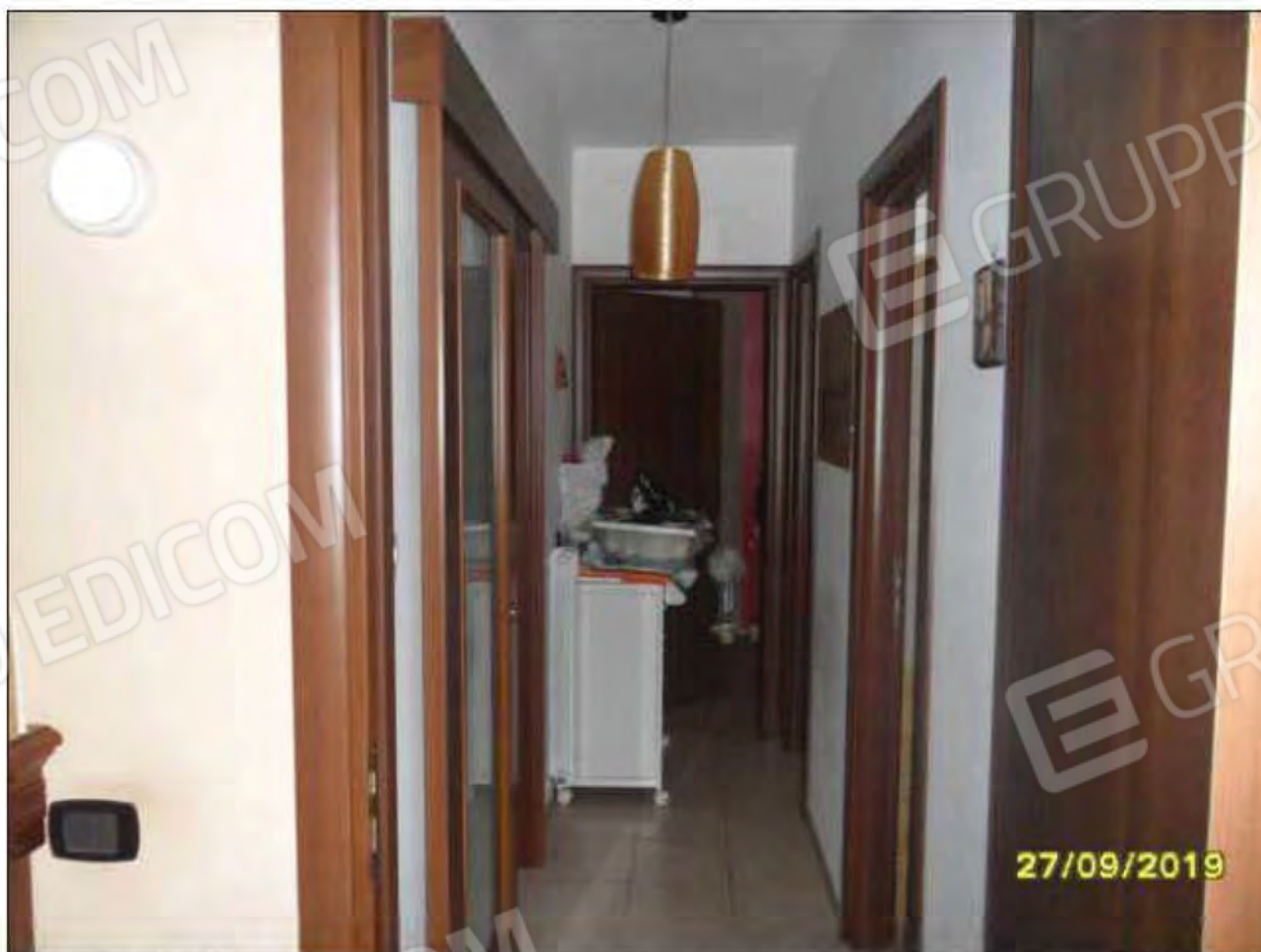
Fotografia n.18: Vista corridoio di collegamento tra le varie camere. (Foto scattata dalla camera da letto padronale).