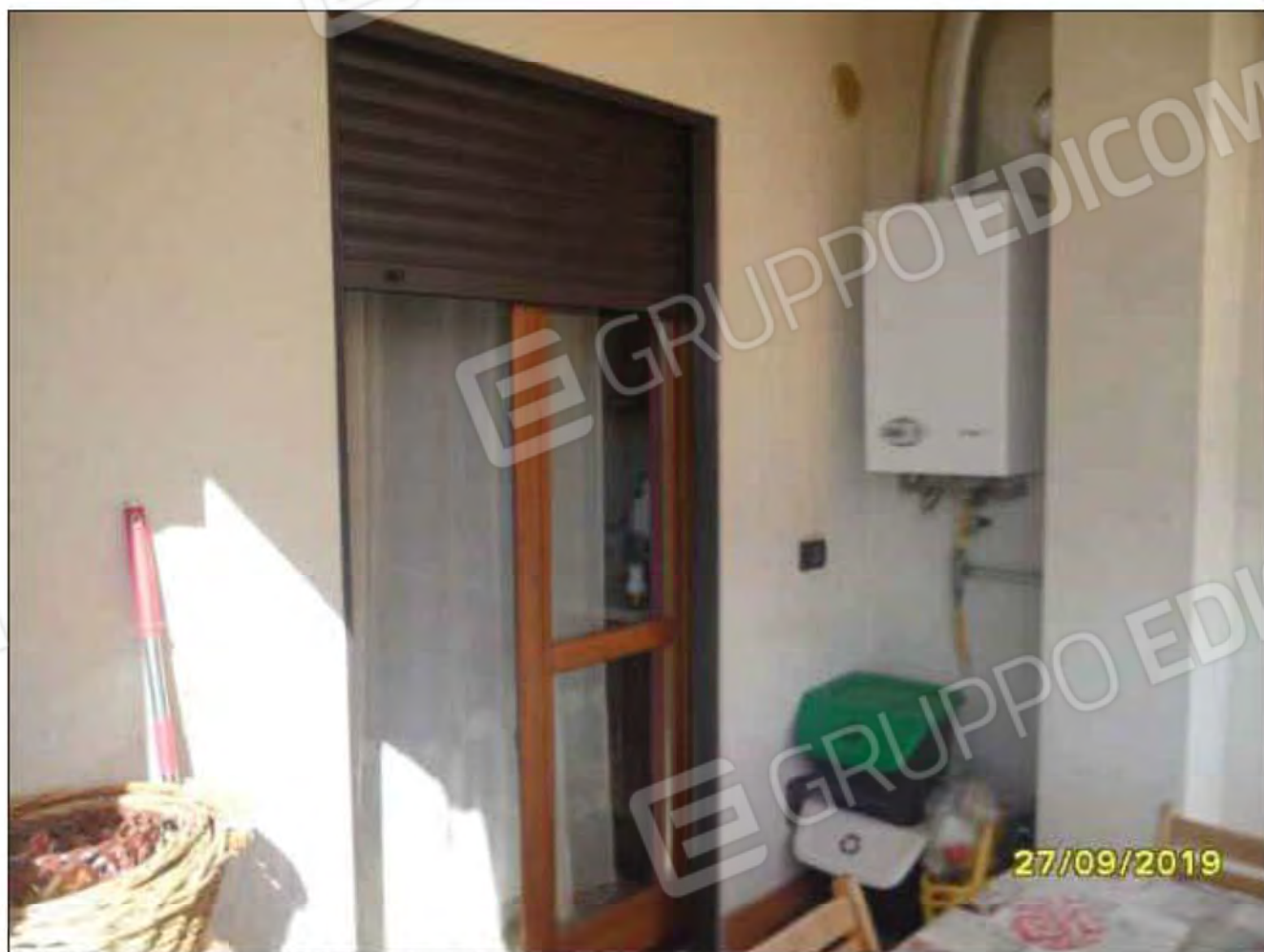
Fotografia n.11: Vista del balcone attestato sulla cucina, sul lato Est dell'immobile.