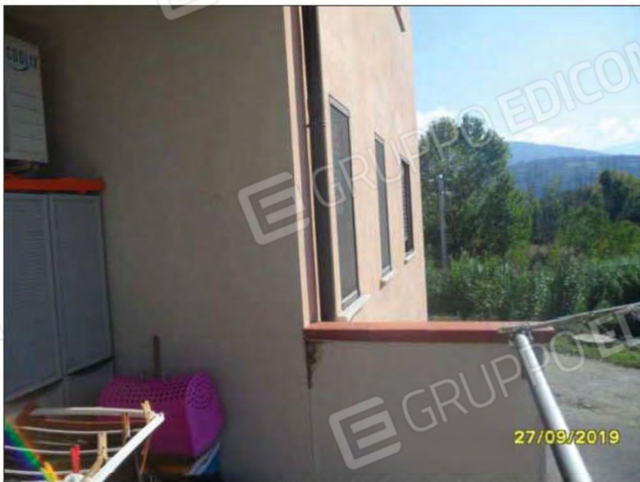
Fotografia n.17: Vista del balcone dalla camera da letto padronale, con esposizione sul lato Sud e Est(catena appenninica)