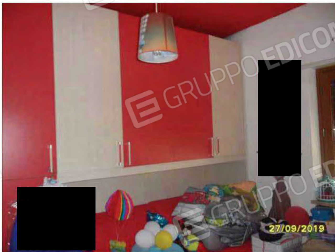
Fotografia n.27: Vista della camera da letto 2, adibita a stanza da letto per bambino. (evidenza dell'armadio esistente).