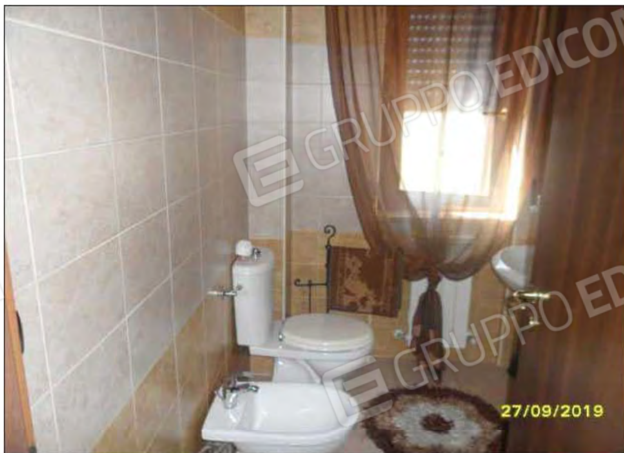
Fotografia n.19: Vista del W.C.1 (foto scattata dal corridoio), con evidenza di rifinitura in piastrella.