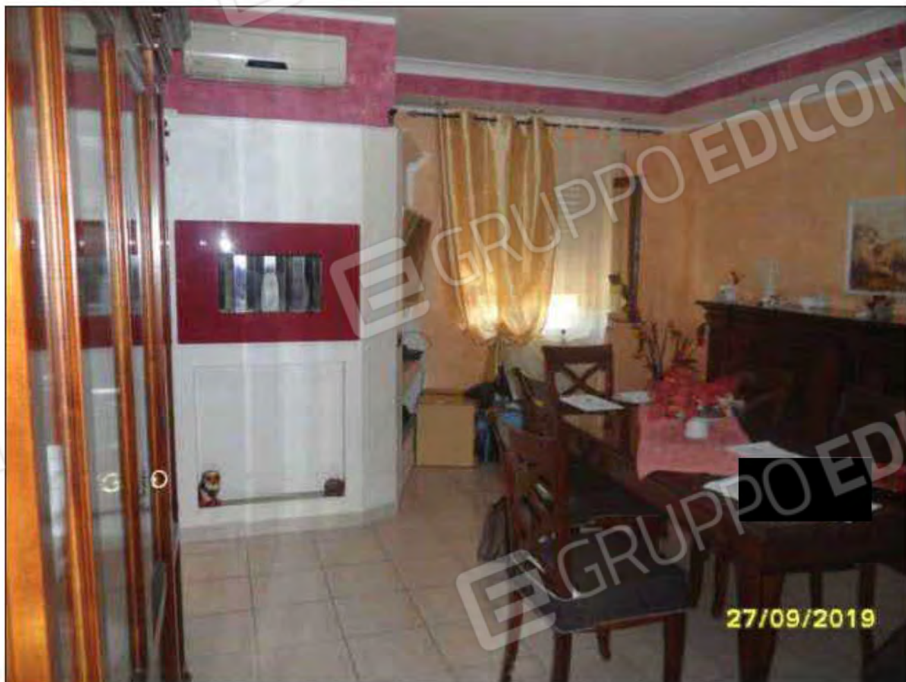
Fotografia n.7: Ingresso/soggiorno con visione finestra su lato Est dell'abitazione civile.