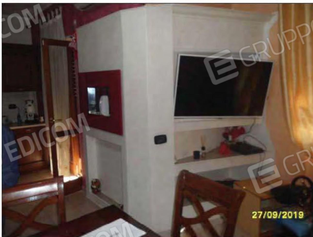
Fotografia n.4: Ingresso/soggiorno con visione di parete attrezzata e balcone su lato Est dell'abitazione.