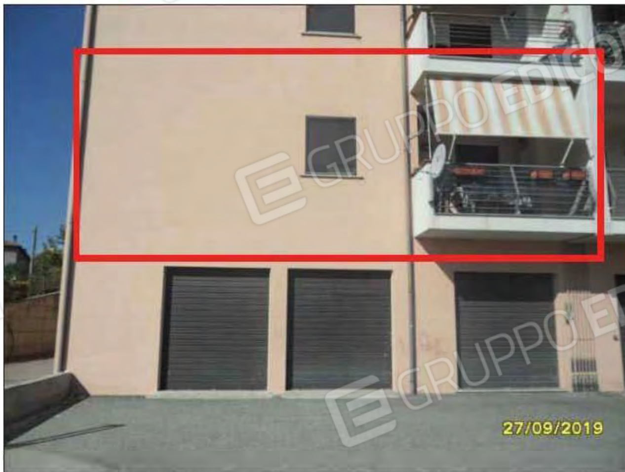
Fotografia n.33: Vista dell'abitazione da corte esterna: facciata attestata su lato Est. (Esclusi tutti i magazzini del piano seminterrato, non interessati, in alcun modo, dalla procedura di esecuzione immobiliare)