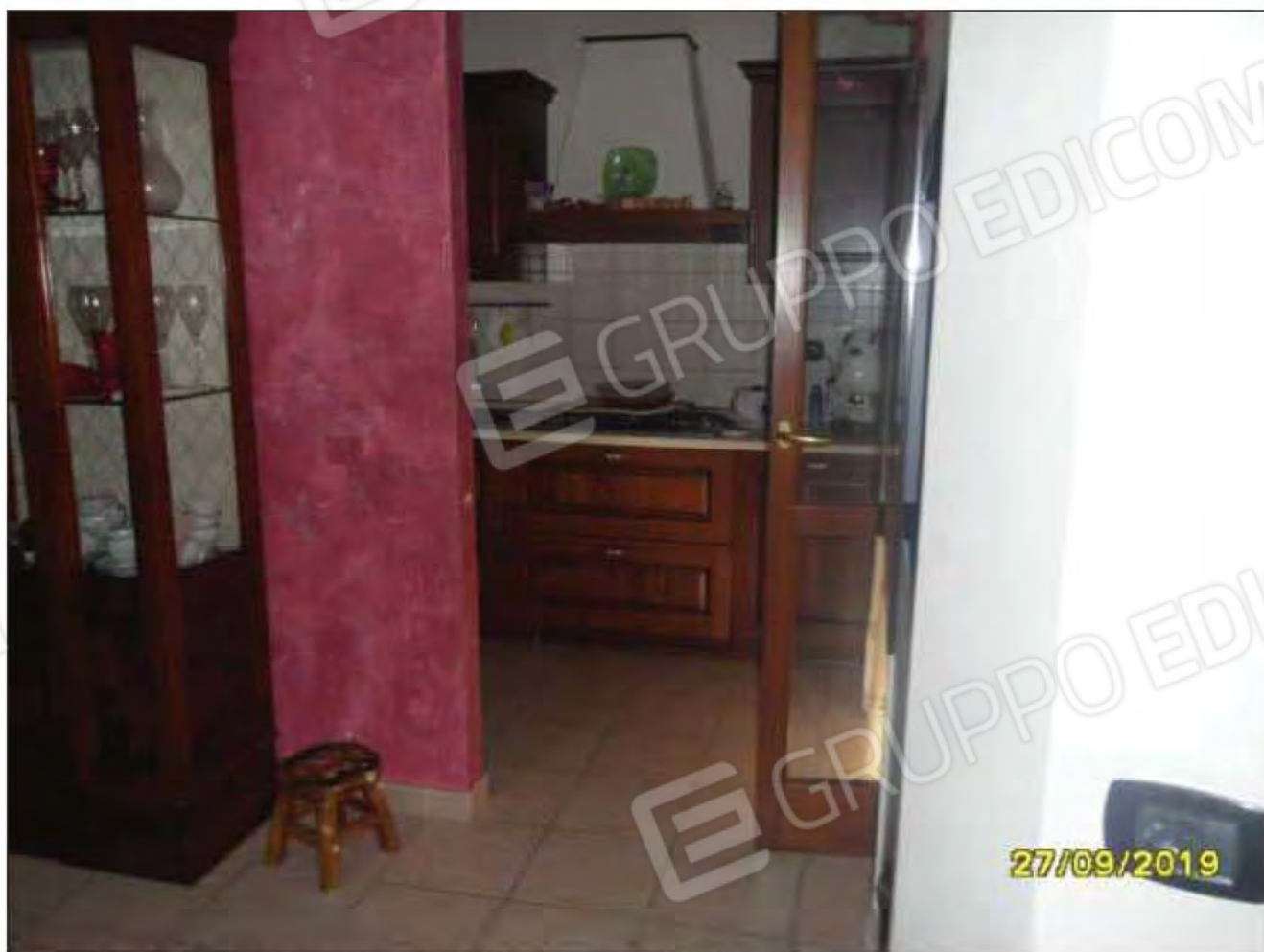
Fotografia n.9: Ingresso/soggiorno con visione su cucina dell'abitazione.