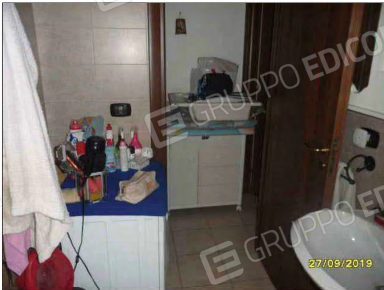
Fotografia n.25: Vista del W.C.2 , con evidenza della porta di accesso attestata sul corridoio (disimpegno).