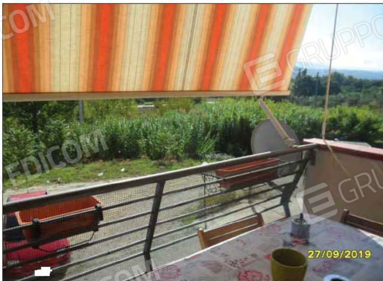
Fotografia n.12: Vista dal balcone della cucina, verso corte esterna, sul lato Est dell'immobile.