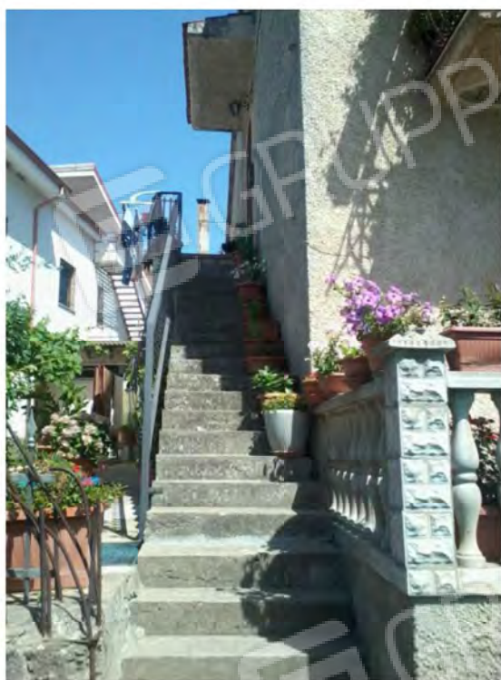
Scala Esterna di accesso all'immobile