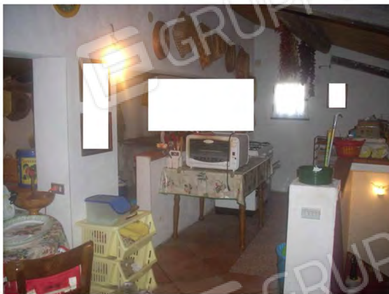
Vani interno appartamento: Soffitta – sottotetto