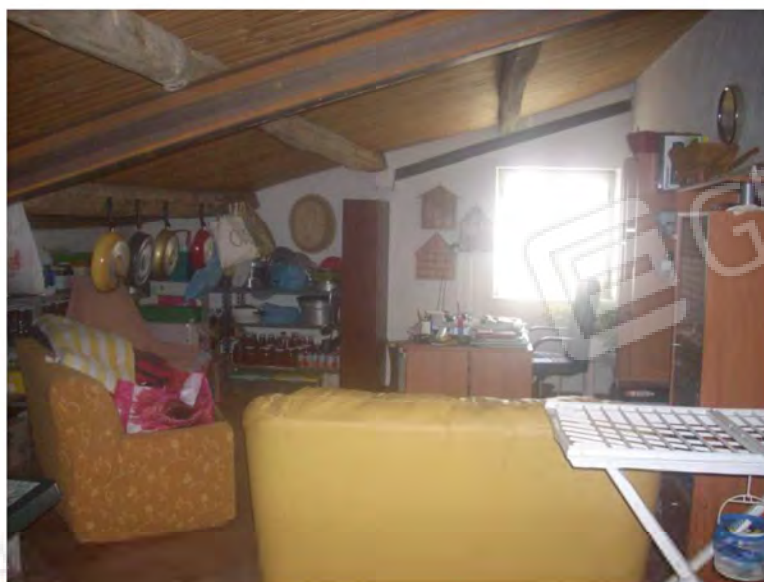
Vani interno appartamento: Soffitta - sottotetto