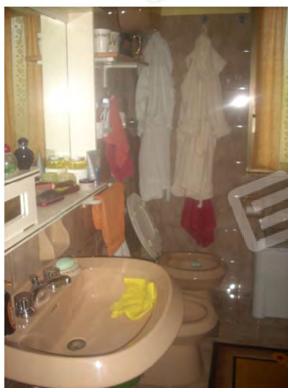
Vani interno appartamento: Bagno