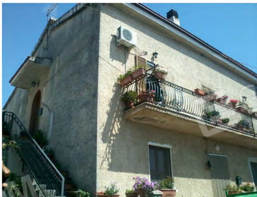
Vista esterno fabbricato – lato Sud - Ovest