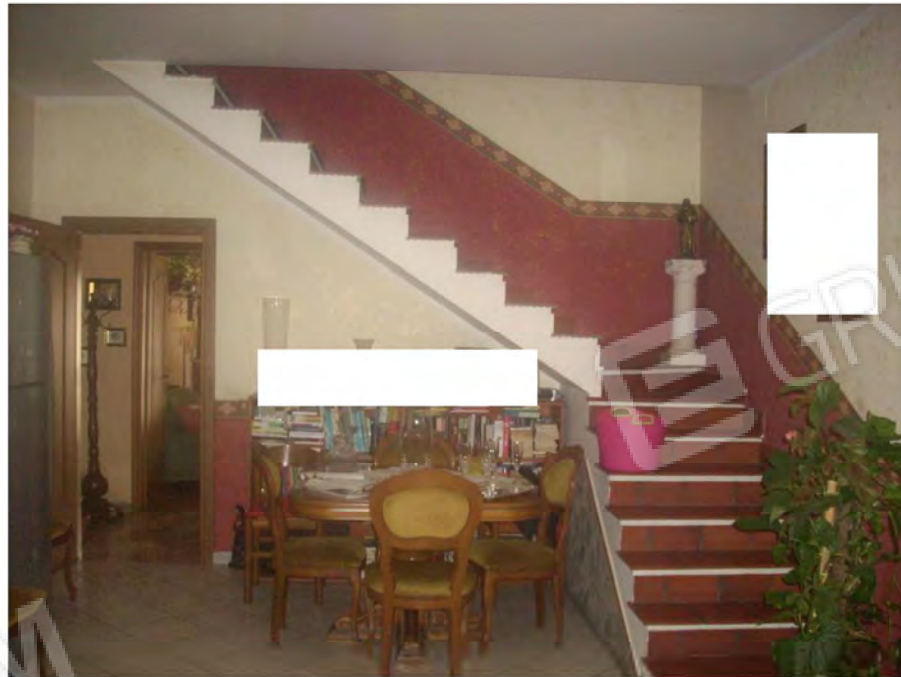
Vani interno appartamento: Soggiorno