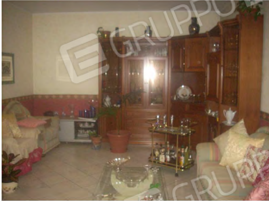
Vani interno appartamento: Soggiorno