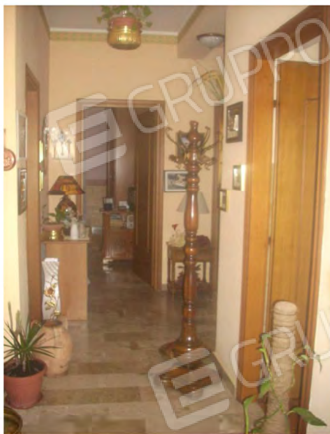
Ingresso - corridoio