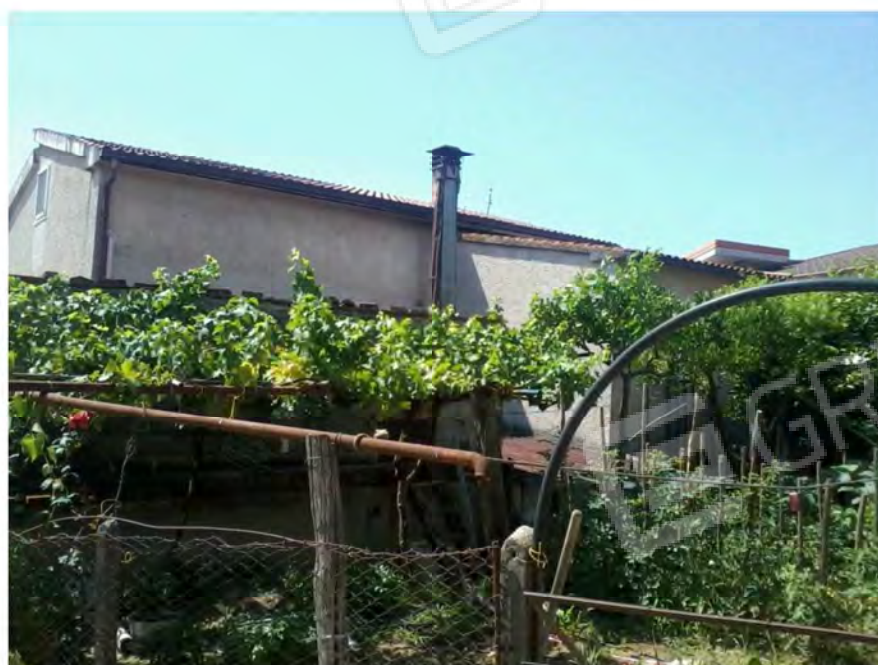
Vista esterno fabbricato – lato Nord