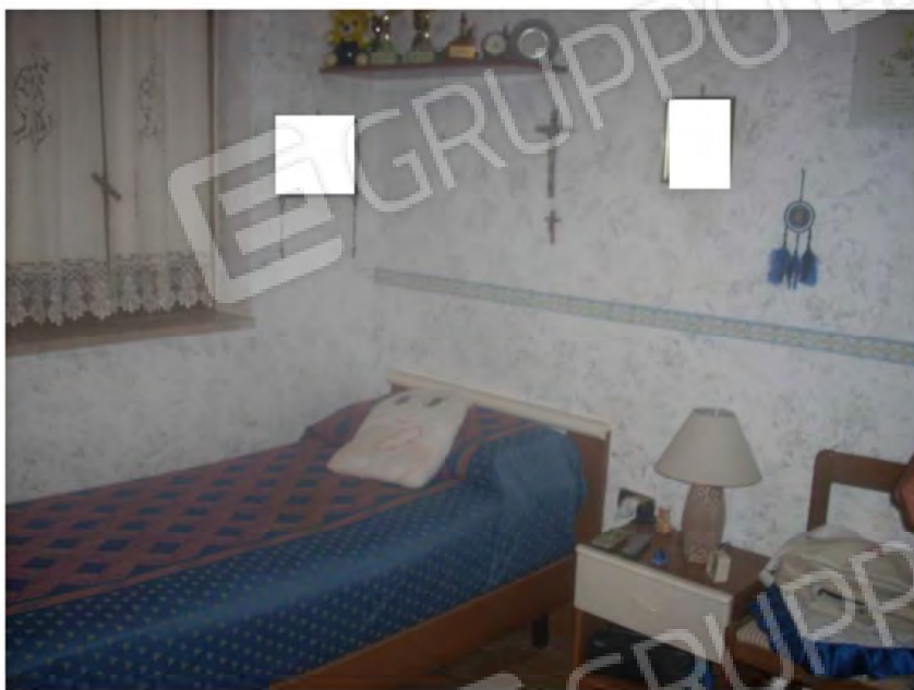
Vani interno appartamento: Camera da letto