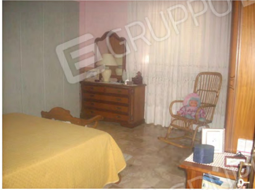
Vani interno appartamento: Camera da letto