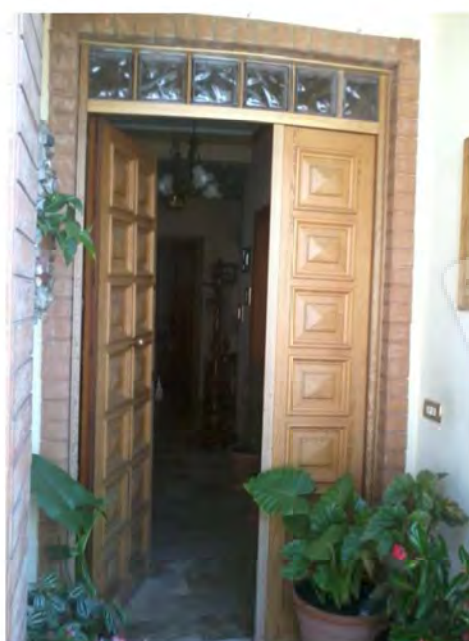
Porta di accesso all'immobile