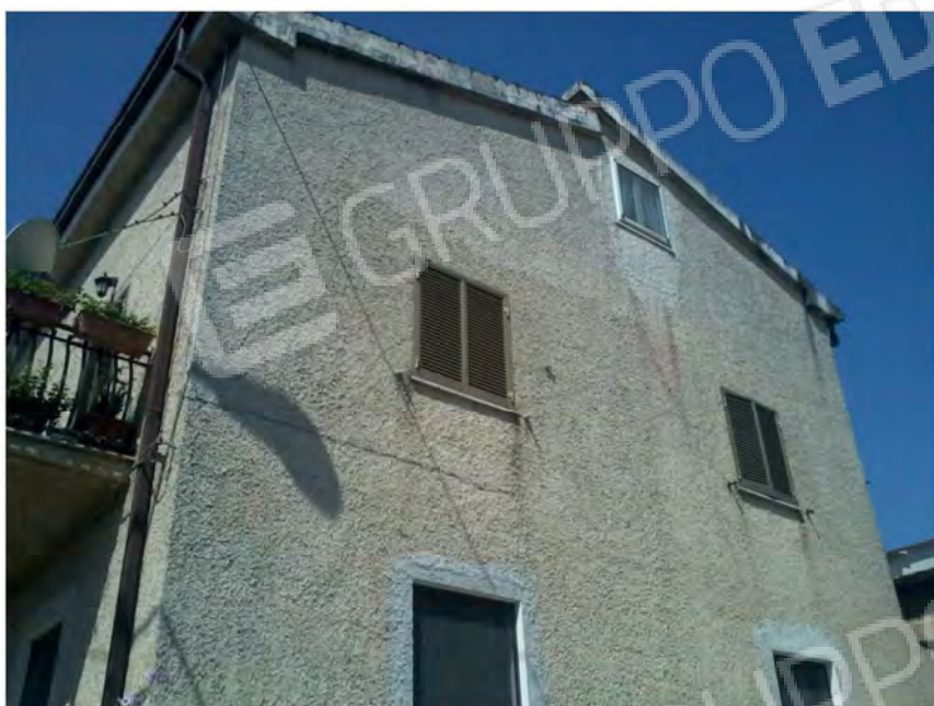
Vista esterno fabbricato – lato Est