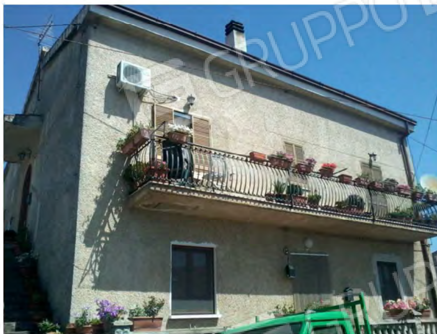
Vista esterno fabbricato – lato Sud