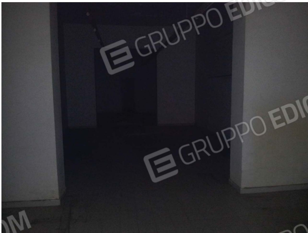
Interno lotto n. 2