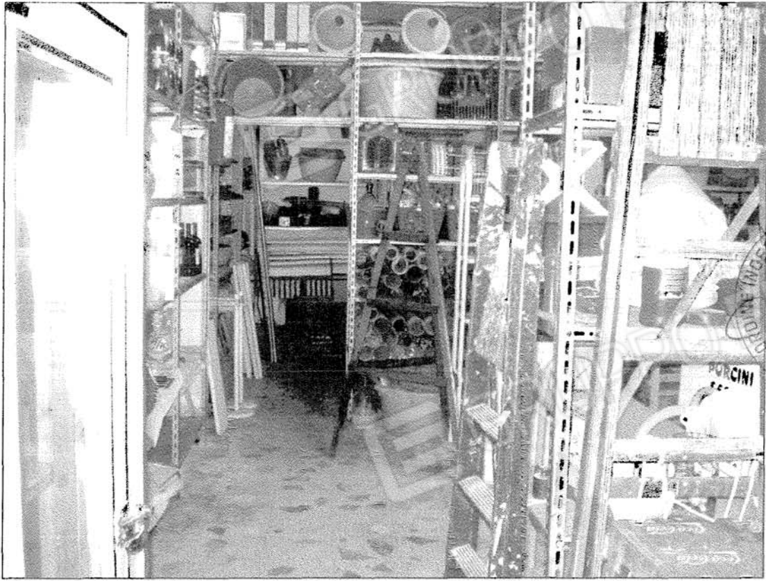
Foto 9 Vista interna dei magazzini di altezza 3,5 m compresi nel lotto n. 4