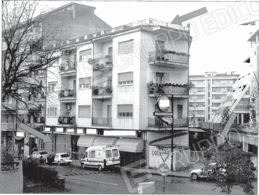
Foto 1 Fabbricato edificato sulla Part. 138 del Fg 3di Cosenza, Via Panebianco con vista del Lotto 1, dell'ingresso alla corte e del lastrico solare del Lotto 2