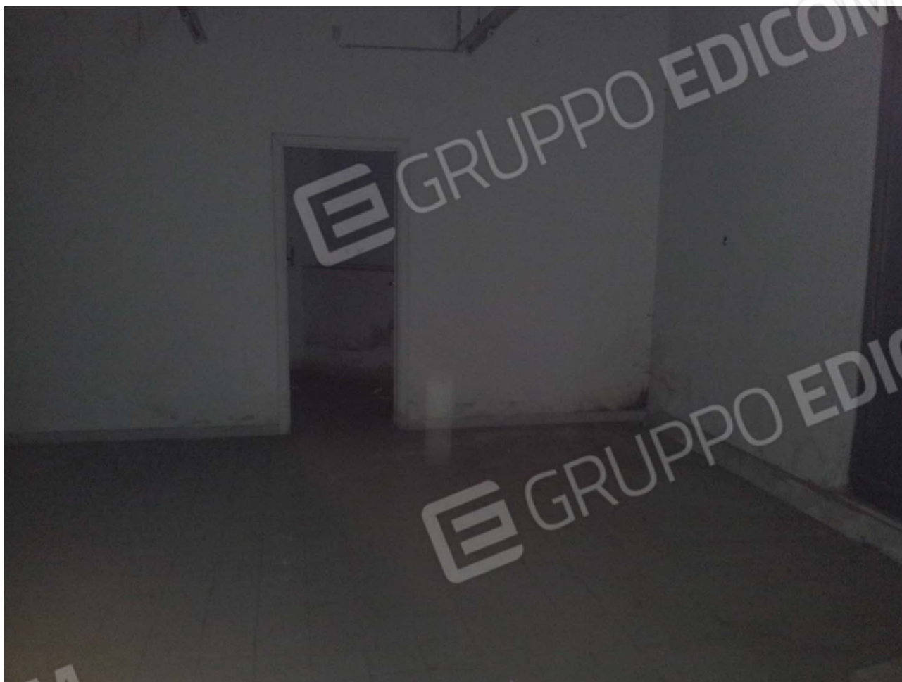
Interno Lotto n. 2