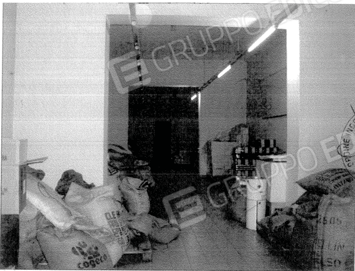
Foto 5 – Vista interna delle unità immobiliari costituenti il lotto n. 2. Fg 3 part. 138 subb 12, 13 e 14