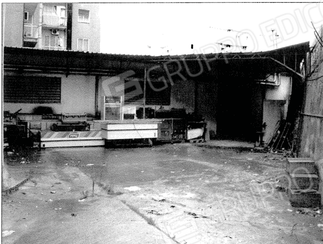
Foto 4 – Vista esterna delle unità immobiliari costituenti il lotto n. 2. Fg 3 part. 138 subb 12, 13 e 14 - Corte