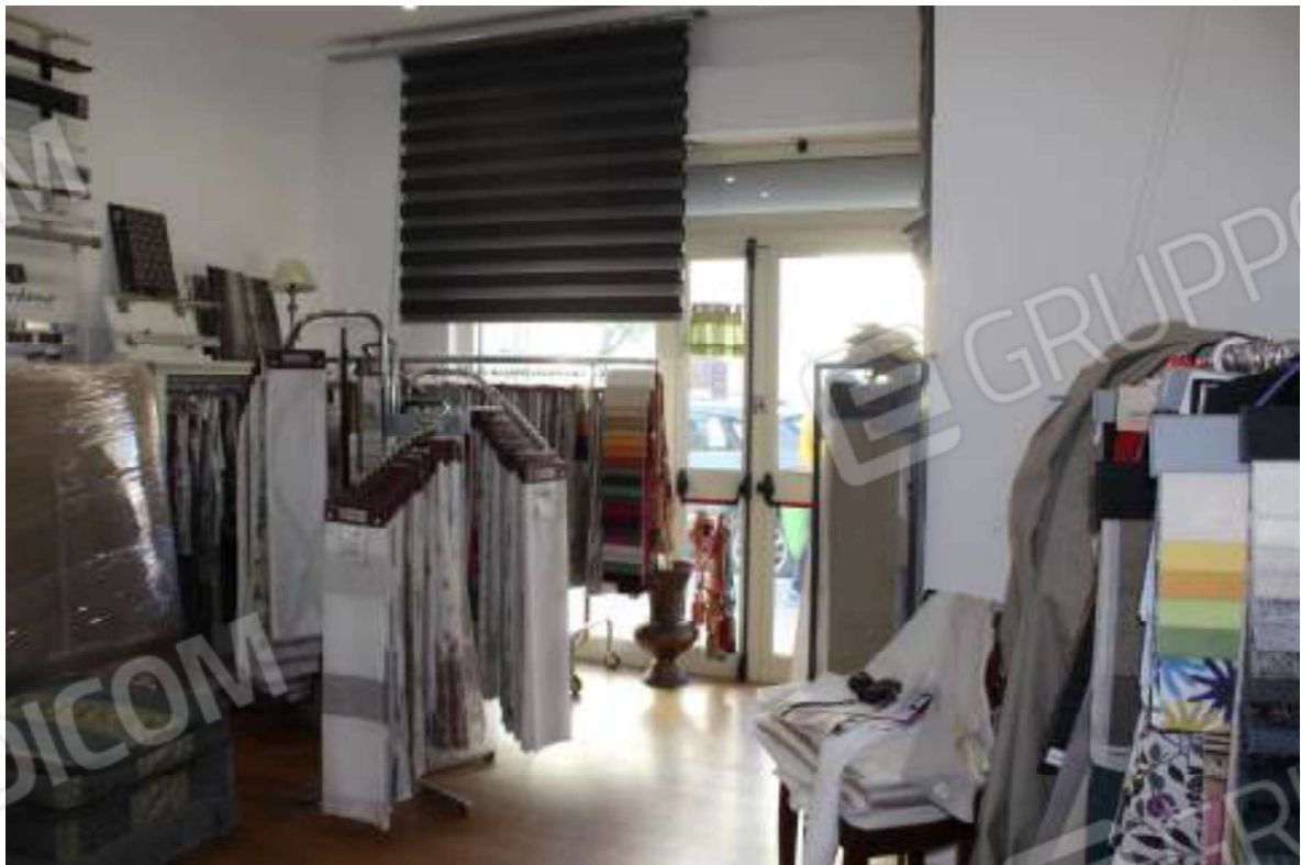
Foto 10.2.6_Vista locale di Vendita tappezzeria