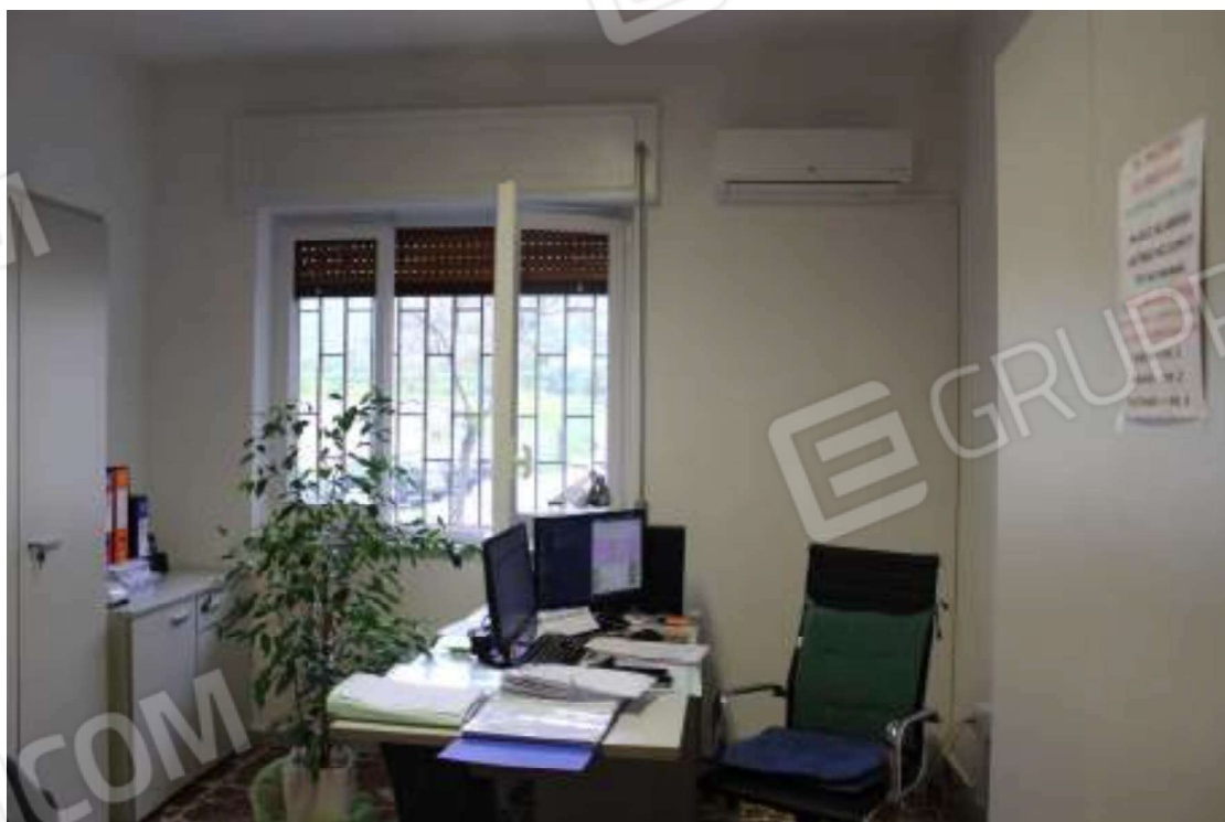
Foto 10.5.4_Vista Ufficio