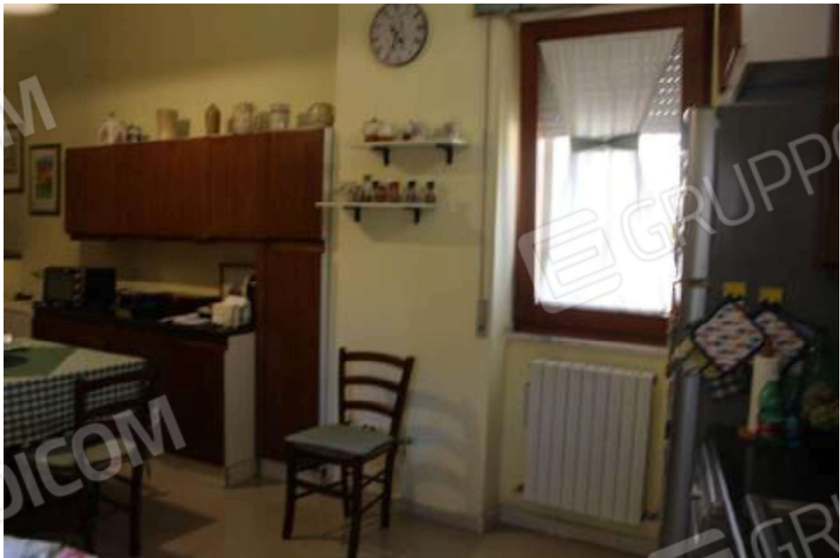
Foto 10.1.4_ Vista Cucina al Paino Primo