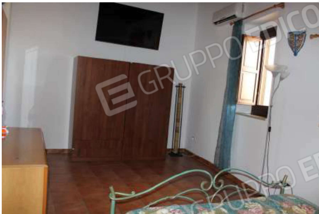
Foto 10.6.3_Vista Camera da Letto