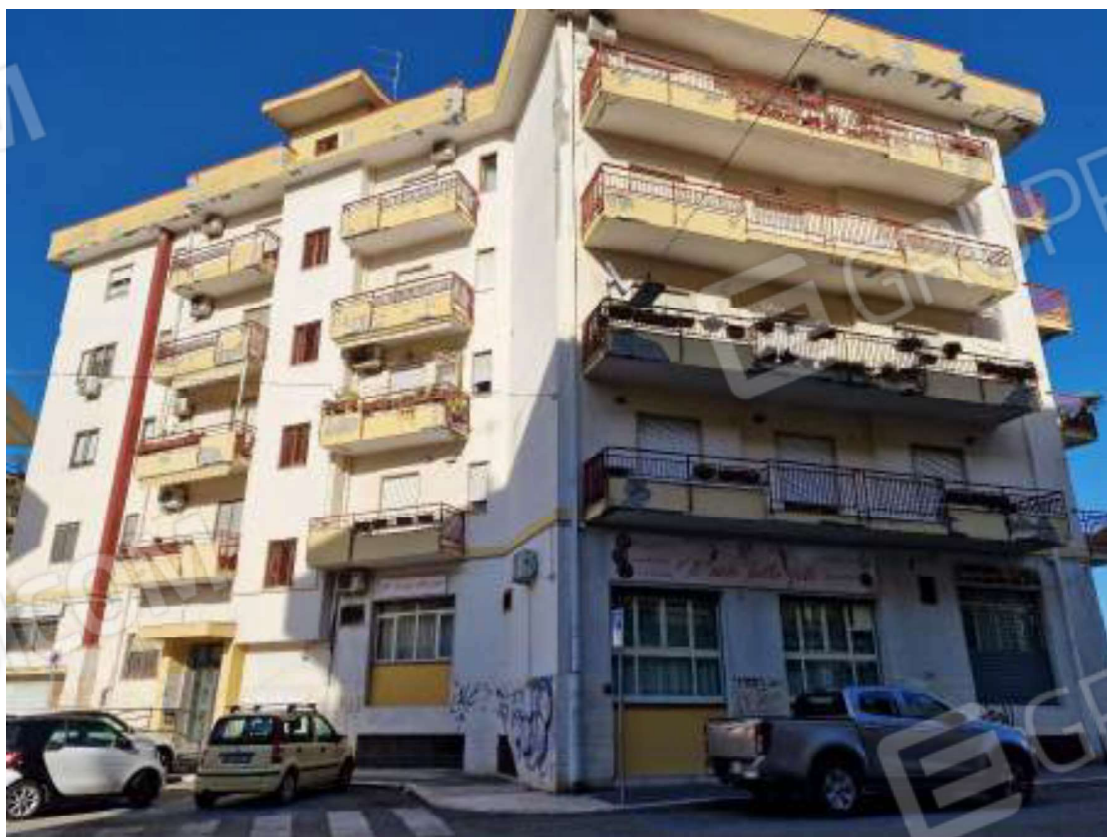
Foto 10.3.12_Vista Edificio