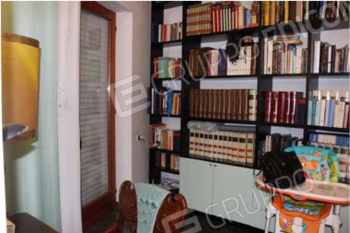
Foto 10.1.5_Vista Studio al Piano Primo