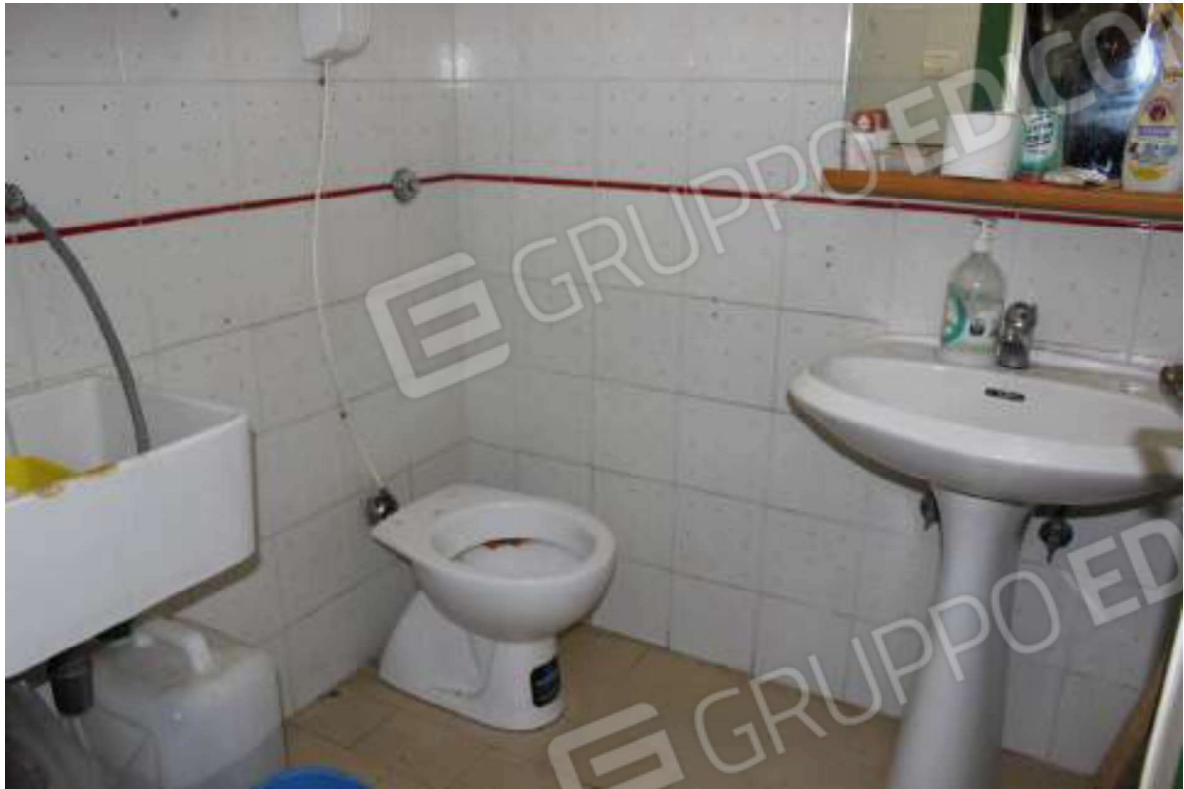
Foto 10.2.5_Vista W.C.