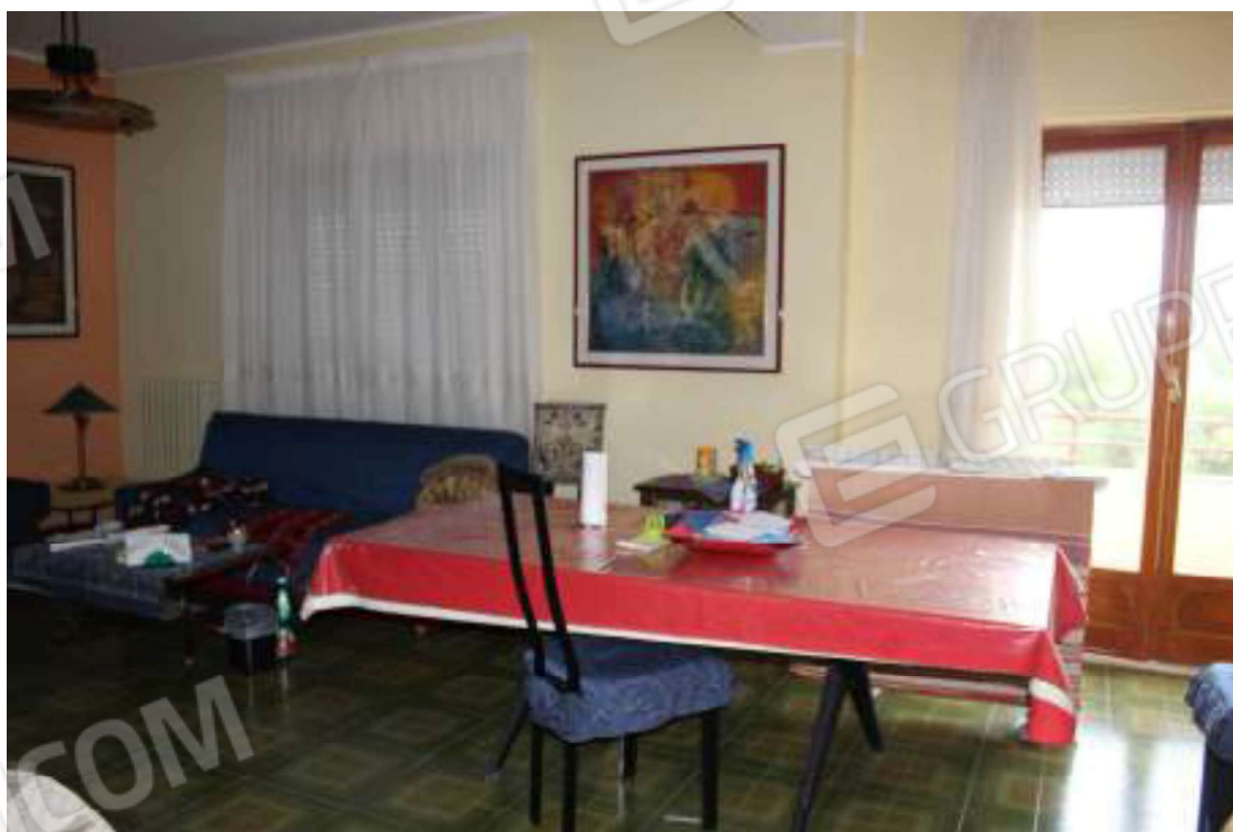
Foto 10.4.6_Vista Soggiorno