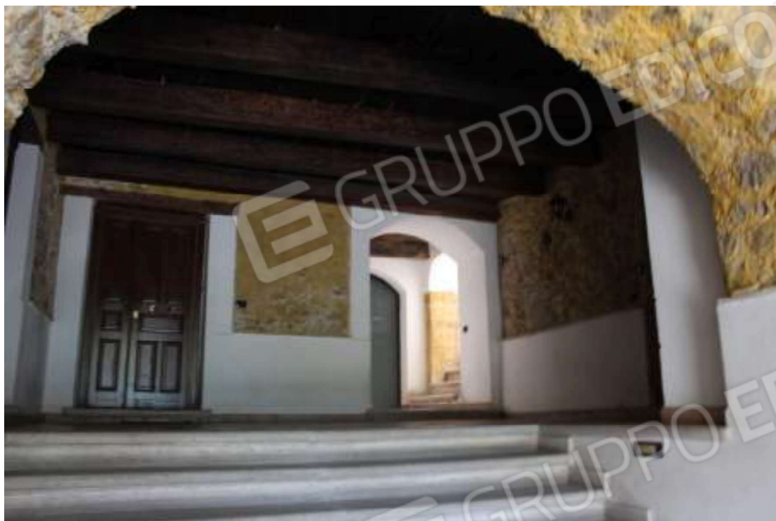
Foto 10.6.7_Vista Atrio