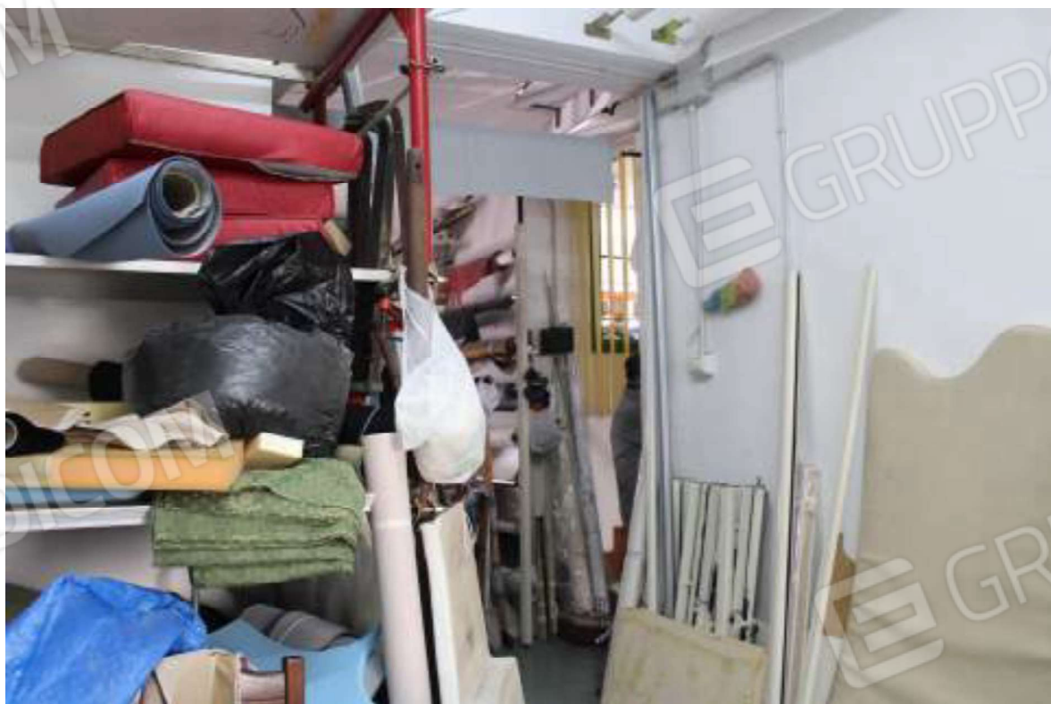
Foto 10.2.2_Vista 2 laboratorio tappezzeria