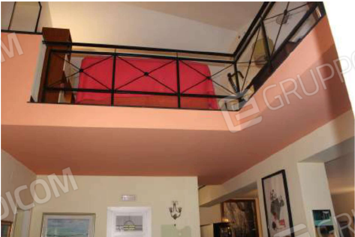
Foto 10.1.6_Vista Studio da Piano Primo verso il Secondo Piano