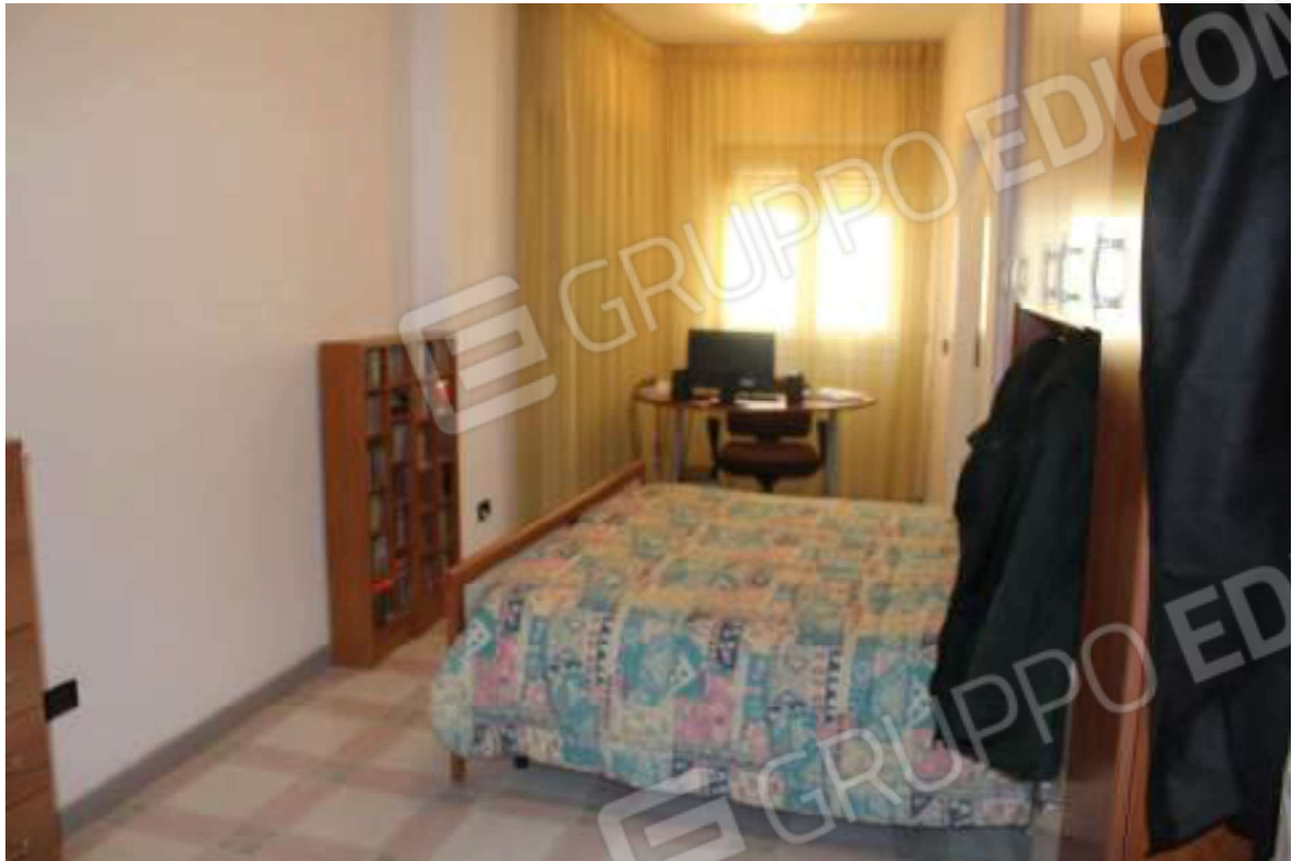
Foto 10.1.8_Vista Camera da Letto