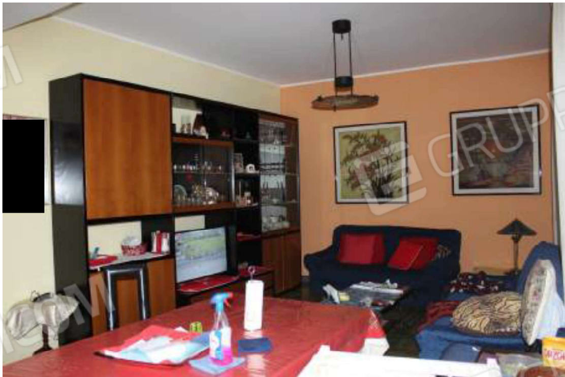
Foto 10.4.2_Vista Soggiorno