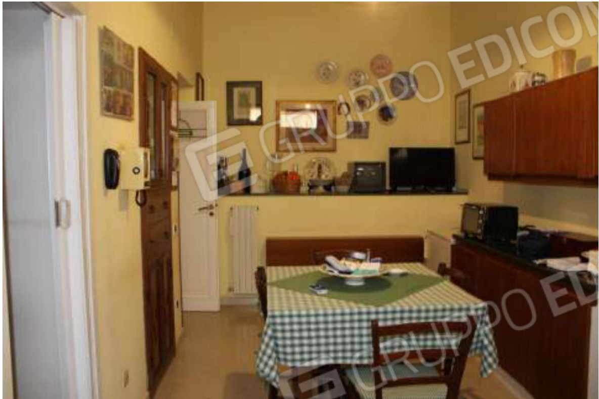
Foto 10.1.4_ Vista Cucina al Paino Primo