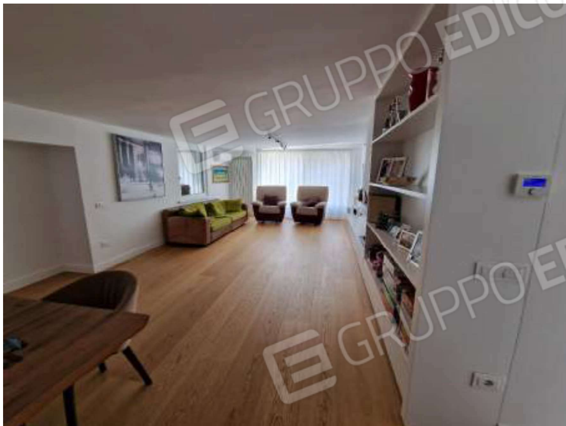
Foto 10.3.1_Vista Soggiorno