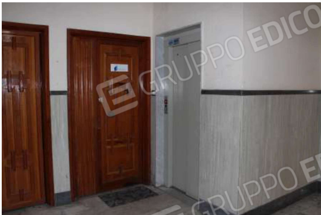
Foto 10.5.7_Vista Ingresso Pianerottolo