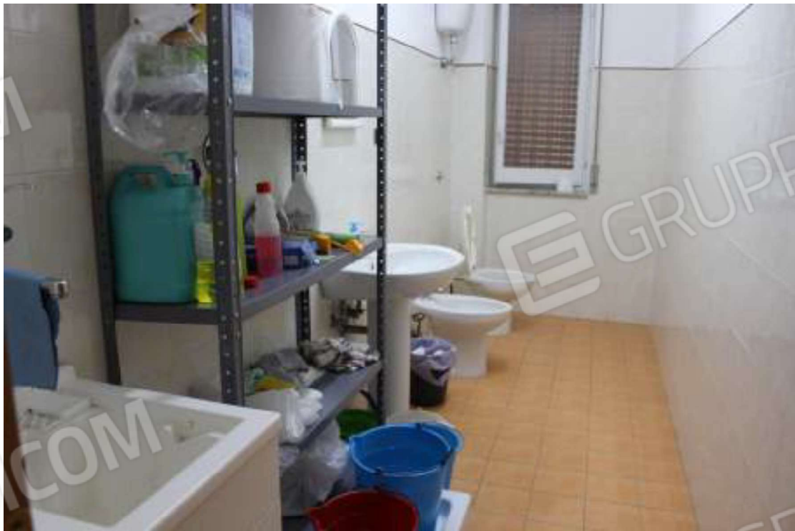
Foto 10.5.6_Vista W.C.