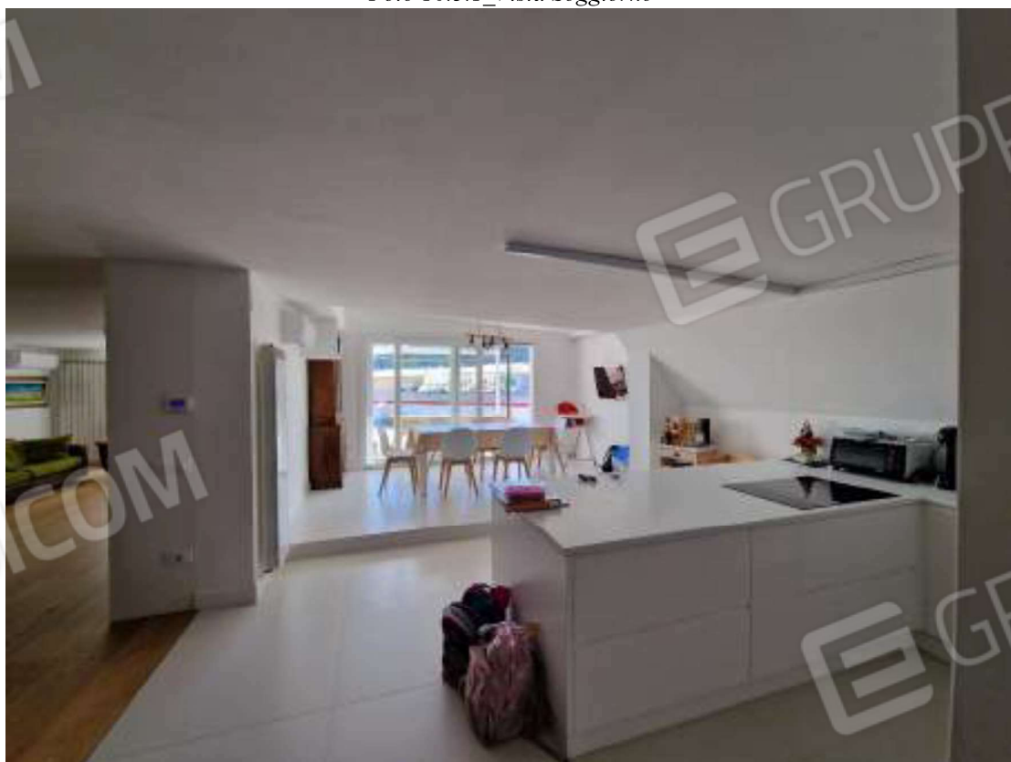
Foto 10.3.2_Vista Cucina