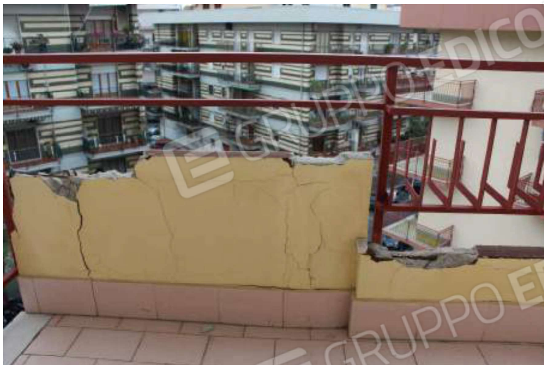
Foto 10.4.9_Vista Parapetti ammalorati