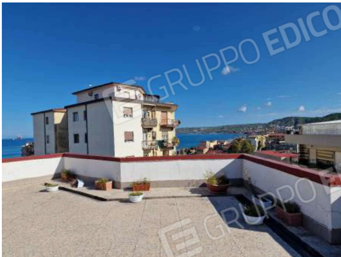
Foto 10.3.11_Vista Terrazzo