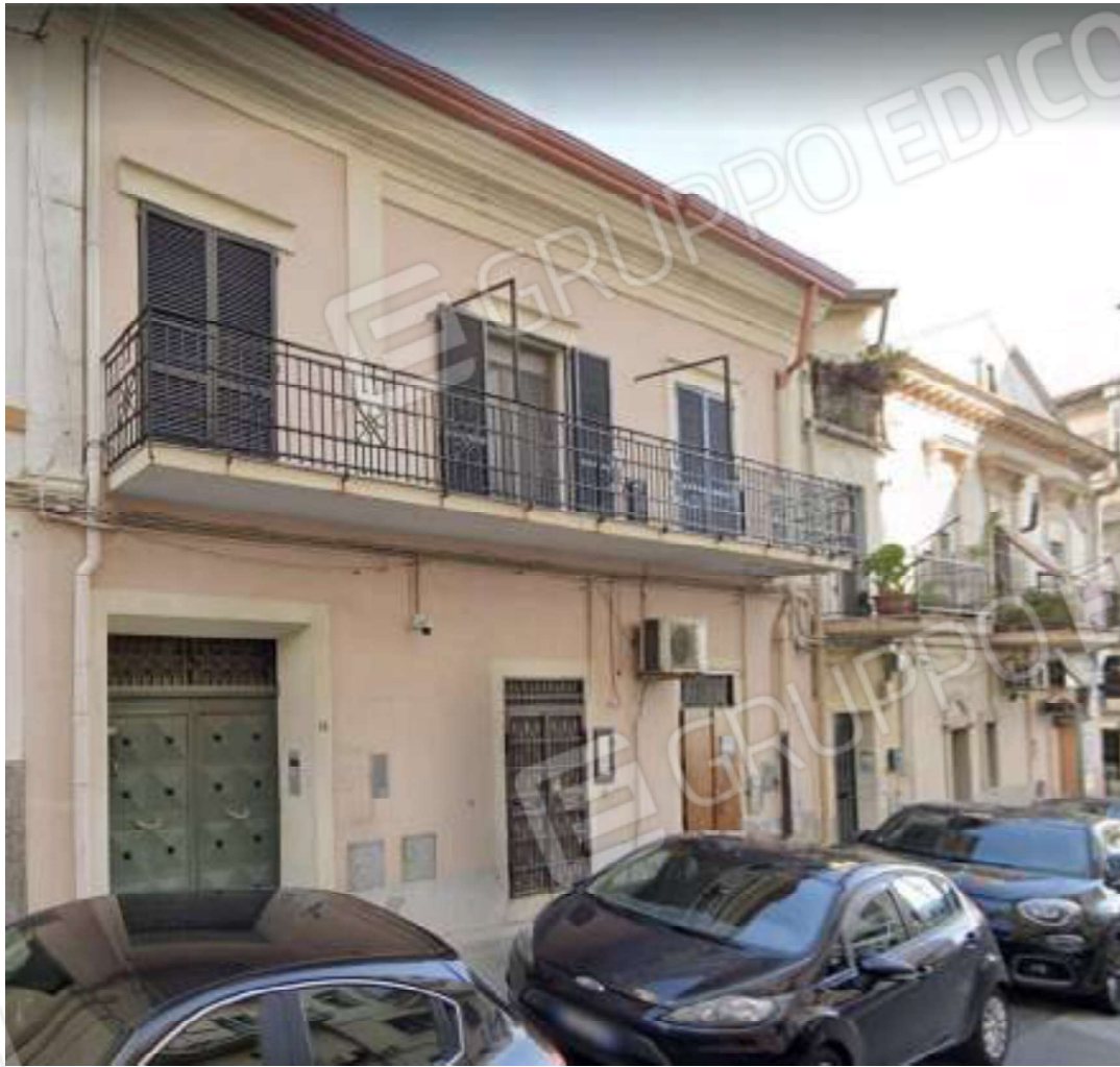
Foto 10.1.10_Vista Prospetto Principale su Via Discesa Marina