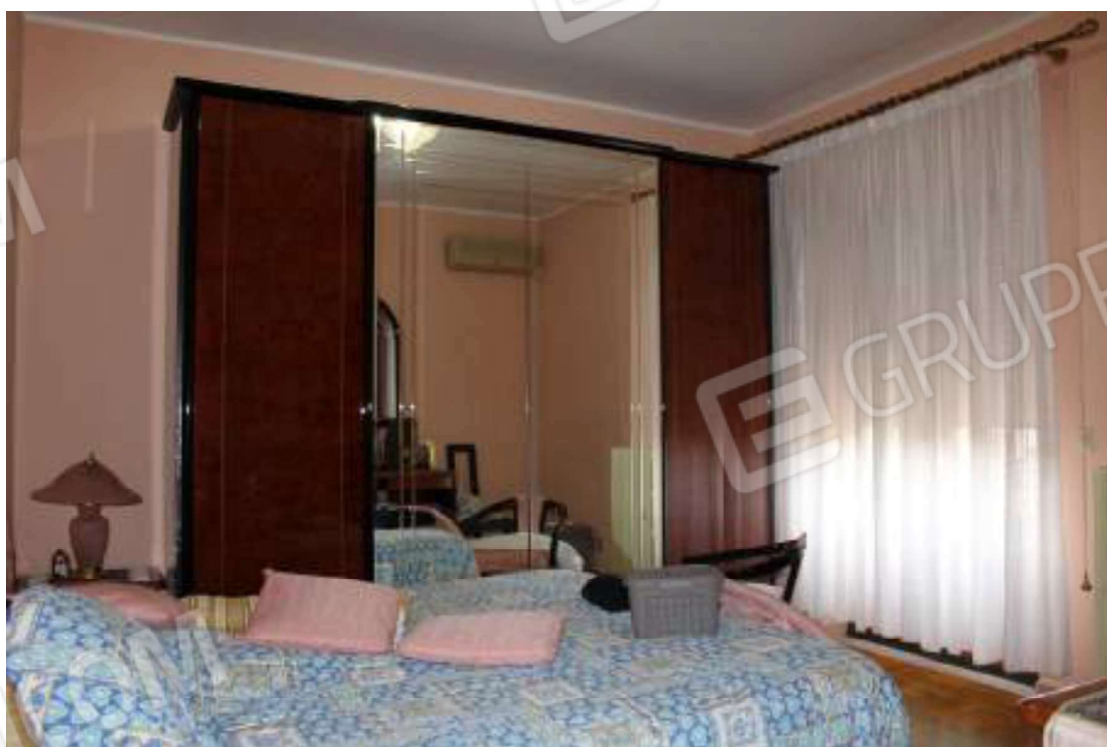
Foto 10.4.4_Vista Camera da Letto 1