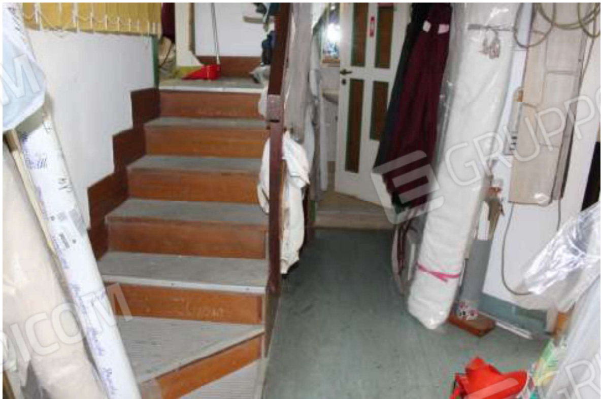
Foto 10.2.4_Vista disimpegno