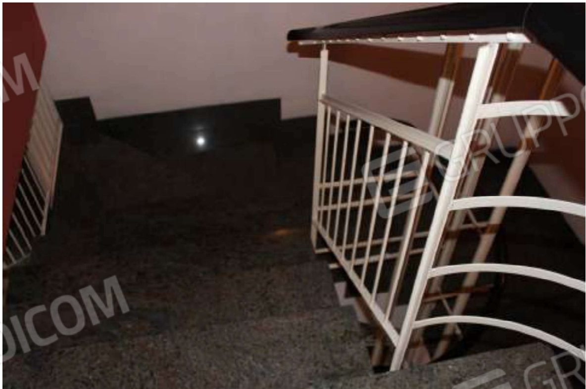
Foto 10.1.4_ Vista Scala