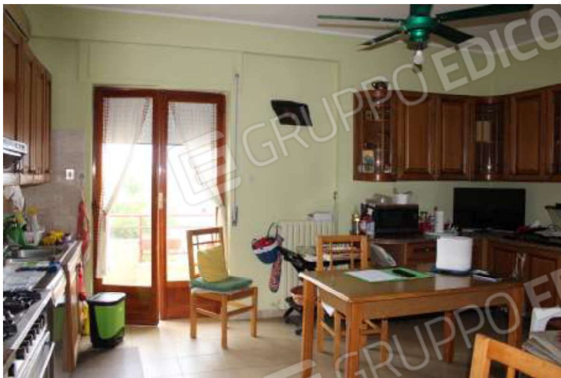
Foto 10.4.7_Vista Cucina