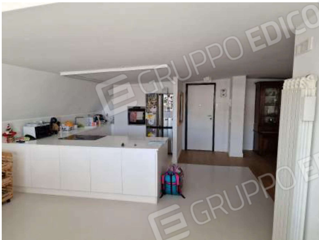
Foto 10.3.4_Vista Cucina