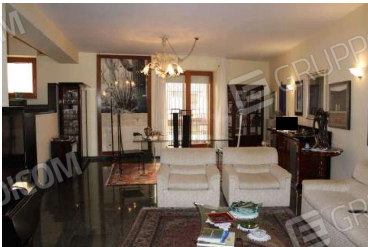
Foto 10.1.2_ Vista Soggiorno al Piano Primo