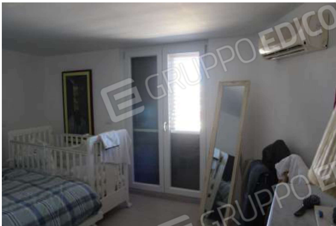
Foto 10.3.9_Vista Stanza da Letto