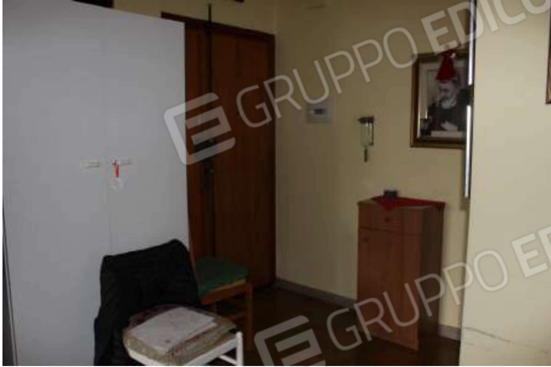
Foto 10.4.1_Vista Ingresso