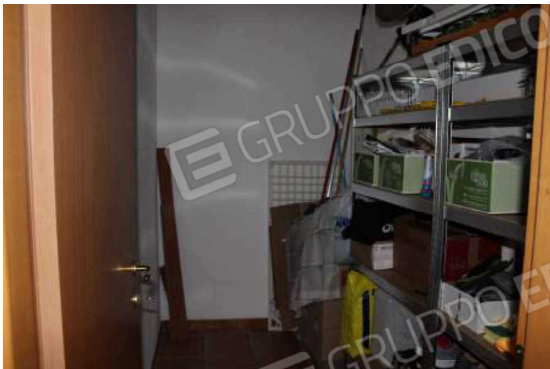
Foto 10.6.5_Vista Ripostiglio