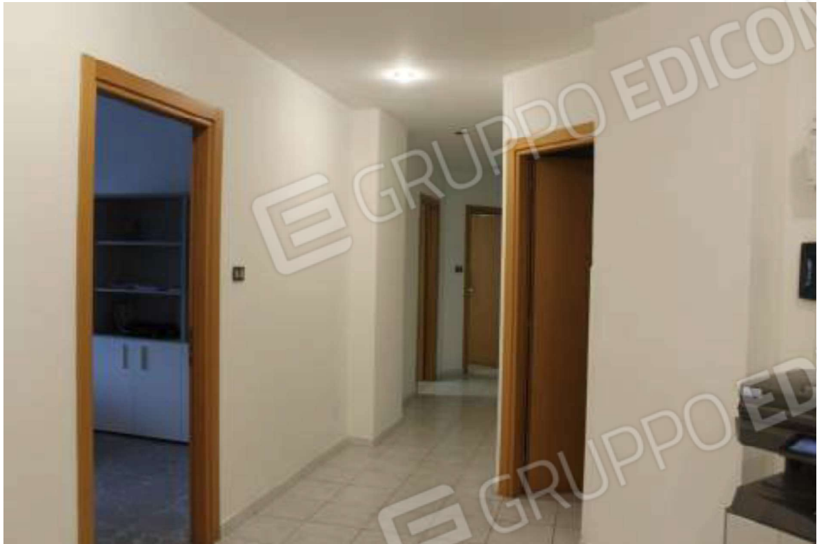
Foto 10.5.5_Vista Disimpegno