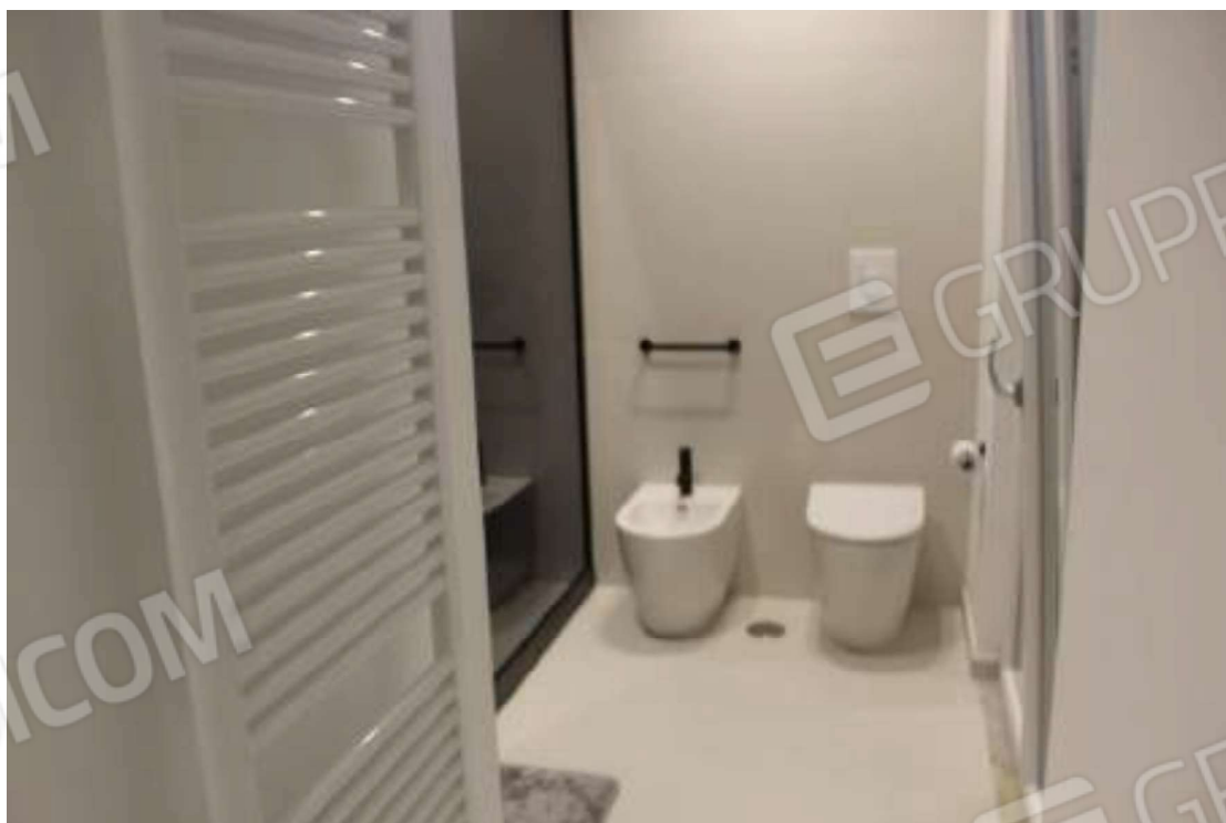
Foto 10.3.4_Vista W.C.