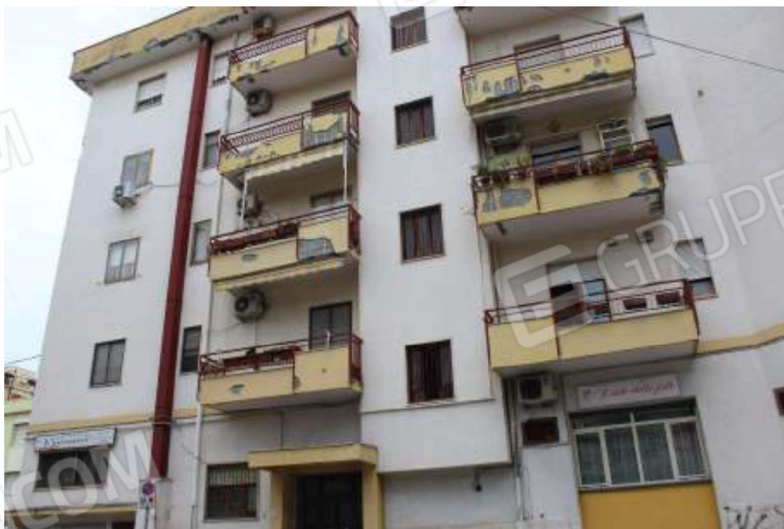
Foto 10.4.8_Vista Edificio