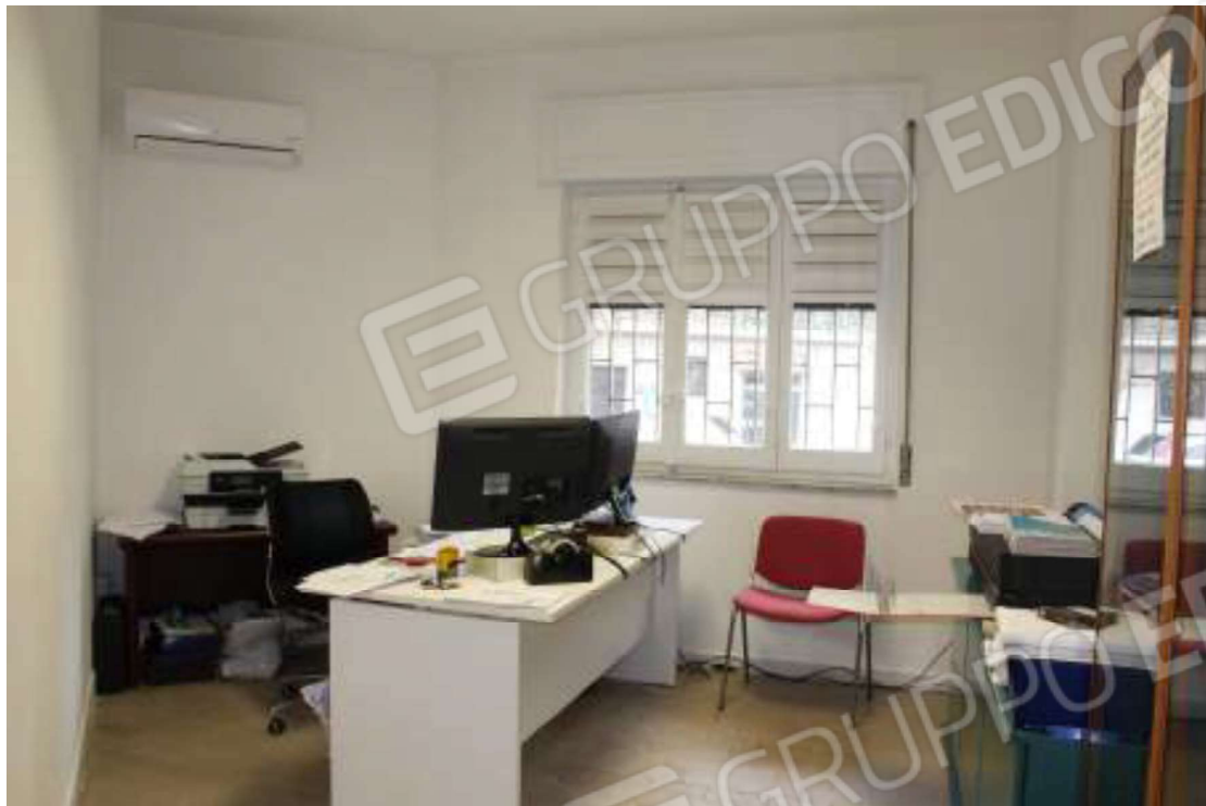
Foto 10.5.3_Vista Ufficio