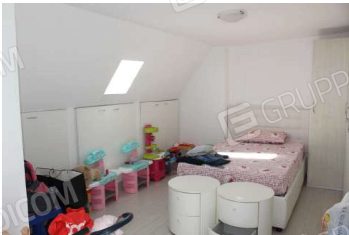
Foto 10.3.8_Vista Stanza da Letto