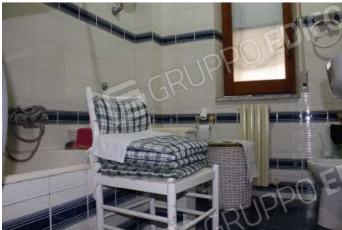
Foto 10.4.3_Vista W.C.