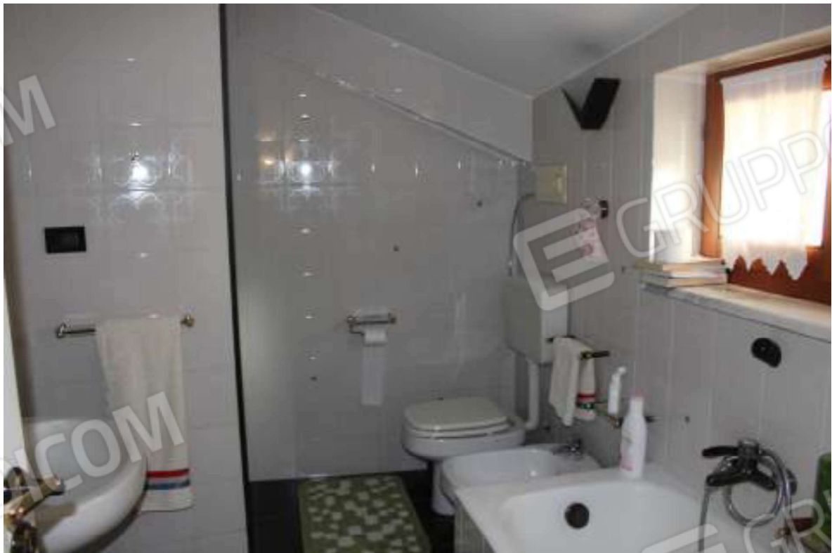
Foto 10.1.7_Vista W.C