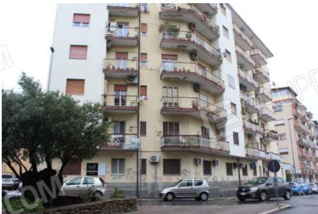
Foto 10.5.8_Vista Edificio