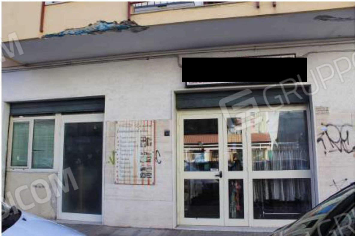
Foto 10.2.58_Vista Prospetto esterno