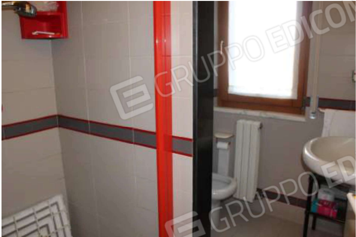
Foto 10.1.6_Vista W.C