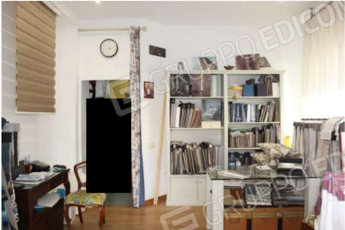
Foto 10.2.7_Vista locale di Vendita tappezzeria