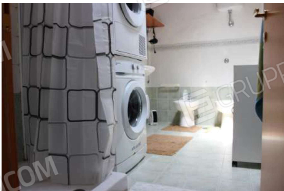
Foto 10.6.4_Vista W.C.