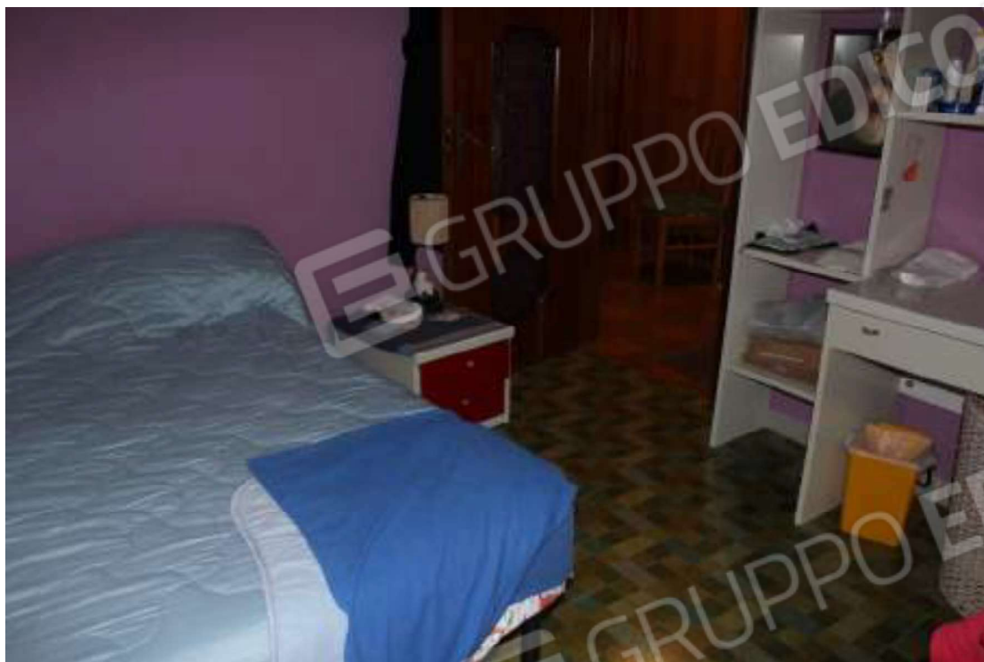
Foto 10.4.5_Vista Camera da Letto 2