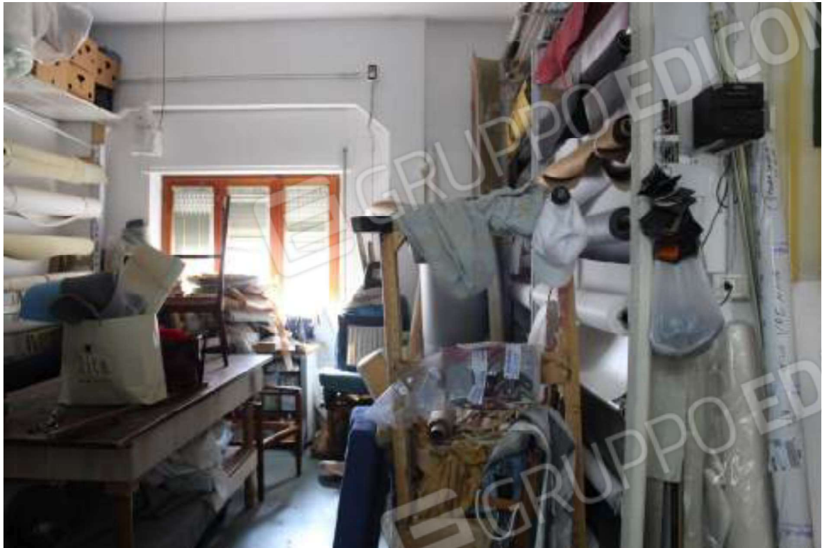
Foto 10.2.3_Vista deposito tappezzeria