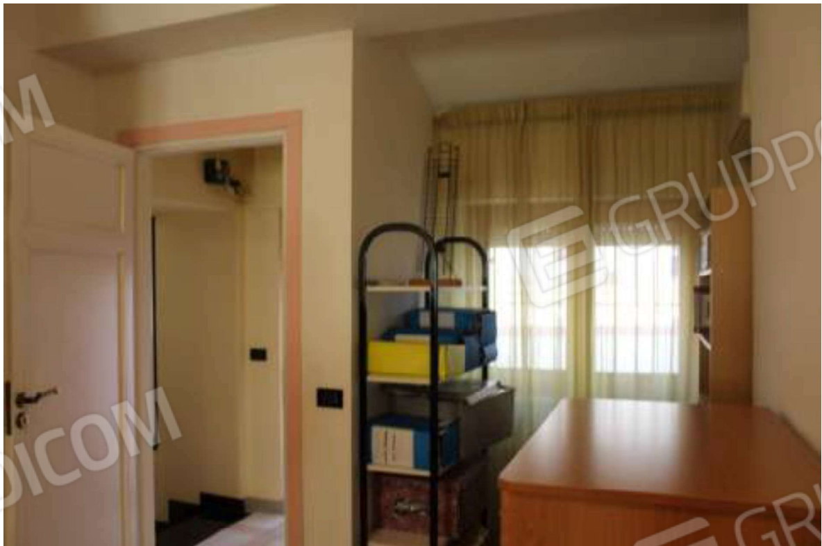
Foto 10.1.9_Vista Camera da Letto