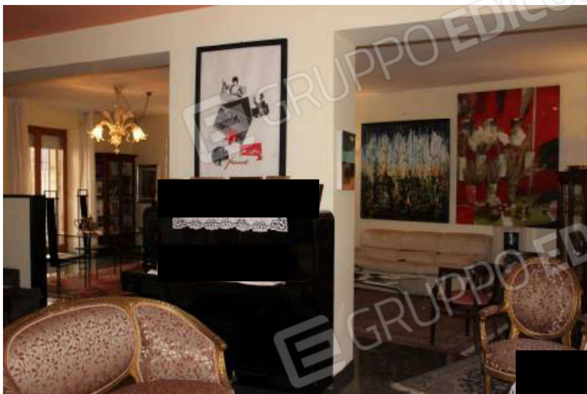
Foto 10.1.1 _ Vista Soggiorno al Piano Primo