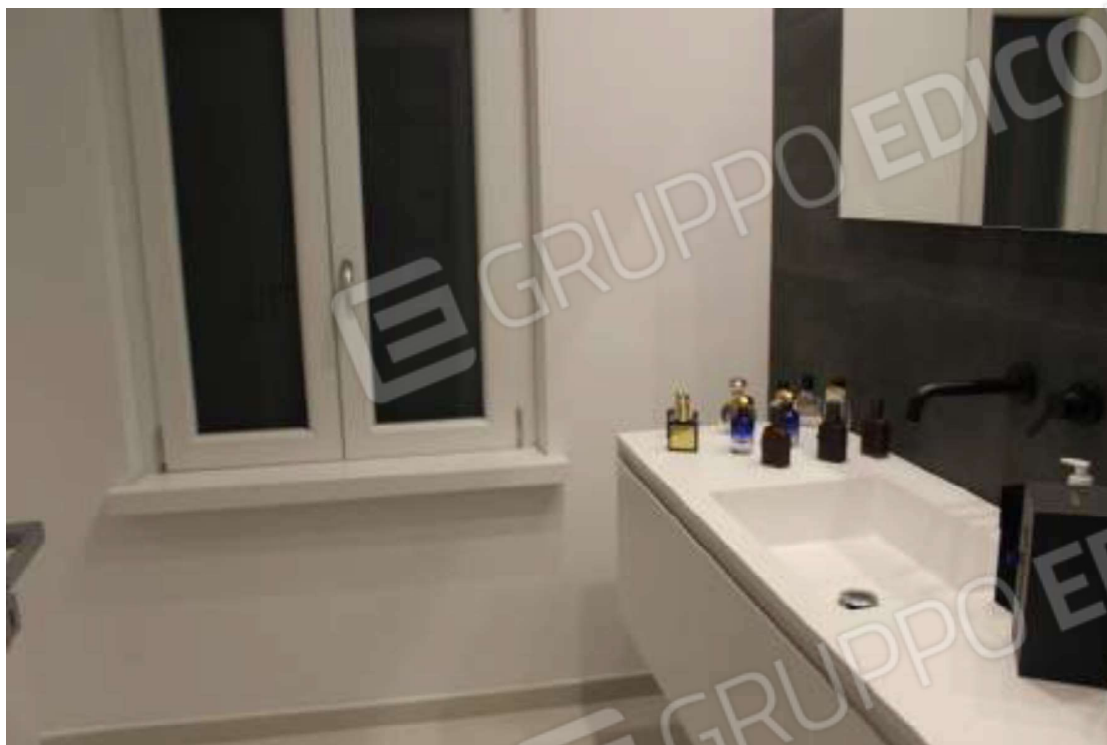
Foto 10.3.7_Vista W.C.