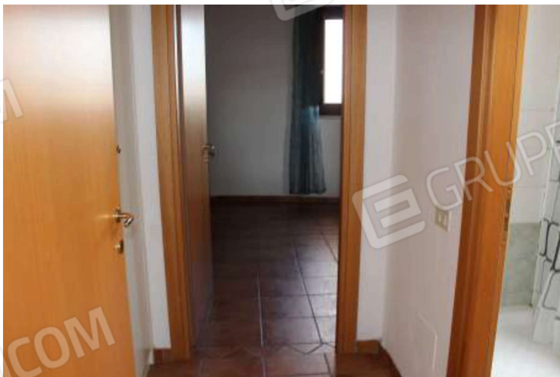
Foto 10.6.6_Vista Disimpegno