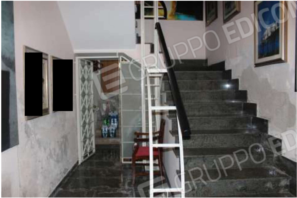
Foto 10.1.3_ Vista Atrio al Piano Terra