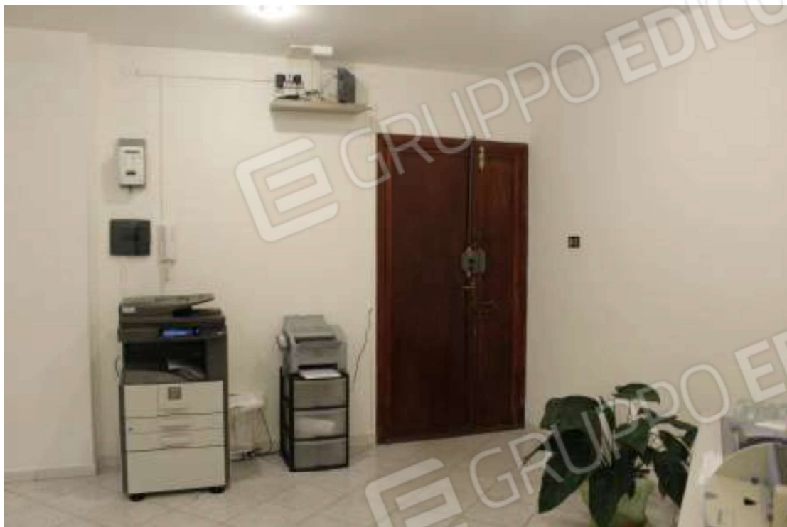
Foto 10.5.1_Vista Ingresso