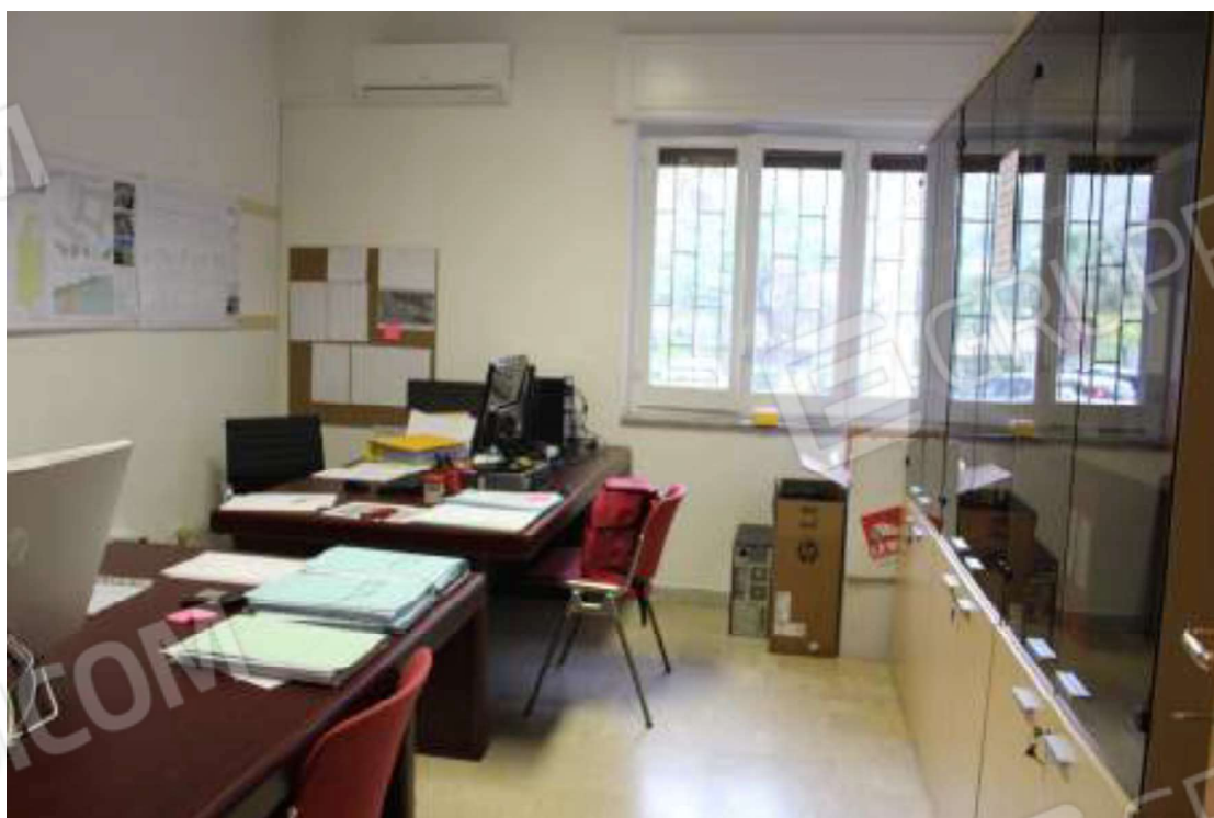
Foto 10.5.2_Vista Ufficio