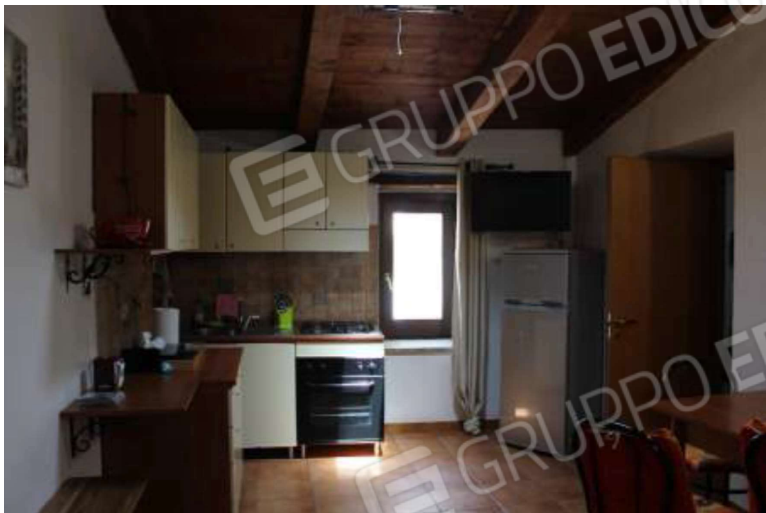
Foto 10.6.1_Vista Cucina