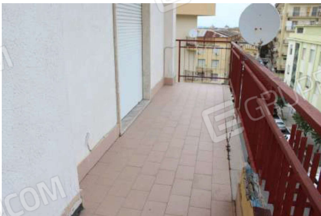
Foto 10.4.10_Vista Balconi