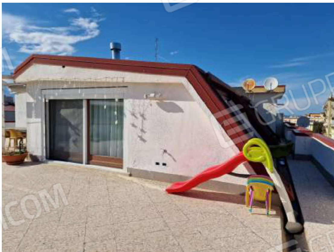
Foto 10.3.10_Vista Terrazzo