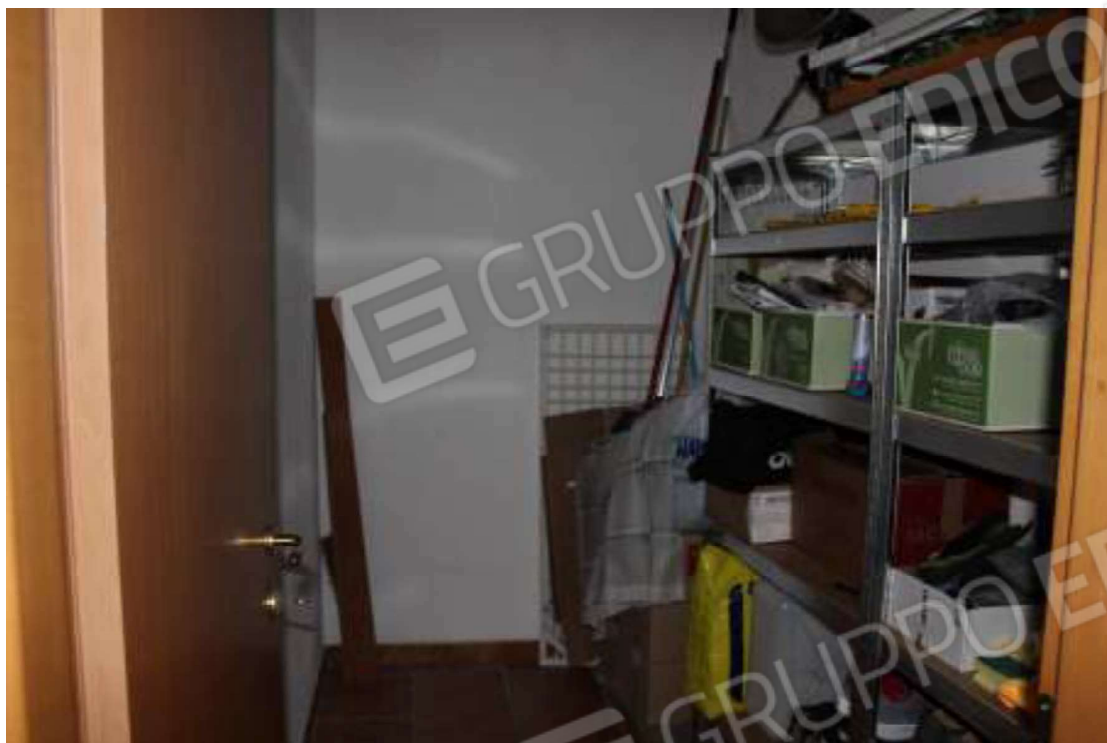
Foto 10.6.5_Vista Ripostiglio