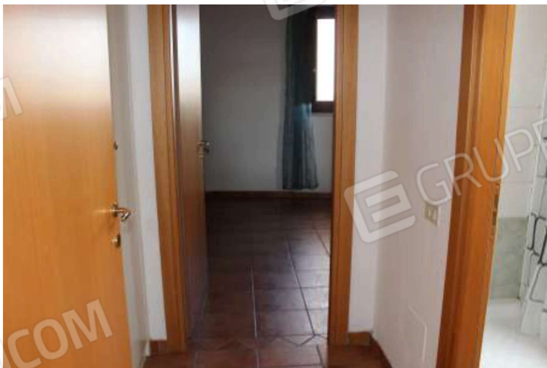
Foto 10.6.6_Vista Disimpegno