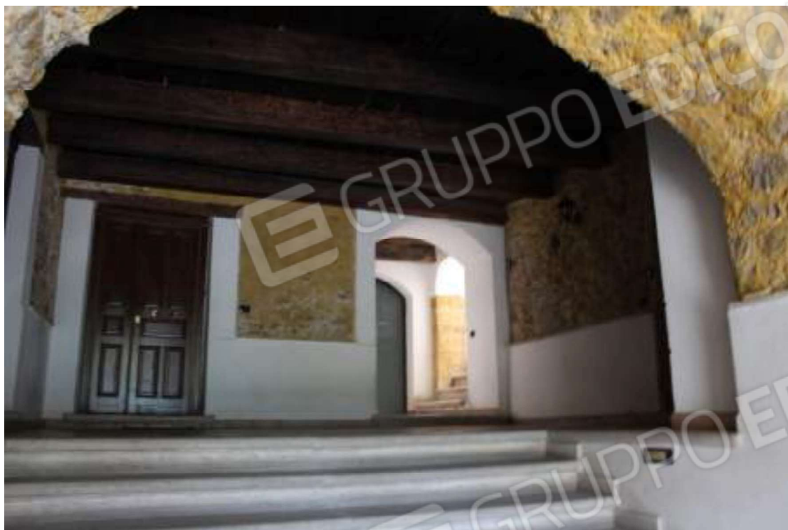
Foto 10.6.7_Vista Atrio