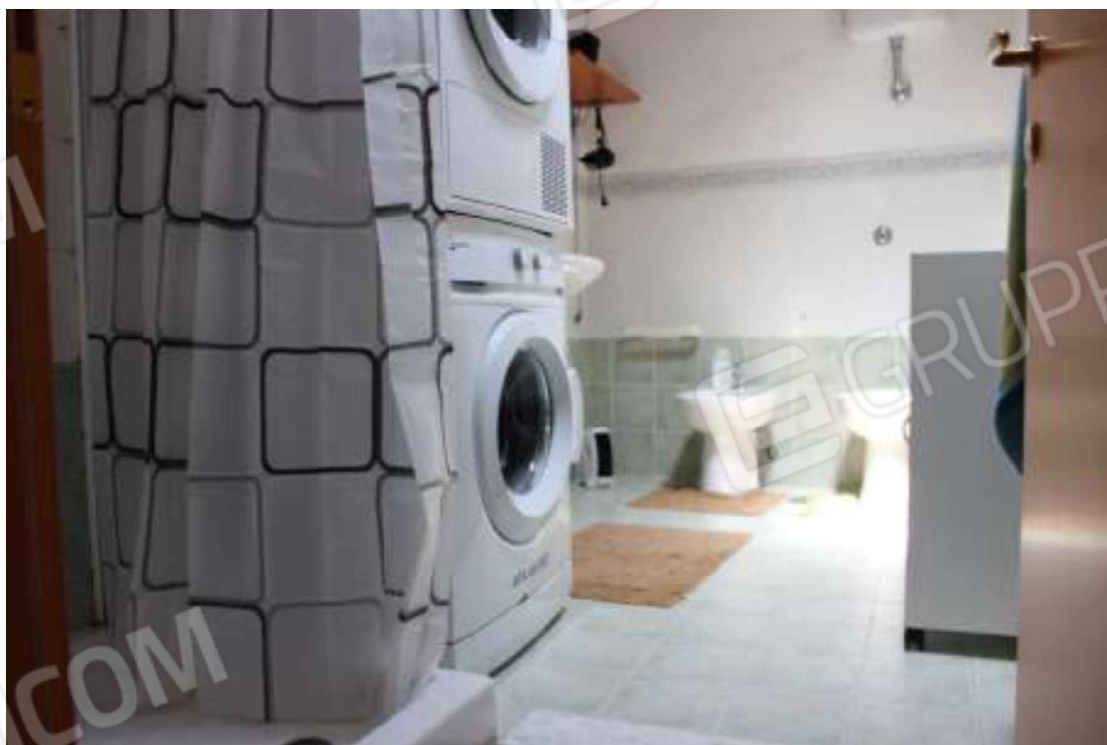
Foto 10.6.4_Vista W.C.