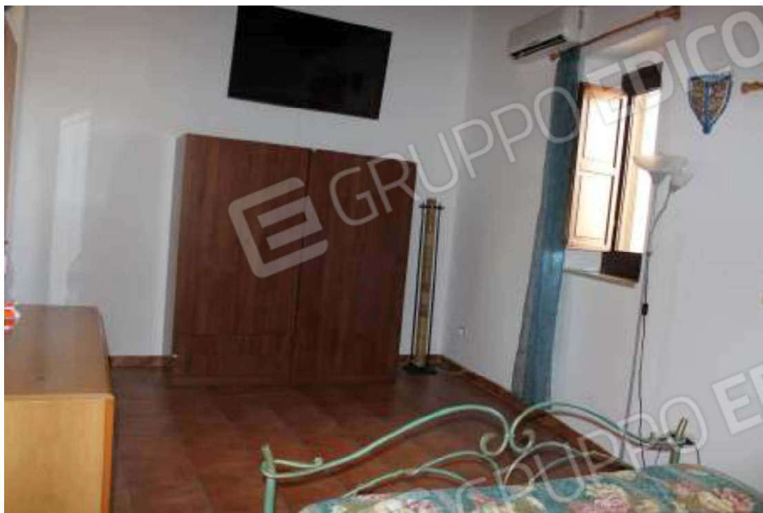
Foto 10.6.3_Vista Camera da Letto