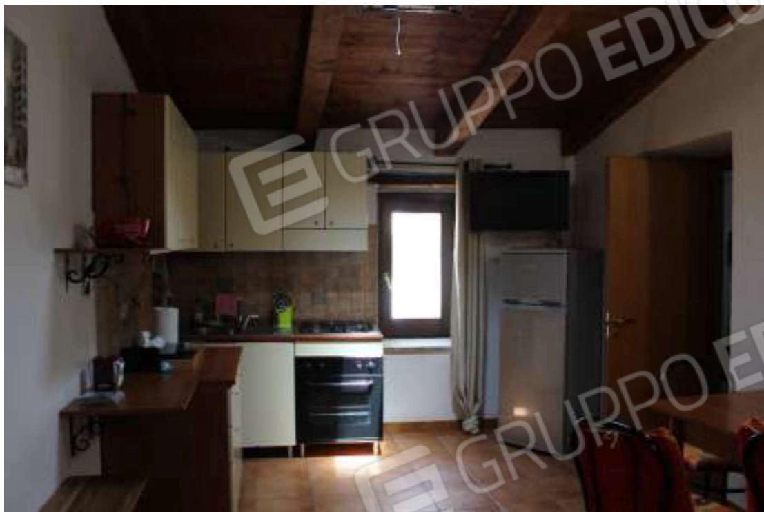
Foto 10.6.1_Vista Cucina