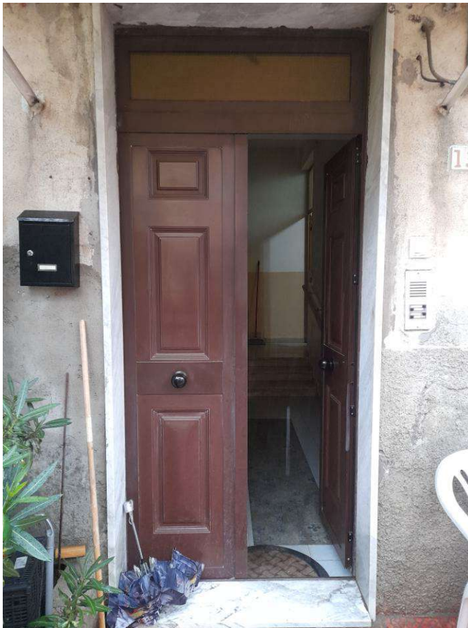
Ingresso al fabbricato via Nazionale S.S. 106 – Corso Giuseppe Garibaldi n° 132

L'impianto di citofono presente all'esterno non risulta collegato con l'unità in oggetto.