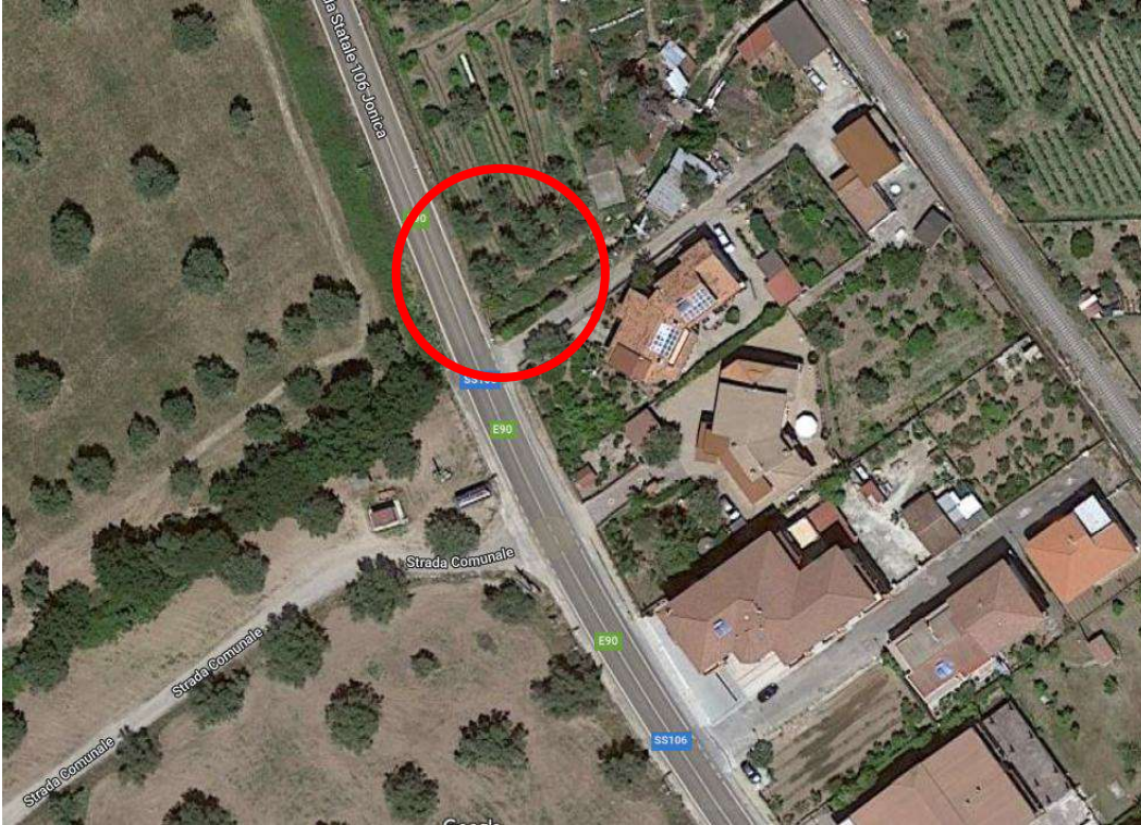
ORTO FOTO LOTTO 2 - FOGLIO 6 PART. 111