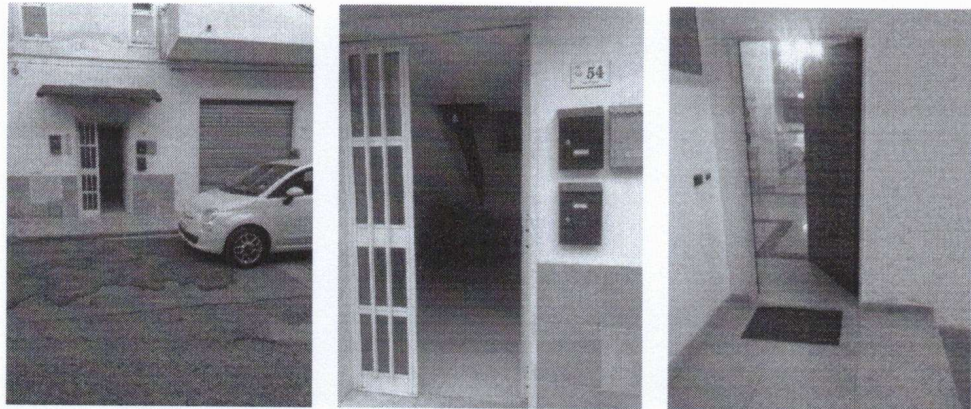
Appartamento posto al piano terra Via La Valletta n. 54

Note: (VEDI -ALLEGATO n. 4 planimetria allo stato attuale dell'immobile e planimetria catastale dell'immobile, -ALLEGATO n. 5 documentazione fotografica e -ALLEGATO n. 6 Visura dell'immobile pignorato F 21 p.la 2140, sub.2).