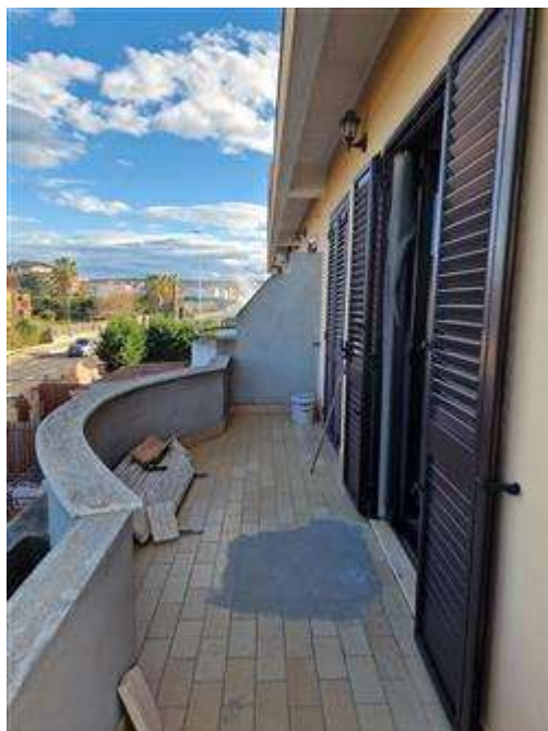
Balcone camere da letto