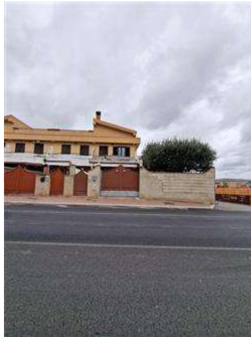
Villino via Nazioni Unite, 140 Crotone