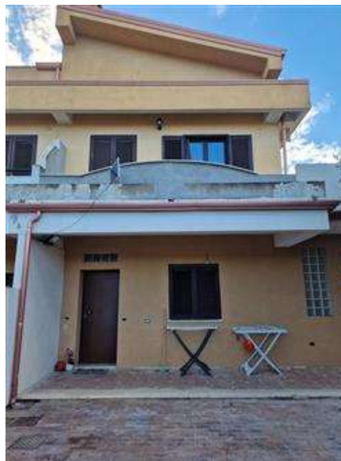
Facciata esterna villino ingresso di via Nazioni Unite