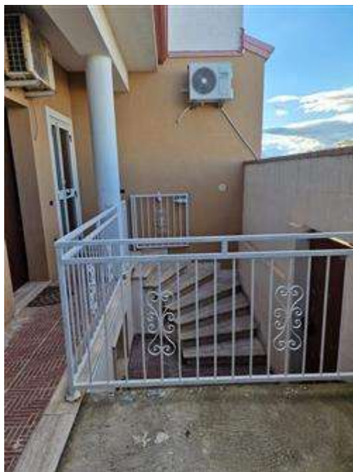
Ingresso al piano terra da via Costa Rica.

L'intero edificio sviluppa 2 piani, 2 piani fuori terra, 0 piano interrato. Immobile costruito nel 2005.