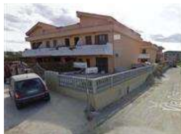
Villetta con realizzazione della recinzione esterna con ringhiera a balaustra e realizzazione del garage abusivo aprile 2010.