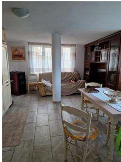
Soggiorno realizzato abusivamente.