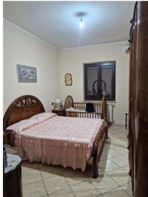
Camera da letto padronale primo piano