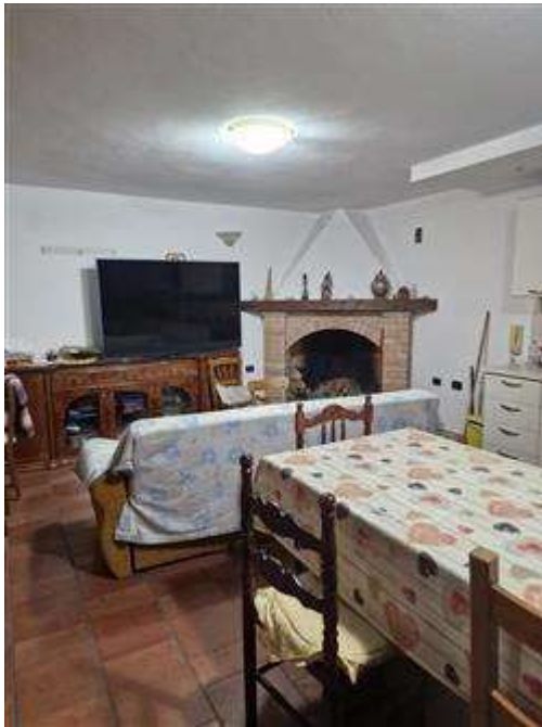
Tinello realizzato abusivamente nel piano interrato