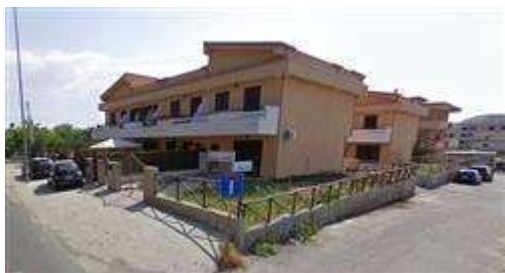
Villetta allo stato originario d'acquisto maggio 2009.

Questa situazione è riferita solamente a manufatto al primo piano fuori terra con una superficie coperta pari a mq 32 circa; manufatto al secondo piano fuori terra con una superficie coperta pari a mq 38 circa.