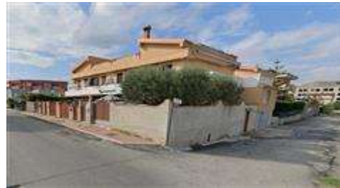
Villetta con completamento dell'ampliamento del piano terra abusivo, del muro di recinzione abusivo e dell'ingresso secondario di via Costa Rica ottobre 2022.