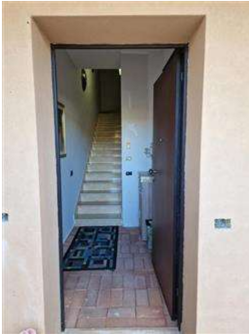
Portone ingresso primo piano

L'intero edificio sviluppa 2 piani, 2 piani fuori terra, 0 piano interrato. Immobile costruito nel 2005.