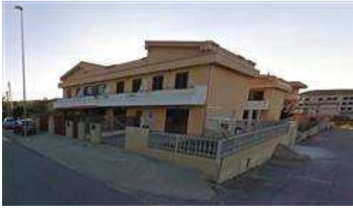
Villetta con inizio opere abusive per la realizzazione di una veranda e ampliamento del piano terra dicembre 2010.