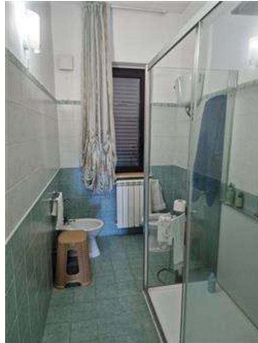
Bagno padronale al primo piano