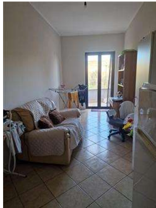
Camera soggiorno primo piano