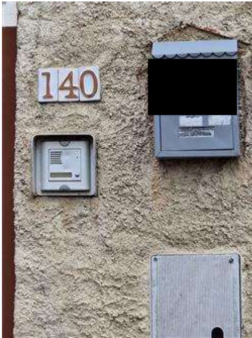
Citofono ingresso villino via Nazioni Unite