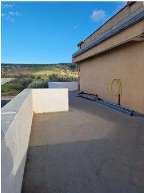
Veranda realizzata abusivamente.