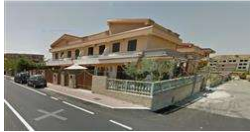
Villetta con completamento della veranda abusiva agosto 2012.