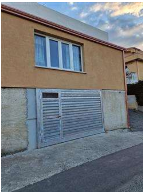
Vista esterna del soggiorno abusivo e ingresso garage interrato abusivo.