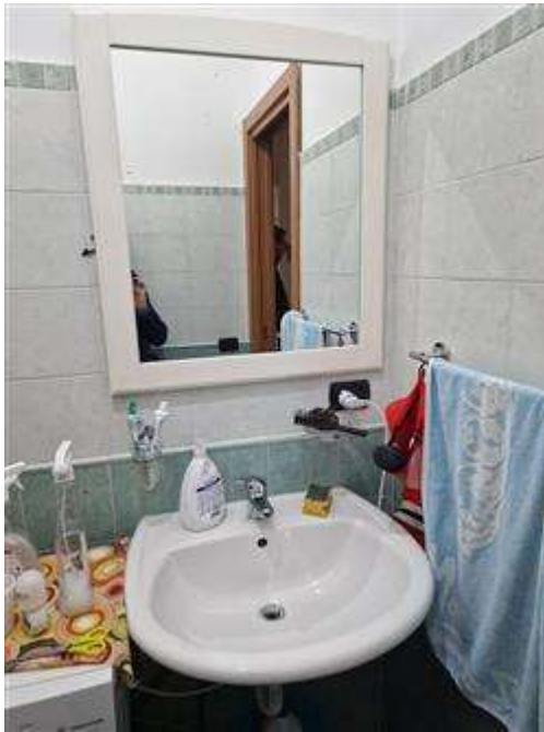
Antibagno padronale primo piano