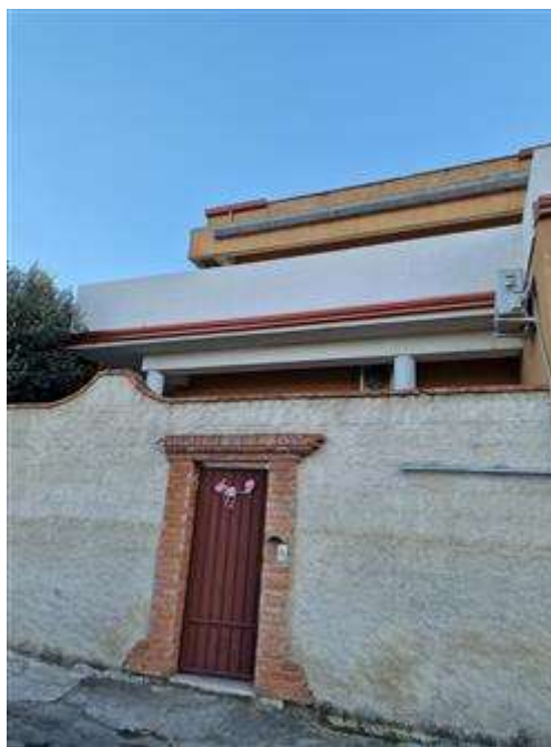
Ingresso abusivo da via Costarica con vista veranda abusiva.