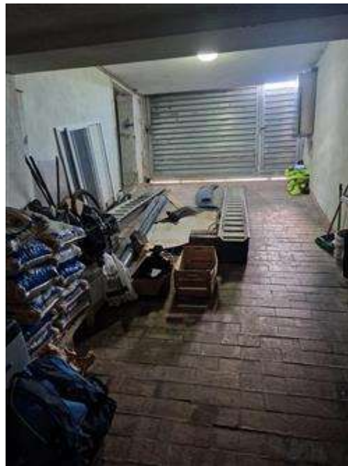
Garage realizzato abusivamente nei piano interrato.