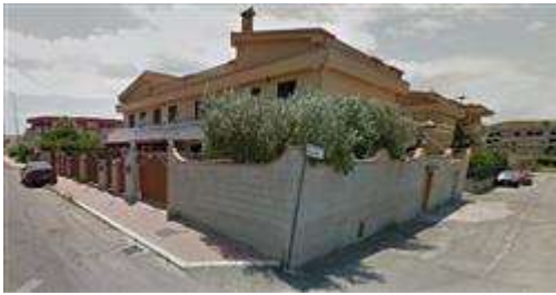
Villetta con ampliamento del piano terra abusivo, del muro di recinzione abusivo e dell'ingresso secondario di via Costa Rica giugno 2019.