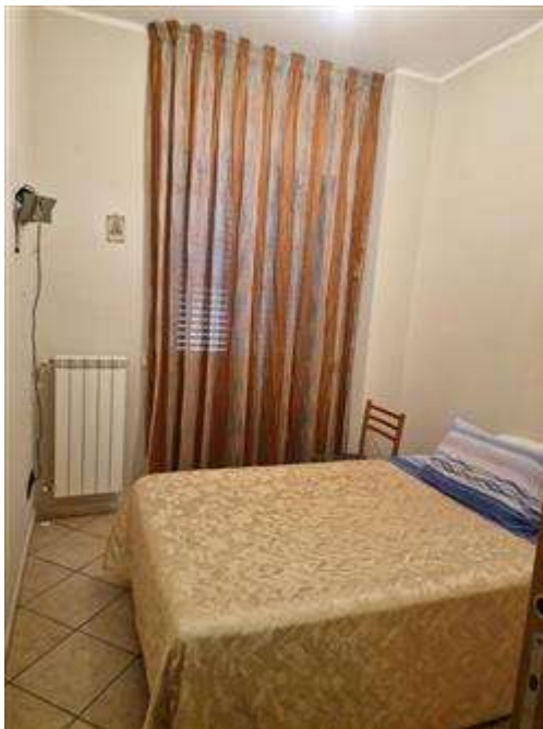
Cucina trasformata in cameretta primo piano