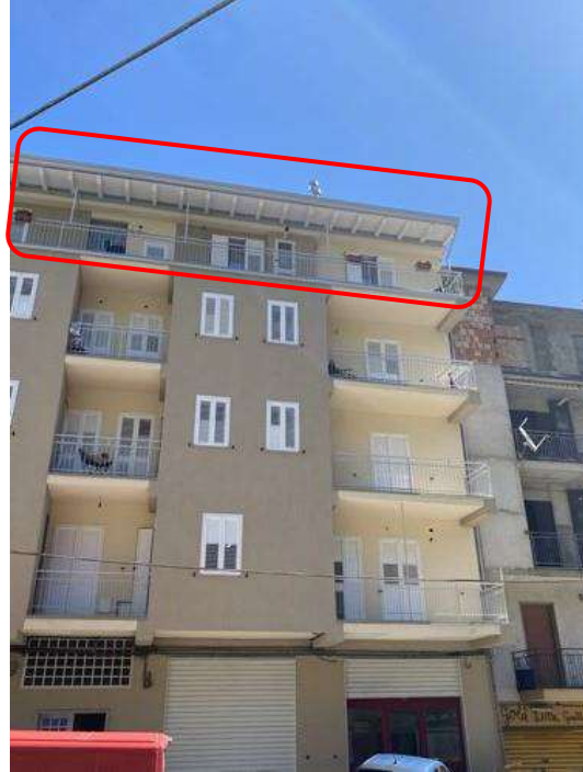
Appartamento DATI OSCURATI