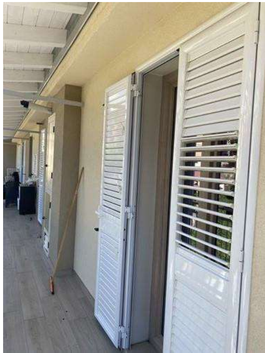
Balcone su via Arringa