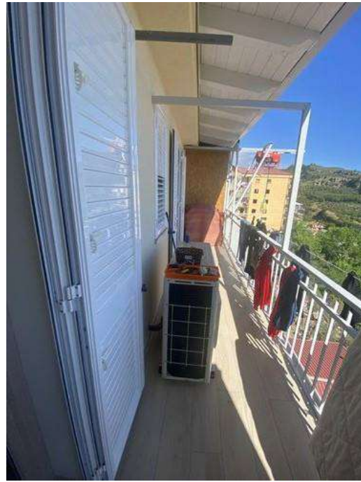
Balcone su via Fontana Grande