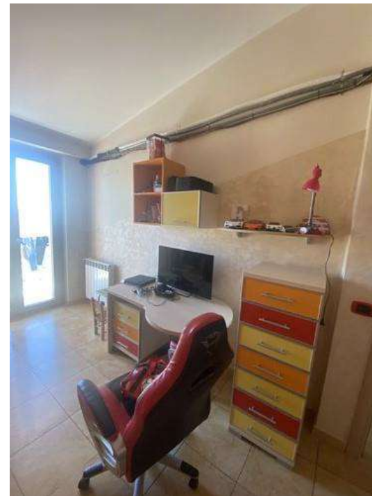
Camera da letto bambini