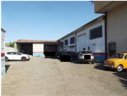
CORTE DI PERTINENZA DEL CAPANNONE