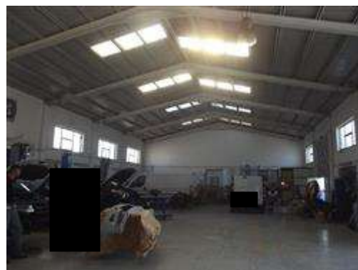
INTERNO DEL CAPANNONE