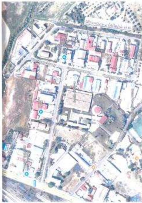
PLANIMETRIA DI ZONA CON EVIDENZIATO IL CAPANNONE