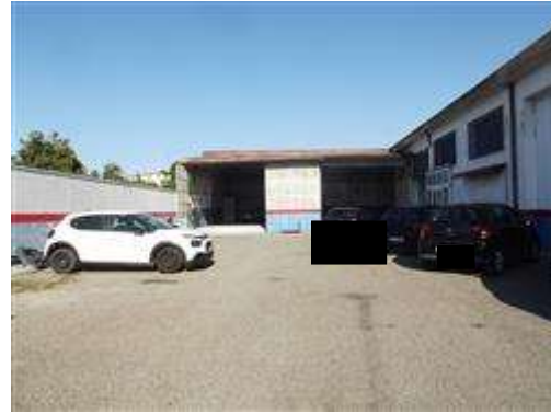
CORTE DI PERTINENZA DEL CAPANNONE