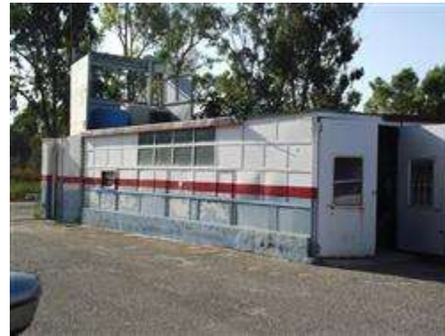
DEPOSITO ALL'INTERNO DELLA CORTE POSTO ALLA SINISTRA DELL'INGRESSO