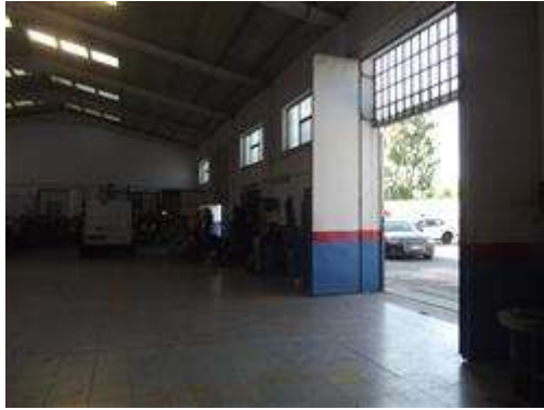
INTERNO DEL CAPANNONE