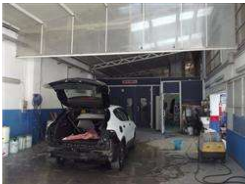
SALA VERNICI E FORNO