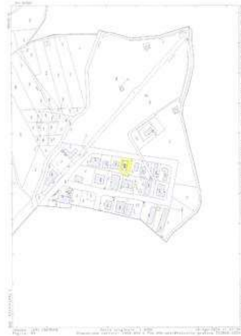
ESTRATTO DI MAPPA CATASTALE