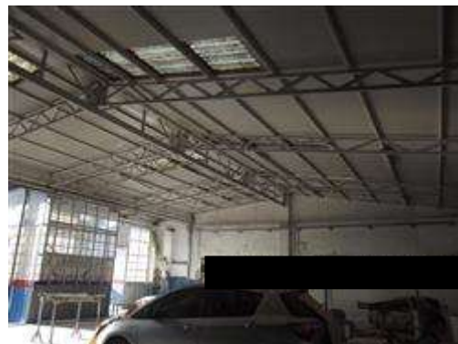
COPERTURA SALA VERNICI E FORNO