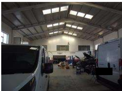
INTERNO DEL CAPANNONE

L'intero edificio sviluppa 2 piani, 2 piani fuori terra, 0 piano interrato. Immobile costruito nel 1981.