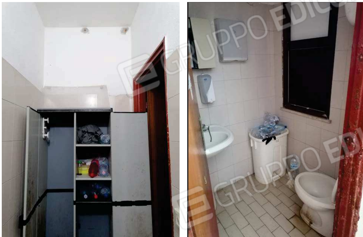
FOTO 15-16. Particolari dello Spogliatoio 3