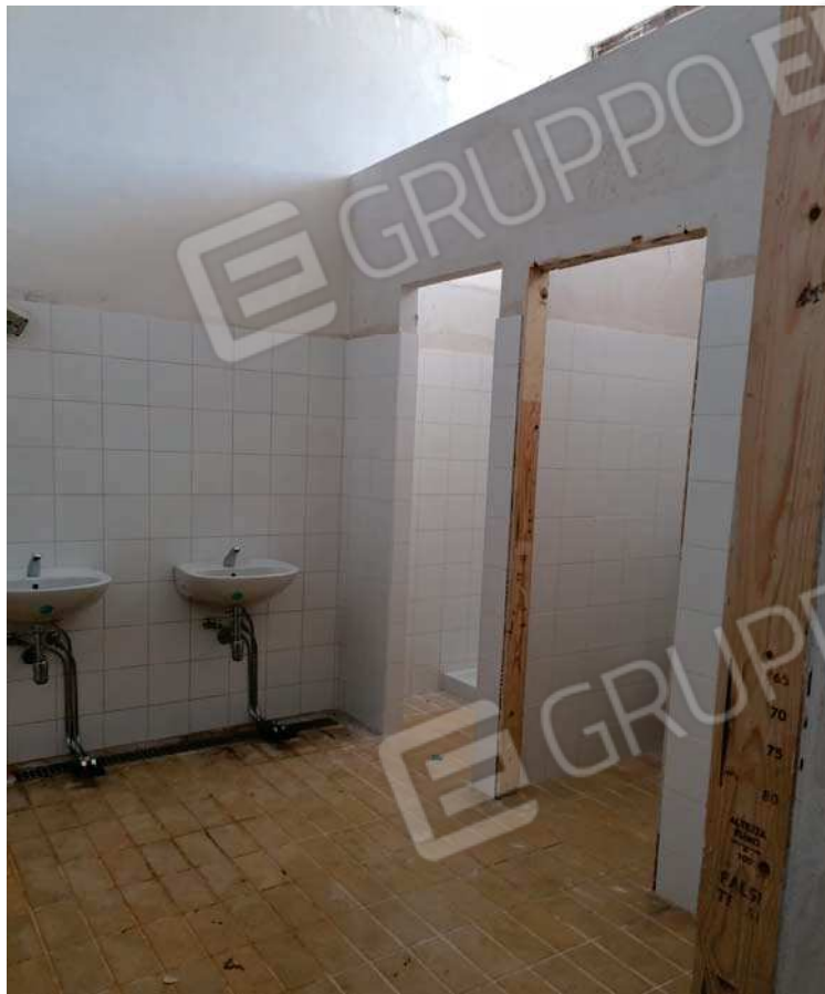
FOTO 9. Spogliatoio 1