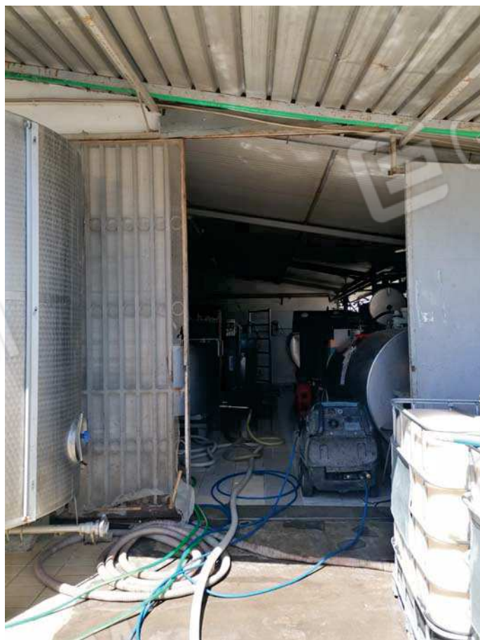
FOTO 17. Ingresso locale tecnico