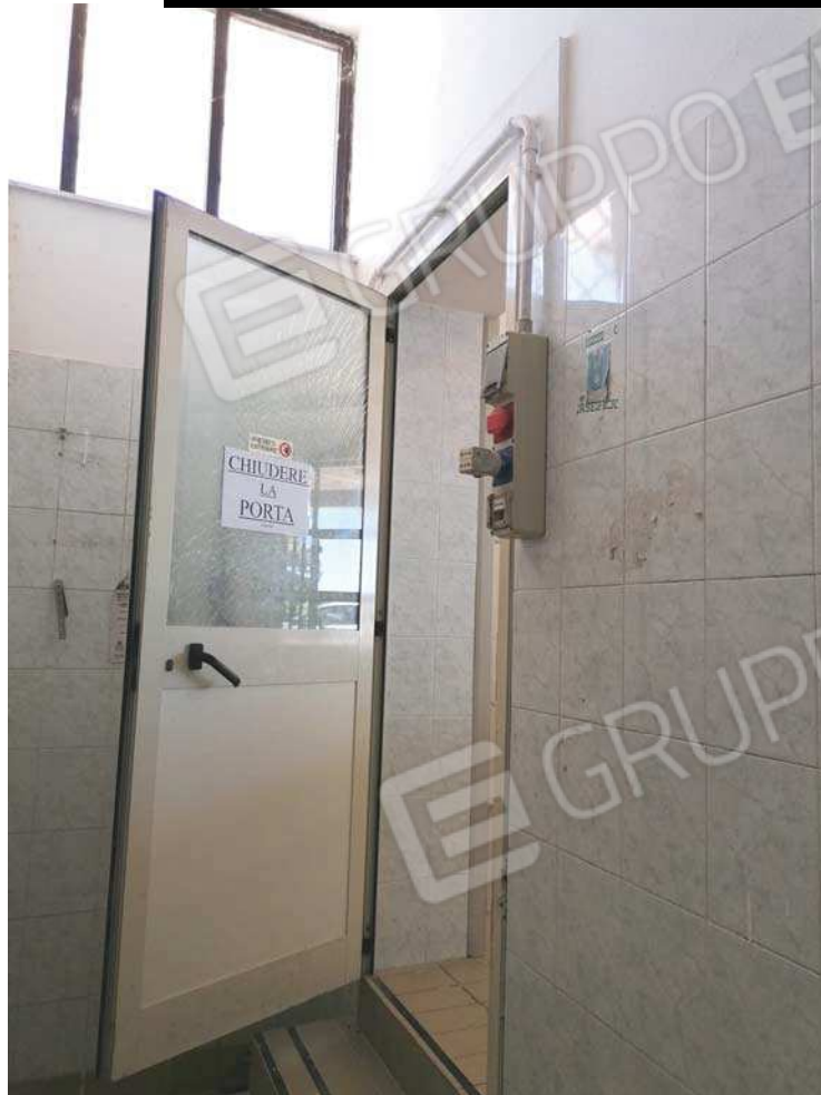
FOTO 7. Porta di comunicazione tra sala vendita e laboratorio caseario