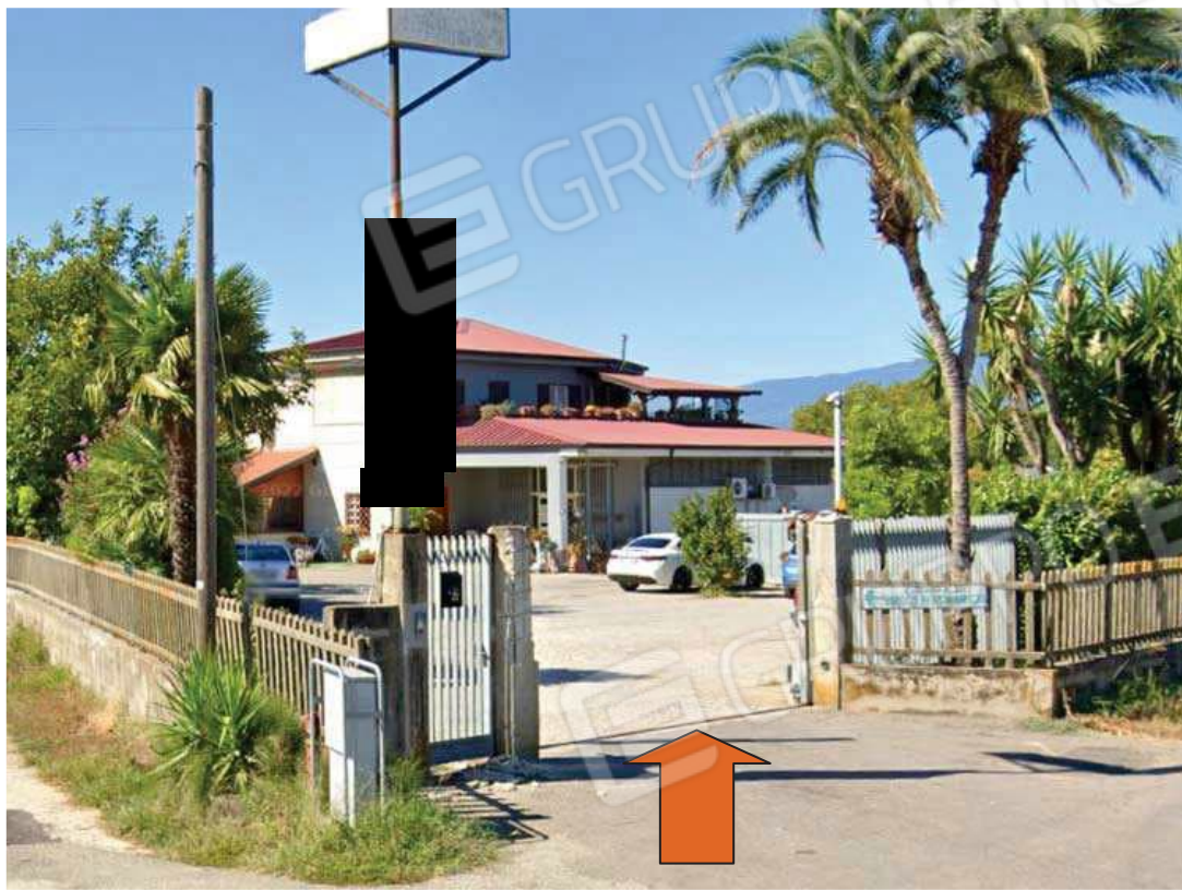
FOTO 1. Immobile tipologia cielo-terra.