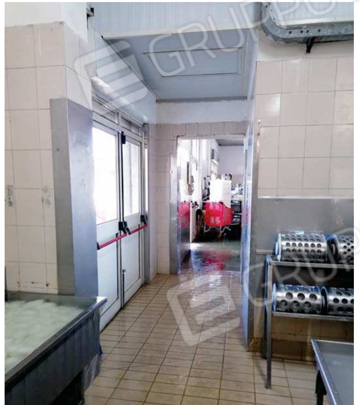
FOTO 10- 11. Laboratorio caseario