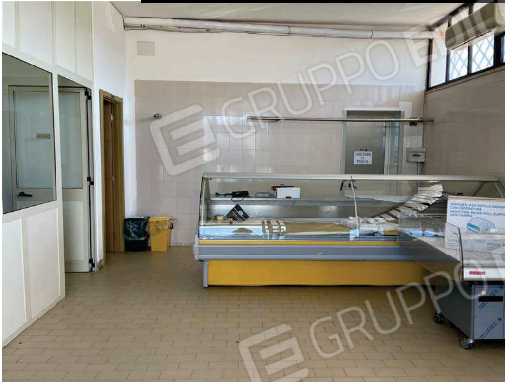
FOTO 3. Area Vendita