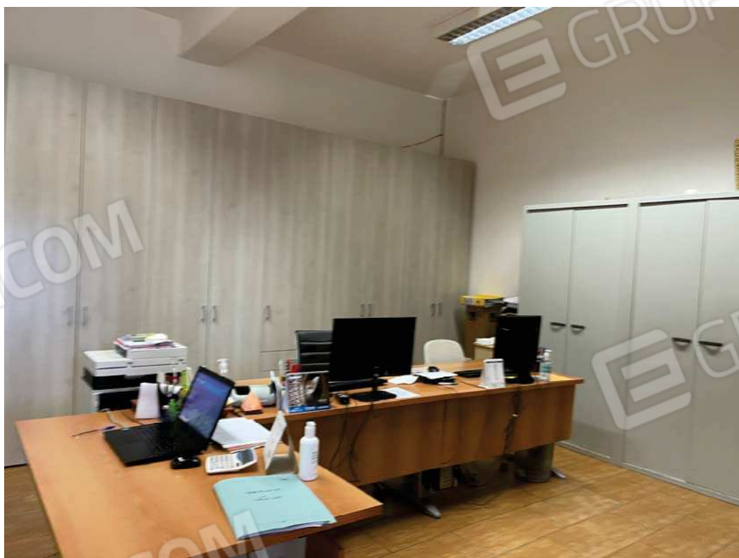
FOTO 8-. Uffici