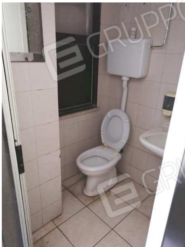
FOTO 13-14. Particolari dello Spogliatoio 2