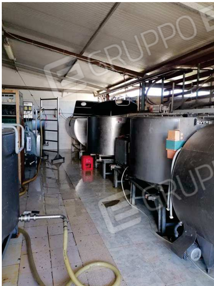
FOTO 18. Locale tecnico