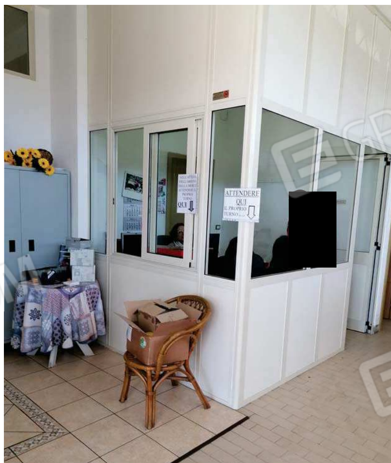
FOTO 4. Area contabile delimitata con struttura removibile in pvc e vetro.