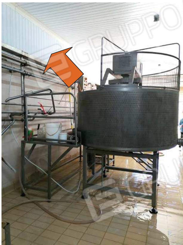
FOTO 12. Pannellatura a chiusura delle finestre.