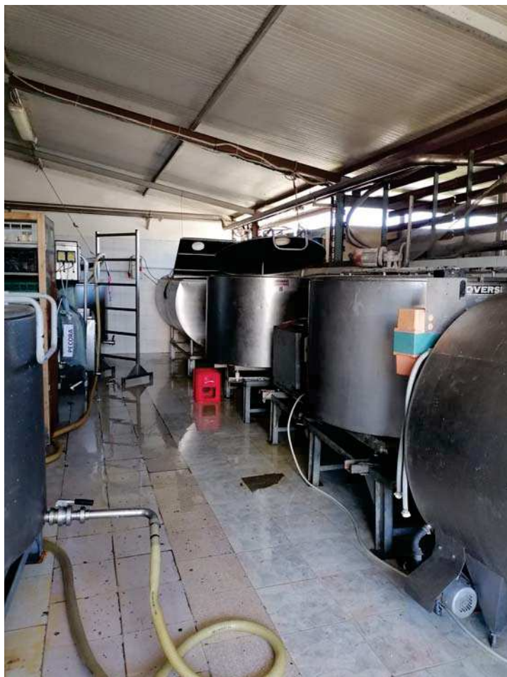
FOTO 18. Locale tecnico