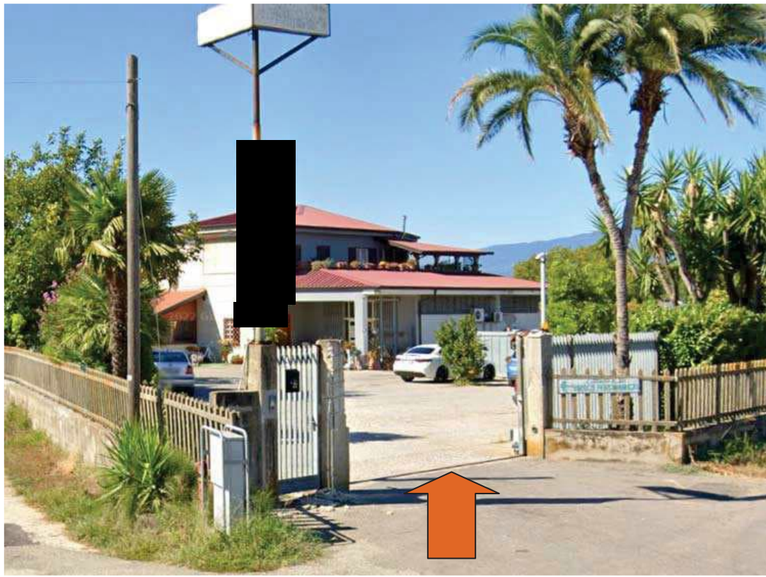
FOTO 1. Immobile tipologia cielo-terra.