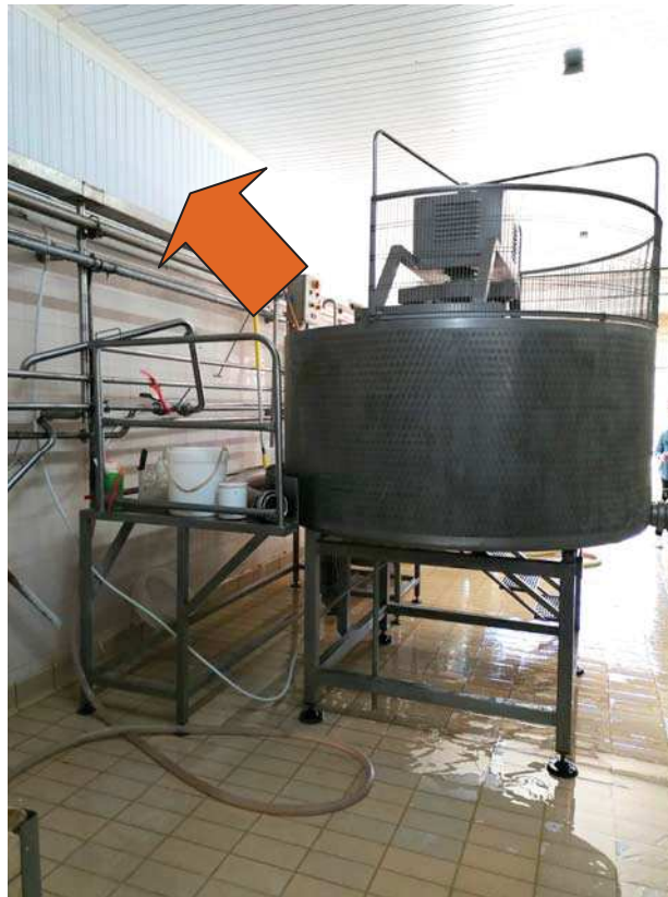
FOTO 12. Pannellatura a chiusura delle finestre.