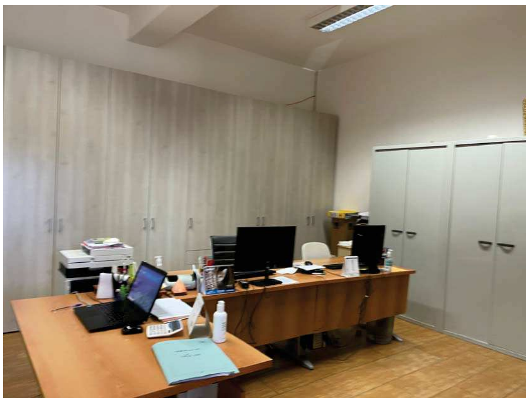
FOTO 8-. Uffici