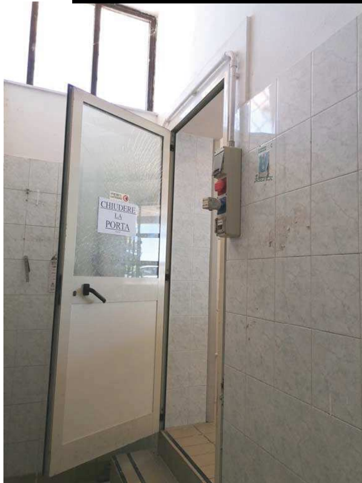
FOTO 7. Porta di comunicazione tra sala vendita e laboratorio caseario