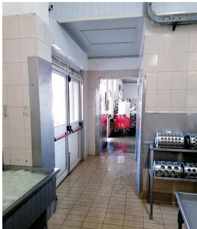
FOTO 10- 11. Laboratorio caseario