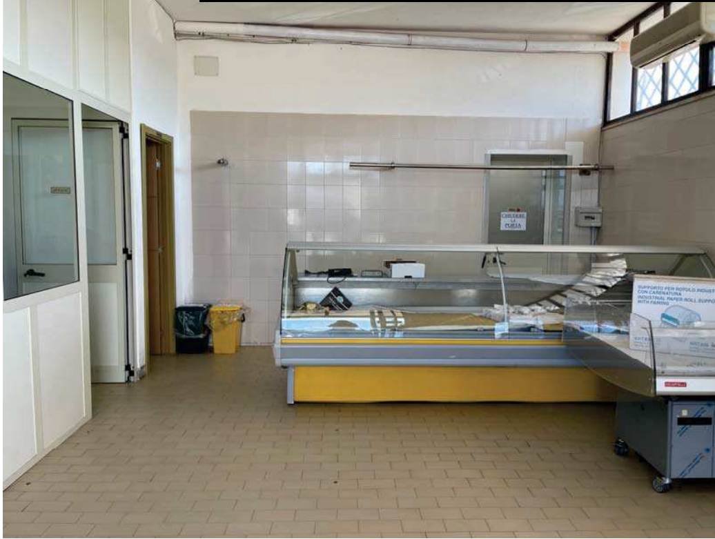
FOTO 3. Area Vendita