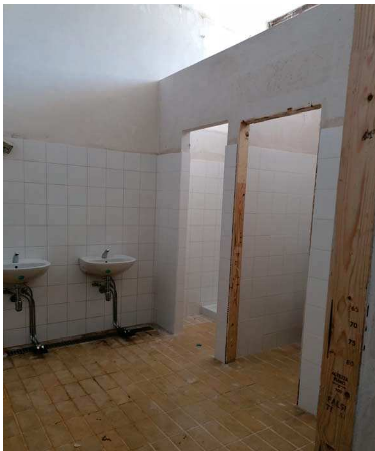
FOTO 9. Spogliatoio 1