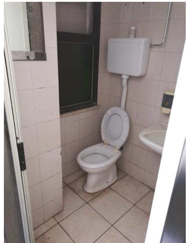
FOTO 13-14. Particolari dello Spogliatoio 2