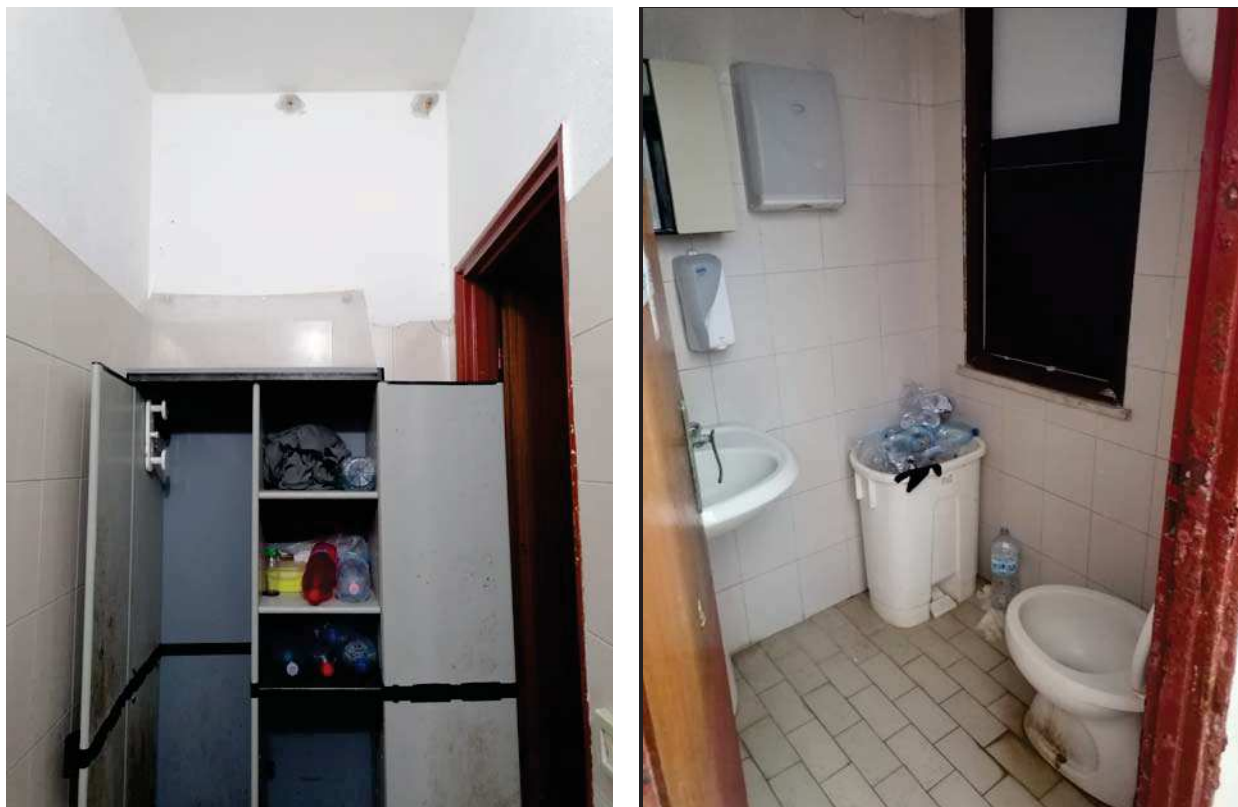
FOTO 15-16. Particolari dello Spogliatoio 3