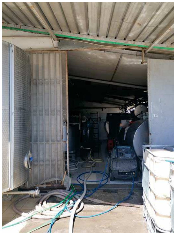
FOTO 17. Ingresso locale tecnico