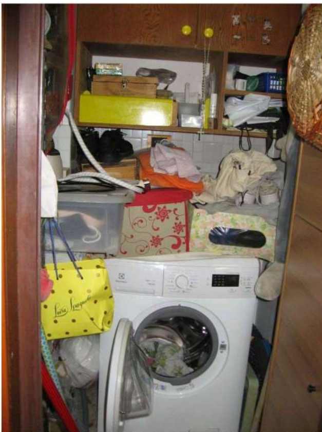
ripostiglio piano primo