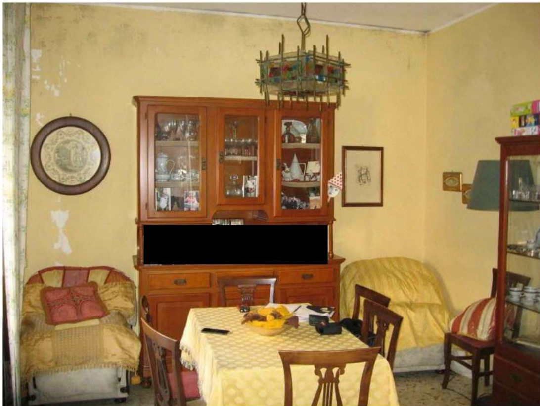
salotto piano primo