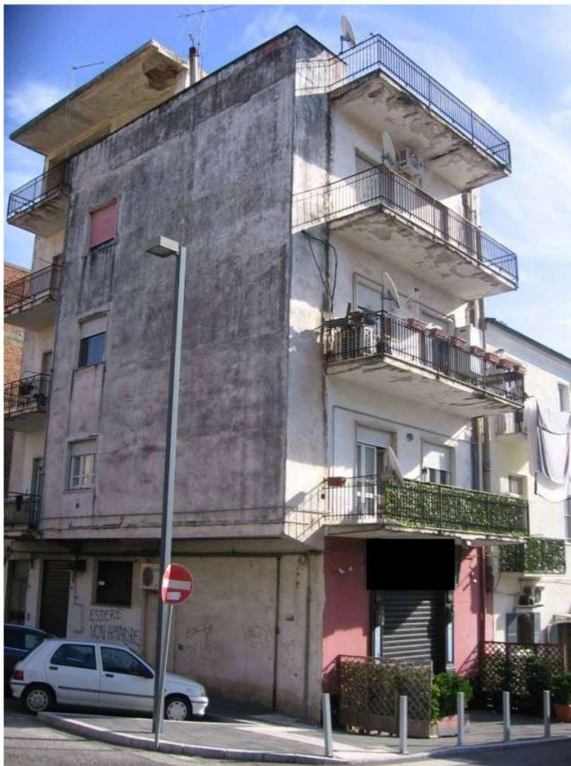
Prospetto Nord-Ovest del fabbricato