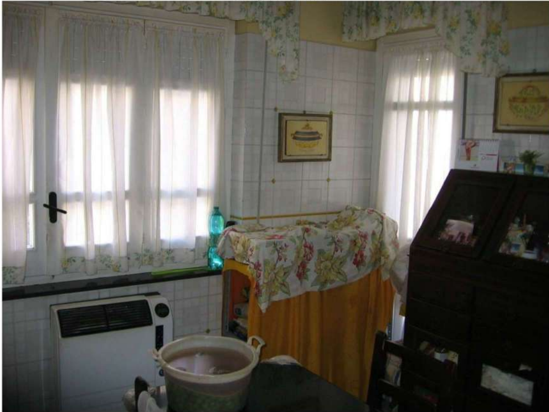
cucina piano primo