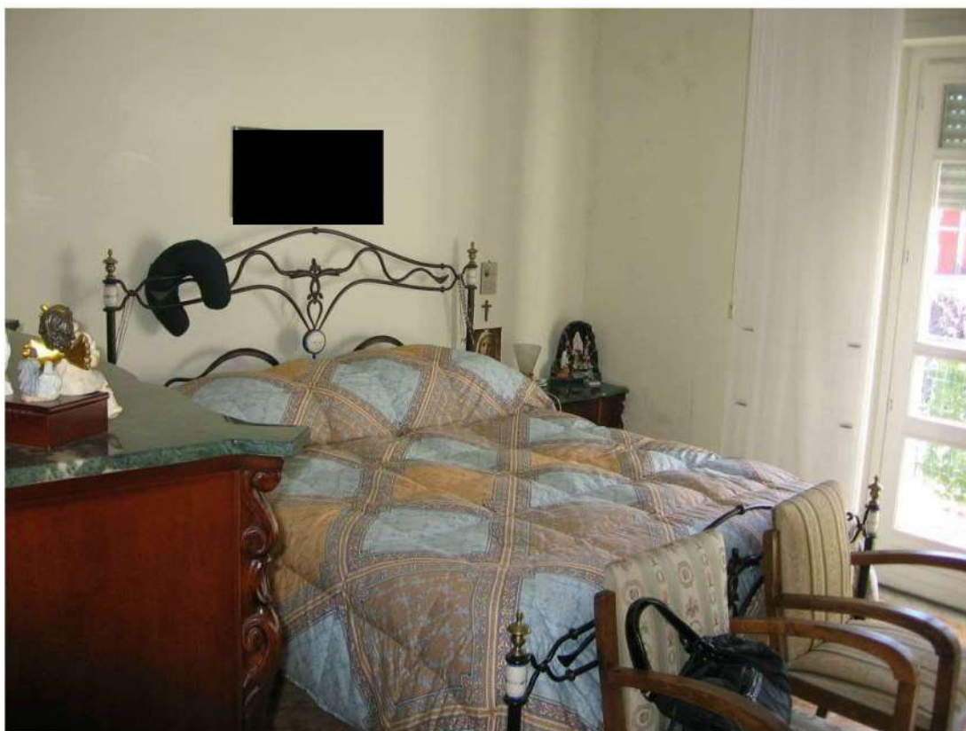
camera piano primo