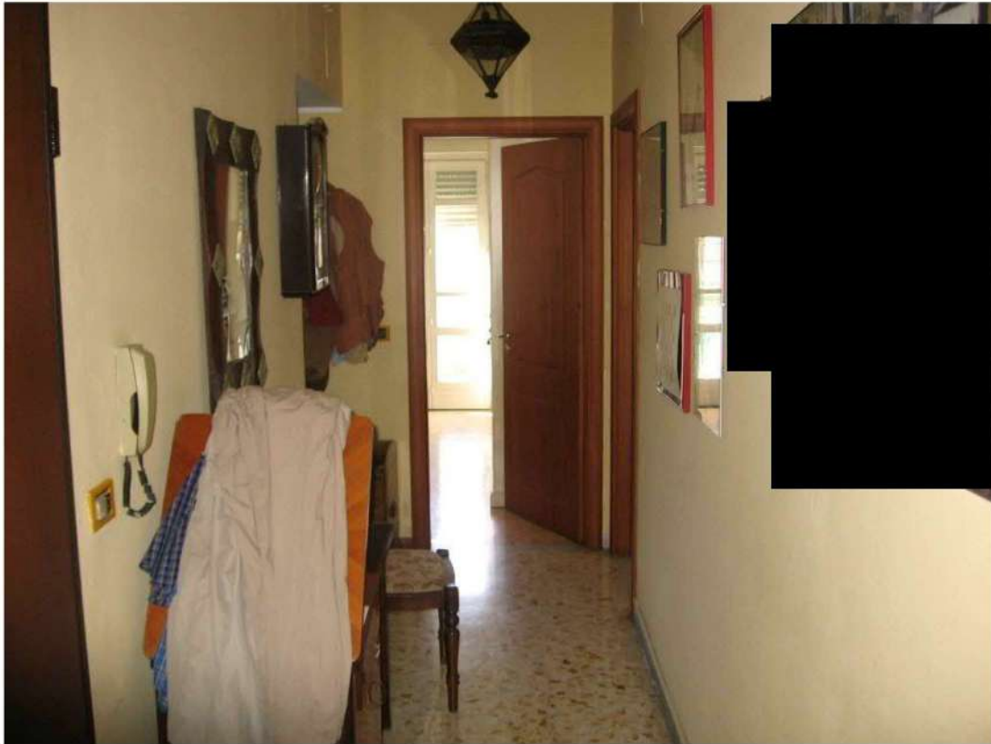
disimpegno piano primo