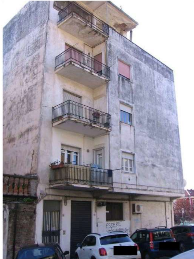
Prospetto Nord fabbricato