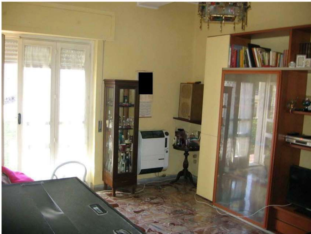
camera piano primo