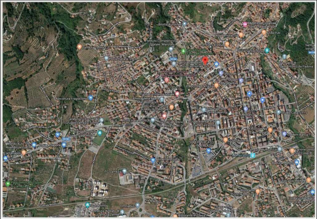
Stralcio satellitare del Comune di Lamezia Terme, Nicastro