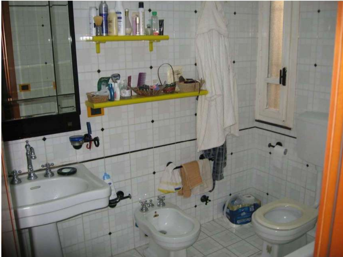
bagno piano primo