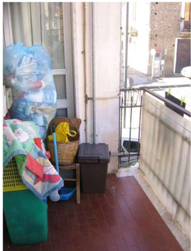
balcone lato Nord