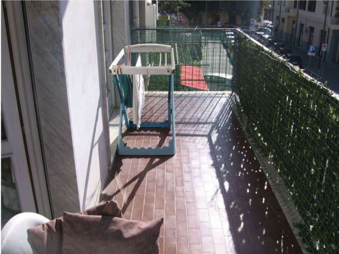
Balcone lato Ovest