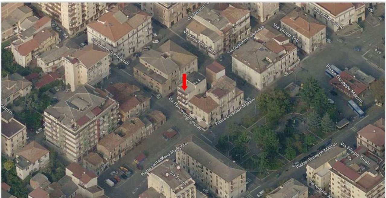
Vista panoramica della zona