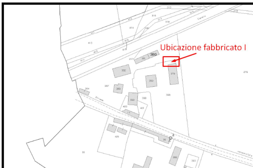
Fig. n. 2 – Stralcio mappa catastale